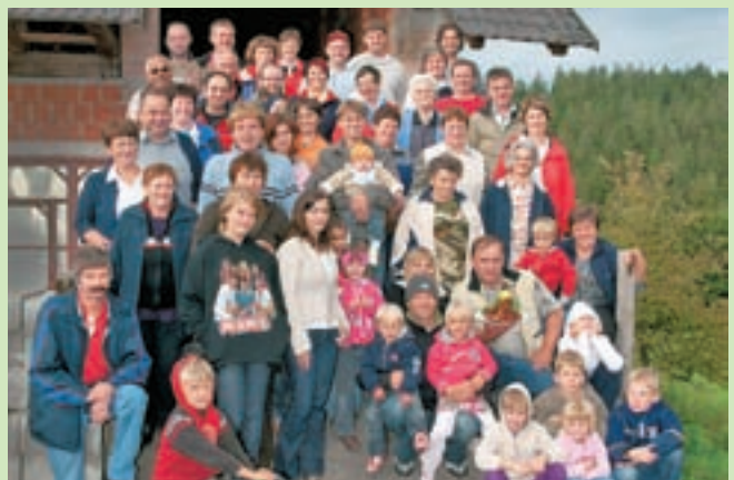
Prvega srečanja rodbine Eržen, po domače Bukovčevih iz Žirovskega Vrha, se je udeležila približno polovica članov.