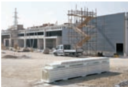
Gradnja trgovskih centrov na Grencu

”Ob tej priložnosti smo razpravljali tudi o stvareh, ki so v tej družbi nekoliko zamolčane. Konferenca je bila ravno pred valom spontanih delavskih protestov, ki so jih sprožila dogajanja v nekaterih industrijskih gigantih v Sloveniji. Na konferenci smo ugotavljali, da je odgovornost podjetij ne le dobro poslovanje, pač pa tudi primerne plače za delavce, odgovorno ekološko ravnanje in dejavno vključevanje v družbeno okolje. Kjer so podjetja odgovorna, namreč prispevajo,