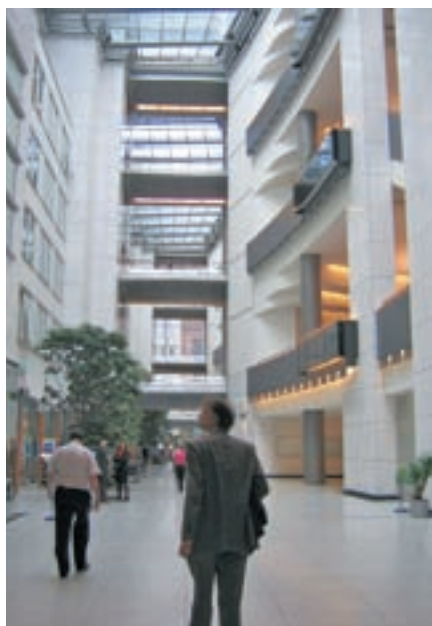
Čopova ulica v bruseljskem parlamentu