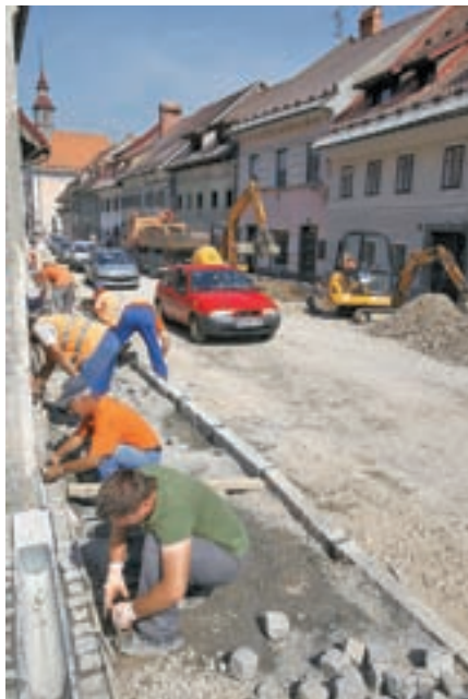
Dela na Spodnjem trgu se končujejo.