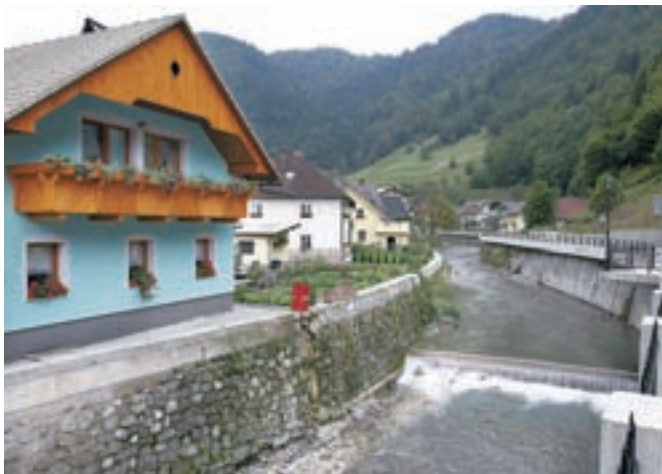
Železniki dve leti po katastrofi kažejo še lepšo podobo kot pred ujmo, domačini pa opozarjajo, da lahko voda znova vse uniči, če ne bo kmalu zagotovljena celovita poplavnarna varnost.

nje je obnovila, manjka pa ji še drvarnica, ki jo je s seboj odnesla voda." Tudi v Železnikih je bilo ogromno narejenega, kraj je dosti lepši kot prej. Urejajo tudi vodotoke, upam pa, da bodo kmalu spet počistili naplavljen prod iz struge Sore v zgornjem delu Železnikov. Država bi morala čimprej poskrbeti, da bomo resnično varni pred vodo, saj bi bilo škoda, da bi šlo vse, kar je bilo doslej narejenega, znova v nič," opozarja Trojarjeva.