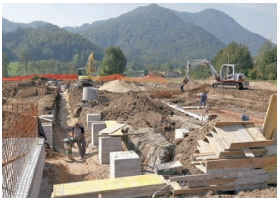
Položeni so temelji za mobilni vrtec v Podlubniku.

”Na to vprašanje lahko najnatančneje odgovorijo investitorji na tem območju, ki gradijo svoje objekte in so odgovorni tudi za ureditev