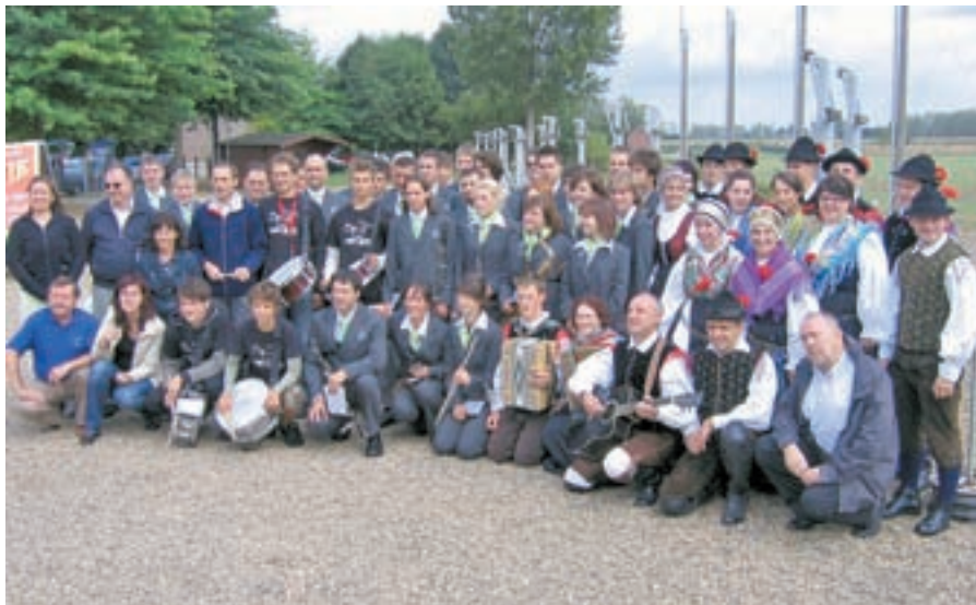
Loška delegacija v Maseiku