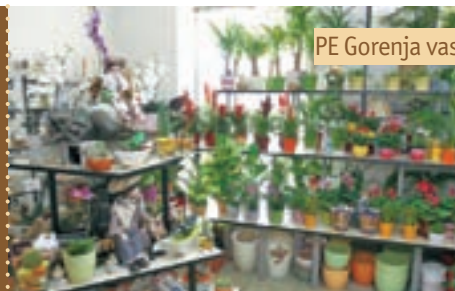
PE Gorenja vas