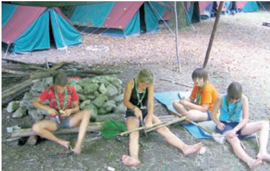
Utrinek z letošnjega tabora. V novih šotorih!

Taborniki Zelenega Žirka so bili s starimi, sedaj pa že z novimi šotori lahko 'doma' tako v Fažani, kot v Rupah in na Idrijski, pogosto poletno deževje, ki smo mu priča v Sloveniji v zadnjih letih, pa jih je le prepričalo, da je nakup novih obvezen. Tako so letošnje taborjenje v kanjonu reke Idrijce že preživeli šest do šestnajst dni pod novimi zeleno-rjavimi strehami. "Sami si nakupa nikakor ne bi mogli privoščiti, zato gre velik del zaslug za