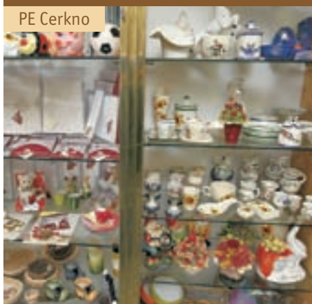
PE Cerklje ob Gori