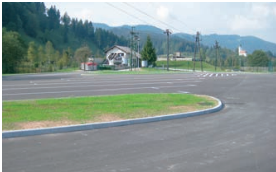
Parkirišče za avtobuse in tovornjake ob čistilni napravi, ki je bilo zgrajeno v drugi fazi projekta urejanja industrijske cone, je nared, vendar prazno.

”Žal investitorju v tem času ni uspelo pridobiti soglasja soseda bodočega doma, ki je sprožil upravni spor. Sodišče le-tega do danes še vedno ni rešilo, kljub prošnjam z več strani, da bi pospešili odločanje. Še vedno upam, da bo gradbeno dovoljenje izdano, preden bo država odvzela koncesijo investi-