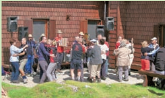
Na pohodu je bilo rekordno število planincev v zadnjih trinajstih letih, med udeležence se jih je vpisalo kar 559.

Ratitovec je med pohodniki iz leta v leto bolj priljubljen, kar dokazuje tudi tradicionalni, že 33. pohod na Ratitovec, ki ga je Planinsko društvo za Selško dolino Železniki priredilo na prvo septembrsko nedeljo. Pohoda se je udeležilo rekordno število planincev v zadnjih trinajstih letih. "Bil je sončen, a precej mrzel dan, kar pa pohodnikov očitno ni motilo. Med udeležence pohoda se jih je vpisalo 559, prav toliko pa je bilo na vrhu tudi obiskovalcev, ki se niso vpisali. Osebe v Krekovi koči je zanje pripravilo okusne enolončnice, flan-