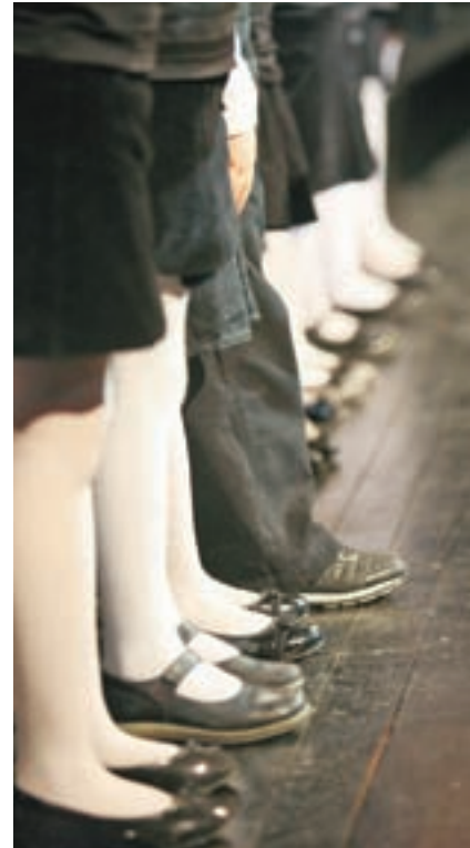
Vabljeni na oder

Prijave sprejema Tanja Avman, vodja izobraževanja na Ljudski univerzi Škofja Loka, po telefonu 04/506 13 80 ali po e-pošti: tanja.avman@guest.arnes.si