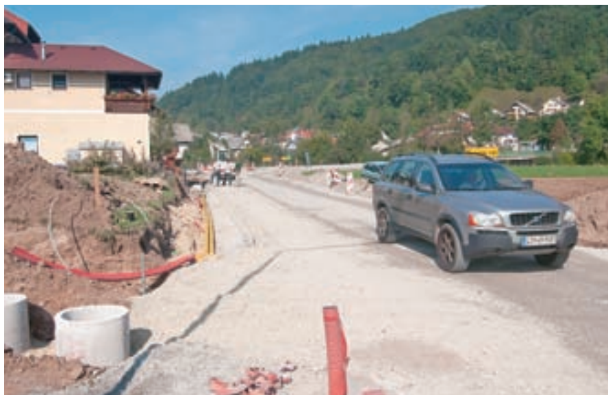
Dela pri urejanju ceste in križišča v Gorenji vasi so se začela v začetku septembra.

”Z vsebino odgovora ministra nisem bil zadovoljen, saj je bilo pogojno navedeno le, da bo, če bo, obvoznica zgrajena do leta 2013. Mene pa je zanimala predvsem kakovost izdelave projekta in nadaljevanje del, saj dobro vemo, da se je že v poznih sedemdesetih letih govorilo, da bo obvoznica zgrajena čez