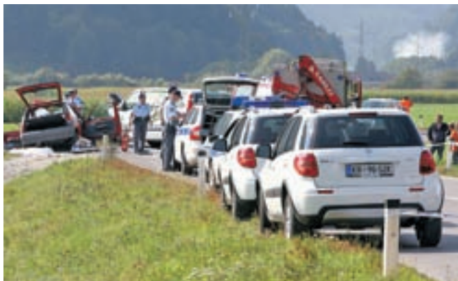
Čelno trčenje pred Selci je bilo usodno za 29-letno domačinko.