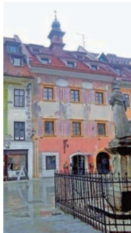
Projekt rekonstrukcije ostrejša mestnega rotovža z zvončnico na Mestnem trgu v Škofji Loki

Logotip certifikata, ki ga bo Združenje upravnikov nepremičnin začelo podeljevati v letu 2017.