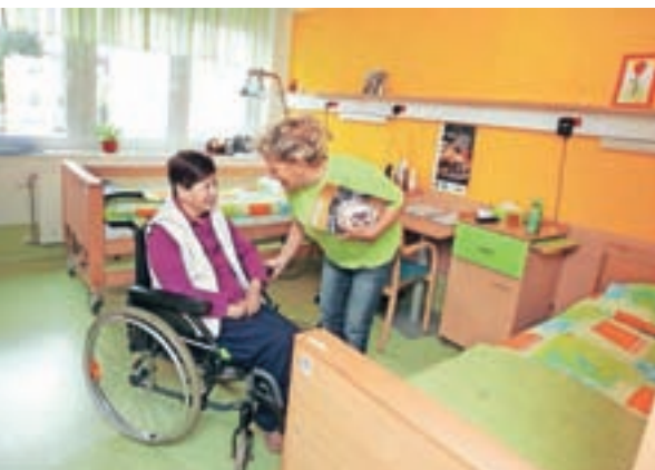
Delamo s srcem, je letošnji slogan Centra slepih, slabovidnih in starejših v Škofji Loki.

Center slepih, slabovidnih in starejših Škofja Loka letos praznuje osemdeset let svojega obstoja. Stanovalcem omogoča kakovostno nastanitev, celodnevno oskrbo in aktivno preživljanje časa v kulturnem, družabnem in duhovnem smislu.