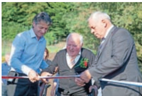
Pomembna pridobitev letošnjega leta je tudi urejen park, ki so ga odprli konec septembra.