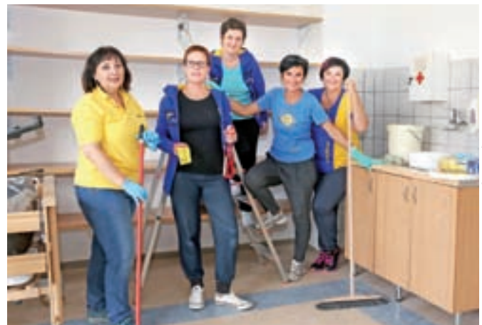
GOODYEAR DUNLOP SAVA TIRES, D.O.O., ŠKOFJELOŠKA CESTA 6, KRANJ