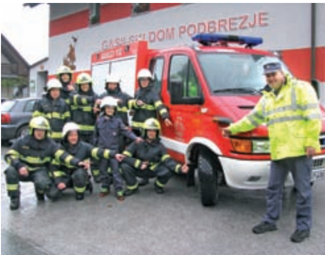
Tudi prostovoljni gasilci iz Podbrezj so hvaležni za donirane pnevmatike.

prostovoljske akcije zaposlenih v kranjski družbi. Spomladi so zaposleni s Prodajnega oddelka prenovili prostore Združenja paraplegikov Gorenjske, jeseni pa so sodelavke z oddelka Servis kupcem Centru Korak in Varstveno delovnemu centru Kranj pomagale pri vzdrževalnih in čistilnih delih.