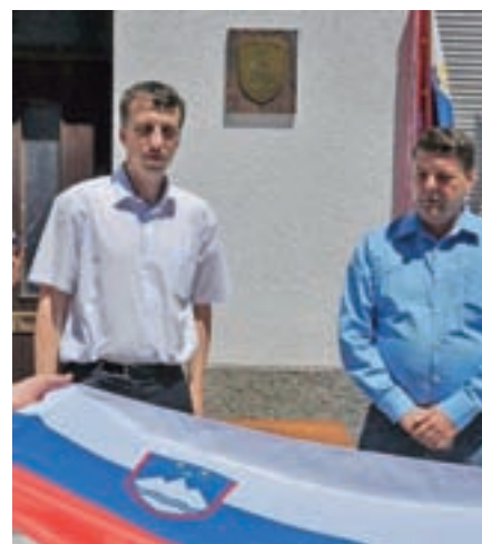
Odkritje spominskega obeležja ob 25-letnici vojne za Slovenijo na stavbi HE Savica.

Telefon: 04 20 83 531 Faks: 04 20 83 512 E-pošta: info@gek.si www.gek.si