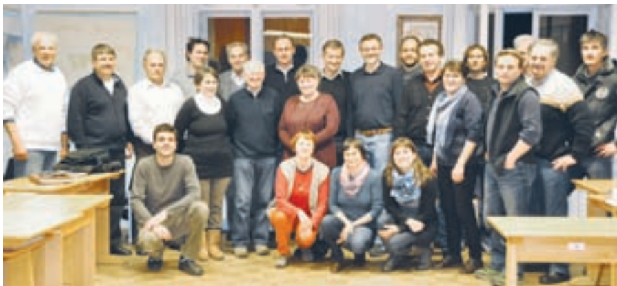
»Mi znamo ohranjati zdravje in plodnost zemlje« – nosilci blagovne znamke Demeter v Sloveniji.

Vam najbližje društvo Ajda ni daleč. Pokličite nas!