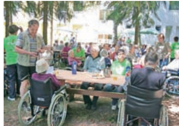
Vsakoletni piknik stanovalcev, svojcev in zaposlenih je lepo skupno doživetje.