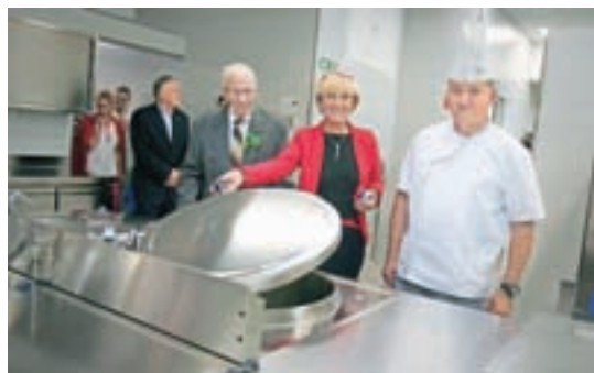
Od oktobra imajo prenovljeno in dograjeno kuhinjo.