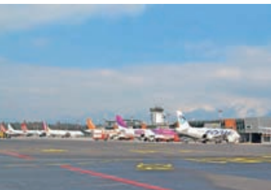
Aerodrom Ljubljana je letos povečal letalsko mrežo poletov na ljubljanskem letališču.

K trajnostni naravnosti Aerodroma Ljubljana sodi tudi skrb za razvoj in zadovoljstvo zaposlenih, ki je pogoj za uspešno rast podjetja. To so med drugim potrdili s polnim certifikatom za družini prijazno podjetje , ki je plod uspešno izvedenih ukrepov, ki zaposlenim omogočajo lažje usklajevanje družinskega in delovnega življenja. Nedvomno je tudi to eden od razlogov, da iskalcji zaposlitve Aerodrom Ljubljana uvrščajo med najbolj zaželena podjetja in so ga uvrstili med nosilce priznanja ugledni delodajalec .