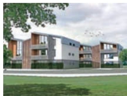
Spomladi prihodnje leto bomo začeli gradnjo prve faze stanovanjskega naselja Vile Brdo.