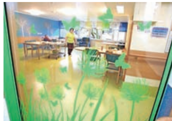
Letos so odprli obnovljeni oddelek Livada v prvem nadstropju Centra.