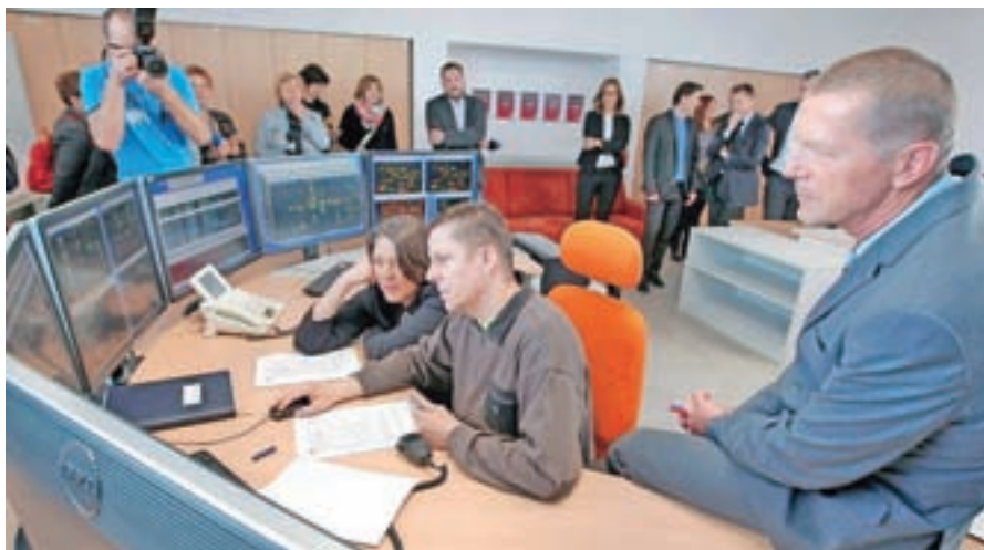
Nov distribucijski center vodenja sta svojemu namenu uradno predala evropska komisarka za mobilnost in promet Violeta Bulc in predsednik uprave Bojan Luskovec.