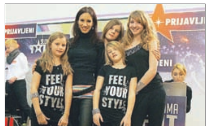
Članice pevsko-plesne skupine Tejly iz Kranja s koreografijo Špelo Krištof