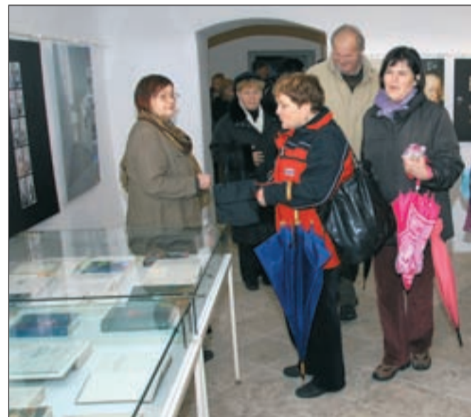
V Prešernovi hiši je vedno živahno, še posebej ob 8. februarju. I FOTO: JELENA JUSTIN

bodo vabili obiskovalce, naj si naročijo fotografijo v "fotografičnem ateljeju" Gorenjskega muzeja. Zraven v starem jeziku dodajajo - Vljudno naznanjamo, da se samo dne 8. svečana nahajamo v predporočni dvorani Mestne hiše v Kranju. Cena fotografiranja je 5 evrov na osebo, poslali vam jih bomo po pošti. Sodelavci muzeja pa bodo predstavili sitarstvo, nekdanje uveljavljeno obrt v vaseh med Kranjem in Škofjo Loko, pripravili pa