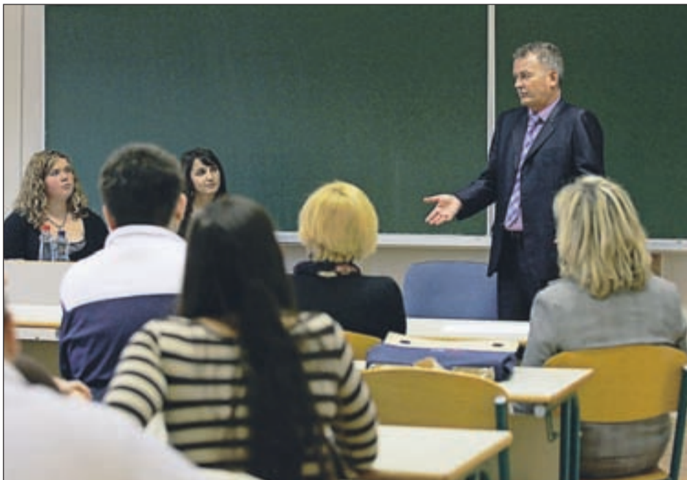
Študentje so z zanimanjem spremljali predavanje kranjskega župana.