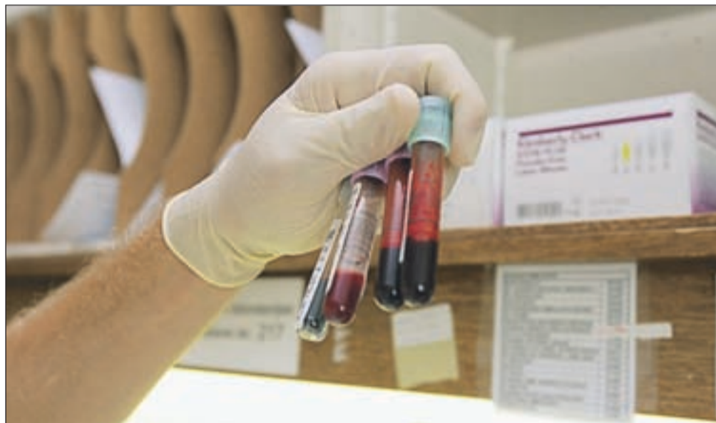
Prva terenska krvodajalska akcija je že danes v Gasilski postaji GRS Kranj.

Vse več krvodajalcev daruje kri na terenskih krvodajalskih akcijah, zato so se odločili, da bodo letos organizirali več terenskih akcij. "Prva je že danes v Gasilski postaji GRS Kranj, odvzemi krvi potekajo od 7. do 13.