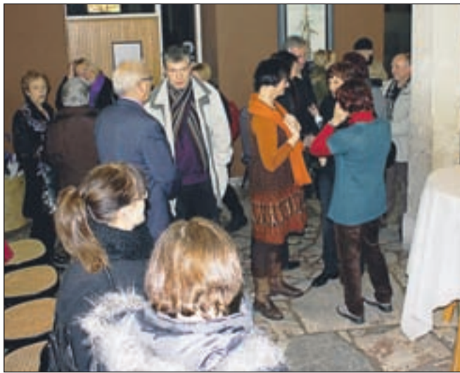
Na odprtju oživiljene čitalnice konec lanskega decembra je bilo zelo živahno.

lu ozaveščanja civilne družbe o ključnih temah razvoja Kranja in Slovenije, poleg tega da bo v čitalnici moč brati knjige, časopise in revije, pa bodo vsaj enkrat na mesec pripravili tudi okroglo mizo o aktualnih zadevah. V goste bodo vabili strokovnjake z različnih področij, ki bodo predstavljali svoja mnenja. Čitalnica bo delovala na prostovoljni bazi dosedanjih članov društva Zdravo mesto in vseh, ki si želijo pri tem sodelovati.