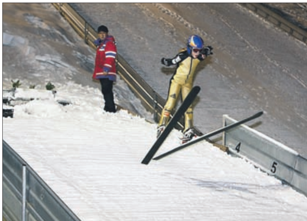
Mladi skakalci pridno vadijo v centru na Gorenji Savi.