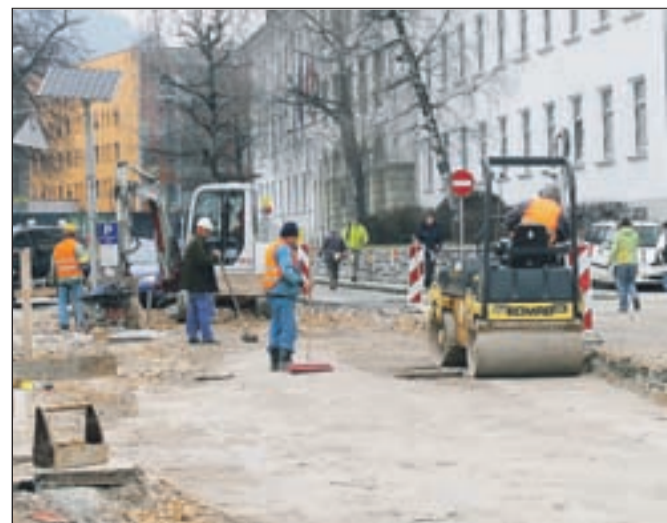
Trenutno potekajo dela pri obnovi ceste mimo občinske stavbe.

V sklopu projekta Prometna ureditev Slovenskega trga trenutno poteka ureditev ceste mimo občinske stavbe. Prejšnjo soboto, 15. januarja, je izvajalec zaključil polaganje cevi za odvodnjavanje meteorne kanalizacije na celotnem odseku, nato pa so v ponedeljek, 17. januarja, začeli s pripravami za zamenjavo spodnjega ustroja cestišča na delu od Gregorčičeve ulice do uvoza na parkirišče za občinsko stavbo. Vsa dela na tej cesti bodo predvidoma končana do konca letošnjega aprila, ko bo cesta dobila tudi končno podobo. Tlakovana bo s kockami, tako kot tudi cesta okoli Globusa.