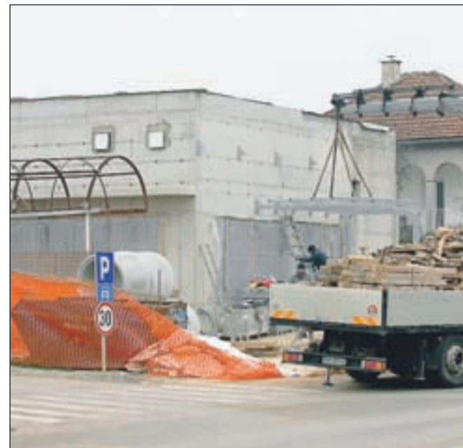
Trenutno prenova pošte na Planini še poteka, za stranke pa naj bi bila odprta v mesecu marcu.