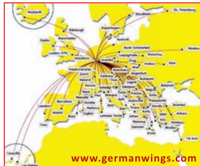
Povezave z letališča KÖLN/BONN