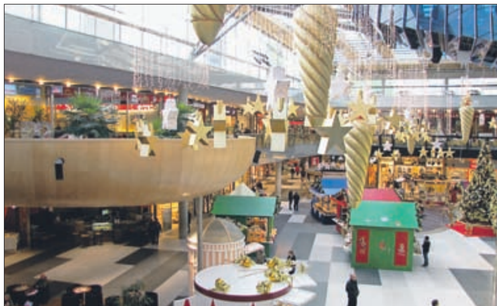
Atrio je že praznično okrašen.

vetimi dvigali in osemnajstimi premičnimi stopnicami. Lani nas je obiskalo nad 5 milijonov kupcev iz Avstrije in številnih drugih držav, med njimi tudi iz Slovenije, s katero smo sosedje in nismo daleč narazen. Pri nas je veliko zanimivega. Naša Intersparova trgovina je magnet za kupce. Pri nas imajo svoje prodajalne vrhunske blagovne znamke in trgovske hiše kot Kastner&Oehler, C&A in Mueller, ki ponujajo v svojih prodajalnah originalne izdelke z izvirno kakovostjo. Z druge strani ceste se je k nam preselil Majdič in tako dopolnil našo ponudbo. Dobra, raznovrstna in po zmernih cenah je gostinska ponudba. Za kupce, ki prihajajo k nam z otroki, smo na 600 kvadratnih metrih uredili kotiček za igro in zabavo otrok Lollipop. Ko starši nakupujejo ali posejajo v restavraciji, je otrokom zagotovljena varna igra. Lani smo v Lollipopu organizirali nad 700 otroških praznovanj