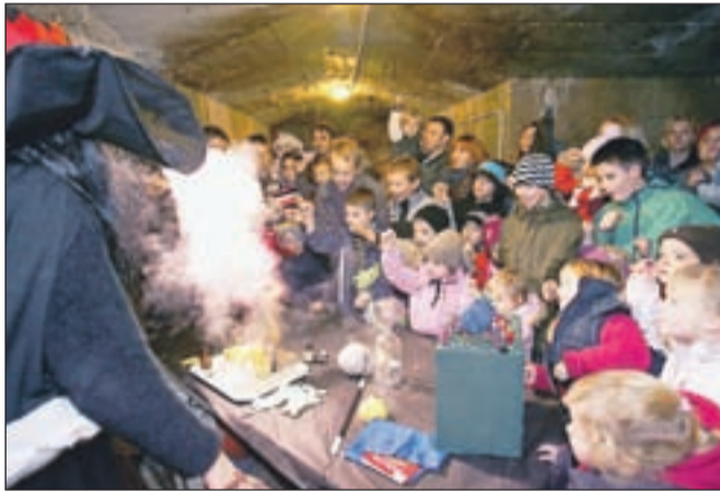
Noč čarovnic v rovih je navdušila tako otroke kot starše.

venčke in praznično okrasitev v rovih pa si je ogledalo okoli 1500 obiskovalcev.