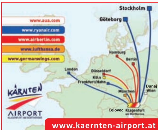
Direktne povezave z letališča KLAGENFURT/CELOVEC