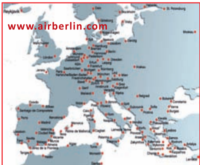
Povezave z letališč BERLIN in DÜSSELDORF

Rezervacije za Air Berlin, Germanwings in Ryanair sprejemamo tudi na oddelku za informacije. tel. 0043/463/41500-229