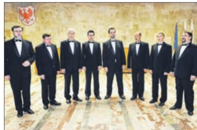
Med pojočimi je bila tudi ena izmed novejših kranjskih vokalnih skupin Kranjski oktet.