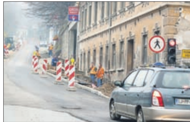
Po Jelenovem klanecu promet v zadnjem tednu že poteka po asfaltu, ob ugodnem vremenu pa naj bi bil v kratkem v celoti asfaltiran.

Prav tako se nadaljujejo dela na Gregorčičevi ulici (del za Globusom in okoli Stare pošte), kjer so položene granitne kocke in so začeli s polaganjem granitnih plošč na pločnikih ob objektih. Tudi tu bodo dela ob ugodnem vremenu končana v začetku decembra. Ko bodo končana, se bodo začela dela na cesti