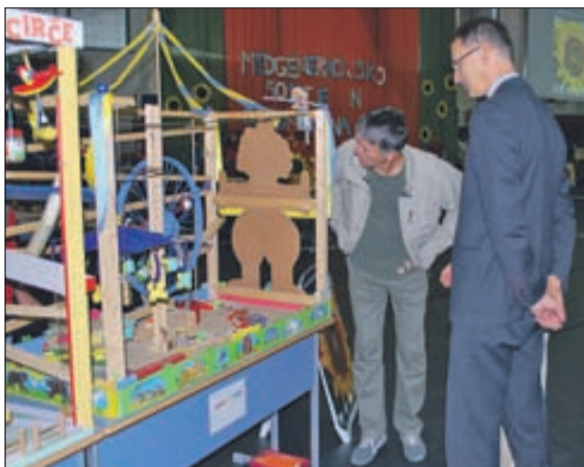
Na prireditvi ob zaključku projekta so se predstavili vsi sodelujoči partnerji. Njihovo delo si je ogledal tudi šolski minister Igor Lukšič.