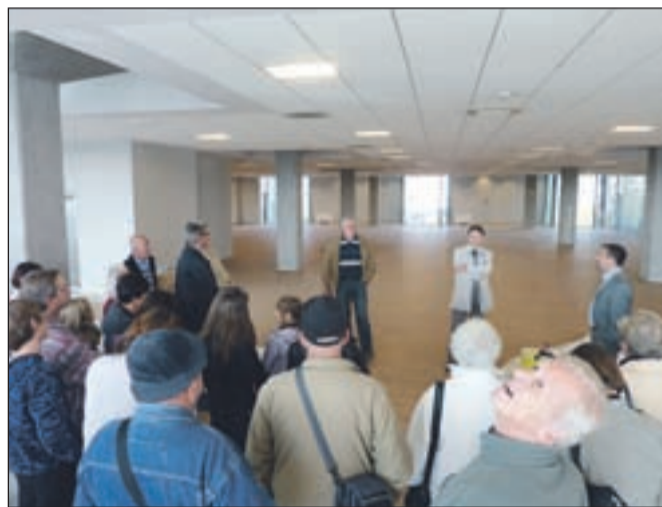
Obiskovalci so z zanimanjem poslušali, kje bo kaj v novi knjižnici.

nosti nove knjižnice. Prizidek bo namenjen predvsem komunikacijam, stopnišču in dvigalom, v pritličju pa bo poleg sprejemnega pulta še šestnajst računalniških mest za prosto uporabo ter prostor namenjen branju dnevnih časopisov in revij splošnih vsebin. V prvem nadstropju bo otroški oddelek razdeljen na tri starostne skupine, v zahodnem delu pa sodobno opremljena dvorana s 140 sedeži, pripravljeni sta tudi že zastekljeni glasbena in filmska soba. Največji bo oddelek za odrasle v drugem nadstropju, kjer bodo tudi posebne bralne sobe, prostor za domoznansko zbirko in starejše izvode, na voljo pa bodo tako kot na otroškem oddelku tudi računalniški priključki.