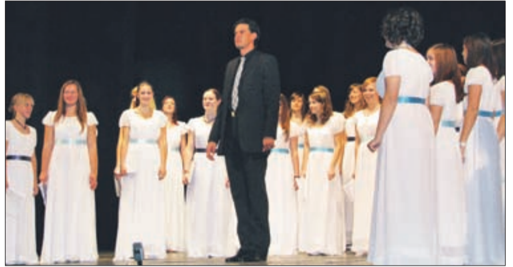
Kranjske gimnazijke so v kategoriji ženskih in moških zborov zapele tudi dve skladbi slovenskih avtorjev J. Gallusa in A. Čopija.

Prvi tekmovalni nastop je zbor opravil v kategoriji zbori enakih glasov (ženski in moški zbori), izvedel pa je štiri pesmi: J. Gallus - En ego campana, Čopi - Da lipa ma. Ke bej na je?, F. Biebl - Ave Maria in S. Hatfield - Las Amarillas. V konkurenci enajstih zborov so osvojili odlično drugo mesto in s 86,6 odstotnimi točkami tudi zlato diplomo. Zaostali so samo za izjemnim moškim zborom Ekonomske fakultete z Univerze v Moskvi. Dosežek je pomenil tudi uvrstitev zbora v zaključno tekmovanje najboljših šestih zborov za veliko