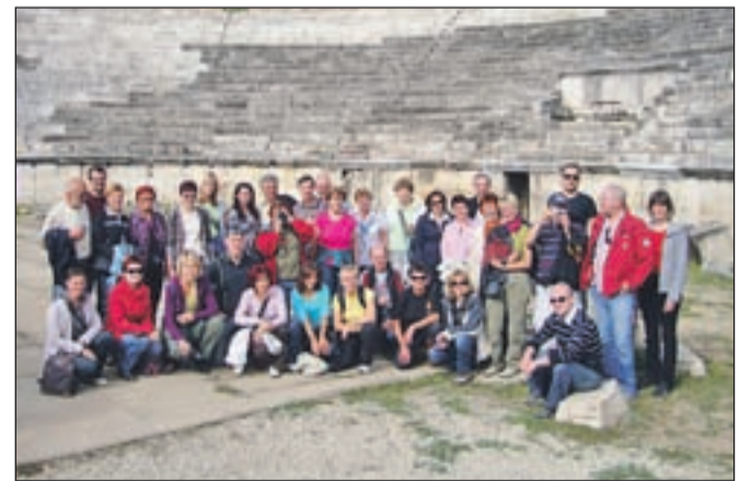
Skupinska. Pevke in pevce Musice vive so v Makedonijo ponesli slovensko pesem in domov odšli polni vtisov iz prelepe dežele in njenih gostoljubnih ljudi.