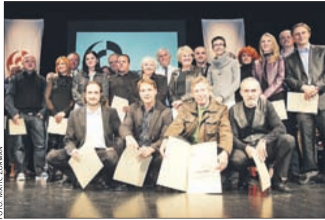
Fotografi so tokrat prejeli tudi priznanja različnih stopenj, ki jih vsako leto podelijo v Fotografski zvezi Slovenije

Dogodek sodi v sklop fotografskih dogodkov, ki jih v letu fotografije organizira ob svoji stoletnici Fotografsko društvo Janez Puhar Kranj. Letos so tako v Kranju pripravili že štiri razstave povabljenih avtorjev iz tujine in iz Celja, štiri društvene razstave, od tega dve v tujini (Hrvaška in Francija) ter dve doma (Kamnik in Kranj). Za organizacijo društvenih razstav so pripravili osemindeset foto esejev petindvajsetih avtorjev, organizirali pa so tudi