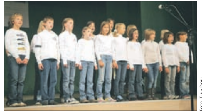
Prireditev ob prazniku KS Primskovo je popestril pevski zbor Podružnične šole Primskovo.