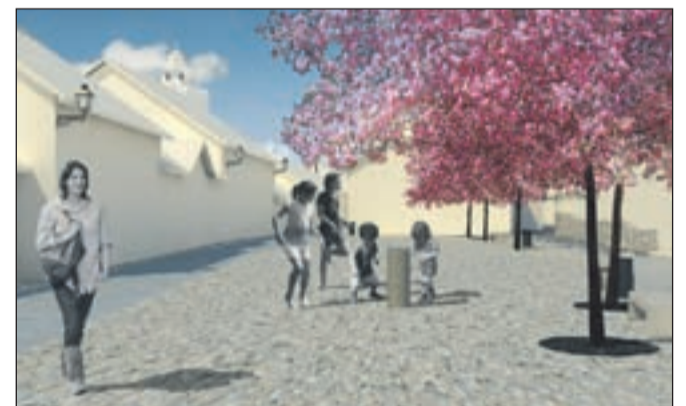
Po prenovi bodo ulice starega mesta sodobno urejene, izvedba del pa se bo začela s prenovno Trubarjevega trga, ki bo urejen v skladu z natečajno rešitvijo (na sliki).