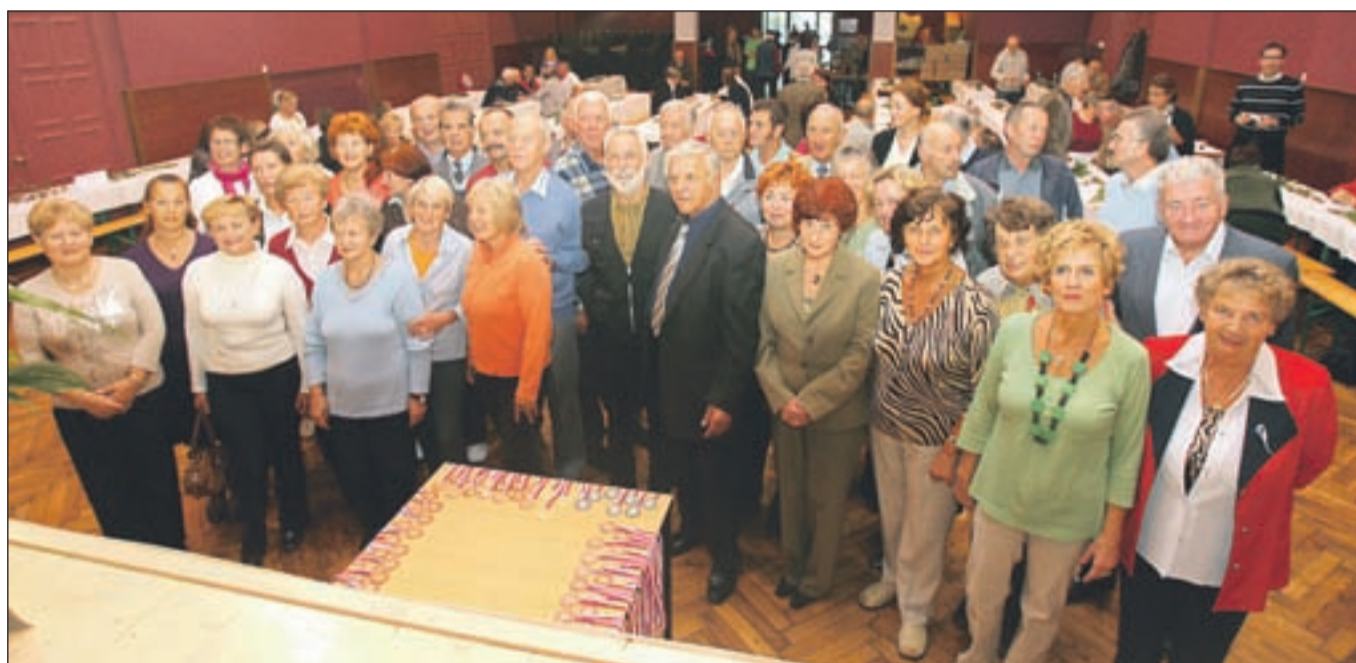
Zbrana družina uspešnih športnikov upokoencev v Domu krajanov na Primskovem