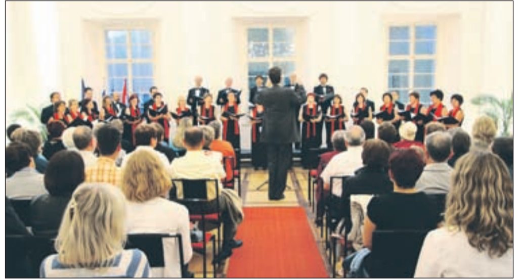
V ambientu baročne dvorane radovljiške Graščine

movanju The Singing World v St. Petersburgu in kasneje še v Moskvi.