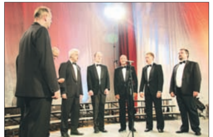
Poleg gostitelja Kranjskega okteta (na sliki) je na festivalu, ki je potekal v kranjski Gimnaziji, nastopilo še osem uveljavljenih oktetov iz vse Slovenije.