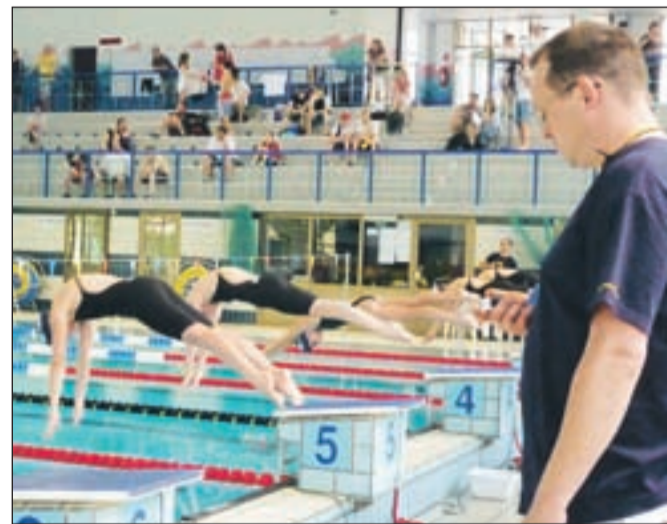
Kranjski olimpijski bazen je sredi junija gostil tradicionalni mednarodni plavalni miting.