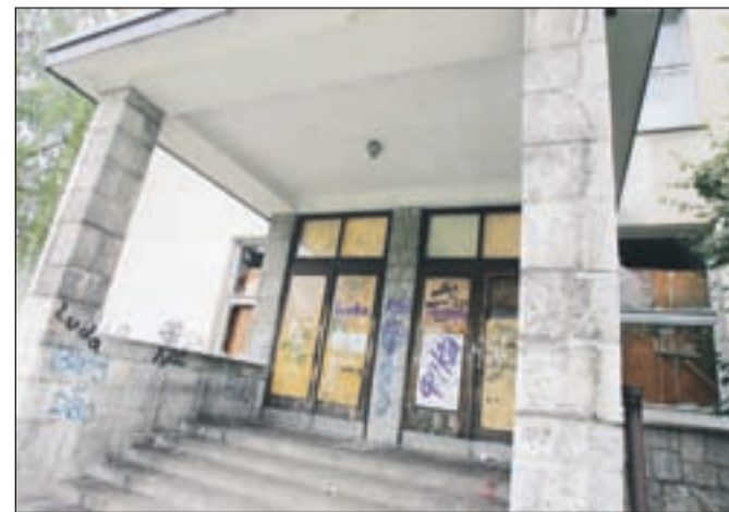
Ekonomska šola na Komenskega je trenutno še zapuščena, že jeseni pa naj bi se začela obnovitvena dela.

Del denarja za vrtec naj bi na občini dobili tudi iz prodaje sedanjih treh stavb vrtcev. "Ko smo ugotavljali, koliko denarja bi bilo treba vložiti v prenovo sedanjih treh vrtcev, smo ugotovili, da je bolje, da stavbe prodamo. Zanje naj bi iztržili nekaj več kot dva milijona evrov. Če jih ne bomo mogli prodati, bomo pogojevali, da jih bo izvajalec vzel v račun," dodaja podžupan Velov in pojasnjuje, da so se odgovorni iz občine večkrat sestajali tudi z okoliškimi krajanji, ki so sprva dvomili, za kakšen projekt gre in so mu zato nekateri tudi nasprotovali. "Ko smo pridobili načrte, smo sklicali zbor krajanov, saj smo jih želeli obvestiti, kakšna bo gradnja. Prav tako smo jim predstavili prometno ureditev, saj so nam strokovnjaki pripravili kar štiri prometne študije. Ko so nam krajanji predstavili svoje pomisleke, smo naredili še peto in šesto različico prometne ureditve in zagotovili, da bo promet urejen tako, da bo kar najbolje za vse. Prav tako bo zgrajenih kar 52 parkirnišč," tudi prvi podžupan Velov.