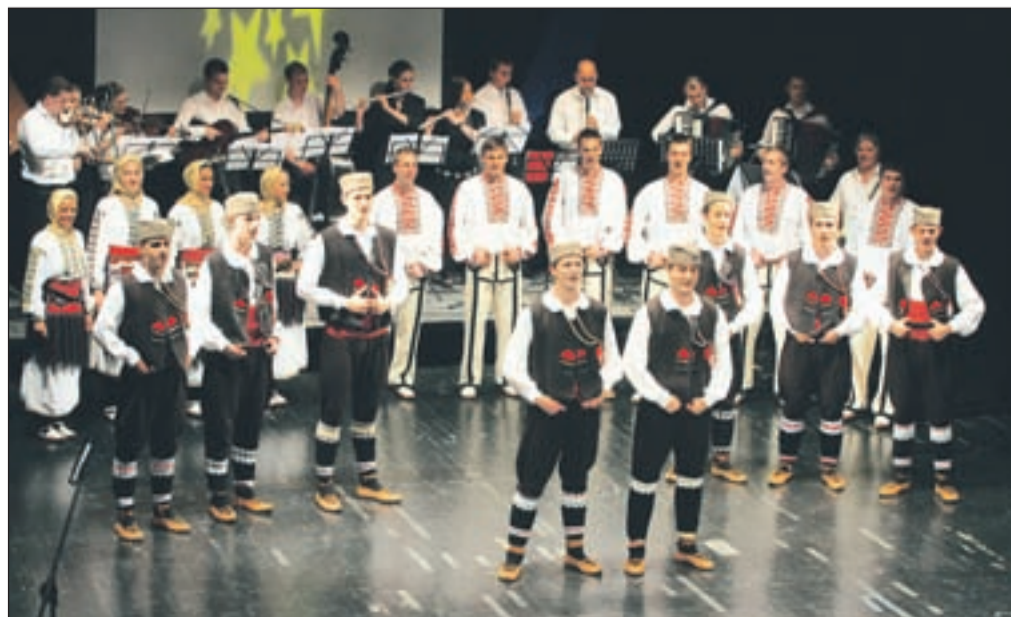
Ansambel SKPD Sveti Sava Kranj, v ozadju člani skupine Etnopedija iz Novega Sada.