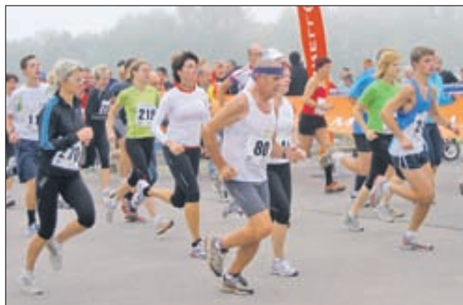
Lani jeseni so pri Atletskem klubu Triglav organizirali 1. tek okoli Brda.

Atletski klub Triglav za soboto, 24. aprila, pripravlja 2. tek okoli Brda na 10-kilometrski razdalji. Če tudi pozimi niste pozabili na tek in boste dovolj pripravljeni tudi za mali maraton, se lahko udeležite tudi prvega malega kranjskega maratona. Start obeh tekov, tako tistega na 10 kilometrov kot polmaratona na 21 kilometrov, bo ob 11. uri na Brdu. Prav tako bodo na svoj račun prišli otroci do 12 let, ki se bodo na hipodromu lahko pomerili v teku na 300 metrov. Vaditelji iz AK Triglav bodo poskrbeli za animacijo in predstavitev atletske šole. Kot pravi organizatorji, na