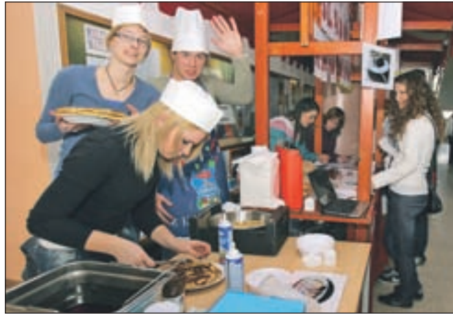
Ob stojnici podjetja Sladki greh so se marsikomu pocedile sline.