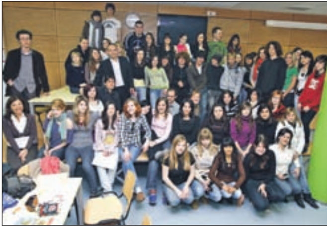
Dijaki se pripravljajo na večjezični spektakel.