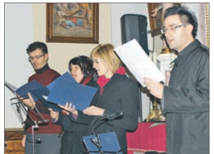
Vokalna skupina Objem med nastopom

Križev pot je skozi dvatisočletno zgodovino navdihoval umetnike različnih zvrsti umetnosti, ki so temu dogodku posvečali veliko pozornosti. Tako so tudi v glasbeni skupini Objem iz Zgornje Besnice prišli na idejo, da letošnji prikaz križevega pota v Besnici tudi kulturno obogatijo. Pripravili so besedilo, k sodelovanju povabili pevsko zboru Janez Kozjek in Tilnove slavčke ter bralce križevega pota in v cerkev svetega Tilna v Zgornji Besnici privabili poslušalce, ki so ob bogatem pevskem in vsebinskem delu križevega pota stopali od postaje do postaje skupaj s Kristusom na Kalvarijo. Zato je bil skupinski nastop kulturnikov v okviru društva Sejalec iz Besnice ponoven dokaz, da je križev pot aktualen tudi v današnjem času, ko se lahko vsak vpraša, kaj je naredil dobro ali slabo v življenju. Kvalitetno izveden program je v mnogih, ki so prišli, da bi podoživeli Kristusov križev pot, sprožil željo, da bi se še srečali na kakšni podobni prireditvi. I. K.