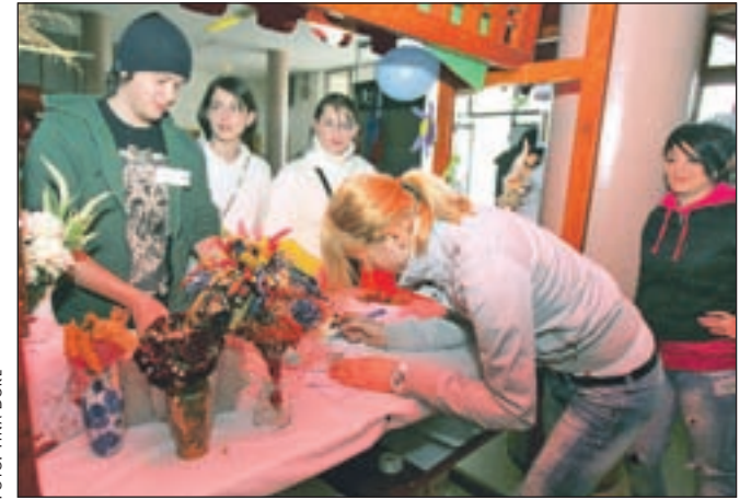
Dijaki so se potrudili, da so bile stojnice privlačne na pogled.

TEHNIŠKI ŠOLSKI CENTER KRANJ ZA POKLICE PRIHODNOSTI