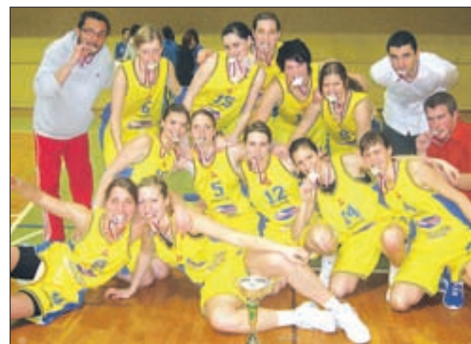
Mladinke ŽKK Triglava so osvojile naslov košarkarskih podprvakinj.