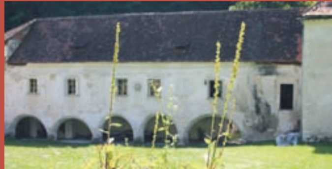
Pod oboki Žičke kartuzije