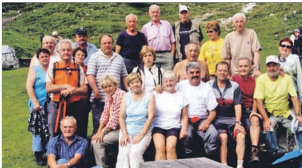
V Blejski koči so si upokojenci Elektra Gorenjske privoščili okusno enolončnico ter pred kočjo naredili spominsko sliko.

Prav tako so bili nato navdušeni nad avgustovskim izletom, odločili pa so se za pohod k Blejski koči na Lipanci. Do tja so prišli po dobri uri hoje skozi lepe poključke gozdove. Njihov naslednji cilj je bila Debela peč na kar 2018 metrih nadmorske višine. Tam so uživali v pogledu na Julijce.