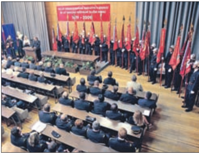
Kranjskim gasilcem so se na slovesnosti pridružili številni gostje in gasilci iz Beljaka.