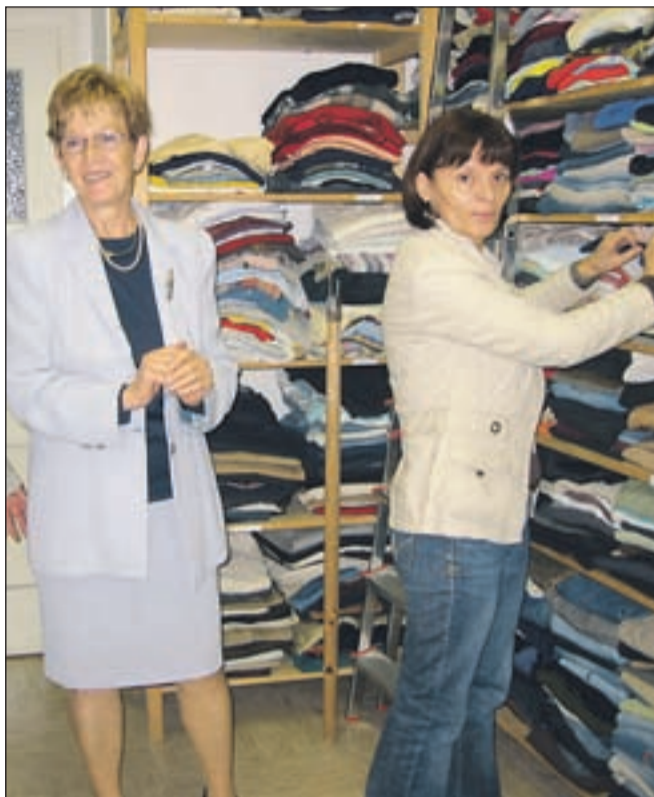
V prostorih župnijske Karitas na Tavčarjevi ulici v Kranju so pripravili dan odprtih vrat in obiskovalcem pokazali lepo urejene prostore.