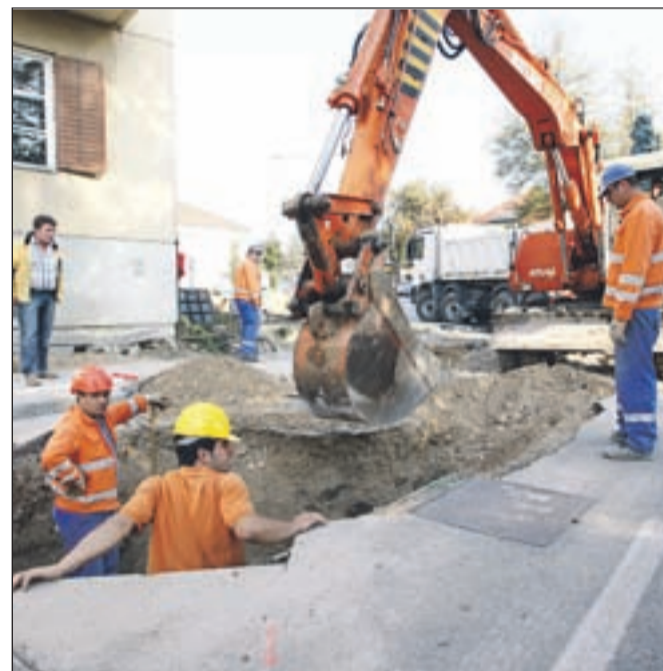
Dela na Stritarjevi so se ta teden že začela.

činske stavbe, Koroški cesti na delu od Slovenskega trga do Bekslna (vključno s križiščem na Bekslnu), Ljubljanski cesti na Jelenovem klancu ter ureditev križišča pod Jelenovim klancem, ki bo po novem krožišče. Prva faza zajema obnovo Stritarjeve in dela Gregorčičeve ulice (za nekdanjim Globusom). Gregorčičeva ulica bo po končani obnovi v celoti tlakovana z granitnimi kockami, medtem ko bo na Stritarjevi ulici ostal asfalt. Na Stritarjevi ulici so se dela začela v ponedeljek, 21. septembra, zaključek pa je ob ugodnem vremenu predviden do konca letošnjega leta. V tem času bo ulica povsem zaprta za promet. Na delu Gregorčičeve ulice se bo obnova začela nekaj dni kasneje, za promet bo veljala polovična zavora.