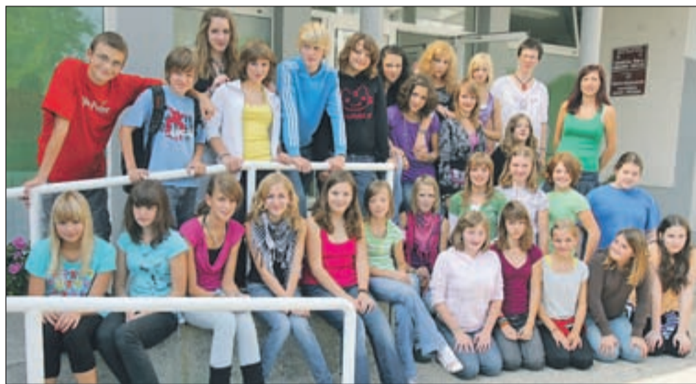
Mladinski pevski zbor osnovne šole Orehek nastopa v šolskem muzikalu Ljubezen je v zraku.