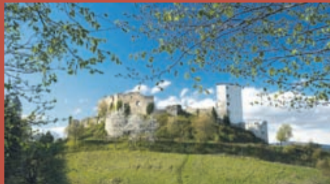
Stari grad na Konjiški gori