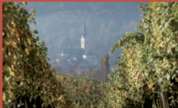
Slovenske Konjice skozi objektiv vinogradov