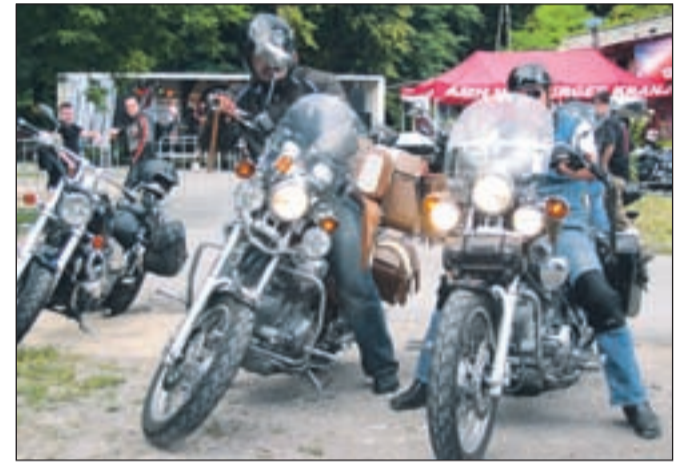
V petek, ko še ni bilo dežja, je na prizorišče prišlo precej več motoristov kot v soboto.