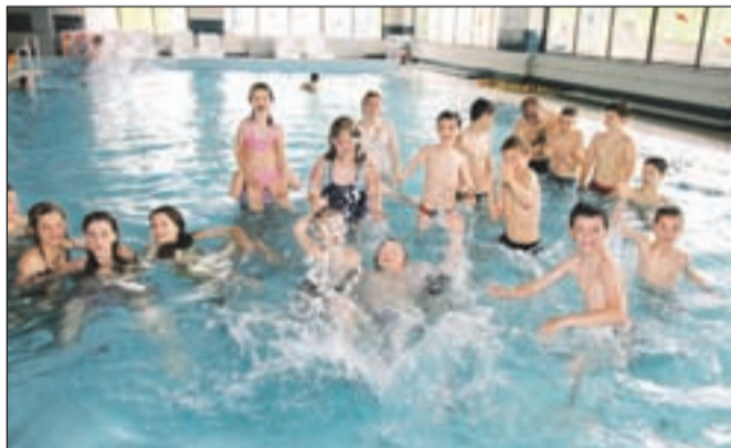
Mladi iz Škrlovca so uživali v čofotanju v kranjskem bazenu.