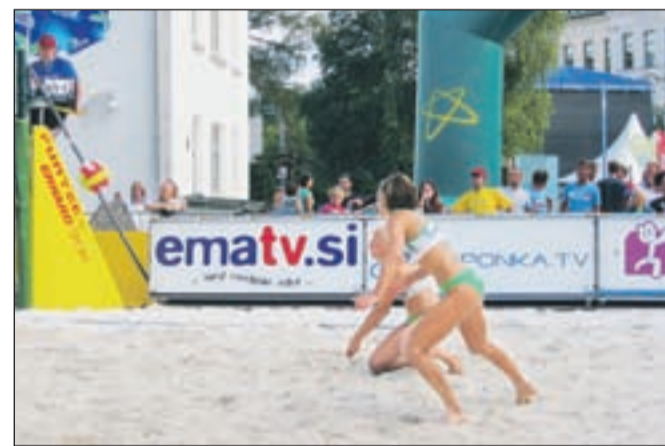
Kranfest ne mine več brez obračunov na mivki pred občino.

Turnir državnega prvenstva se bo začel danes ob 10. uri na centralnem igrišču v Kranju in na treh igriščih v RC Vogu v Besnici. Danes se bodo nastopajoči med seboj pomerili vse do polfinala, vsi četrtfinalni dvoboji pa bodo potekali v popoldanskih urah. Jutri ob 13.30 bo na sporedu prva polfinalna tekma, finale se bo začelo ob 20. uri.