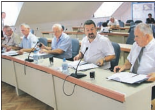
Pri gradnji novega vodovoda sodeluje pet občin.

vodovod, ki napaja približno dvajset tisoč ljudi, je sicer večinoma iz azbestnih cevi, na njem pa beležijo okoli 40 odstotkov izgube pitne vode. Gradnja novega vodovoda bo predvidoma stala 10,7 milijona evrov, od tega pa bo vsaka občina prispevala delež, ki ji pripada glede na kasnejšo porabo krvavške vode. Po tem ključu bo Mestna občina Kranj h gradnji primaknila enajst odstotkov sredstev oz. 1,17 milijona evrov, občina Cerklje 32 odstotkov (3,43 milijona evrov), Komenda in Vodice po 18,4 odstotka (po 1,97 milijona evrov) in Šenčur dvajset odstotkov (2,25 milijona evrov). Ker župani pričakujejo, da bodo iz evropskega kohezijskega sklada uspeli pridobiti od sedem do osem milijonov evrov, bo seveda končno breme za občine toliko nižje. "Krvavški vodovod je pomemben tudi za oskrbo z