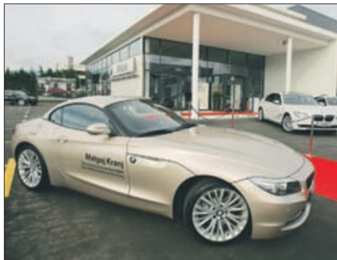
Po dolgih letih čakanja je tudi v gorenjsko prestolnico končno prišel BMW.

njen novim vozilom, poleg njih je razstavljen salon za mlada rabljena vozila z garancijo BMW Premium Selection, ki je še enkrat večji. Strankam poleg celotne palete vozil BMW zagotavljajo servis, diagnostiko, karoserijske storitve in nego vozil. V novem prodajno servisnem centru je zaposlenih 12 ljudi, vsi iz gorenjske regije. Slovesnega odprtja se je med drugim udeležil tudi kranjski župan Damijan Perne in skupaj z direktorjem Avtohiše Malgaj Andrejem Malgajem prerezal trak.