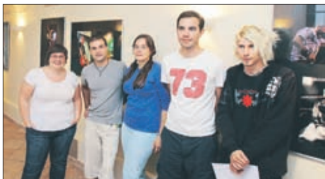
Mladi fotoreporterji so s svojimi očmi ujeli utrip Kranfesta.