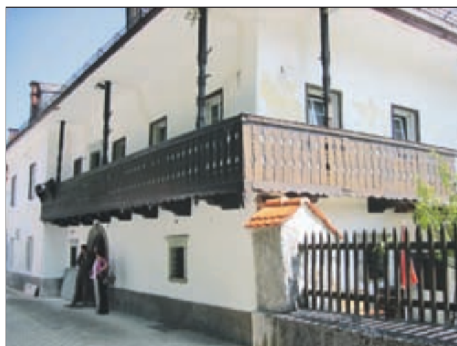
Dom Vincenca Drakslerja v Pristavi naj bi prve stanovalce sprejel še letos.

Obnova celotne stavbe bo stala nekaj več kot 431 tisoč evrov, Fundacija Vincenca Drakslerja je do sedaj za to zbrala blizu 132 tisoč evrov, v obnovo so v preteklosti vložili že 53 tisoč evrov, Mestna občina Kranj pa je lani prispevala 12 tisoč evrov, letos pa še 60 tisoč evrov. Tako za celotno prenovo manjka še nekaj več kot 174 tisoč evrov, ki pa naj bi jih dobili z novimi donatorskimi sredstvi, denarjem iz razpisov, s sofinanciranjem ustanoviteljev in tudi donatorstvom v materialu.