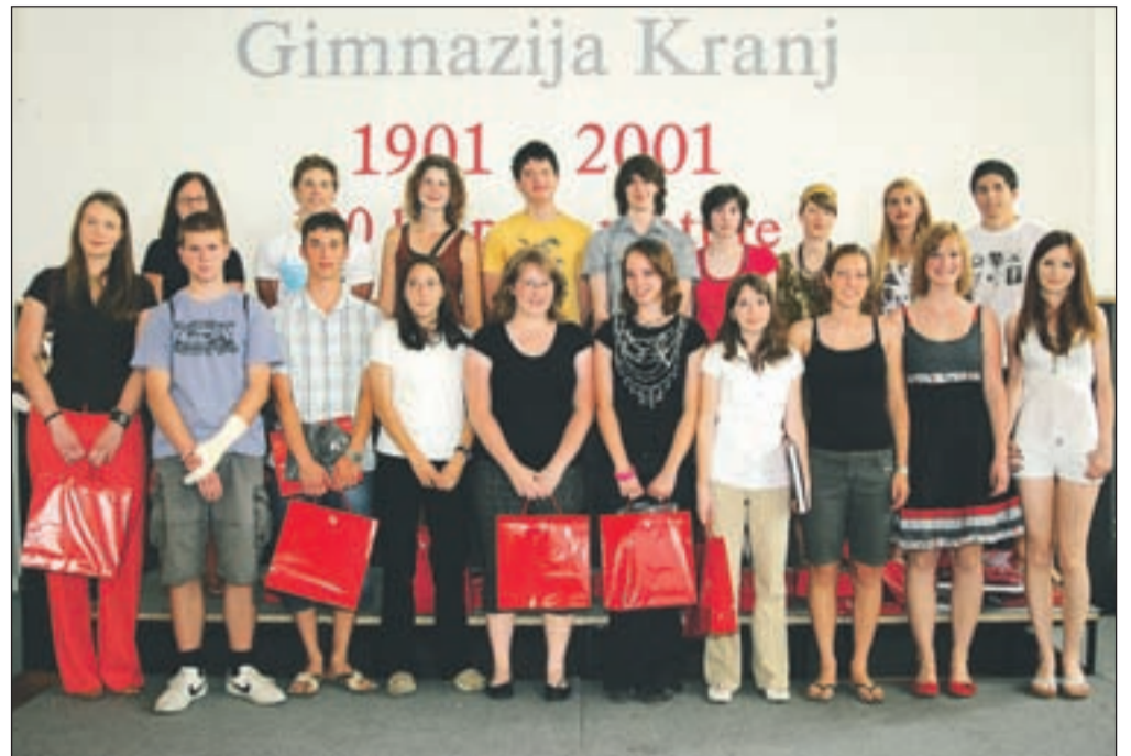
Letošnji zlati maturanti kranjske gimnazije