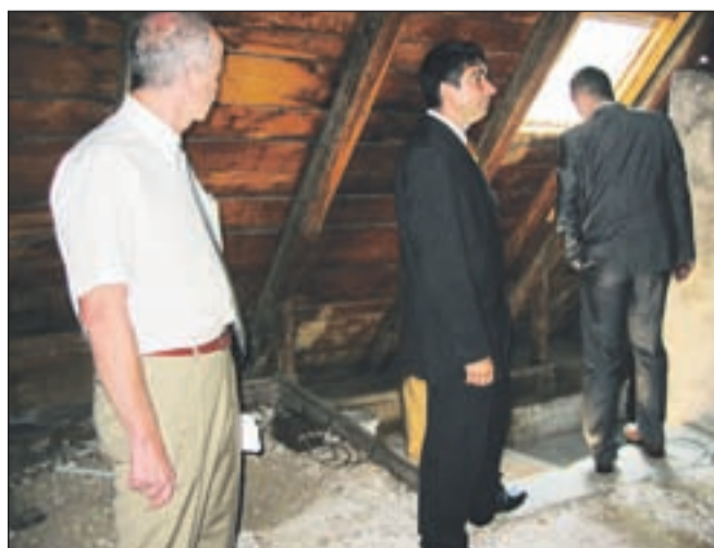
Z obnovo mansarde bodo v novem domu pridobili dodatnih 135 kvadratnih metrov.