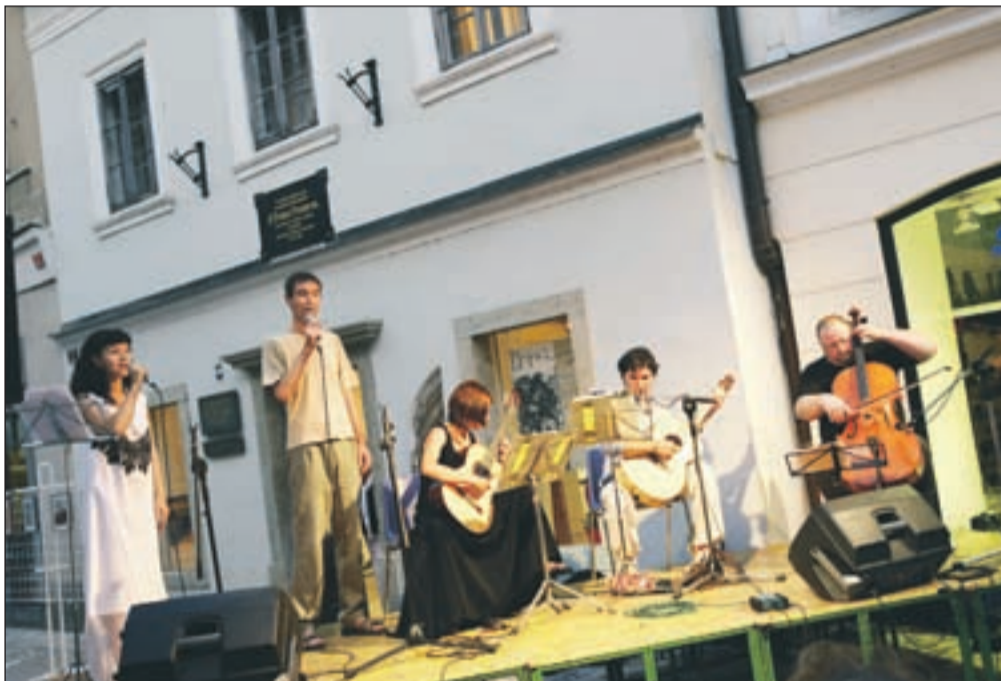
Prejšnji teden je obiskovalce v središče mesta zvalila skupina Tantadruj, danes in jutri pa se obeta množica prireditev za vse generacije.