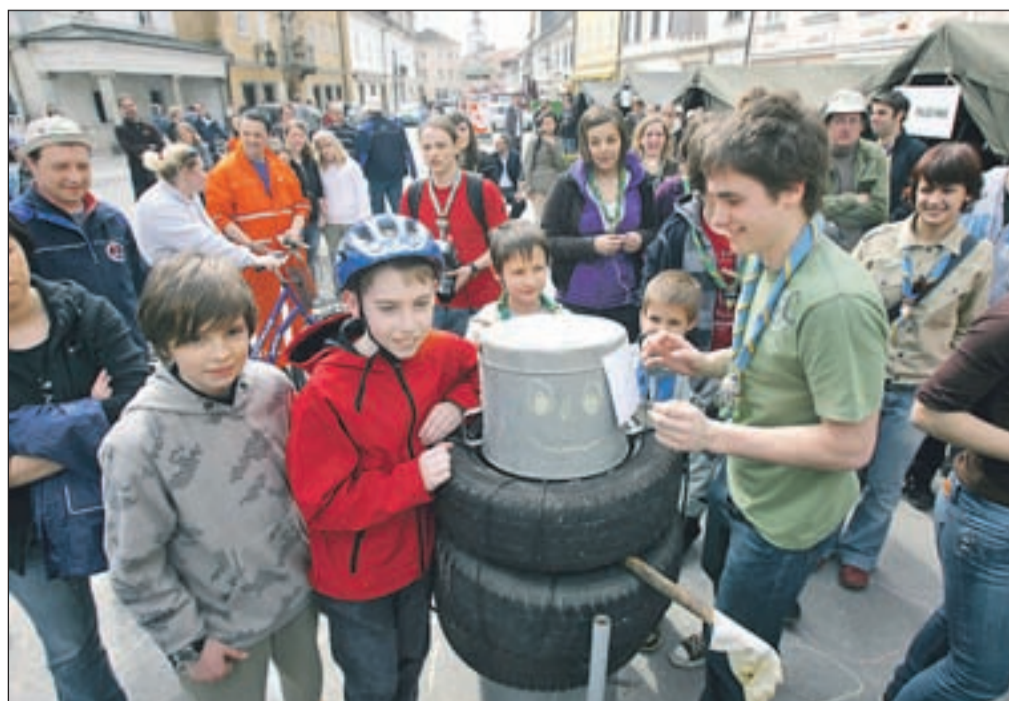
Ob zaključku akcije so se udeleženci ubrali na Glavnem trgu, kjer so razstavili najbolj zanimive odpadke, manjkalo ni niti avtomobilskih pnevmatik.