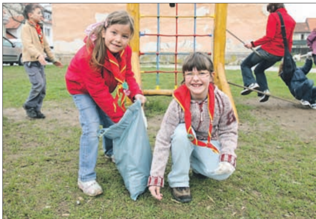
Otroci, ki jih že od malega učimo, kam je treba odlagati smeti, so se čudili koliko odpadkov, zlasti cigaretnih ogorkov, so našli na travnikih in igriščih.

Zveza tabornikov občine Kranj, Mestna občina Kranj in Poslovna skupina Sava so skupaj pripravili že osmo očiščevalno akcijo Očistimo Kranj - Kranj ni več usran, več kot dva tisoč udeležencev se je čudilo človeški malomarnosti, saj so med smetmi našli vse od neodprtega šampanjca do zobne proteze.