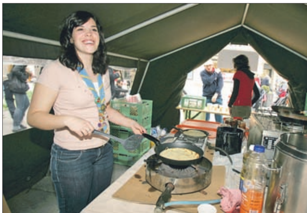
Taborniki so skrbeli za prijeten spremljevalni program, prav tako pa poskrbeli, da so se udeleženci akcije in mimoidoči posladkali s palačinkami.