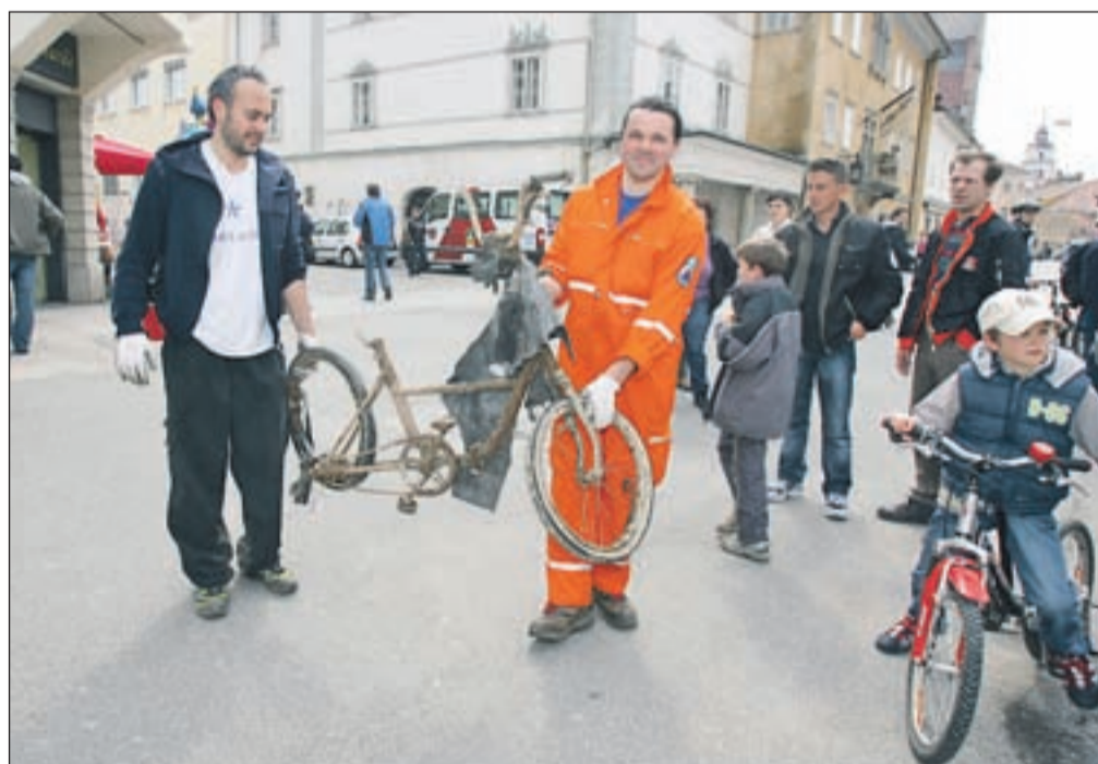
Udeleženci akcije so po mestu in okolici našli veliko odpadkov, saj se mnogi ne morejo privaditi, da je treba odložiti smeti (tudi stara kolesa) na za to primerna mesta.