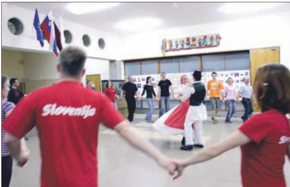
Savski folkloristi vadijo dvakrat na teden, po potrebi in pred nastopi pa tudi večkrat (v središču: prekmurska noša).