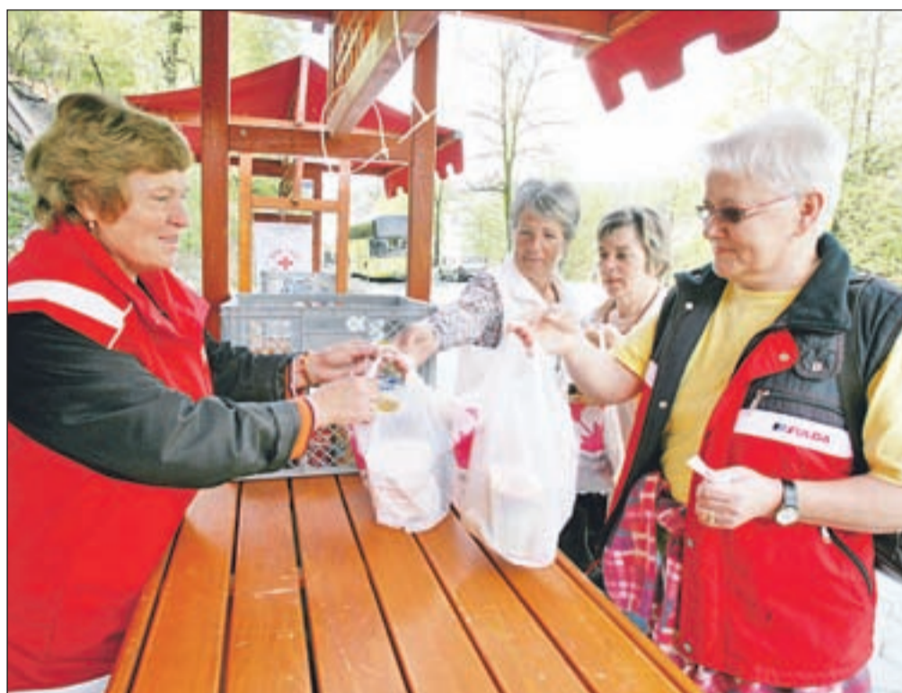
Na dobrodelni prireditvi so Kranjčani pokazali veliko solidarnost.

Kranj - Gospodarska kriza ne prizanaša niti Kranju, v mesecu aprilu pa so imeli na Območnem združenju Rdečega križa Kranj registriranih več kot šeststo proslincev za prehranske izdelke. To pa, skupaj z družinskimi člani, pomeni okoli dva tisoč ljudi, ki jim manjka denarja celo za hrano. Tako ni čudno, da zaloge hrane iz skladišč hitro kopnijo, vsaj malce so jih znova napolnila živila, ki smo jih darovali na nedavni akciji "Kranjčani pomagajte - solidarnost, ne usmiljenje". Dobrodelno akcijo so pripravili Zavod za turizem Kranj, Rdeči križ Slovenije iz Kranja, Mestna občina Kranj in Radio Kranj, vsak ki je prinesel originalno zapakirano hrano pa je imel tudi prost vstop za ogled kranjskih rovov, kjer so se predstavljala številna društva in zavodi. Prav tako so hrano zbirali ob koncertu na 3+1 žuru pred Delavskim domom, vsi obiskovalci in donatorji skupaj pa so zbrali kar 664 različnih konzerv, 131 kilogramov moke, 74 kilogramov sladkorja, 239 kilogramov testeni, 66 litrov mleka, 93 kilogramov riža, 46 litrov olja ter še nekaj druge hrane. Poleg tega je tri tisoč različnih juh darovalo podjetje Podravka, nabralo pa se je tudi nekaj denarja.