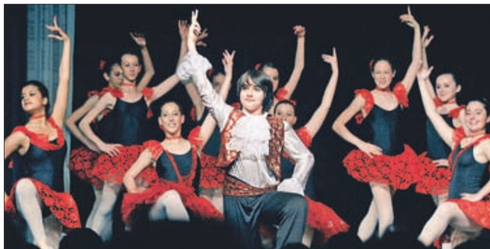
Petindvajset plesalk in plesalcev je navduševalo v kar 35 plesnih točkah.

In obiskovalci smo v Predosljah imeli kaj videti. Mladi francoski plesalci so v dobrih dveh urah z le nekajminutnim premorom predstavili kar 35 plesnih točk, bodisi v