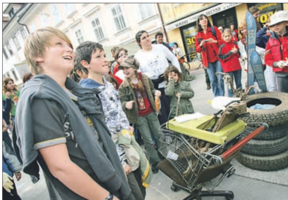
Nagrado za "naj smet" so si letos prislužili učenci PŠ Staneta Žagarja, ki so našli tudi odslužen nakupovalni voziček.