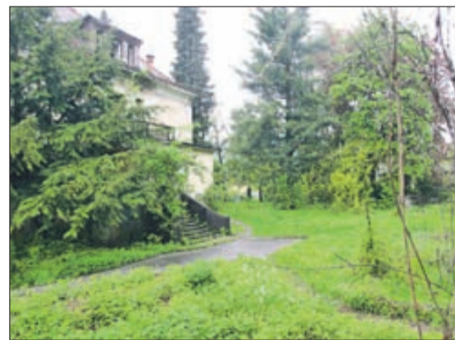
Potovalna agencija Alpetour kot lastnica parcele čaka na odgovore, šele potem se bodo lotili projekta preureditve.