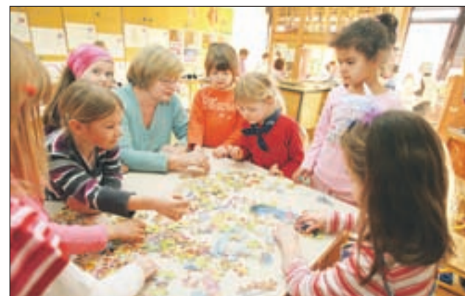
Večina staršev, ki ima otroke v katerem od kranjskih vrtcev, bo po novem plačevala od 1,5 do 4,5 evra več.