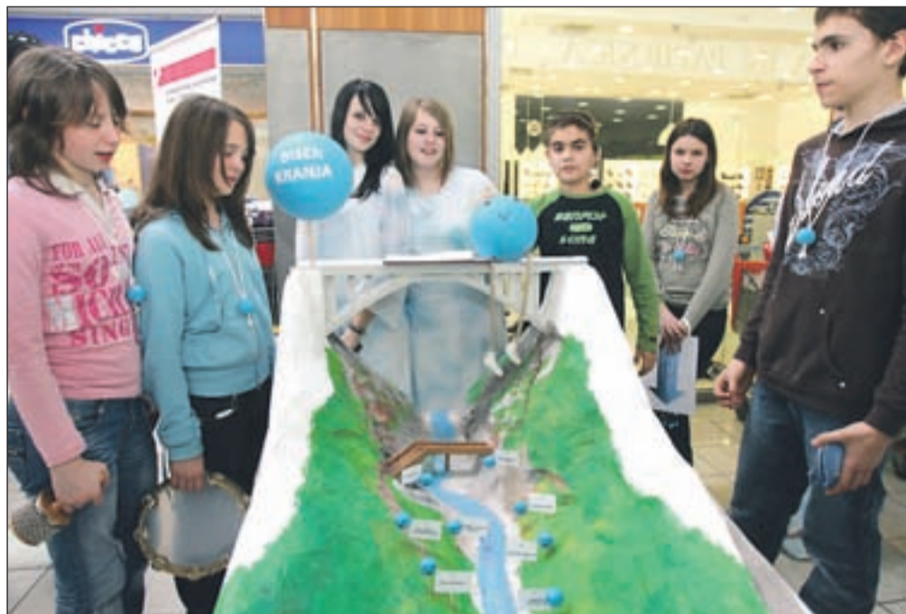
Turistična stojnica bo še enkrat na ogled med Tednom mladih v Kranju, posnetek je iz postavitve stojnice v Hipermarketu Mercator.