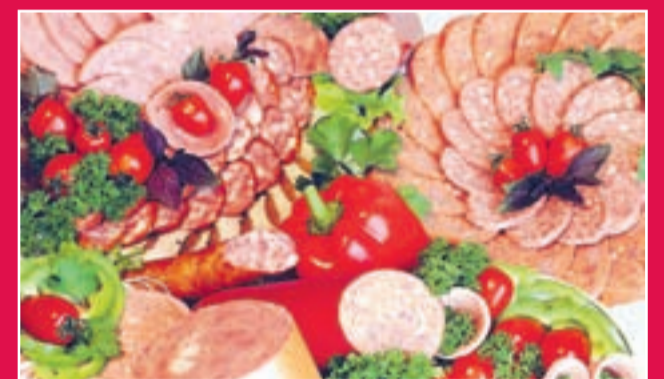
Torek, 5. maja - dobrote slovenskih kmetij