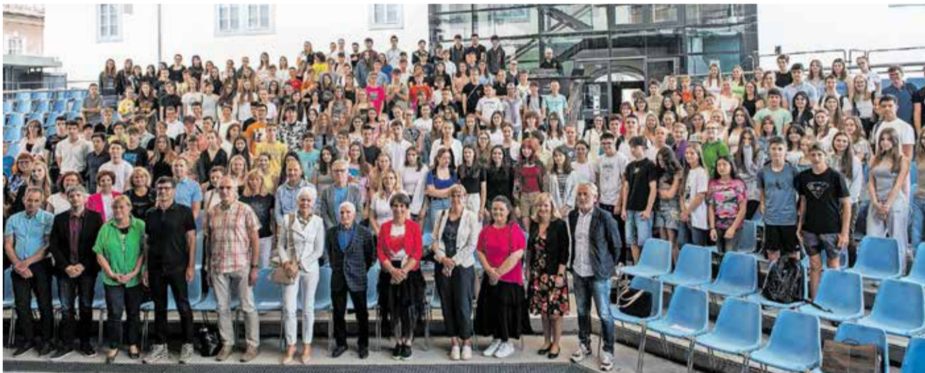
Slavnostni sprejem za kranjske odličnjake in t. i. prebojnice v Letnem gledališču Khislstein