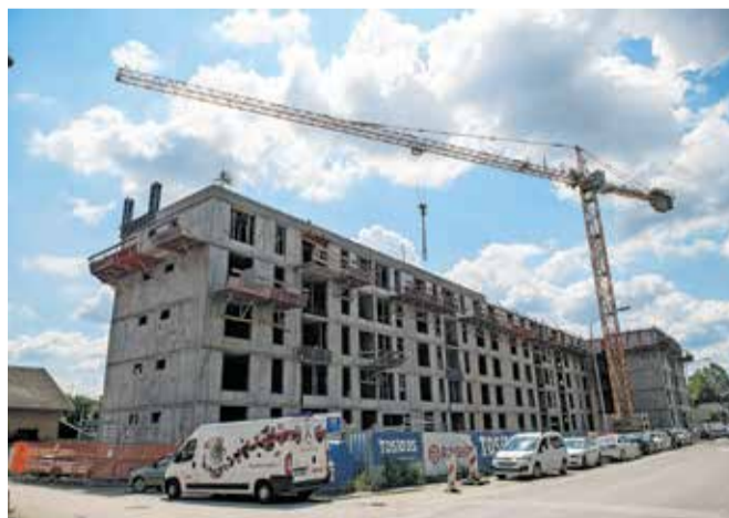
Kompleks D26 je sodobno zasnovan objekt, ki bo vključeval 66 stanovanj.