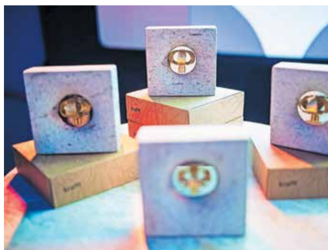
Kranjske lilije ali zlata jabolka oblikovalca Jerneja Kejžarja čakajo na nagrajence.