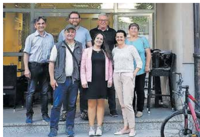
Srečanje s člani Sveta KS Kokrica

V okviru krajevnih praznikov je Mestna občina Kranj krajevnima skupnostima 24. junija predala avtomatska defibrilatorja. Na Planini bo nameščen na pročelju Dnevnega varstva starejših, v Bitnjah pri vhodu v vrtec Biba.