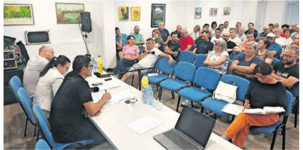
Srečanje s krajanji v Mavčičah

Na predlog Krajevne skupnosti Mavčiče je 13. junija potekal zbor občanov, ki se ga je udeležilo okoli 60 krajanov. Med drugim so poudarili problematiko vrta, saj bo v novem šolskem letu en oddelek prvega starostnega obdobja namesto v mansardi vrta Mavčiče organiziran v za to prilagojenih šolskih prostorih Osnovne šole Orehek. Občina si intenzivno prizadeva za dogovor za pridobitev celotne stavbe in odkup parcele od vrta za ureditev novih prostorov za vrtec. Še letos bo izvedena tudi energetska sanacija v vrednosti 250.450 evrov, v času katere bodo otroci obiskovali vrtec kot običajno. Veliko vprašanj krajanov se je nanašalo tudi na nadaljevanje rekonstrukcije ceste od Jame proti Bregu ob Savi, za katero občina še ni pridobila vseh zemljišč, ki so pogoj za nadaljevanje obnove. Na zboru je bila podana pobuda, da se vsem lastnikom ob predvideni obnovljeni cesti predstavi projekt ter tako prepriča v prodajo potrebnih zemljišč za nadaljevanje druge in tretje faze obnove ceste. Prav tako so se za predstavitev projekta la-