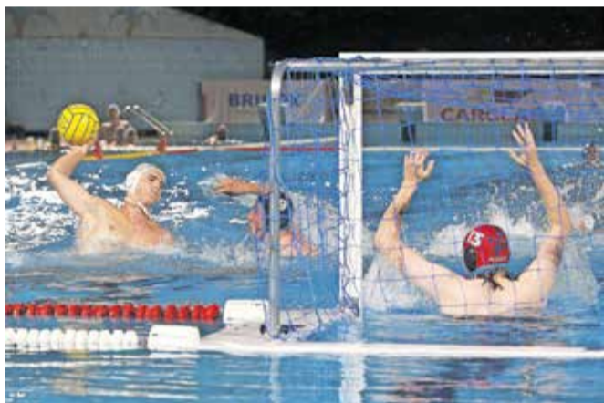
Naši vaterpolisti so v domačem bazenu dosegli dve zmagi in remi.