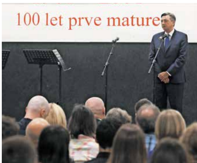
Častni gost na prireditvi Dosežki dijakov Gimnazije Kranj je bil nekdanji predsednik države Borut Pahor.

Slednje je zagotovo dokazalo 263 dijakov, ki so skupaj s spričevali prejeli pohvalo za odličen uspeh, med njimi jih je bilo 41 s samimi odličnimi ocenami v spričevalu, pa tudi prejemniki priznanj in plaket Gimnazije Kranj. Slednje podeljujejo za odličen uspeh s povprečno oceno 5 v vseh štirih letih srednješolskega izobraževanja, za odličnost na maturi, za doseženo prvo mesto na državnih tekmovanjih iz znanja, za mednarodne tekmovalne športne dosežke in dijakom četrtega letnika, ki so vsaj trikrat dosegli kriteri-