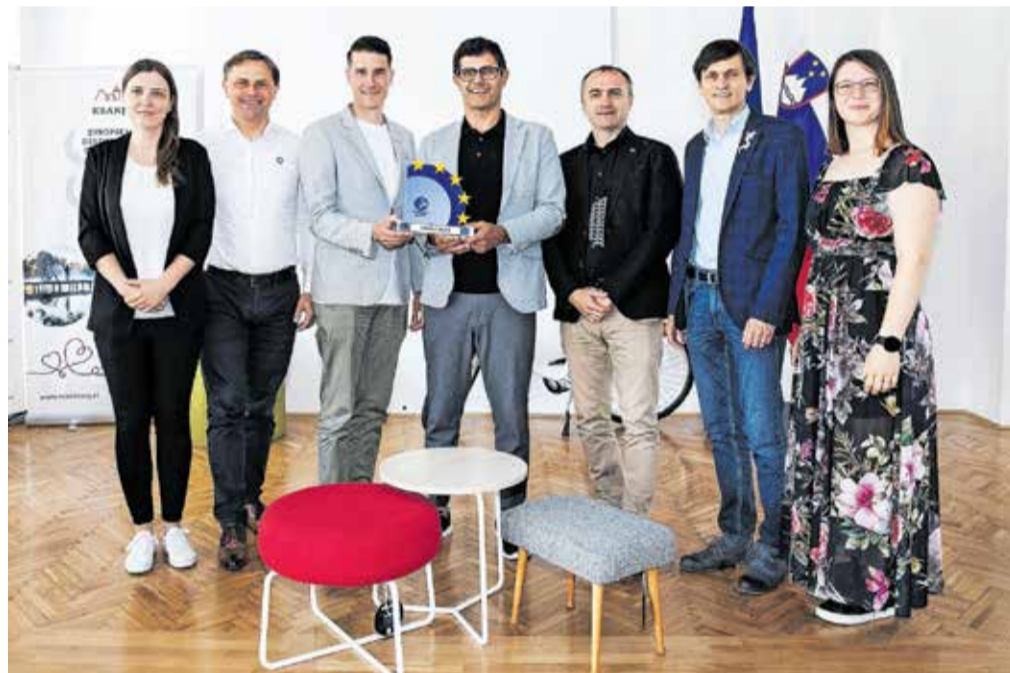
Za trajnostne projekte in produkte kranjskega turizma je Kranj prejel naziv evropska destinacija odličnosti 2023.

BIEN, bienale tekstilne umetnosti, je zelo mednarodno obarvan in se vije tako po ulicah Kranja kot pod in nad njimi. Tu so še velike športne prireditve: Kolesarski praznik v Kranju z Veliko nagrado Kranja, tokrat že 55. po vrsti, pa Mednarodni turnir v odbojki na mivki. Kr'petek je! ponuja ob dobri glasbi in prijetnem ambientu za druženje še kulinarična doživetja. Za otroški program so poskrbeli v Kricah kracah ... Natančnejši program vas čaka na strani 9 v