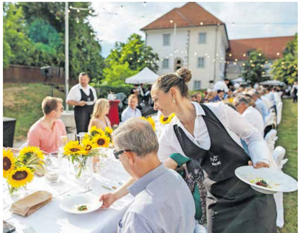
Kranjska dolga miza bo 7. septembra osredotočena na lokalne sestavine, ki bodo na večerji zasijale v vsej svoji lepoti. Na fotografiji je utrinek z lanskega dogodka.

Večerjo, ki se bo osredotočila na lokalne dobrote, pridelane v Kranju in okolici, bodo na vrtu Gradu Khislstein postregli v četrtek, 7. septembra, ob 17. uri. Podrobnosti o tem, kako rezervirati vstopnice, bodo že kmalu objavljene na spletni strani visitkranj.com . Poleg tega bo to poletje v Kranju zaznamovalo še nekaj gurmansko obarvanih datumov, kajti že kmalu, 28. in 29. julija, bo na Glavnem trgu gostovala Karavana okusov. Kot omenjeno, pa v gorenjsko metropolo letos pletiti prvič prihaja Odprta kuhna, ki bo Kranjčane in obiskovalce razveselila 26. avgusta.