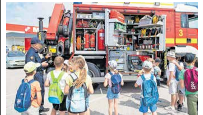
Otroci so se seznanili z delom reševalnih in intervencijskih služb, ki skrbijo za varnost v prometu.

šol in vrtcev poleg svojega dela predstavili še opremo in vozila. Obenem je potekal niz izobraževalnih aktivnosti, na katerih so jih opremili s koristnimi informacijami, ki prispevajo k izboljšanju varnosti udeležencev v cestnem prometu. Sodelovale so gasilsko-reševalna in medicinska služba, policija, medobčinski redarji ter ekipa Rdečega križa. Iz AMZS Ljubljana so otrokom omogočili izkušnjo na simulatorju prevračanja, člani Kolesarskega kluba Kranj so postavili poligon, prisotni pa so bili tudi predstavniki Centra trajnostne mobilnosti Kranj.