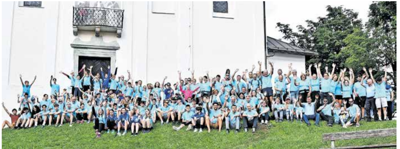
Triglavova modra družina je tudi letos poskrbela za odlične rezultate.