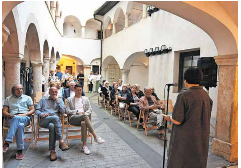
Poletje s Prešernovimi nagrajenci so sredi junija odprli z razstavo del, pridobljenih v galerijsko zbirko v zadnjih sedmih letih.