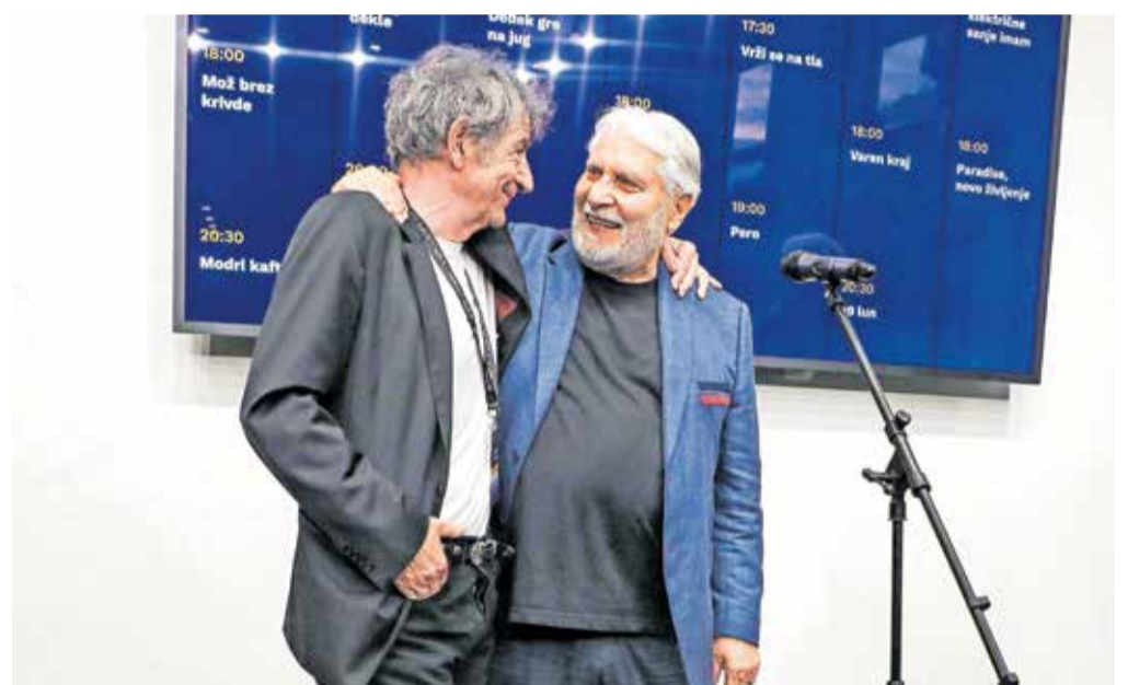
Prva gosta festivala, igralska prijateljica Miki Manojlović in Boris Cavazza