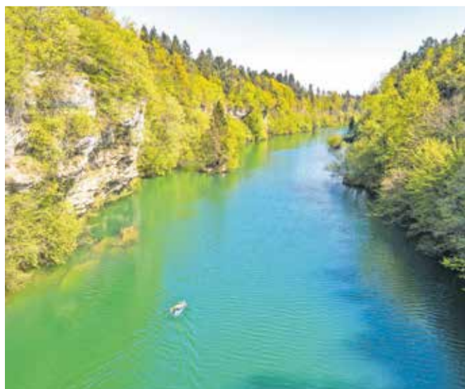
Petdeset metrov visoki kanjon Zarica

Poleg vodnih aktivnosti Trbojsko jezero v sebi skriva tudi zaklad narave, zdravlilne energijske točke, ki vas bodo pomirile, očistile in zdravilno vplivale na telo in dušo. Ustavite se še v Čolnarni, kjer postrežejo s slastno in osvežilno poletno ponudbo.