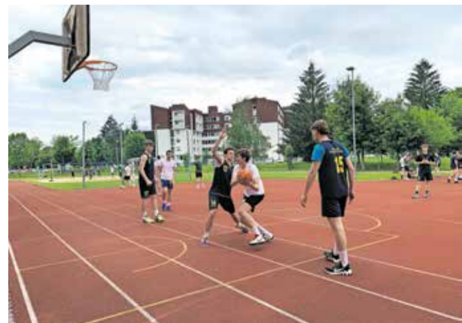
Bolj kot rezultat je štelu druženje dijakov dveh gimnazij v Kranju.

košarka na en koš za dekleta in fante, odbojka na mivki (mešane ekipe) ..., sodniki pa so bili večinoma kar dijaki. Poudarek je bil na druženju, ne na rezultatu. »Vse skupaj so spremljali tudi slovenska glasba, osvežilni napitki in dobro vzdušje, ki so ga pripravili navdušeni dijaki, ki so napolnili travnike ob zunanjih šolskih igriščih.«