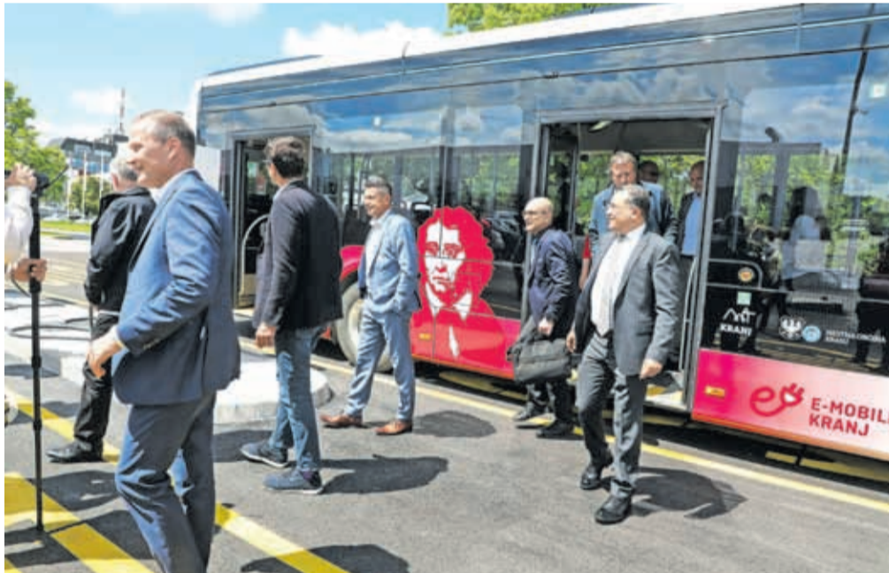
Po prevzemu električnih avtobusov so se vabljeni gostje z njimi tudi zapeljali.