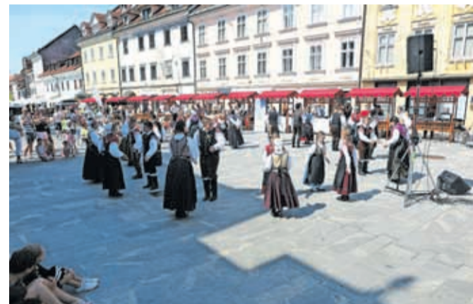
Utrinek s Pozdrava poletju leta 2021

krajšega sporeda z vseh področij kulturno-umetniškega ustvarjanja. Hkrati bo na panojih in stojnicah potekal tudi sejem nevladnih organizacij, kjer bo prostor za promocijo kulturnih društev in drugih nevladnih organizacij, promocijsko gradivo lahko oddate tudi na skupno stojnico ZKD Kranj. Rok za oddajo prijavnice in s tem potrditve udeležbe je četrtek, 9. junij, na elektronski naslov zkd.kranj@gmail.com.