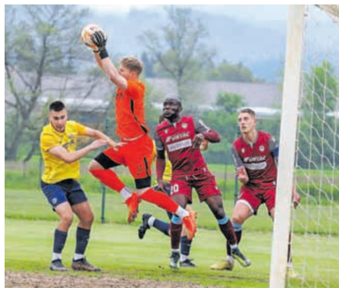
Nogometaši kranjskega Triglava (v temno rdečih dresih) so drugoligaško sezono zaključili z zmago. V gosteh so premagali Roltek Dob.