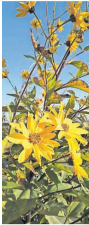
Topinambur ( Helianthus tuberosus )

Zavedati se moramo, da je odstranjevanje ITV dolgotrajen proces, ki zahteva večletno delo, vztrajnost in natančnost. Z vztrajnostjo lahko vrsto na posamezni lokaciji tudi trajno odstranimo in damo novo priložnost domorodnim vrstam, da ponovno zasedejo svoje mesto v naravi.