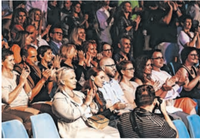
Filme na Krafftu si boste letos ogledali v kinu Moj kino Kranj, ki vrata odpira junija.

Festival, ki nastaja v koprodukciji Filmskega društva Krafft in Prešernovega gledališča Kranj v sodelovanju z Mestno občino Kranj, bo letos odprla predsednica republike dr. Nataša Pirc Musar. Od nedelje do zaključka festivala si boste lahko ogle-