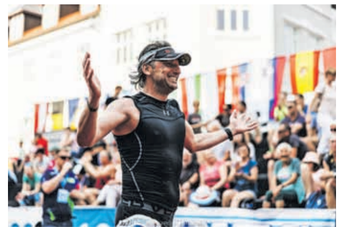
Lani so gledalci napolnili tribuno in okolico proge ter navijali za ultramaratonce. / FOTO: TADEJ PIŠEK

Nagradni sklad za zmagovalce je letos bistveno višji, saj bosta zmagovalka in zmagovalec 12-urnega teka prejela po tisoč evrov ter prijavnino za partnersko ultratekmo v Braziliji. Poleg tega bo najboljši tekač prejel še poseb-