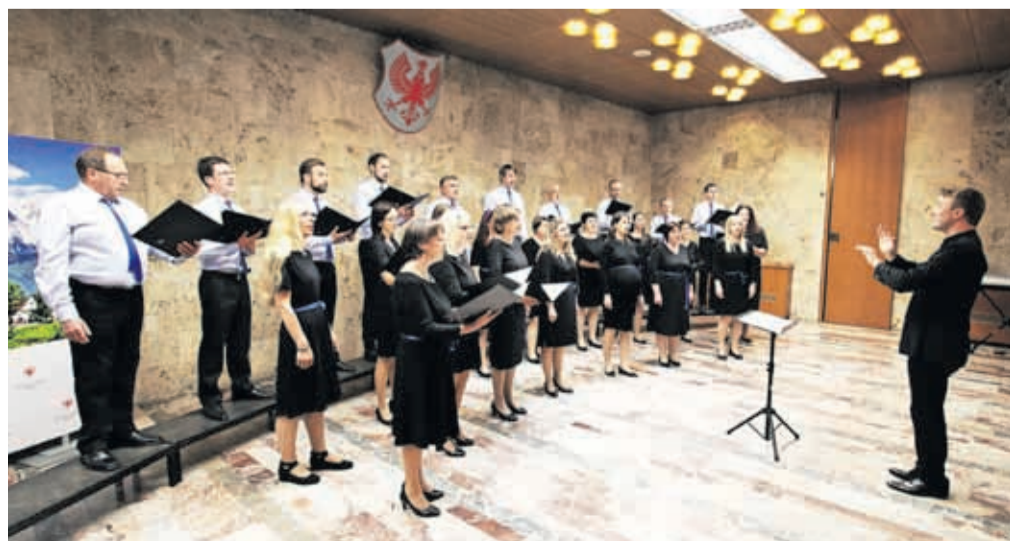
KPZ Mysterium nadaljuje koncertni cikel Naj se sliš'.

programa so vsi pevci, združeni v stočlanski zbor, zapeli še čudoviti slovenski ljudski skladbi Ta na Solbici ter vsem znano Pa se sliš'. Gostitelji so bili veseli številnega občinstva, ki je napolnilo avlo Mestne občine Kranj in bilo navdušeno nad koncertom ter idejo o združevanju zborovske kulture. Čudovit glasbeni večer so pevci in poslušalci zaključili ob prepevanju ljudskih skladb in z druženjem ob pogostitvi, ki so jo pripravili pevci zbora gostitelja. Tretji koncert iz cikla Naj se sliš' bodo pripravili jeseni.