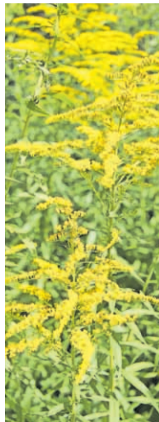
Kanadska zlata rozga ( Solidago canadensis )