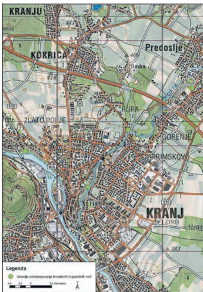
Zemljevid lokacij čiščenja invazivk na območju Mestne občine Kranj 2023

Na izbranih občinskih zemljiščih bodo organizatorji, šolarji, dijaki, taborniki in prostovoljci odstranjevali invazivne tujerodne vrste. Na terenu bodo prostovoljci pri prepoznavanju invazivnih tujerodnih rastlin usmerjali posebej usposobljeni koordinatorji.