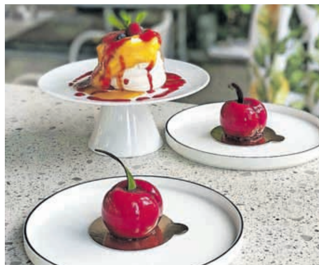
Poletna ponudba na Brionih

tortice z mangom in pasijonko, limonine pite z meringo ter poletne češnjice v monoporcijski izvedbi. Navadnemu tiramisuju se je pridružil poletni pistacijev tiramisuj z jagodami. Obvezno morate poskusiti tudi njihove sladolede, ki jih izdelujejo samo iz naravnih sestavin – sivka in pehtran bosta kralj in kraljica tega poletja! Med pijačami bodo prevladovali osvežilni napitki, kot so naravne sezonske limonade različnih okusov, domači ledeni čaji, ledene kave, cafe affogato, ledena matcha in hladno varjena cold brew kava. Ob večerih pa se bodo še posebej priljubljeni gin toniki in osvežilni kok-