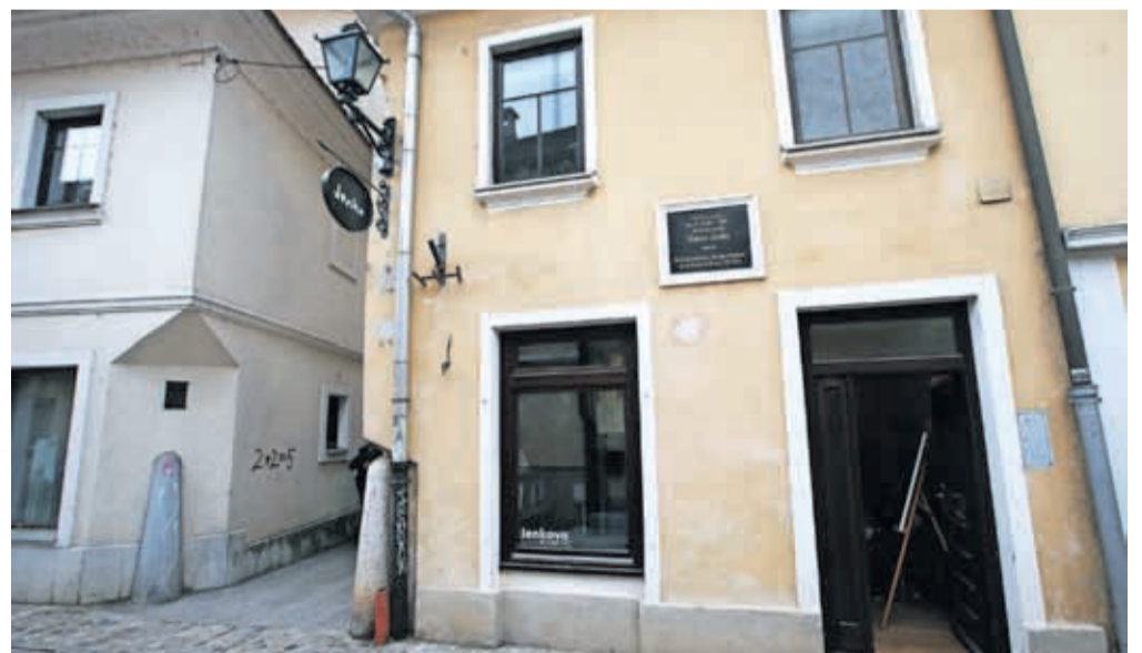
Jenkovo rezidenco, del nastajajočega razpršenega hotela, so odprli v hiši v središču Kranja, v kateri je nekaj časa prebival pesnik Simon Jenko.