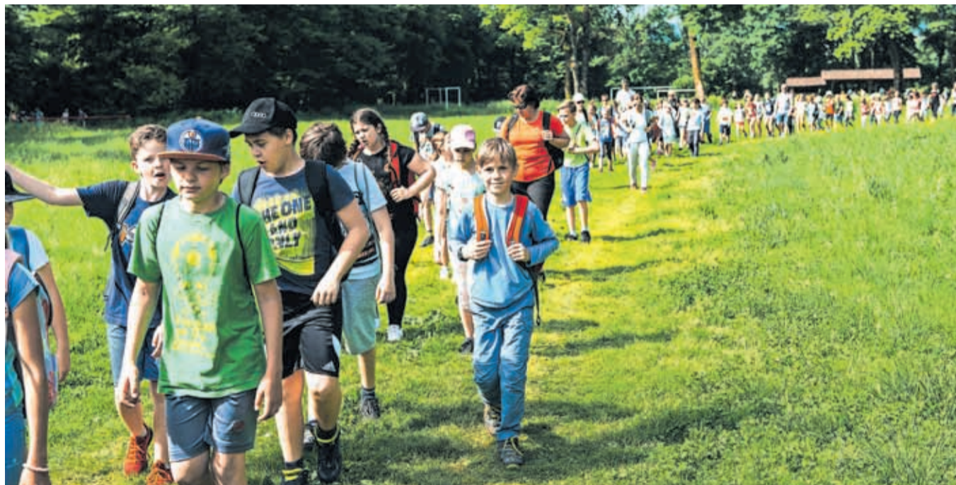
Turistično društvo Kokrica letos organizira že 14. Pohod po Mamutovi poti. Daljša trasa je dolga štirinajst kilometrov, krajša, namenjena mladim družinam, pa tri kilometre in pol.

V Bobovških jezercih, mimo katerih vas bo vodila pot, so leta 1953 odkrili okostje ledenodobnega mamuta. Od tod tudi izvira ime poti. Po samici, stari okoli 40 let, ki je pred približno 180 tisoč leti živela na tem območju. Prepustite se domišljiji in se povežite z našo daljno preteklostjo. Simfonija ptičjega petja, nežnega šumenja listov in brnenja čebel vas bo spremljala med travniki in