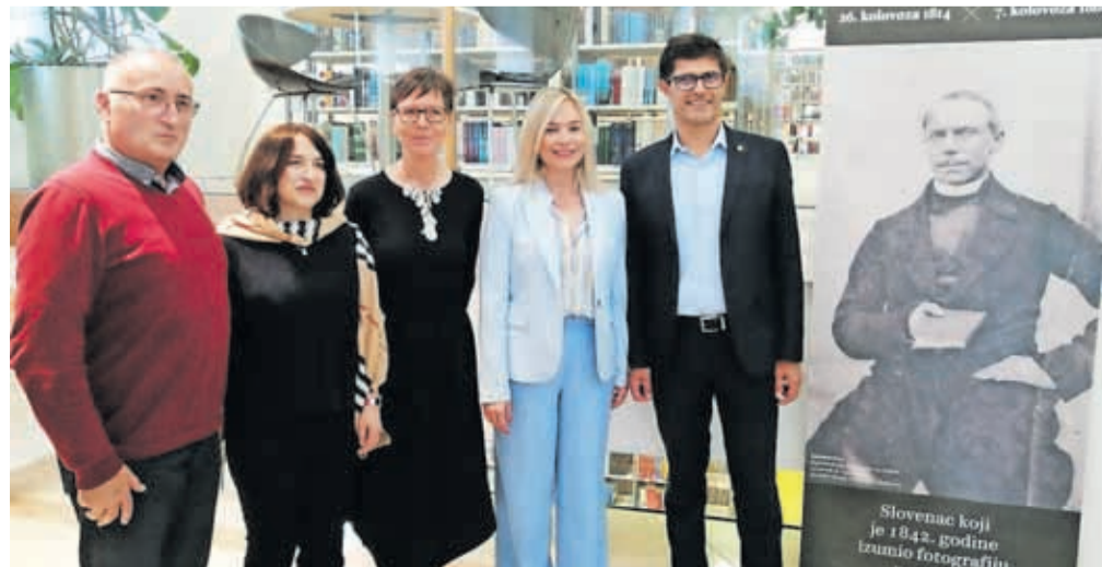
Razstava o Janezu Puharju se je v Pulju ustavila v sodelovanju z Osrednjo knjižnico Celje.