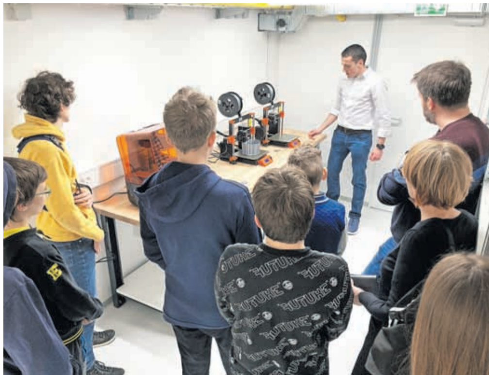
Na učnih urah v OpenLabu

Novo dimenzije je dobilo tudi sodelovanje z osnovnimi in srednjimi šolami. V sodelovanju s Kovačnico in samostojno je OpenLab v letošnjem letu izvedel več tehniških dni, predstavitev ter prikazov sodelovanja in delovanja različnih tehnologij. Tehniške dneve izvajajo tako na šolah kot v Kovačnici, kjer lahko mladim predstavijo tudi naj sodobnejše tehnologije. Tehniške dni so od selitve novembra lani že izvedli na kranjskih osnovnih šolah Franceta