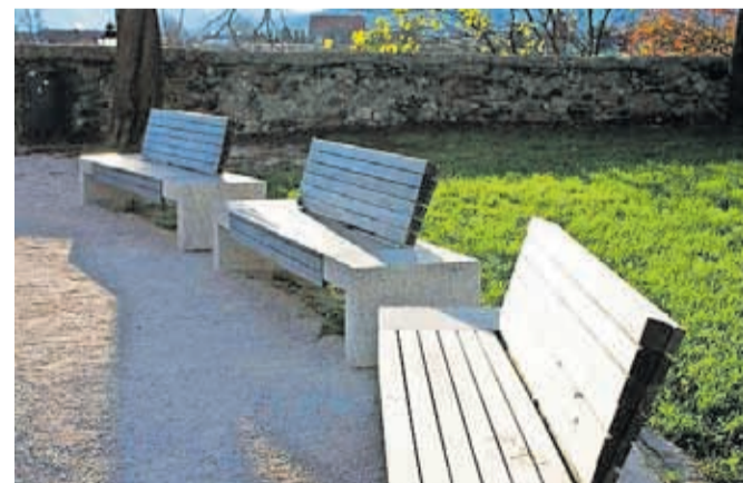
Klopi na Pungertu

za podnebno nevtralnost in občinski program varstva okolja. Vprašalnik bo aktiven do 31. maja. Spletna oblika je dostopna na spletni strani MOK (na naslovnici oz. v rubriki Ankete) ali prek QR kode (na sliki) za mobilne naprave. Na voljo so tudi tiskani izvodi vprašalnika v Mestni knjižnici Kranj, sprejemni pisarni MOK in Layerjevi hiši. V tem primeru naj sodelujoči izpolnjeni vprašalnik vrnejo na isto mesto, kjer so ga prevzeli, ali pa ga pošljejo po pošti na naslov: Mestna občina Kranj, Slovenski trg 1, 4000 Kranj, s pripisom »Podnebno nevtralen Kranj«. Za sodelovanje se občanom v mestni upravi že vnaprej zahvaljujejo.