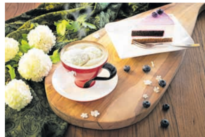
Jogurtova torta z borovnico in kava s smetano / FOTO: RENDEZ VOUS

gurtovo torto z borovnico, h kateri se odlično poda kozarec lahkega Roseja vinske kleti Pečarič-Meginc. Odlična izbira je tudi hišna ledena kava z domačim sladoledom in ekstra okusno smetano! Ljubitelji malin morate obvezno poskusiti malinine sanje, domač vaniljev sladoled z vročimi malinami ali cassato, rolado z vaniljevim sladoledom, posuto s krokanti, ki si jo sami prilijete s kombinacijo vročih malin in višenj. Na Brionih vas iz vitrine s sladicami kličejo osvežilne sadne torte. Ne spreglejte brezglutenske