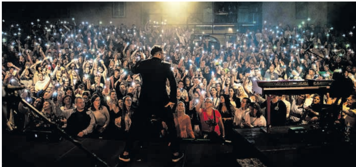
Na odru Letnega gledališča Khislstein se bodo zvrstili koncerti večjega obsega.

www.visitkranj.com; vstopnice za koncerte pa je že moč kupiti na Eventim prodajnih mestih, Petrol servisih, v Kranjski hiši in spletni strani Eventima. Zavod za turizem in kulturo Kranj k izvedbi prireditev v lastni organizaciji pristopa trajnostno. Ta se nanaša predvsem na trajnostno mobilnost, zato obiskovalce nagovarjamo, naj na dogodke prihajajo peš ali s kolesom, z uporabo javnih ali deljenih prevozov ter s tem prispevajo k manjšemu ogljičnemu odtisu prireditev. Na dogodkih bomo stregli v plastičnih kozarcih za večkratno uporabo in poskrbeli, da bo na prizoriščih možnost ločevanja odpadkov. Vse obiskovalce prosimo še, da naj na prizoriščih za seboj ne puščajo smeti in skrbijo za ohranjanje čistoče v mestu. Vabimo vas, da si podrobnejši program Prešernega poletja pogledate na www.visitkranj.com.