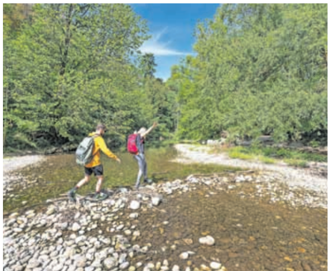
Karavanška pohodniška pot je sestavljena iz sedmih etap.

po skoraj 29 kilometrov dolgi trasi stran od mestnega vrveža in v pravo gorsko idilo. Iz Kranja se odpravite proti Čukovi jami in ribniku Račnik v osrčje krajinskega parka Udin boršt. Zaradi svojih naravnih, podeželskih in kulturnih znamenitosti ter lege v osrčju Gorenjske gre za edinstveno območje. Prepredeno je s številnimi sprehajalnimi in pohodnimi potmi, ki so primerne tudi za kolesarjenje in tek. Privoščite si nekaj globokih vdihov in izdihov ter se naužite bogastva mogočne narave. Nato se boste vzpeli mimo Golnika in naprej do vasi Gozd pod Kriško goro. Sledi prijeten spust v trziško dolino, kjer vas bo pričakala bogata industrijska tradicija Trziča. Daljinska Karavanška pohodniška pot je bila zasnovana z željo prepleta raznovrstnih občutkov, čudovitih razgledov, preproste pohodniške izkušnje in okušanja življenja pod Karavankami. Preostale etape vas bodo vodile še do čudovitega Jezerskega, Begunj na Gorenjskem, Doma Pristava, Mojstrane in Kranjske Gore. Odlična ideja za aktiven dopust in raziskovanje lepot Gorenjske!