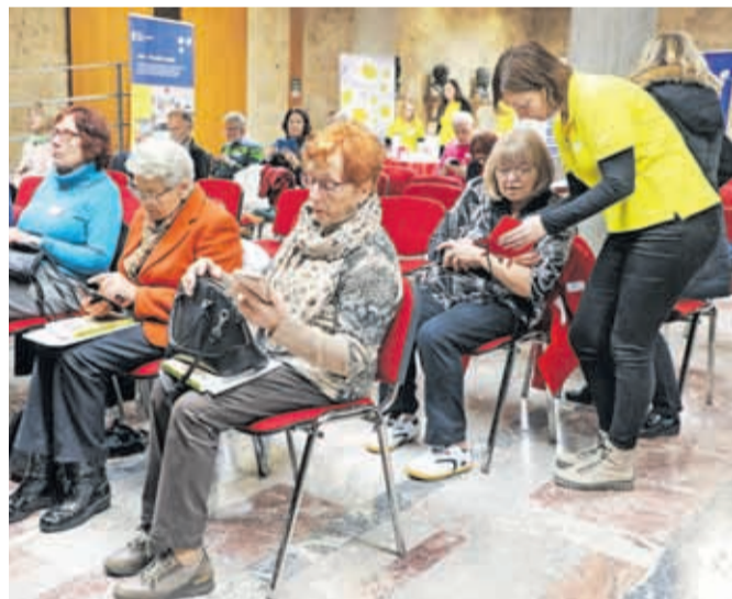
Konference KR ZA starejše se je udeležilo več kot petdeset starejših občanov in občanov.