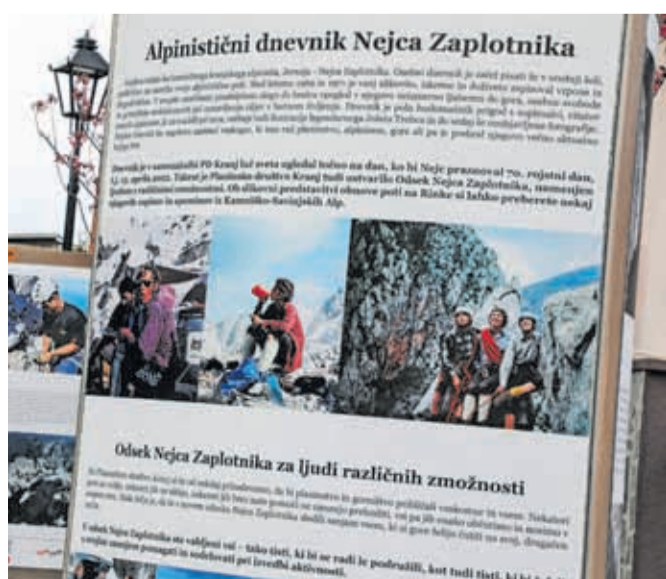
Razstava pred kranjsko knjižnico

Kranj – Planinsko društvo Kranj in Odsek Nejca Zaplotnika sta ob 40. obletnici smrti alpinista Nejca Zaplotnika 24. aprila organizirala spominski pohod od Rupe do Bežkove vile v Kranju. Pohodniki so se zbrali pri cerkvi na Rupci, krenili mimo njegove rojstne hiše po poti, ki jo je kot otrok neštokrat prehodil. V Galeriji na mestu pri Mestni knjižnici Kranj so si ogledali razstavo, ki nas z besedo in sliko popelje skozi dnevnik Nejca Zaplotnika in po planinskih poteh. Pohod so končali pri Bežkovi vili, kjer so k njegovemu doprsemu kipu položili spominski venec.