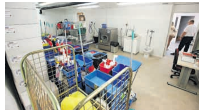
Novo prostore so dobile tudi čistilke.