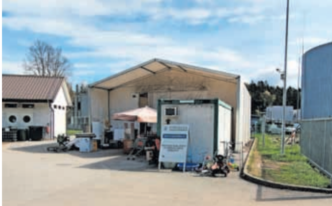
Šotor za zbiranje uporabnih predmetov na Zarici bodo v kratkem prestavili na bližnjo lokacijo.

V socialnem podjetju se posvečajo več družbenim problemom in povezujejo pomoč odvisnikom, invalidom in mladim v stiski z elementi krožnega gospodarstva. V trgovinah s predmeti ponovne rabe zaposlujejo težje zaposljive invalide, v delavnicah, kjer obnavljajo pohištvo in pripravljajo predmete ponovne rabe za prodajo, pa z delom usposabljujejo nekdanje odvisnike za reintegracijo v življenje brez drog. Lani so v sodelovanju s Komunalo Kranj in podjetjem Zeos v Kr'Štacuni na Maistrovem trgu v Kranju odprli oddelek za prodajo rabljene elek-