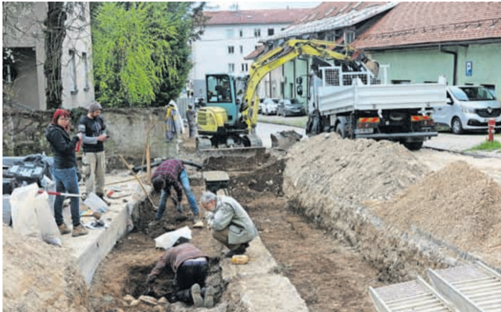
Ob Prešernovem gaju so v marcu in aprilu potekala arheološka izkopavanja.