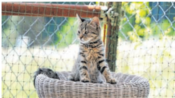
Zavetišče je lani oskrbelo 204 mačke.

Poskrbeli so tudi za prevoz oziroma oskrbo 204 mačk, štiri mačke pa so bile v zavetišču še od leta 2021. Opravili so 83 sterilizacij, 61 kastracij, 37 evtanzij zaradi poškodb in bolezni, oskrbeli so poškodbe devetih že steriliziranih oziroma kastriranih živali, poskrbeli za ustrezno aplikacijo zdravil, odpravo parazitov in drugo. Štiri mačke so poginile, 113 so jih po opravljenih storitvah vrnili na lokacijo pobiranja, 48 mačk je bilo oddanih v posvojitev novim skrbnikom, šest pa jih je bilo konec leta 2022 še v oskrbi zavetišč.