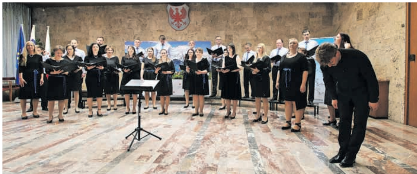
KPZ Mysterium in MePZ Leo Fortis sta skupaj zapela rezijansko Ta na Solbici.

Gostitelji so bili veseli številnega občinstva, ki je napolnilo avlo Mestne občine Kranj in bilo navdušeno nad koncertom in idejo o združevanju zborovske kulture. Čudovit glasbeni večer so pevci in poslušalci zaključili z druženjem ob pogostitvi, ki so jo pripravili pevci zbora gostitelja, in pa prepevanju ljudskih pesmi. Drugi koncert iz cikla bo sledil še to pomlad, tretji pa bo jeseni.