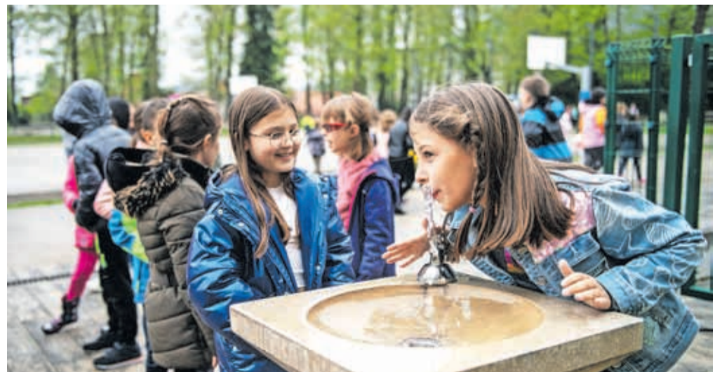
Voda iz pipe je v Kranju zelo dobra.