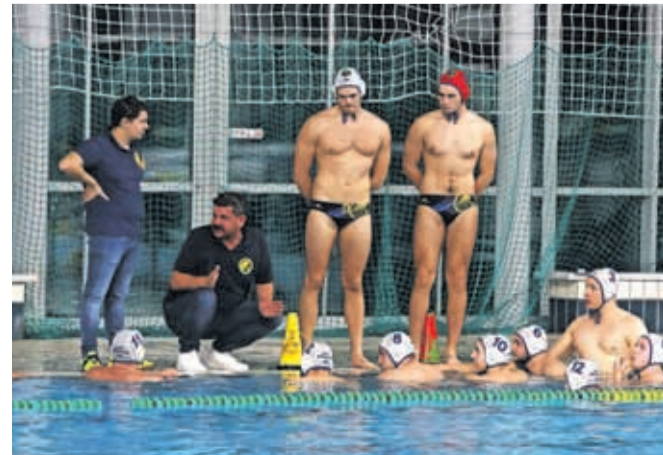
Vaterpolisti Triglava bodo polfinale začeli s prvega mesta.

V polfinalu bodo Kamničani igrali s Triglavom. Prva tekma bo v Kranju. V drugem polfinalnem paru se bosta pomerila Branik in Slovan. Polfinale se bo začel 10. maja, ekipe pa igrajo na dve zmagi.