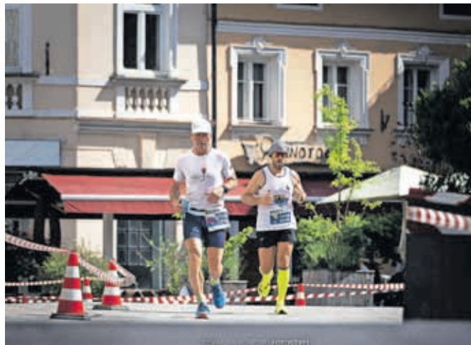
Čez dober mesec dni, prvo junijsko nedeljo, bo v Kranju znova 12-urni ultra tek.

SLO12RUN bo štel za 2. prvenstvo Slovenije v teku na 12 ur. Za tekače iz Bosne in Hercegovine bodo že drugi izvedli bosansko prvenstvo v teku na 6 ur. V soboto, 3. junija, in v nedeljo, 4. junija, bo ob prizorišču tudi sejem športne opreme, sobotni večer pa bo znova rezerviran za tematski pogovor s priznanimi ultramaratonci in drugimi gosti.