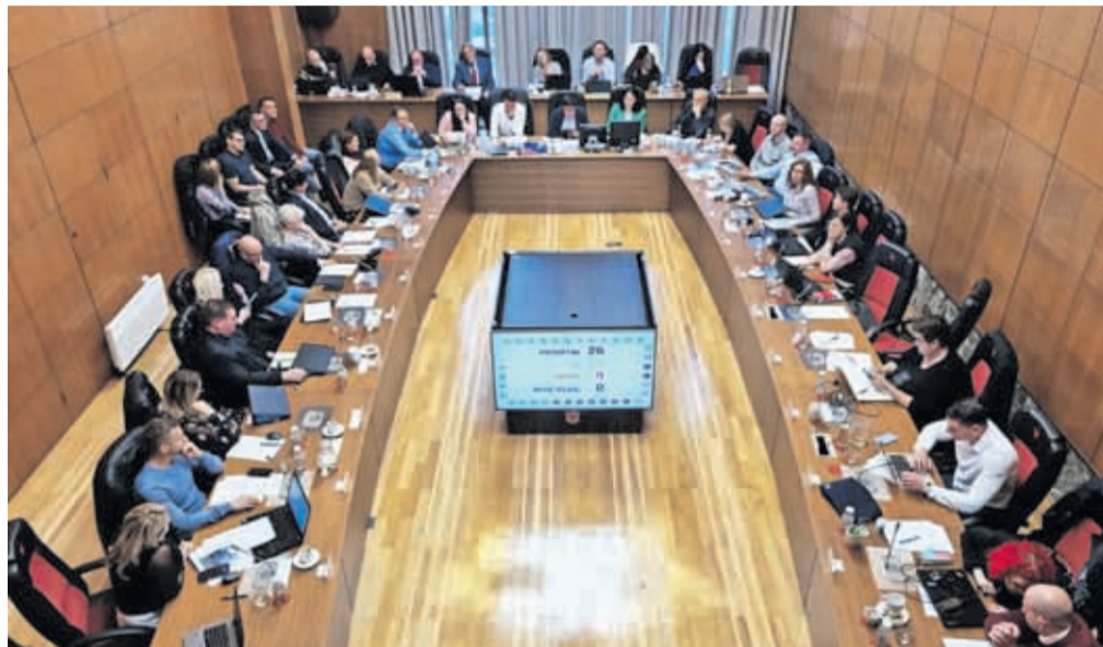
Kranjski svetnice in svetniki so na aprilski seji potrdili nove cene komunalnih storitev.

Tudi cene storitev zbiranja določenih vrst komunalnih odpadkov se niso spreminjale že več let, natančneje od