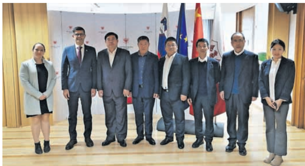
Predstavniki Kranja in Džangdžjakova so se srečali prvič po pobratenju decembra 2021.

fucijeve učilnice na Gimnaziji Kranj in Gimnazije Franceta Prešerna. Med drugim se je podrobneje seznanila še z delovanjem Kovačnice – podjetniškega inkubatorja Kranj, kjer so se jim predstavili tudi mladi podjetniki s svojimi izdelki, in Centra trajnostne mobilnosti ter Informacijskega centra SOS proteus, Kranj pa so si ogledali tudi s Sv. Jošta. Džangdžjakov je mesto, ki je gostilo zadnje zimske olimpijske igre (Peking 2022). Na teh je med 40 slovenskimi športniki četrtina predstavljala kranjske športne klube. Med dobitnike kolajna sta se v Džangdžjakovu vpisala tudi Peter Prevc in Cene Prevc, člana Smučarskega kluba Triglav Kranj, priskakala pa sta si jih v skakalnem centru, pri gradnji katerega je sodelovalo kranjsko podjetje Mana Original.