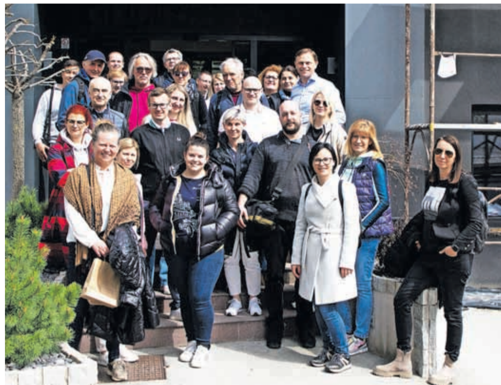
Udeleženci strokovne ekskurzije pred podjetjem Dewesoft

Ekskurzija je bila namenjena zaposlenim na fakultetah, osnovnih in srednjih šolah (ravnatelj, učitelj, profesor, mentor, ...), v javnih zavodih in Kovačnici – podjetniškem inkubatorju Kranj. Odziv med ravnatelj, učitelji in mentorji je bil odličan, saj se je na pot v Trbovlje odpravilo več kot trideset predstavnikov kranjskih in okoliških srednjih in osnovnih šol, Kovačnice, Mestne knjižnice Kranj, Fakultete za elektrotehniko in Mestne občine Kranj. Tovrstne ekskurzije so priložnost za spoznavanje s projekti za mlade talente,