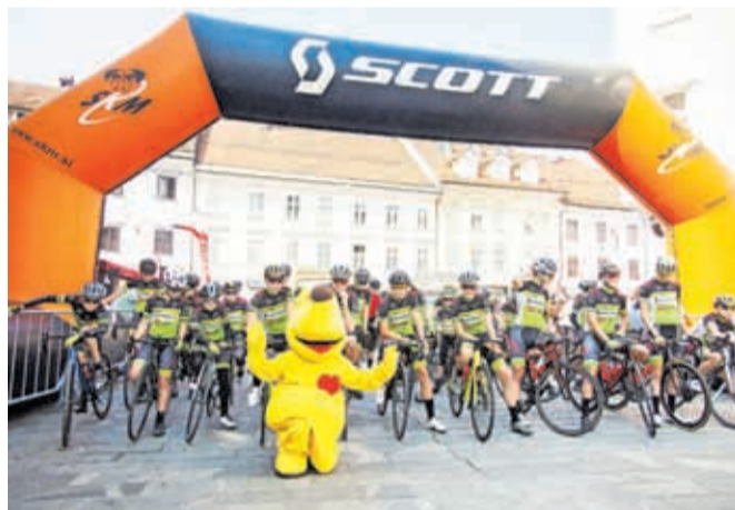
Zadnje majsko nedeljo se v kranjsko mestno jedro vrača Scottov kolesarski dan.

Zadnje majsko nedeljo, 28. maja, se v kranjsko mestno jedro vrača Scottov kolesarski dan, ki ga ne sme zamuditi noben ljubitelj kolesarstva. Osrednji dogodek je kolesarski maraton za družine in individualne kolesarje, spremljevalni program pa bo ponujal številne aktivnosti za otroke in odrasle: otroke bosta zabavala Kuža Pazi in škrat Kranček, na voljo bodo družabne igre, odrasli pa bodo lahko testirali kolesa Scott in preizkusili svojo srečo na bogatem srečelovu, kjer je glavna nagrada kolo. Več informacij in prijave najdete na spletni strani Kolesarskega kluba Kranj.