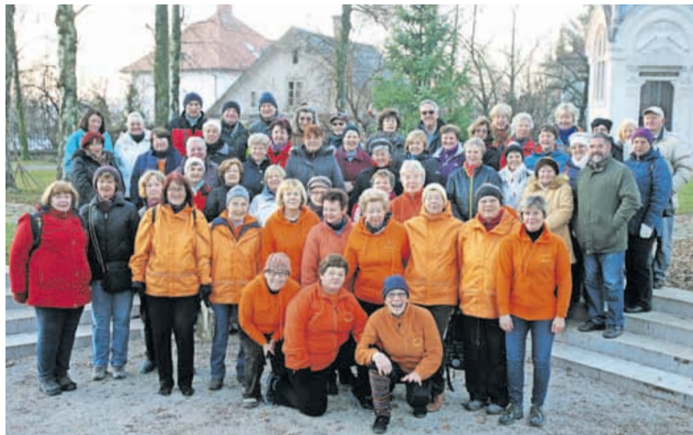
Iz dvanajstih deklet leta 2014 se nas je v devetih letih nabralo že 132 članov društva Šola zdravlja.

greste v službo, v šolo ali po opravkih. In se sprašujete, kaj vendar počnejo te ženske tako zgodaj, čeprav dežuje ali sneži (moških, namreč, je med nami zelo malo). Izvajamo vaje, ki so zelo premišljeno sestavljene od lahkih do težjih in razgibajo vse, od dlani do stopal. Če poslušas svoje telo in so vaje pravilno izvedene v mejah naših sposobnosti, nič ne boli, nobena mišica ni zategnjena, vsi sklepi so na svojem mestu. Sčasoma postane telo gibko,