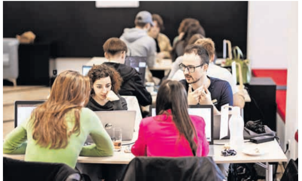
Mladi so imeli za razvijanje svojih idej nekaj več kot 24 ur časa.

»Če bi na primer želel v nedeljo potovati na Bled, bi chatbot iz vseh razpoložljivih virov našel različne mo-