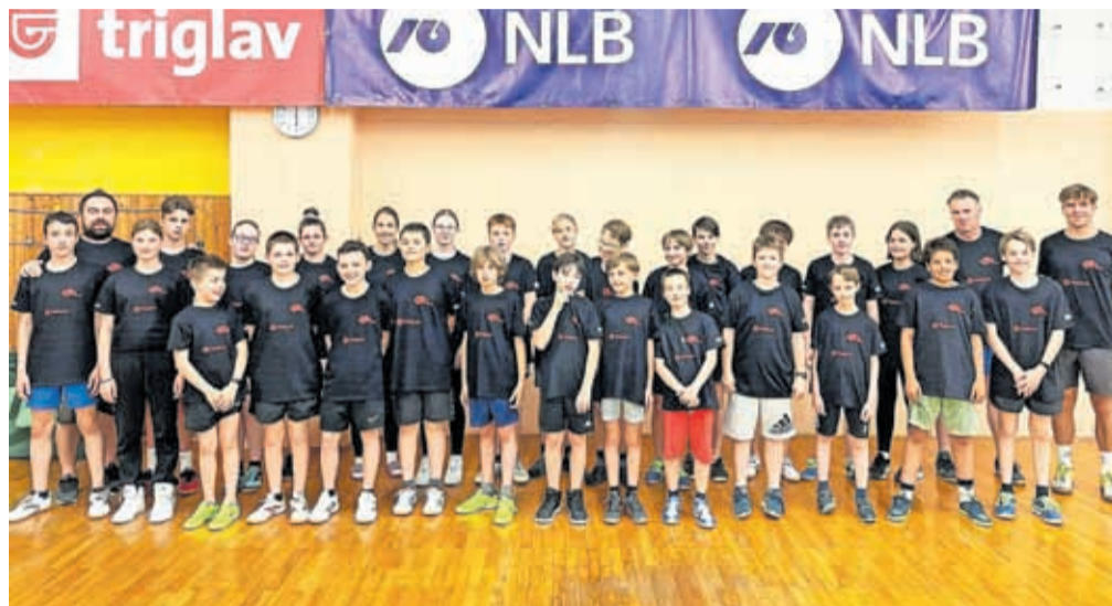
V klubu ne posvečajo pozornosti le tekmovanjem, ampak tudi vzgoji mladih.

»Ob vseh dobrih članskih rezultatih in prebrodenem ob-