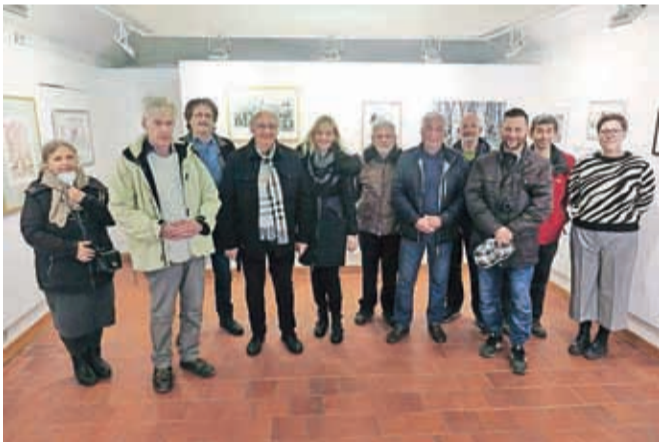
V Likovnem društvu Kranj so pripravili skupinsko razstavo v čast Prešernu.