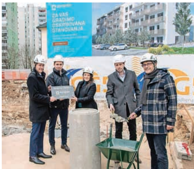
Temeljni kamen so položili sredi meseca.