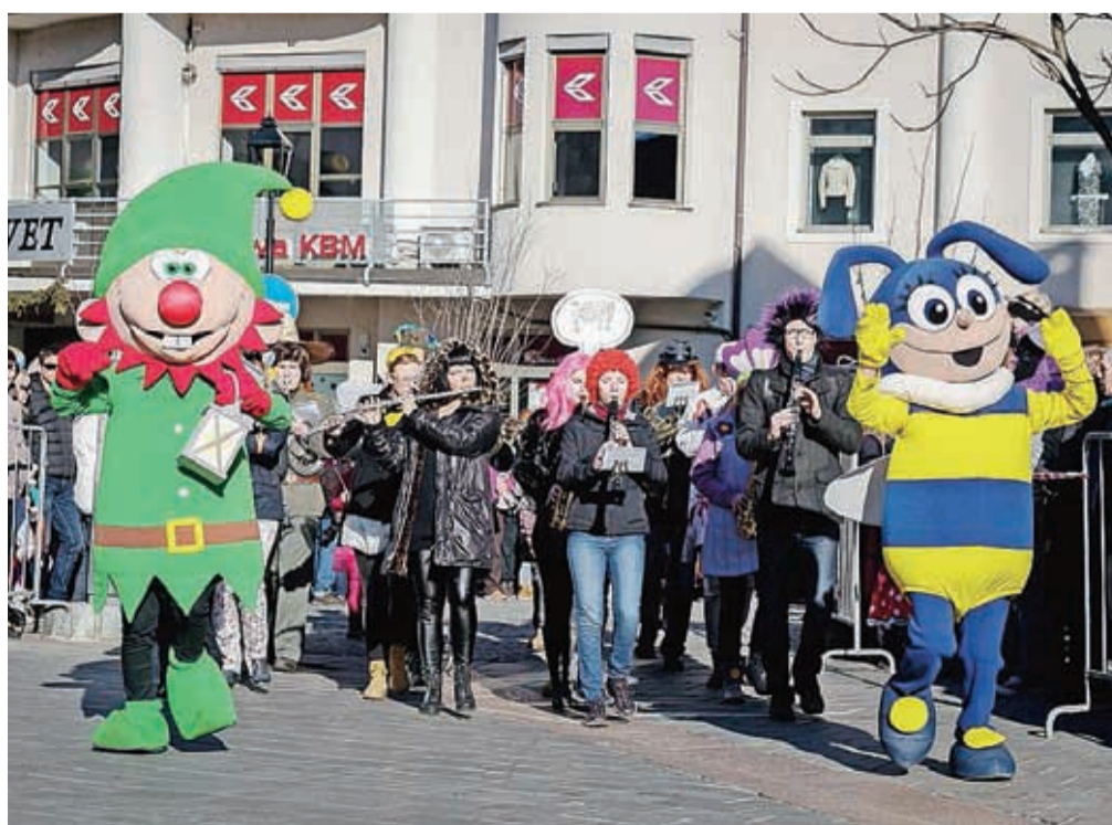
V Kranj se vrača pustni - Krančkov karneval.

Redki so tisti, ki ob omembi pusta ne pomislijo na krofe. Božansko mehke ocvrte dobrote, z mareličnim polnilom in sladkornim posipom, ki