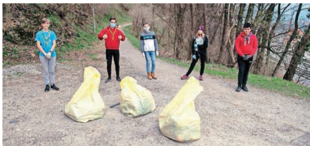
Utrinek z lanske, 20. čistilne akcije Očistimo Kranj 2021

Kranj – V Zvezi tabornikov občine Kranj se v sodelovanju z Mestno občino Kranj (MOK) že pripravljajo na izvedbo 21. čistilne akcije Očistimo Kranj 2022 – Kranj ni več usran. Če bodo epidemiološke razmere omogočale izvedbo čistilne akcije, bo ta za prijavljene kranjske vrtnice in šole v petek, 25. marca, dopoldne, za druge pa v soboto, 26. marca, prav tako v dopoldanskem času. Čiščenje bo potekalo v skladu z navodili Komunale Kranj in štaba Civilne zaščite (CZ) MOK, na akciji pa bodo veljala pravila in ukrepi za zamejevanje širjenja covid-19. Letošnja akcija bo sicer del praznovanja 70-letnice taborništvu v Kranju. Kranjski taborniki skupaj z MOK pozivajo, naj občani sporočijo, če v svoji okolici naletijo na črno točko z odpadki. Lahko jo vnesejo v digitalni zemljevid črnih točk ( www.kranj.si/digitalni-zemljevid-crnih-tock-z-odpadki ), lahko pa čim podrobnejši opis lokacije (ime kraja, opis