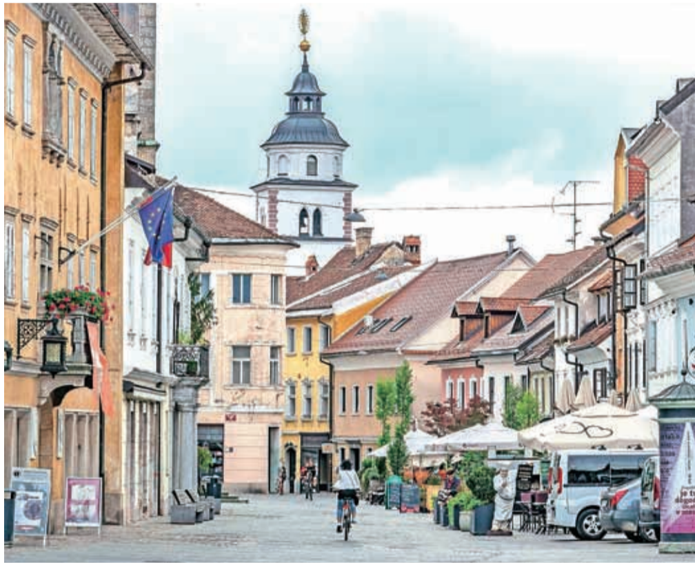
Ko Kranjčani in Kranjčanke odkrivamo lepote našega mesta, smo vsakič znova presenečeni, koliko zgodb se skriva za meščanskimi zidovi.

tekture 20. stoletja Jožeta Plečnika, Edvarda Ravnikarja in Ivana Vurnika, ki so v Kranju pustili svoj pečat. Svoje umetnine so spretno umestili v srednjemeščansko arhitekturo Kranja. Fuzija obeh mestu daje prepoznavni videz, zaradi katerega velja za enega izmed najočarljivejših mestnih jeder v Sloveniji. Skozi bogata pročelja stavb, slikovito mestno obzidje, drobne detalje in najprepoz-