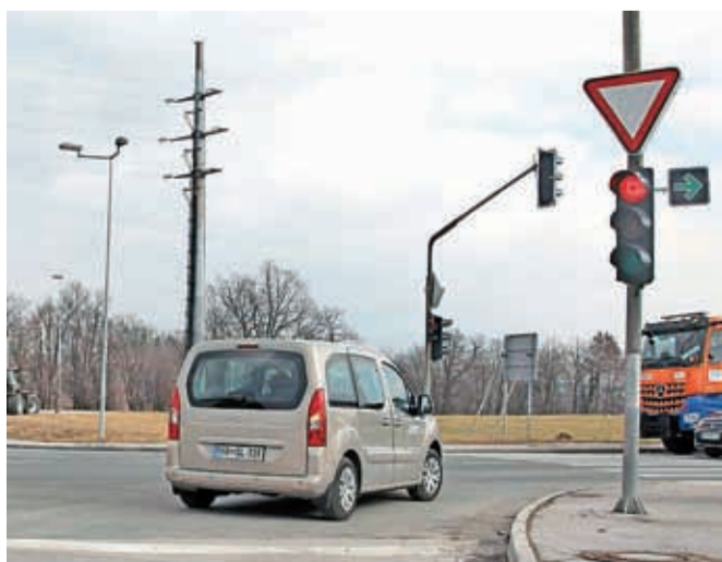
Prometni znak za zavijanje desno ob rdeči luči je novost, na katero se bomo vozniki morali še navaditi.

Kranj – Semaforizirano križišče na regionalni cesti na Laborah je prvo v Kranju in eno prvih v Sloveniji, kamor je Direkcija RS za infrastrukturo (na pobudo Mestne občine Kranj) pred dnevi namestila nov prometni znak, ki iz smeri Stražišča dovoljuje zavijanje desno pri rdeči luči na semaforju ob pogoju, da je glavna smer prosta. Gre za črn znak z zeleno puščico, obrnjeno v desno. Kljub postavljenemu znaku zavijanje desno pri rdeči luči na semaforju ni obvezno, je pa omogočeno. Voznik, ki se za to odloči, se mora pred tem prepričati, da to lahko stori varno, torej da je vozišče, na katero se vključuje, prazno. Če se voznik ne počuti dovolj suverenega ob novem pravilu, je bolje, da počaka zeleno luč.