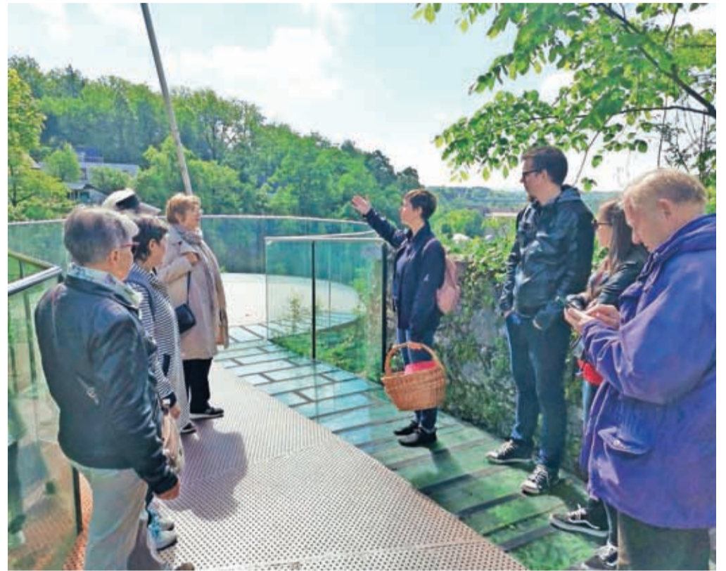
Brezplačne ogledne Kranja pripravljamo vsako prvo soboto v mesecu.

navnejše arhitekturne dosežke boste na sprehodu spoznali zgodovino Kranja od poznosrednjeveškega obdobja pa vse do 20. stoletja.