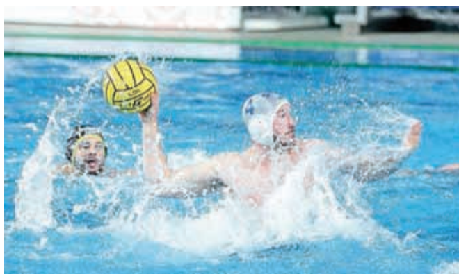
Naši reprezentanci se kljub borbeni igri ni uspelo uvrstiti na evropsko prvenstvo v Splitu.

Kranj – Od četrta do nedelje je Kranj gostil kvalifikacijsko evropsko vaterpolsko prvenstvo, ki bo med 28. avgustom in 10. septembrom v Splitu. Že pred turnirjem so bili favoriti za dve mesti, ki sta pomenili nastop v Splitu, Francozi in Nemci, naši pa so si želeli premagati vsaj nasprotnike iz Belgije in Švice ter nabrati nove izkušnje, saj slovenska vaterpolska reprezentanca do lanske jeseni kar osem let ni igrala mednarodnih tekem. Varovanci selektorja Krištofa Štromajerja so se v četrtek najprej pomerili z reprezentanco Belgije. Tekmo so začeli bolje od gostov, na koncu pa so se zasluženo veselili zanesljive zmage, saj so slavili z rezultatom 15 : 10 (4 : 3, 3 : 1, 5 : 3, 3 : 3).