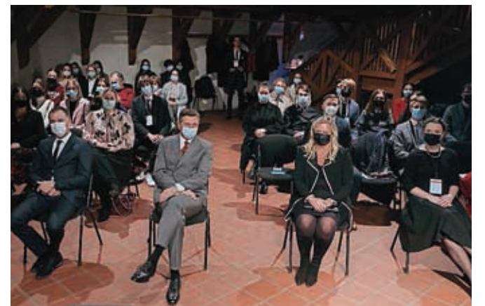
S slovesnega odprtja v Stolpu Škrlovec