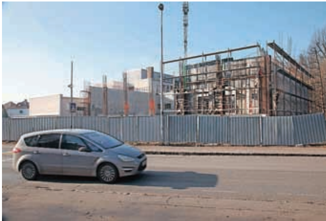
Prizidek k Osnovni šoli Staneta Žagarja bodo dokončali do jeseni.

energetske sanacije občinskih stavb in gradnjo kolesarskih povezav, 1,5 milijona evrov bodo namenili urbani prenovi Kranja. Na območju širitve Poslovne cone Hrastje bodo gradili novo javno infrastrukturo, letošnja dela bodo vredna okoli pet milijonov evrov. Nadaljevali bodo komunalno urejanje Industrijske cone Laze (909 tisoč evrov v dveh letih), komunalno infrastrukturo pa bodo začeli graditi tudi na relacijah Golnik–Mlaka (3,81 milijona evrov v dveh letih) in Goreinja Sava–Rakovica–Zabukovje–Spodnja Besnica in Zgornja Besnica (5,67 milijona evrov v treh letih). Za letos načrtujejo začetek rekonstrukcije Savske ceste z izgradnjo novega mostu