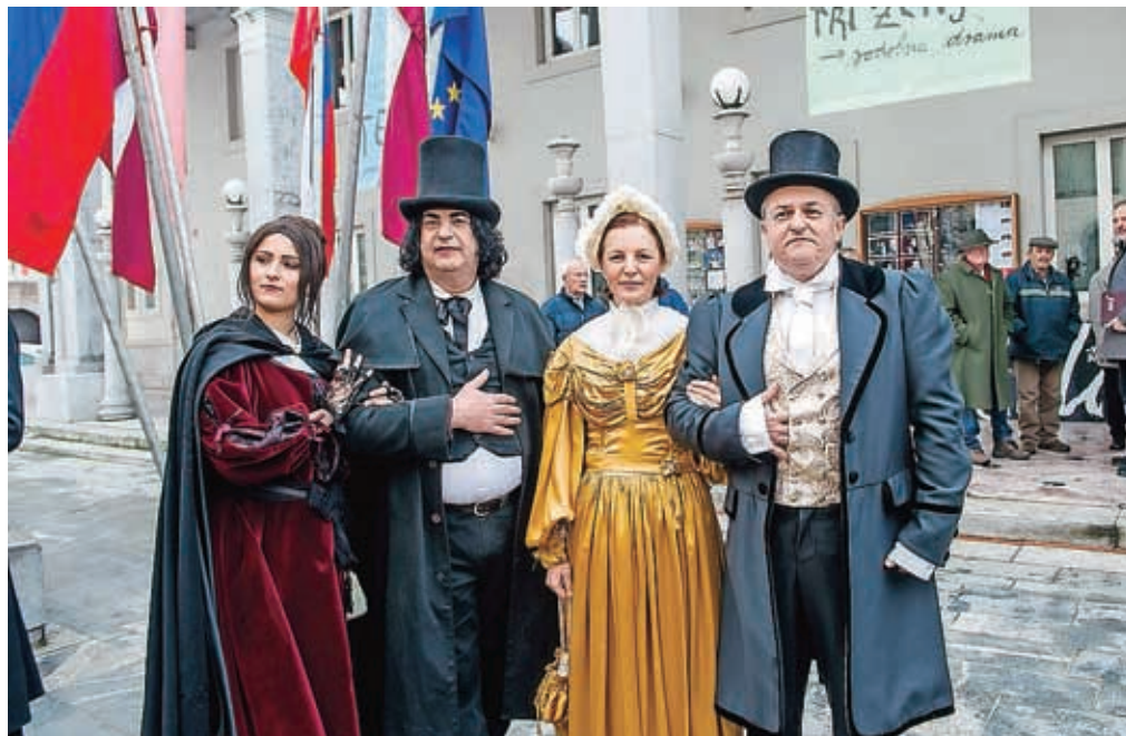
Prešernov smenj

značilno oblikovanimi lučmi. Istočasno sta sodelovala tudi pri postavitvi največjega kipa dr. Franceta Prešerna, ki stoji ob gledališču. Temu pa je sledilo stopnišče na vrhu Vodopivčeve ulice, kjer si je Plečnik zamislil monumentalni vhod v mesto, kar mu je več kot uspelo. Stopnišče, obdano z arkadami in z vodnjakom, vrh katerega se iz bronastega petelina pretaka voda v kamnite, terasasto postavljene posode, navdušuje domače in tuje obiskovalce, ki si stopnišče zelo radi izberejo kot motiv svojih fotografij. Plečnikove stvaritve si lahko ogledate sami, na sproščnem sprehodu skozi mesto, ali pa se o njih pozanimajte bolj poglobljeno in se udeležite Arhitekturnega sprehoda. Na vodenem ogledu boste spoznali vse arhitekta, ki so delovali v Kranju, in njihova dela ter kako so jih spretno umestili v starejšo arhitekturo Kranja. Skozi arhitekturo spoznajte očarljivost mesta, ki pritegne tako ljubitelje arhitekture kot tiste, ki jih zanima, kaj je za vrati meščanskih hiš!