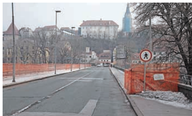
Med načrtovanimi projekti je tudi sanacija Ljubljanskega mostu čez Savo.

Ob tem bo MOK letos prvič izvedla participativni proračun, za katerega občani predlagajo izvedbo projektov z občinskimi sredstvi. Za participativni proračun je namenjeno 624 tisoč evrov letno oziroma 24 tisoč evrov z DDV za vsako krajevno skupnost.