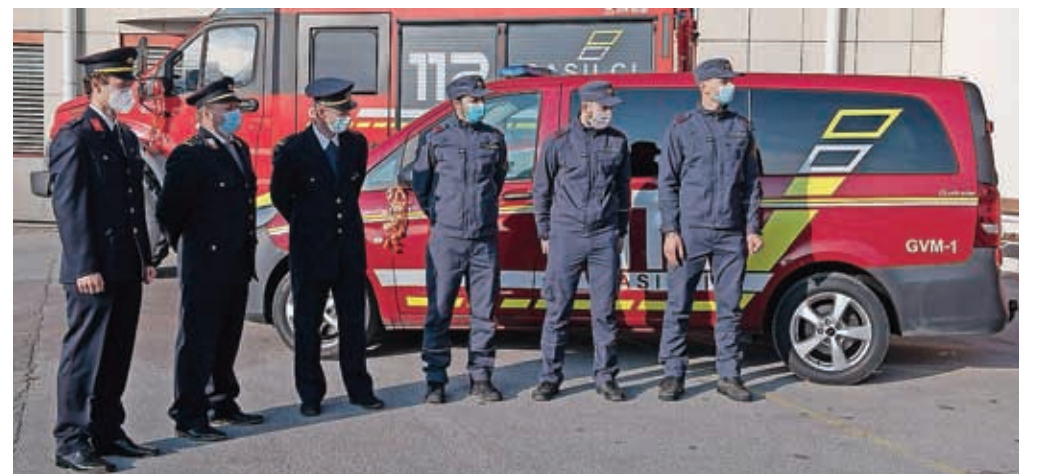
Gasilci PGD Jošt so v uporabo prevzeli operativno vozilo GVV-1 in moštveno vozilo GVM-1.

Operativno vozilo GVV-1 z manjšo količino vode in opremo za vse vrste intervencij v vrednosti 125 tisoč evrov je v celoti financirala Mestna občina Kranj. Izdelalo ga je podjetje Svit-Zolar, in kot je podjetje Svit-Zolar, in kot je pojasnil njihov predstavnik Jani Zolar, je operativno vozilo joštarskih gasilcev tretje tovrstno v Sloveniji in edino na Gorenjskem. "Gre za vozilo, ki je v Sloveniji redko, zato pritegne pozornost, kar so izkusili tudi gasilci z Jošta. Ko so ga peljali na prvo toče-