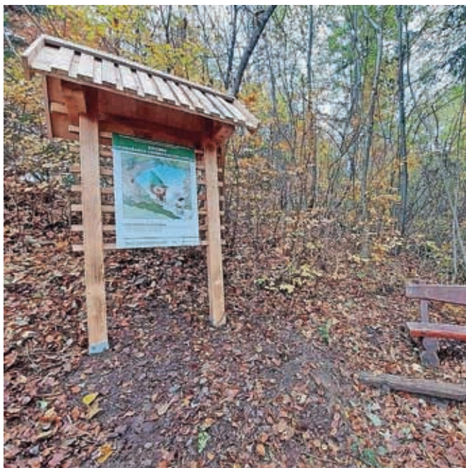
Ob poteh na Jošt od začetka leta stoji vseh šestnajst predvidenih kozolcev s kodeksom obnašanja.