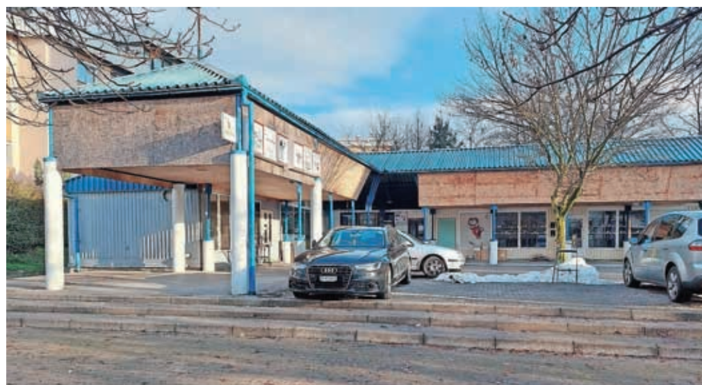
Kioske bodo odstranili in uredili parkirna mesta.

časa poteklo, da so najemniki dejstvo o spremembi sprejeli. "S sedmimi nekdanjimi najemniki je tako že bil dosežen sporazum za odstranitev kioskov, s tremi pa še ne," so razložili. Prva dela se bodo začela v začetku februarja. MOK namerava na zemljišču nekdanje mini tržnice v prvi fazi urediti peščno parkirišče z okoli trideset parkirnimi mesti in pripadajočo urbano krajinsko ureditvijo. S tem želi v kratkem času omiliti pomanjkanje parkirnih mest v najbolj poseljeni soseski v mestu. Za naprej pa bodo iskali trajne in dolgoročne rešitve, ki bodo na tej lokaciji izboljšale kakovost bivanja, ne samo v smislu zagotavljanja parkirnih mest, ampak tudi širše (sociološki, trajnostni vidiki ipd.), so razložili.