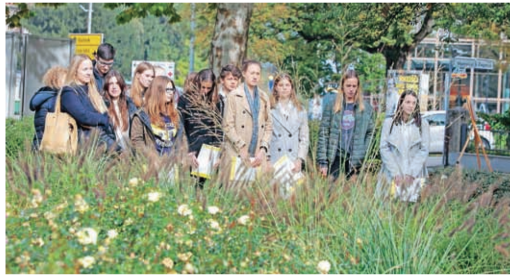
Pesmi Prešerna in Lermontova v slovenščini in ruščini so recitali dijaki in dijakinje Gimnazije Kranj in Gimnazije Franceta Prešerna.