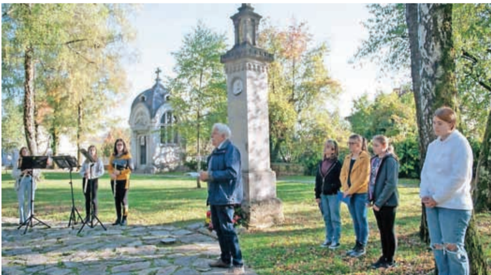
Jenkovi dnevi so se začeli s spominsko slovesnostjo ob pesnikovem grobu.