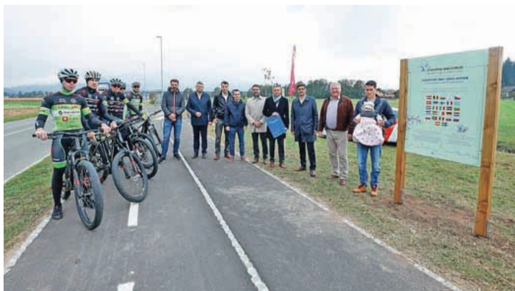
Z ureditvijo Evropskega drevoreda povezovanja in sodelovanja so končali projekt kolesarske povezave Kokrica–Brdo–Predoslje.

Rakovec je obenem pozdravil tudi novo pridobitev na Brdu – samooskrbno električno