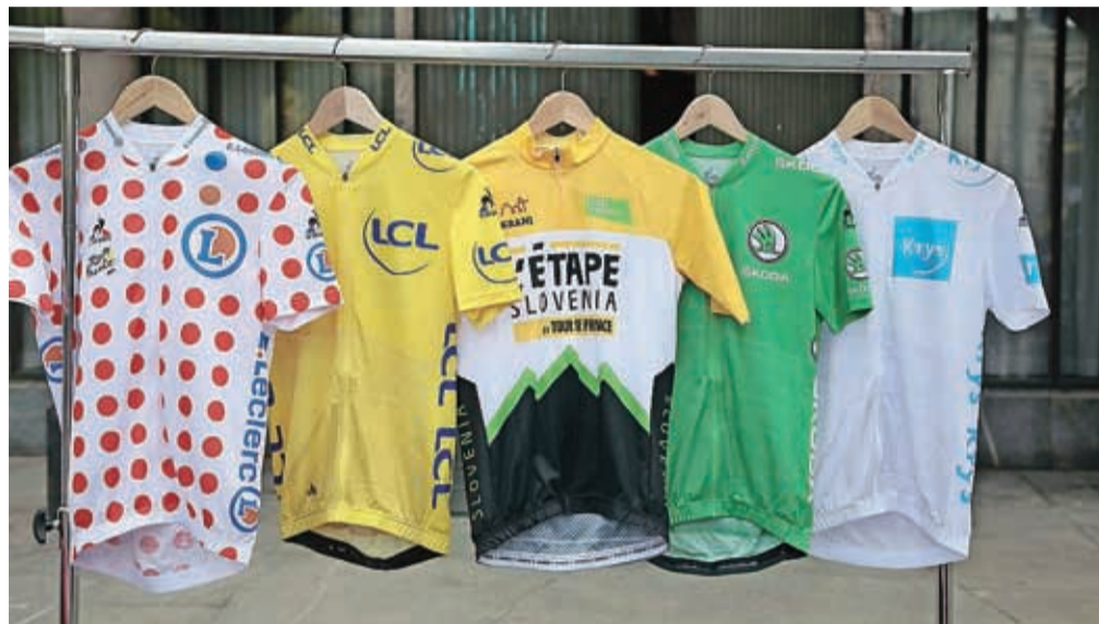
Tudi na dirki L'Étape Slovenia se bodo najboljši rekreativni kolesarji "udarili" za rumeno, zeleno, pikčasto in belo majico.