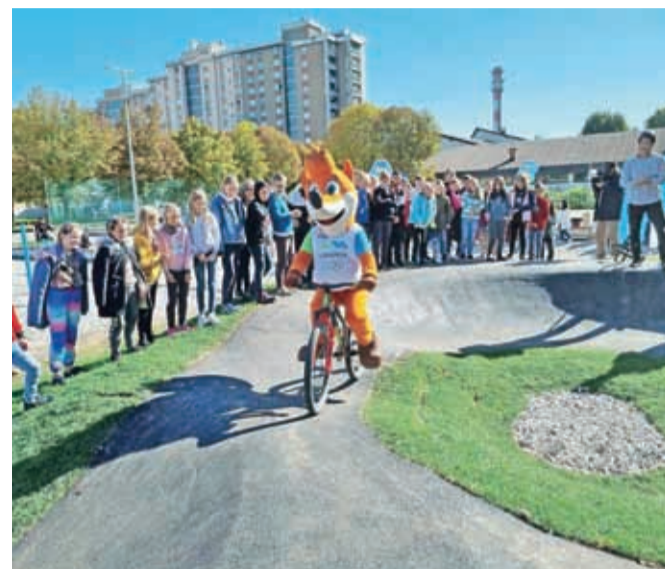
Po grbinastem poligonu se je med prvimi zapeljal tudi Foksi.

"Grbinasti poligoni so danes zelo atraktivna in priljubljena športna igrišča. Namenjena so tako otrokom in mladim kot odraslim, za rekreacijo ali tekmovanje. Hkrati pa ponujajo tudi zelo odprte možnosti za uporabo opre-