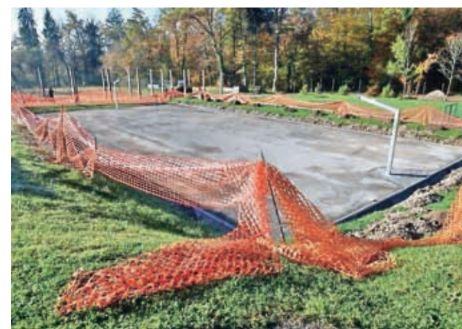
Glede na trenutno stanje v Športnem parku Tivoli prednostno urejajo asfaltna igrišča in balinišče.

lovilno mrežo v dolžini najmanj šestdeset metrov ter ograje v dolžini približno štirideset metrov. Na bali-narski stezi bodo nasuli pesek in utrdili najmanj osem-deset kvadratnih metrov površin, obnovili bodo tudi leseno ograjo. Skupna vrednost investicije znaša 66 tisoč evrov, od tega bo država prispevala nekaj manj kot 23 tisoč evrov, MOK pa okoli 43 tisoč evrov. Dela bodo predvidoma končali v novembru.