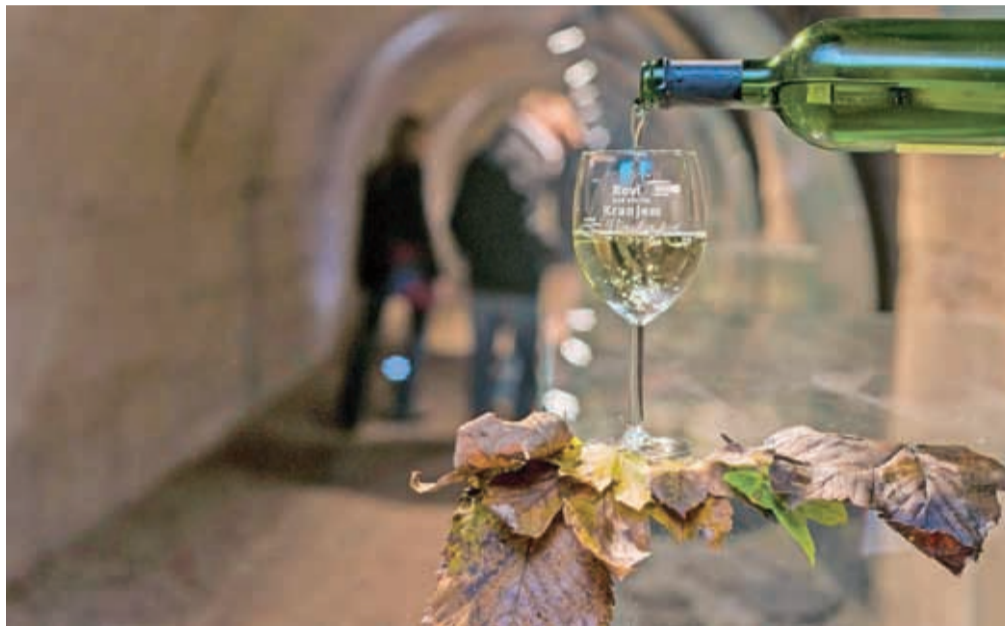
Vinska pot v Rovih pod starim Kranjem bo letos dva novembrska konca tednov gostila vinarje iz vseh vinorodnih področij Slovenije.

Nato novembra nazdravimo Martinu. V dnevih 19. in 20. ter 26. in 27. novembra se rovi spremenijo v največjo vinsko klet na Gorenjskem. V njih se predstavijo vinarji iz vseh slovenskih vinorodnih področij. Ponudbo odličnih vin dopolnjuje širok izbor sirov, krušnih izdelkov in mesnin. Na tem gastronomskem dogodku se je do sedaj predstavilo že več kot 180 različnih vinarjev, vsako leto v tem času rove obišče več kot pet tisoč ljubiteljev vinske kapljice. Ker se letos prilagajamo covid ukrepom in so rovi deležni manjše prenove, se bo vila Vinska pot le v prvem delu rofov, z izhodom na kanjonu Kokre. A zato ponudba ne bo nič manj žlahtna.