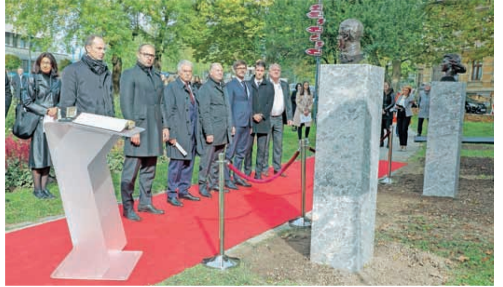
Odkritja doprskih kipov so se ob prvih možeh občine udeležili visoki državni gostje, predstavniki ministrstva za zunanje zadeve, poslovni partnerji in podjetniki.

"Še danes občudujemo neprekosljivo mojstrstvo Lermontova in Prešerna, njuno sposobnost, da bralcem natančno in v visoki poetič-