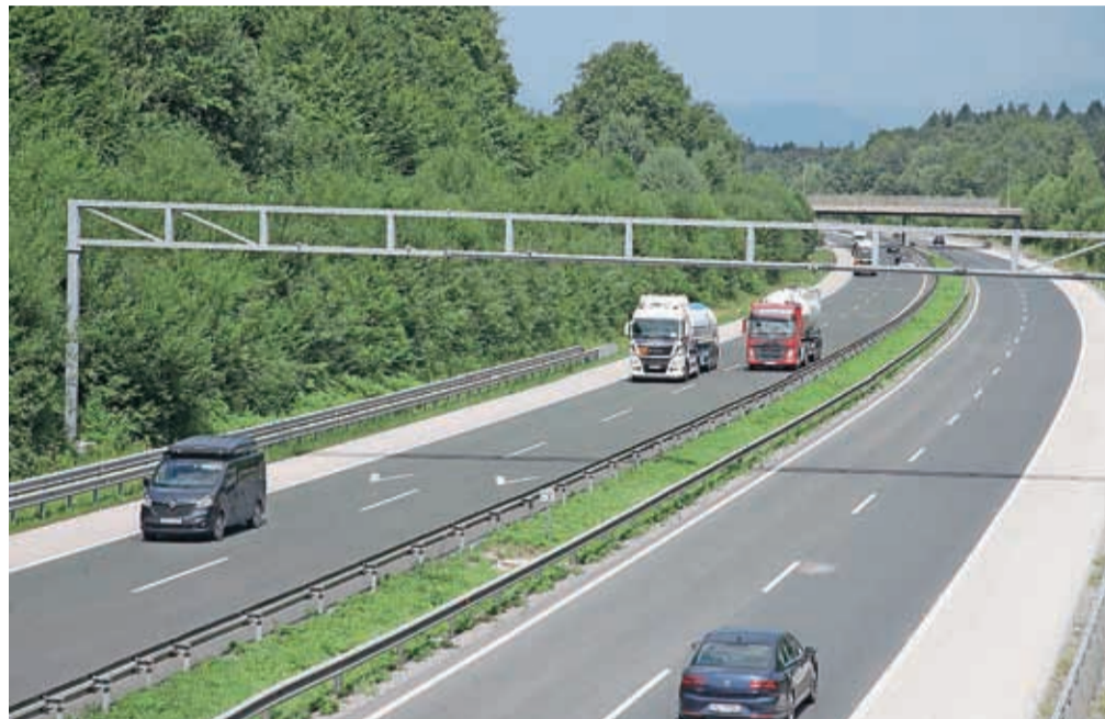
Priključek Kranj sever bi zgradili pri nadvozu avtoceste pri Britofu.

16 odstotkov. V DARS-u zato ocenjujejo, da že sama izgradnja avtocestnega priključka Kranj sever glede na obstoječe stanje prinaša ekonomske in prometnovarnostne koristi. Še večje koristi pa pričakujejo v kombinaciji z drugimi načrtovanimi ukrepi v pristojnosti direkcije za infrastrukturo. Gre za rekonstrukcije državne ceste od krožišča Primskovo do Supernove Qlandie ter ceste med Hipermarktom Kranj Primskovo in krožiščem v Šenčurju v štiripasovnico, gradnjo novega odseka državne ceste na relaciji Britof–Hotemaže in izgradnjo severne obvoznice Kranja. Kot je znano, je bilo za cesto Britof–Hotemaže pred kratkim vendarle izdano gradbeno dovoljenje, ki pa še ni pravomočno. Zaradi navedenih ugotovitev je DARS že pristopil k izdelavi pobude za sprejem sklepa vlade o izvedbi državnega prostorskega načrta (DPN)