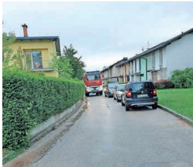
Primer ovirane intervencijske poti

Kranj – V Šorlijevem naselju so kranjski poklicni gasilci v sodelovanju s Civilno zaščito Mestne občine Kranj (CZ MOK) in medobčinskim redarstvom prejšnji teden izvedli požarno vajo, s katero so opozorili na nujnost označitve intervencijskih poti in postavitvenih površin v stanovanjskih naseljih. Kljub napovedani vaji je bil namreč dostop do stanovanjskega bloka na Šorlijevi ulici 33, kjer je po scenariju vaje izbruhnil požar, oviran.