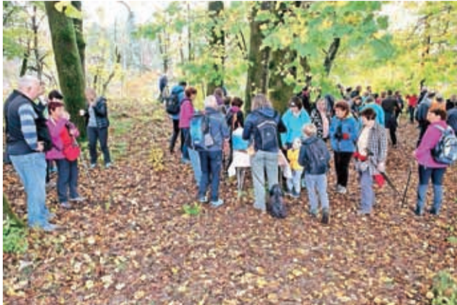
Na Poti Jeprškega učitelja so se pohodniki ustavili tudi v Kalanovem kunciju na Jami.

V soboto dopoldan so v Kulturnem društvu Simon Jen-