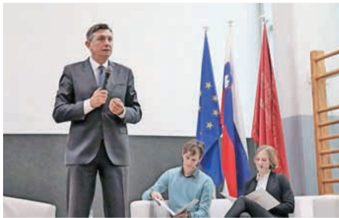
Predsednik RS Borut Pahor se je z dijaki pogovoril o njihovih poteh poklicnega razvoja.