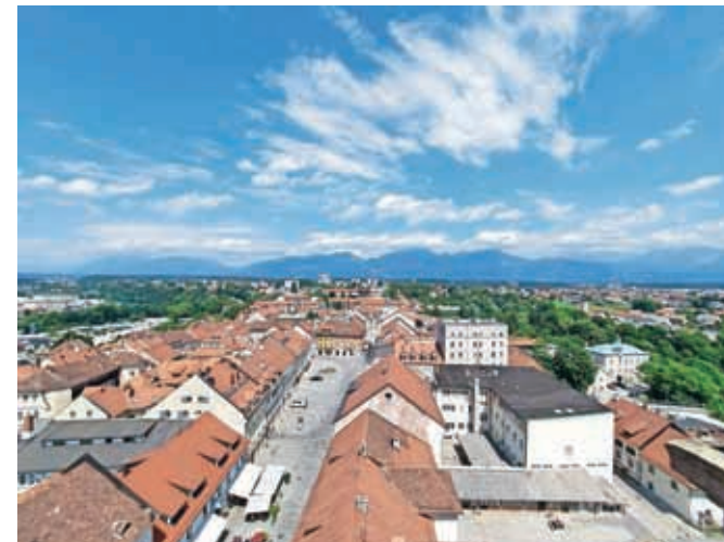
Razgled s kranjskega zvonika

Zvonik bo od 6. septembra dalje mogoče obiskati vsak dan med 9. in 17. uro. Vstopnice bodo na voljo v Turistično-informativnem centru v Kranjski hiši.