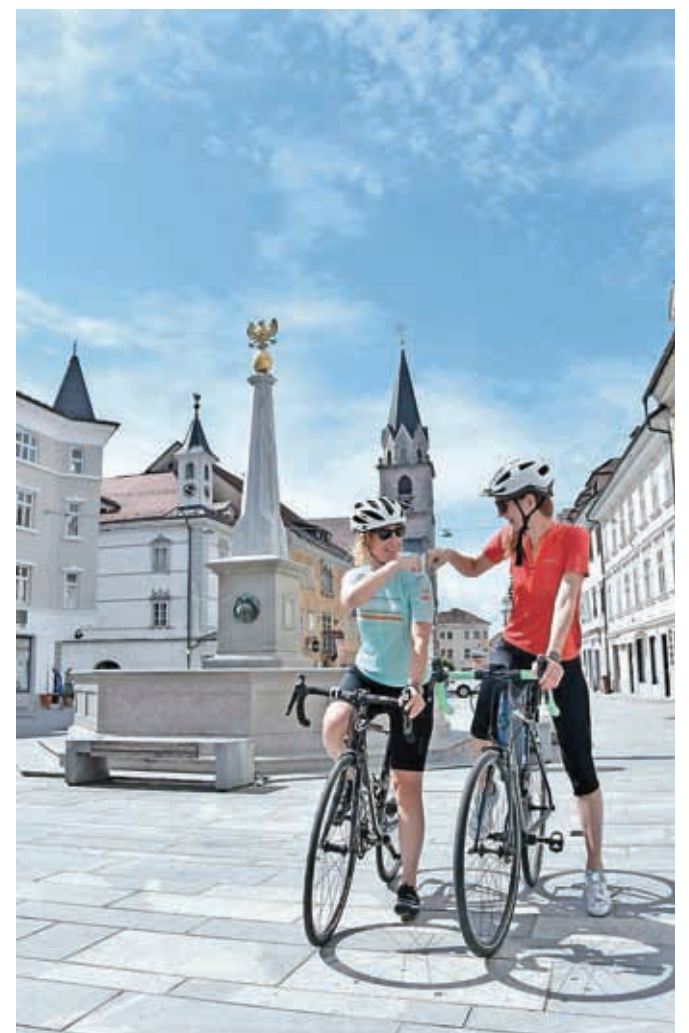
Kranjska kolesarska roža / FOTO: URŠA ERJAVC

te vračali mimo Brezij, Ljubnega, Kovorja, Dupelj in Strahinja. Jezerjanka pa s Posestva Brdo zavije proti Predosljam do Preddvora. Cesta do Jezerškega se vije po ozki dolini. Priporočamo postanek pri Planšarskem jezeru. Iz Jezerškega se nato po isti cesti vrnete nazaj do Tupalič, Hotemaž, Visokega, Šenčurja, Hrastij in nazaj v Kranj. Zemljevid Kranjske kolesarske rože z opisom poti ter kulturnih in naravnih znamenitosti boste že v septembru našli v Turistično-informativnem centru na Glavnem trgu 2 ter na spletnih straneh www.visitkranj.si .