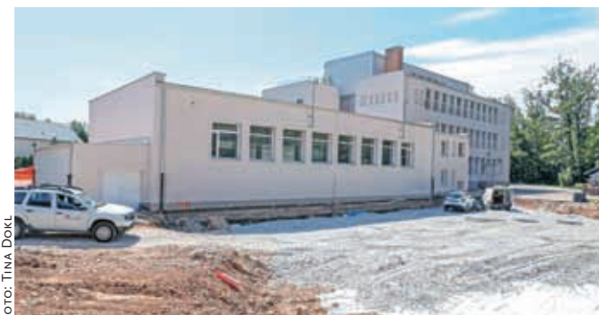
Pri OŠ Staneta Žagarja bo stekla gradnja prizidka.