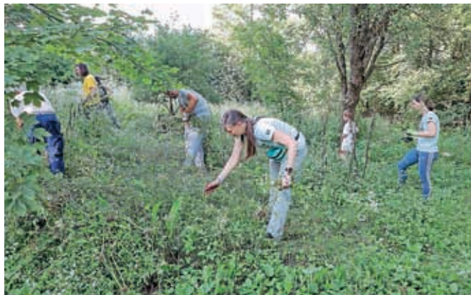
Na Bobovku so odstranjevali tujerodne rastline, ki se vedno bolj širijo v naravo.

sti, a njeni negativni vplivi so veliko večji od koristi, zato je tudi njeno omejevanje nujno. »Obe uničujeta biodiverzitetu in zatirata domorodne rastline, kar povzroča spremembo ekosistema,« je pojasnila Rozmanova in dodala: »Teško ju bo popolnoma izkoreniniti, zato je še toliko bolj pomembno, da ju vsako leto odstranjujemo, s čimer ju krčimo in nadzorujemo njun razrast.« Tujerodni rastlini sta večletnici in