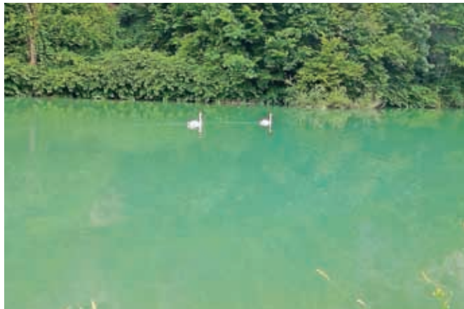
Na mestu iztoka, kjer očiščena voda priteče v Savo, se občasno pojavi sprememba barve vode.

Na mestu iztoka, kjer očiščena voda priteče v Savo, se občasno pojavi sprememba barve vode, kar je posledica svetlobe in rahle rjave obarvanosti. Rahel odtenek rjavkaste barve na iztoku se poveča, kadar je zadrževalni čas odpadne vode na čistilni napravi daljši, to je ob sušnem dotoku (manj kot 8.000 m 3 /dan). Eden od razlogov je tudi dodajanje železovega triklorida v proces čiščenja odpadne vode, ki ima izrazito rjavo barvo (po rji), uporablja pa se za obarjanje viškov fosforja, z namenom doseganja mejne vrednosti.