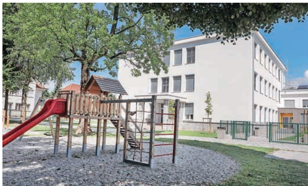
Nekdanja podružnična šola Simona Jenka – Center v novo šolsko leto vstopa kot samostojna Osnovna šola Janeza Puharja Kranj – Center.

2021/2022 je v javne in zasebne vrtnice s koncesijo na območju mestne občine Kranj (MOK) vključenih 2209 otrok, in sicer v 93 oddelkov Kranjskih vrtcev, v 31 vrtčevskih oddelkov pri osnovnih šolah in v sedem oddelkov v koncesijskih vrtcih. Javni in zasebni vrtci s koncesijo so skupno razpisali 596 prostih mest: 388 za I. starostno obdobje, 203 za II. starostno obdobje in pet za razvojni oddelk. Letos so sprejeli 527 novincev (lani 544), na čakalnem seznamu pa je trenutno 135 otrok, od tega 121 otrok iz MOK (28 otrok izpolnjuje pogoj za sprejem s 1. septembrom 2021, 93 otrok pa pogoj med šolskim letom 2021/2022) in 14 čakajočih iz drugih občin. V vrtcih je sicer še 69 prostih mest (19 za otroke I. starostnega obdobja in 50 za otroke II. starostnega obdobja), vendar pa nekateri otroci ostajajo na čakalnem seznamu kljub prostim mestom, saj želijo starši otroka vključiti v točno določen vrtec in nikamor drugam. Število čakajočih se bo v prihodnje zagotovo še spreminjalo.