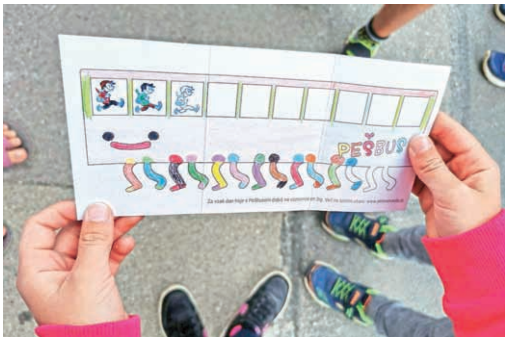
Med aktivnostmi Evropskega tedna mobilnosti v Kranju bo tudi PešBUS.

duševno zdravje, izboljšuje počutje in kakovost spanja. Dogajanje v okviru Evropskega tedna mobilnosti (ETM) se bo v Mestni občini Kranj (MOK) med 16. in 22. septembrom raztezalo od Slovenskega do Glavnega trga in Centra trajnostne mobilnosti (CTM) na Planini. Med aktivnostmi bodo e-mobilnost v Kranju, parkirni dan, PešBUS, kolesarski zajtrk, kolesarsko popoldne ... Zaključek ETM bo pri