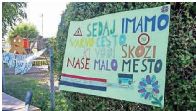
Tudi otroci so se razveselili nove ceste.

komunikacijski vodi so umaknjeni v zemljo, položena je tudi kanalizacijska cev. Zaradi razširitve ceste je bila potrebna prestavitev Jurjeve kapelice, ki je na začetku vasi Praše stala tik ob cesti. Prenos na drugo stran ceste je bil zahteven, s potrebno ojačitvijo temeljev je kapelica tehtala kar 60 ton. Obljubljeno je nadaljevanje rekonstrukcije in krajanje že težko čakajo, da stroji spet zabrnijo. Odkupi potrebnih zemljišč so pri nekaj lastnikih sicer težava, a brez razširitve ceste varnejšega prometa od Mavčič proti Kranju ne bo mogoče zagotoviti.