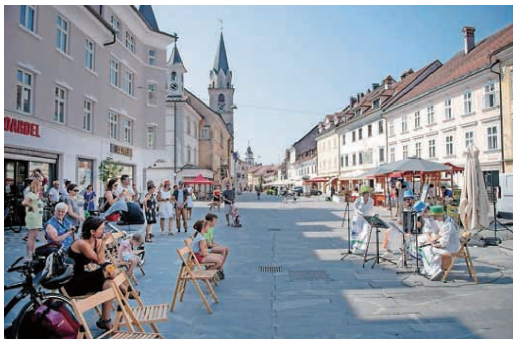
Glasbena skupina Klakradl v starem mestnem jedru je z nastopom pritegnila.

koncert. Lahko rečemo, da se je s svežimi aranžmaji ljudskih napevov iz alpsko-jadranske regije Koroško poletje v Sloveniji ustavilo v Kranju. Jeseni se bosta Kranjčanom predstavili še dve sosedi, Hrvaška in Italija.