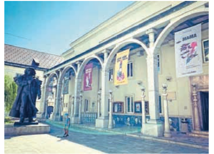
Pročelje Prešernovega gledališča je že v znamenju nove sezone, ki prinaša pet predstav.

Vpisi abonmajev za novo sezono se bodo začeli v ponedeljek in bodo v prvi fazi potekali tja do sredine meseca. Zaradi razmer – najbrž nihče prav natančno ne ve,