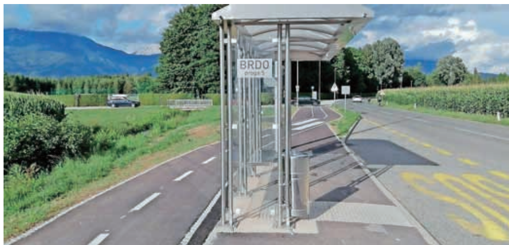
Izgradnjo kolesarske poti sta sofinancirali Evropska unija in Republika Slovenija.

Gradnjo kolesarske poti, ki prispeva tudi k večji urejenosti območja, so končali skoraj sočasno s prevzemom slovenskega predsedovanja Svetu EU, v okviru katerega bo večina dogodkov potekala ravno na Brdu. Predvsem pa gre za pomembno pridobitev za krajanje, saj zagotavlja večjo prometno varnost, z označitvijo kolesarskih pasov na relaciji Vodovodni stolp–Rupa–Kokrica–Predoslje pa je vzpostavljena tudi neprekinjena povezava za kolesarje v dolžini skoraj pet kilometrov, poudarjajo na MOK: "Z operacijo je MOK pridobno opremljenih prostorih – telovadnico bo opremil Elan Inventa, učilnice pa podjetje Lesing – bodo zagotovljeni ustrežni pogoji za izobraževanje, na novem zunanem igrišču, ki bo zdaj na levi strani šole, pa se bodo lahko rekreirali tudi mladi, ki živijo v bližini na Planini.