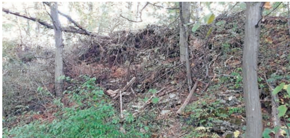
Odvržen zeleni odrez na robu naravne vrednote Gozd Huje

Kranj – Enotna transnacionalna strategija za odgovorno upravljanje in ravnanje s tujerodnimi drevesnimi vrstami bo osnovana na pilotnih primerih dobrih praks in vzpostavitev odprte mreže znanja partnerjev in ključnih deležnikov iz vključenih projektnih regij: Avstrije, Nemčije, Francije, Slovenije in Italije (država opazovalka Švica). V okviru projekta bodo skupaj s projektnimi partnerji razvili transnacionalna priporočila za upravljanje tujerodnih in invazivnih tujerodnih drevesnih vrst, izdelali baze podatkov in modele oz. scenarije podnebnih sprememb, oblikovali priročnik z dobrimi praksami za upravljanje tujerodnih drevesnih vrst in vzpostavili Odprto mrežo znanja ALPTREES Hub z javno bazo podatkov, povezano z Wikialps.eu. Na Gorenjskem, ki je eno od pilotnih območij v Sloveniji, aktivnosti vodi Razvojna agencija Sora ob pomoči strokovnih sodelavcev projekta z Gozdarskega inštituta Slovenije in Zavoda RS za varstvo narave. Območne enote Kranj. V projektu aktivno sodelujejo s pilotnimi občinami Kranj, Škofja Loka, Naklo in Preddvor. Skupaj z njimi so določili pilotna območja v urbanih, periurbanih oz. primestnih in gozdnih območjih. V Mestni občini Kranj so za pilotni območji določili kanjon reke Kokre in Huje v Kranju – gabrovo-hrastov gozd, ki se nahaja v samem