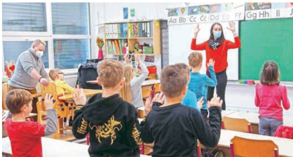
Tudi učenci Osnovne šole Orehek so bili zelo veseli vrnitve v šolo.