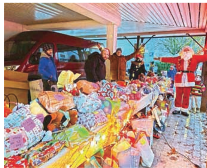
Skrivni Božički so pripravili veliko daril.

Društvo Dekca je v sodelovanju s Krajevno skupnostjo Bratov Smuk v decembru prvič pripravilo množično obdarovanje krajanov Planine 2, na katerem je bilo razdeljenih več kot 250 daril otrokom vseh starosti. »Na poziv, da smo vsi lahko skrivni Božički, je bil odziv neverjeten. Ves teden pred Božičem so prostovoljci društva zbirali in zavijali darila v pisarni krajevne skupnosti. Igrače, oblačila za otroke in odrasle, knjige, družabne igre, otroško opremo, sladkarije in še mnogo drugega so krajanji prinašali od vsepovsod. Prostovoljci so darila smiselno pripravili in zavijali glede na starost in spol. Darila, ki niso bila razdeljena, so se namenila družinam v stiski v okviru dobredelne akcije V Kranju dobro v srcu mis-