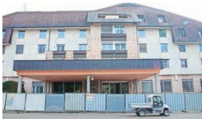
Obnovitvena dela v notranjosti hotela že potekajo.

na Brdu, v občini Kranj in tudi širše,« je dejal. Projekt ostaja skladen z idejnim projektom podjetja Esplanada, ki so ga predstavili sredi lanskega leta, izločili so le nov velneški center, saj bodo obstoječega obnovili. Število sob bodo z obstoječih 78 povečali na 119, na koncu sledi še obnova strehe in fasade hotela. Izvajalec mora sicer poleg gradbenih,