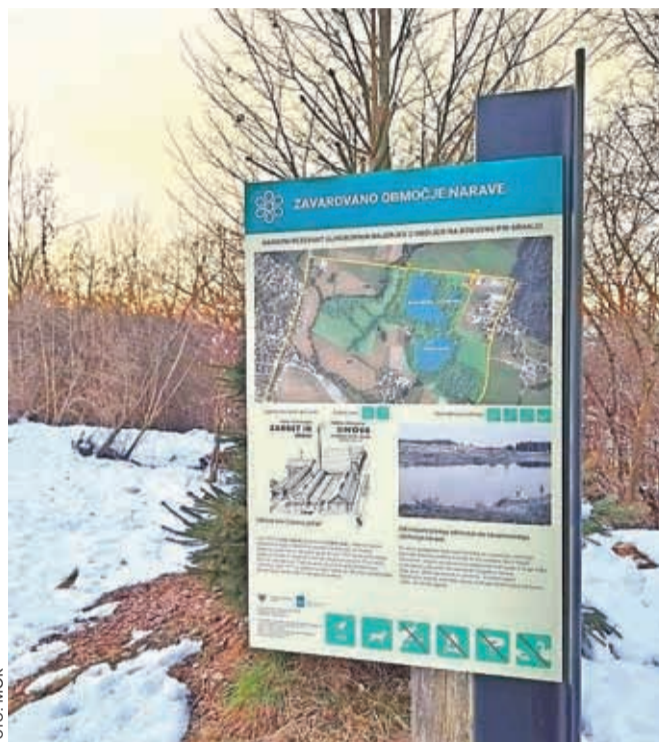
Informacijska tabla pri vstopu v Naravni rezervat Bobovek

Vse to je odslej v privlačni in strnjeni obliki zapisano na informacijskih tablah, ki