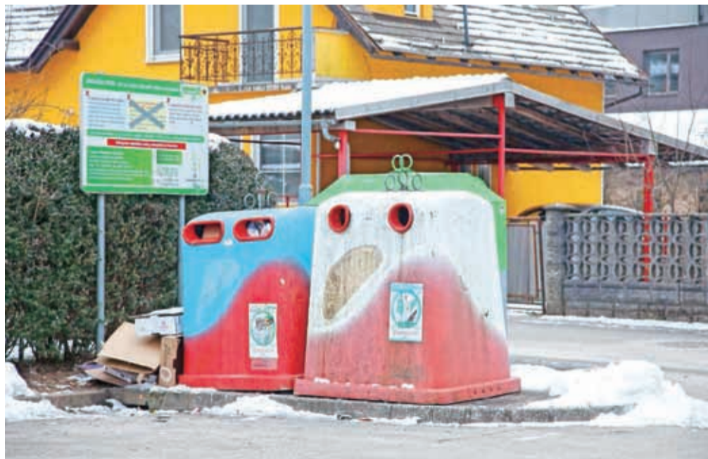
Zabojniki za ločeno zbiranje stekla in papirja ostajajo na ekoloških otokih.

Kranj – Komunalna Kranj je ta mesec ukinita zbiranje mešane komunalne embalaže na ekoloških otokih v Mestni občini Kranj (in tudi v občinah Naklo, Senčur in Preddvor), kar je sprožilo številna vprašanja in polemike med občani. V javnem podjetju zagotavljajo, da zaradi ukrepa običajni gospodinjski uporabniki finančnih posledic ne bodo nosili. Nasprotno: z umikom rumenih zabojnikov z ekoloških otokov so ukiniteli podvajanje sistema zbiranja odpadne embalaže, s katerim je na letni ravni nastalo okoli 90 tisoč evrov dodatnih stroškov. Zaradi prihranka se bodo tako za nekaj časa, najmanj do konca leta, lahko izognili povišanju cen storitve ravnanja z odpadki. Trenutne veljavne cene so namreč še iz leta 2016, medtem ko so se stroški ravnanja z odpadki v tem obdobju zvišali za četrtno, pojašnjujejo. V Komunalni Kranj so razložili, da je delež odložene mešane komunalne embalaže (plastike, pločevink, tetrapa-