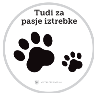
Nalepka s pasjo tačko, ki opozarja, da v koš za smeti sodijo tudi pasji iztrebki.

Kranj – »Vsak teden s podplatov čevljev svojih otrok odstranjujem pasje iztrebke. S palčko, zobotrebcom, valjam jih po pesku, lužah, nazadnje podplat čez noč namočim celo v kis, da se čevljev dokončno znebi tega neprijetnega vonja. Iztrebki so povsod – na zelenicah, v gozdu, po sprehajalnih poteh. Imeti psa resda pomeni popestritev, vendar pa nalaga tudi odgovornost. Ena od teh je pospraviti iztrebke za svojim hišnim ljubljencem, a te naloge očitno mnogi ne opravijo,« je opozorila občanka. V prihodnjih dneh bodo koše za mešane odpadke na območju Mestne občine Kranj (MOK) opremili z nalepkami s pasjo tačko. S tem bi radi spodbudili lastnike psov, naj vrečke z iztrebki