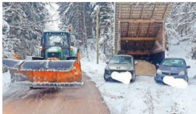
Nepravilno parkirana avtomobila pred skladiščem peska za posipanje cest na območju KS Jošt

V času zaprtja občinskih mej (razen za namene rekreacije) so najbolj priljubljene izletniške točke v Mestni občini Kranj še veliko bolj obiskane kot sicer, zato tam pogosto zmanjka prostora za parkiranje. Ta problem se ob obilnejšem sneženju, kakršnemu smo to zimo že bili priča, samo še poveča. Žal v takih primerih nekateri premalo razmislijo, kje lahko pustijo svojega jeklenega konjička. Z nepravilno parkiranimi avtomobili ovirajo promet na cestah, pogosto onemogočijo dostop s kmetijsko mehanizacijo do poljskih in gozdnih poti ... V prvi polovici januarja je prišlo celo do neljubega zapleta na območju krajevne skupnosti Jošt, ko so lokalnemu izvajalcu zimske službe z avtomobili onemogočili dostop do skladišča peska za posipanje vozišč.