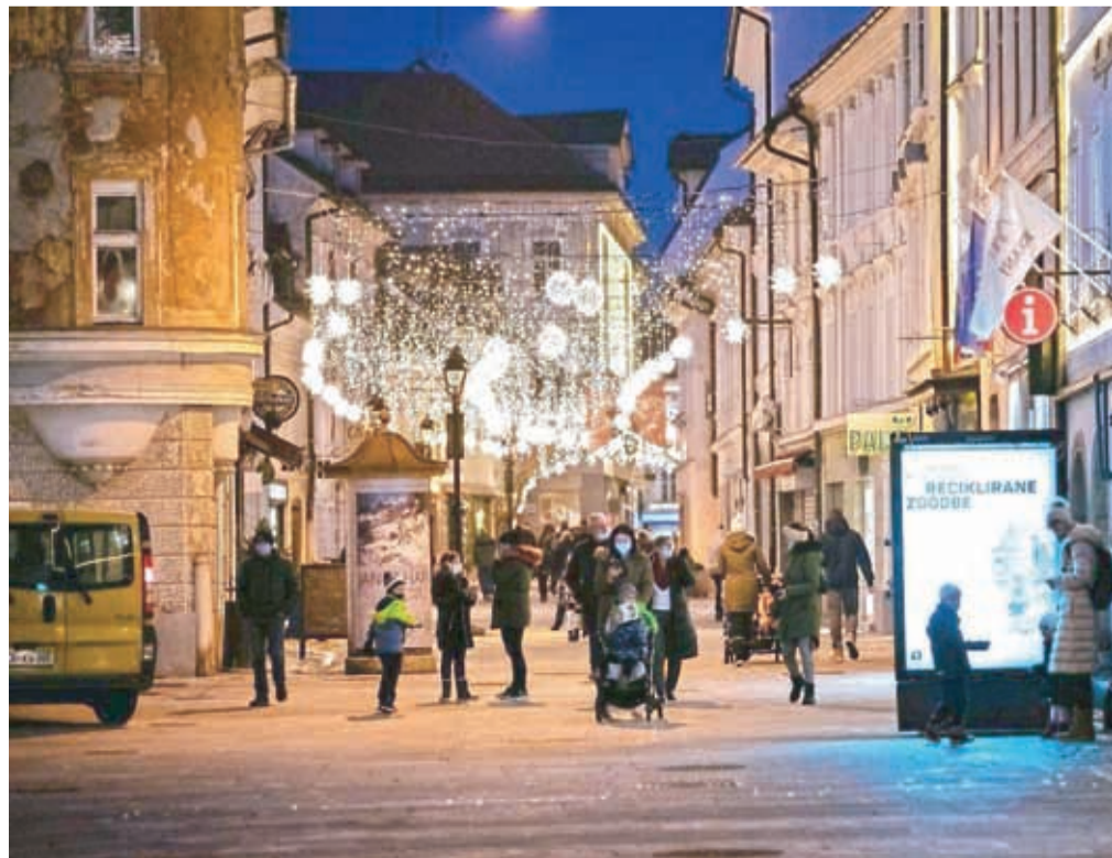
Na občini so se odločili, da mestno jedro ostane okrašeno do 8. februarja.

stalih mesecih leta. Dobro voljo lahko širimo že z majhno gesto – pomahajte v pozdrav mimoidočim, ki jih srečate v mestu. Okrašeno mestno jedro in s tem tudi njegovo pozitivno sporočilo delite na družbenih omrežjih in se potegujte za lepo nagrado! Vse, kar morate storiti, je, da objavljeni fotografiji dodate #KRpozdrav in #visitkranj,« so zapisali na spletni strani VisitKranj.si. Nagradna igra poteka do 8. februarja.