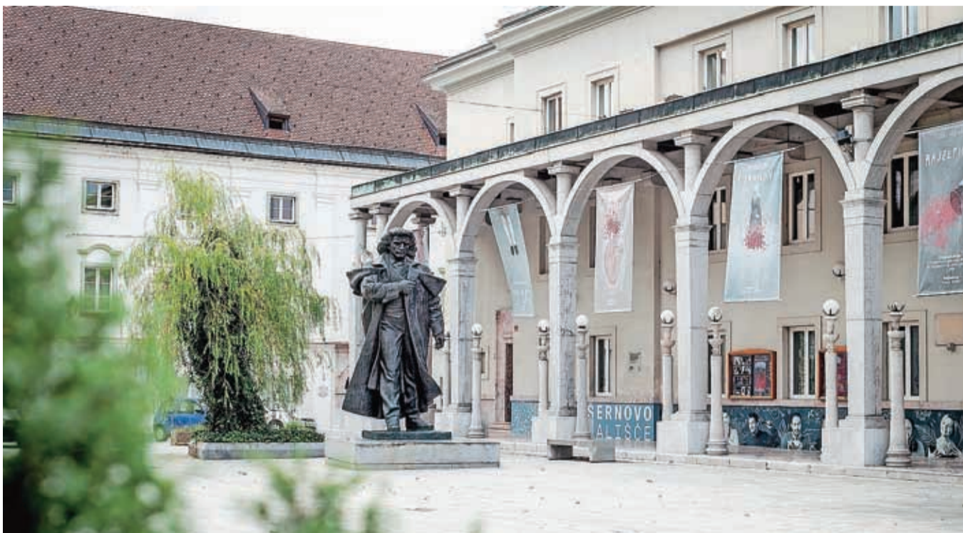
Spomenik Franceta Prešerna pri gledališču velja za največji pesnikov kip.

Na Glavnem trgu, v Pavšlarjevi hiši, najdete Galerijo Prešernovih nagrajencev. Stavba izstopa s svojim pročeljem, v njeni notranjosti pa so razstavljena dela prejemnikov najvišjih nagrad za likovno umetnost v Sloveniji. Galerija tako obiskoval-