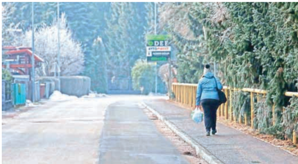
Novi pločnik na Jelenčevi ulici je zelo izboljšal varnost pešcev.

poleg gradnje pločnika zajemal tudi zamenjavo starega in izrabljenega vodovoda, pa so zaključili tik pred novim letom. Spomladi je v načrtih še zaris prav tako dolgo pričakovane prehode za pešce in kolesarskih pasov na Jelenčevi ulici vse do križišča proti osnovni šoli.