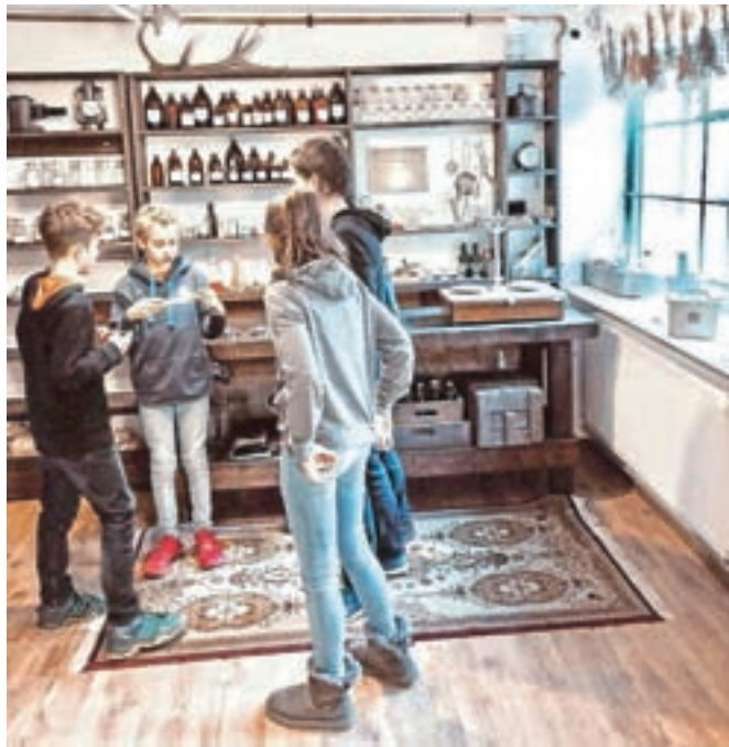
Puharjev skrivni laboratorij vedno navduši obiskovalce.

Doživetji sta namenjeni otrokom od desetega leta naprej, družinam in tudi starejšim, željnim kakovostne popestritve prostega časa in spoznavanja zgodovinskih biserov našega mesta.