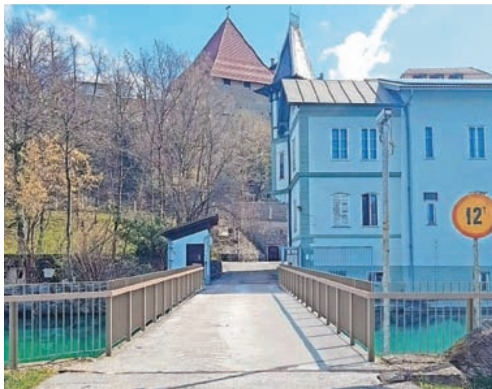
V novembru se bo v Majdičevem logu odprl prvi del nove poti.