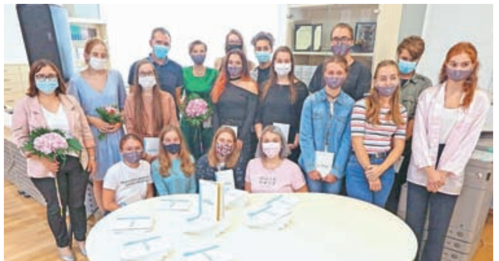
Gimnazija Kranj kar kipi od literarne ustvarjalnosti.