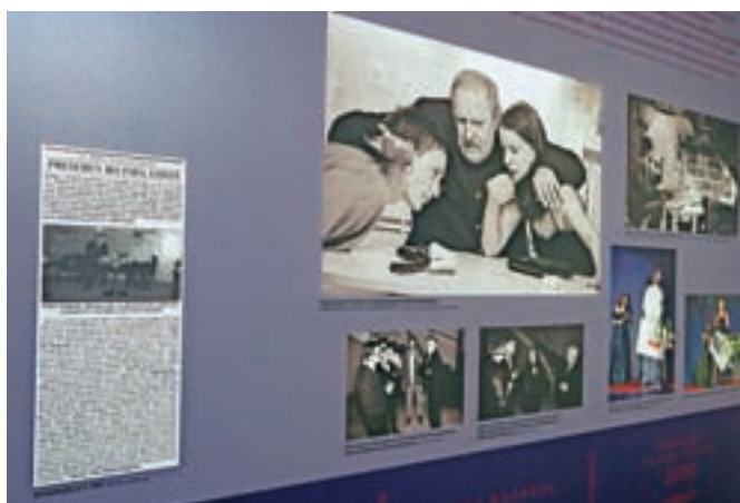
Na razstavi. Tudi Gorenjski glas vseh petdeset let redno spremlja Teden slovenske drame.