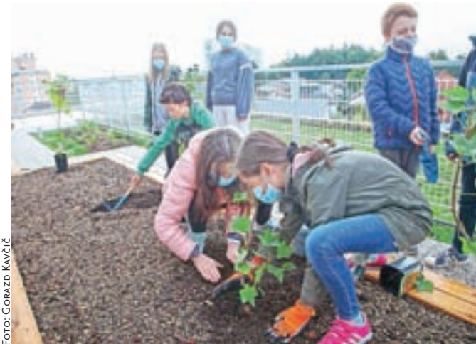
Sedmošolci so že prevzeli skrb za zeleno streho.