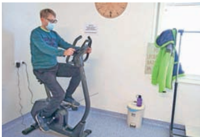
V Centru Korak so pred kratkim dobili novo sobno kolo, ki jim bo prek zime prišlo še kako prav. Trenutno namreč programi potekajo na daljavo.

»Neurotrust se je pridružil projektu Kolesarske zveze Slovenije Kolesarimo.Skupaj. Želimo opozoriti zlasti na tiste skupine, ki jim je kolesarjenje oteženo. To so tako tisti, ki so se rodili z nedozorelimi možgani, kot tisti, ki jim zaradi starosti popuščajajo miselne funkcije, pa tudi vsi tisti, ki so utrpeli nevrološko poškodbo ali bo-