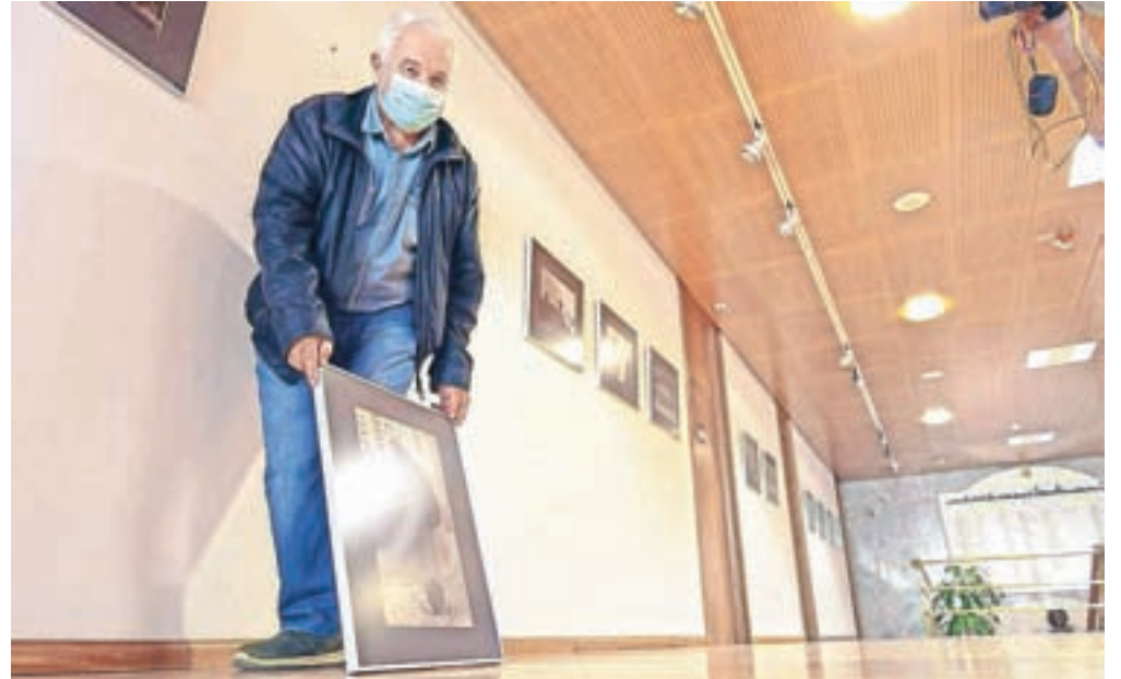
Tako, razstava je postavljena. Na ogled je do konca novembra.

Ker je letošnje leto zaradi pandemije v mnogih pogledih res posebno, so "puharjevci" del svoje društvene dejavnosti posvetili tudi aktualnim razmeram. Lahko bi rekli, da jim je virus odnesel tudi kakšno razstavo, mogoče tudi večjo odmev-