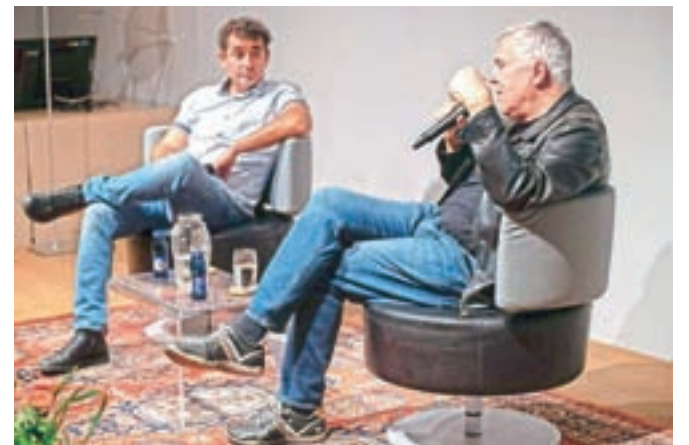
Kantavtor, pevec, šansonjer in pisatelj Zoran Predin je v Mestni knjižnici Kranj predstavil roman Mongolske pege.