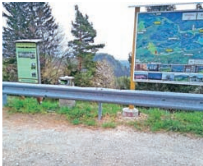
Odgovorno ravnanje z odpadki in spoštovanje do okolja ter bonton v gorah nam narekujejo, da odpadke, še zlasti če ni košev ali so ti polni, odnesemo s seboj in jih odložimo v zabojnike za ločeno zbiranje odpadkov.

Doma odpadno jedilno olje vlijemo v plastenke ali v steklenice oziroma v katerokoli drugo primerno embalažo. To začasno hranimo v kleti, garaži, in ko se nabere več odpadnega jedilnega olja, ga odpeljemo v zbirni center za ločeno zbiranje odpadkov, kjer ga lahko brezplačno oddamo. Odpadno jedilno olje je prepovedano odlagati v zabojnike za mešane odpadke in zabojnike za