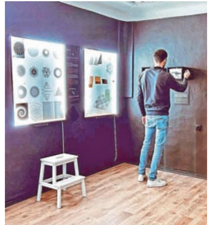
V Kabinetu Janeza Puharja je tudi muzejska soba.

Obiskovalci se lahko odločite tudi za eno izmed dveh doživljajskih iger, ki vas ne bosta pustili ravnodušnih. Ena je Puharjev skrivni laboratorij, nekakšna soba pobege, ki vas skozi uganke in šifre odpelje v Puharjevo skrivnost – odkrivanja barvne fotografije. Druga pa je Lov za izgubljeno fotografijo, nepozabno kulturno doživetje, na katerem odkrivajte skrite kotičke našega mesta in njegove kulturne dediščine.