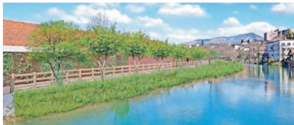
Obiskovalci bodo lahko spoznali številne zanimivosti o življenju ob reki Savi in njenih poteh.

sebni in javni bazen, paviljon, sprehajalna pot, hlev, pet zaklonišč, mlin ter hidroelektrarna. Z vzpostavitvijo nove poti v Majdičevem logu Kranj ne pridobiva le najkrajše povezave središča mesta z nakupovalnim centrom, ampak ponovno postopno pridobiva zeleno po-