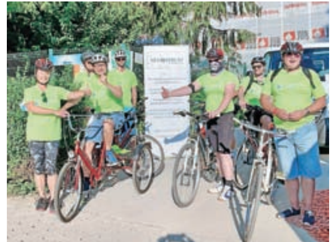
Uporabniki in zaposleni v Centru Korak so se septembra pridružili akciji Kolesarimo skupaj.

lezen možganov, hrbtenjače oziroma kakega drugega dela živčnega sistema. Odločili smo se, da zanje pripravimo kolesarjenje, k sodelovanju smo povabili tudi Center Korak v Kranju in septembra smo z uporabniki in zaposlenimi izvedli ko-