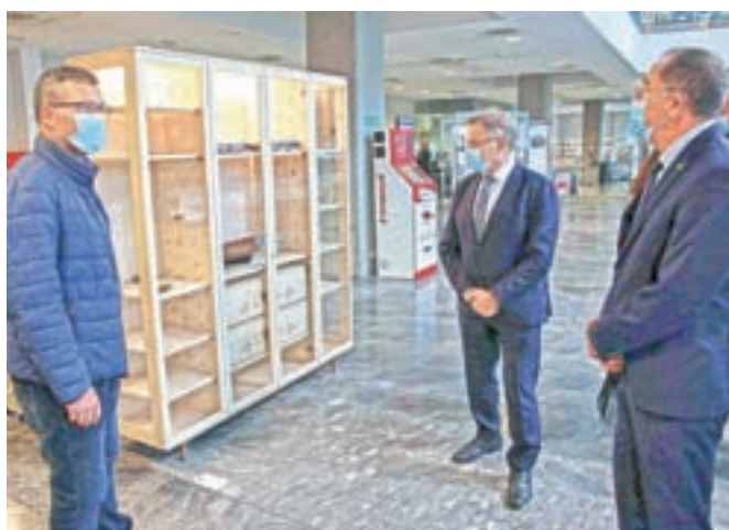
Ob zaključku projekta so v kranjski knjižnici odprli tudi razstavo inovativnih izdelkov iz lokalnega lesa, ki so si jo med prvimi ogledali sodelujoči na okrogli mizi.