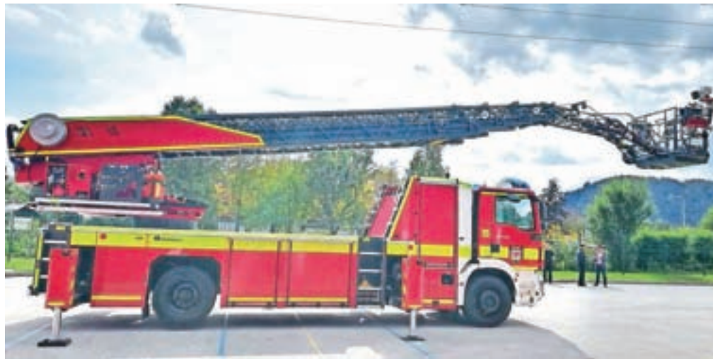
Gasilsko reševalna služba Kranj je od tega meseca bogatejša za novo avtolestev.

Stara avtolestev pri Gasilsko reševalni službi Kranj (GARS) je bila namreč dotrajana in ni več služila svojemu namenu. Kranjskim gasilcem je pri nabavi nove avtolestev finančno priskočilo na pomoč sedem občin, poleg Mestne občine Kranj, ustanoviteljice GARS, še občine Jezersko, Naklo, Preddvor, Šenčur, Škofja Loka in Tržič. Pomemben delež je Upravi Republike Slovenije za zaščito in reševanje prispevalo tudi Mini-