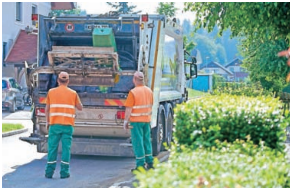
S pravilnim ravnanjem lahko dodatno pripomoremo k zaščiti in zdravju smetarskih ekip, ki dnevno odvažajo odpadke.

Nujno je dosledno ločevanje odpadkov ter zmanjševanje prostornine odpadne embalaže. V primeru, da se v gospodinjstvih nabere večja količina odpadkov, jih ne odlagamo ob zabojnike, ob ekološke otoke, pred zbirne centre ali celo v naravo. Kupimo le najnujnejše oziroma živila z daljšim rokom trajanja. Zelenjavo in sadje kupujemo v manjših količinah, saj ta gnije, kar se odraža v polnih zabojnikih. V primeru negotovosti, kam z odpadki, lahko pokličete ali pišete na Komunalo Kranj, kjer vam bodo svetovali, kako ravnati z odpadki. Več informacij je na sple-