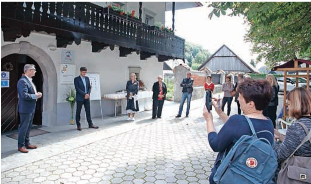
Reintegracijski center v Domu Vincenca Drakslerja v Pristavi pri Trziču deluje že deset let.