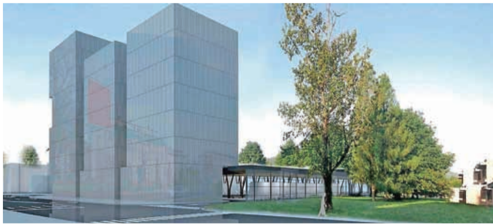
Prikaz idejne zasnove projekta Severna vrata