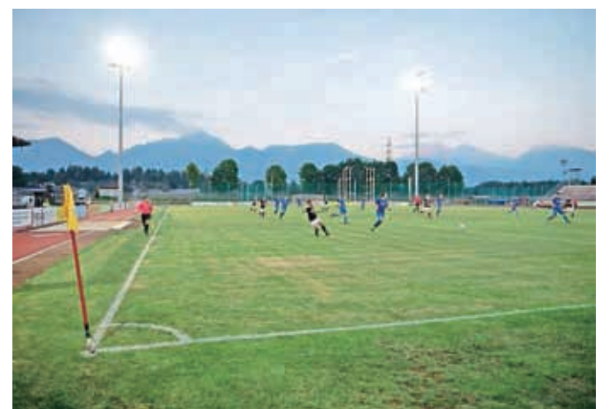
Kranjski nogometaši so ta mesec že lahko igrali pod reflektorji.

Minulo sredo smo prvič praznovali dan slovenskega športa. Tudi v kranjski občini je bilo veliko vzrokov za praznično vzdušje, saj so športniki v minulem letu dosegali odlične rezultate, v tem letu pa so dobili dve pomembni pridobitvi. Na stadionu v Športnem centru Kranj so postavili reflektorje z naj sodobnejšo razsvetlavo, objekt pa je bogatejši še za tartansko stezo, ki se ponaša s certifikatom svetovne atletske zveze. Novi pridobitvi naj bi predstavili prav na praznični dan, vendar so se organizatorji odločili, da zaradi pandemije covid-19 in z njo povezanih ukrepov slovesnost preložijo. Prav tako so preložili načrtovano podelitev priznanj športnikom pa tudi načrtovani Forum o strategiji športa.