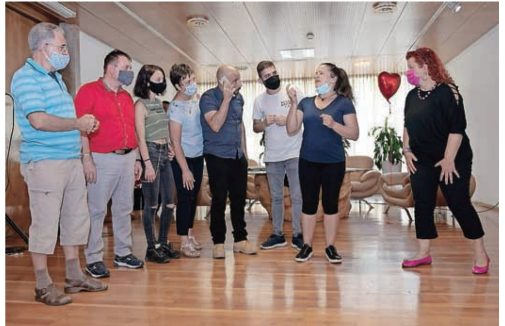
Na prireditvi je nastopila gledališka skupina gluhih in naglušnih.