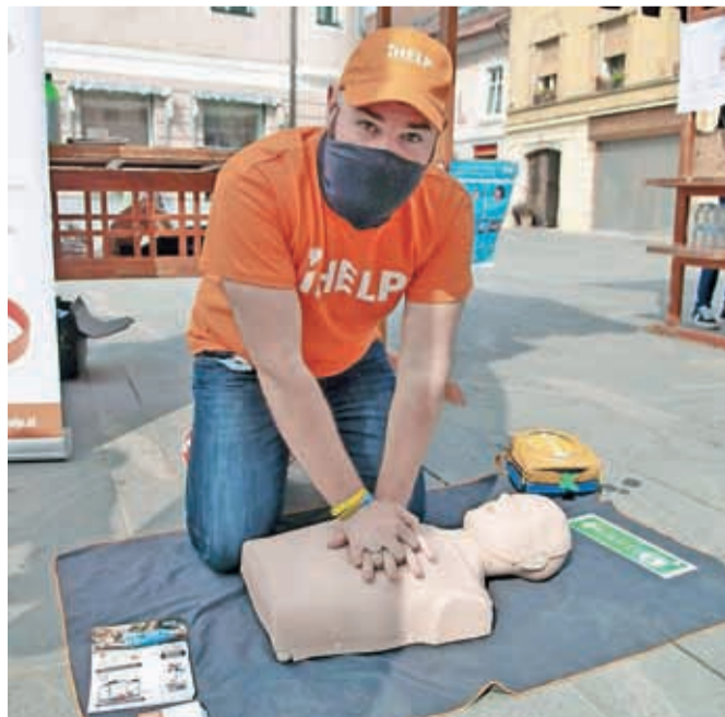
Na iHELP varnostni točki so prikazovali temeljne postopke oživljanja.

"Odziv potrjuje, da so občani srcu prijazne občine odgovorni do svojega zdravja in se želijo ozavestiti, kako najbolj učinkovito pomagati ob nujnih klikih na pomoč," pravijo organizatorji.