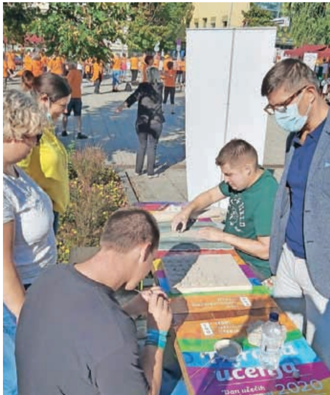
Na stojnicah je bilo tudi letos moč spoznati različno ponudbo.