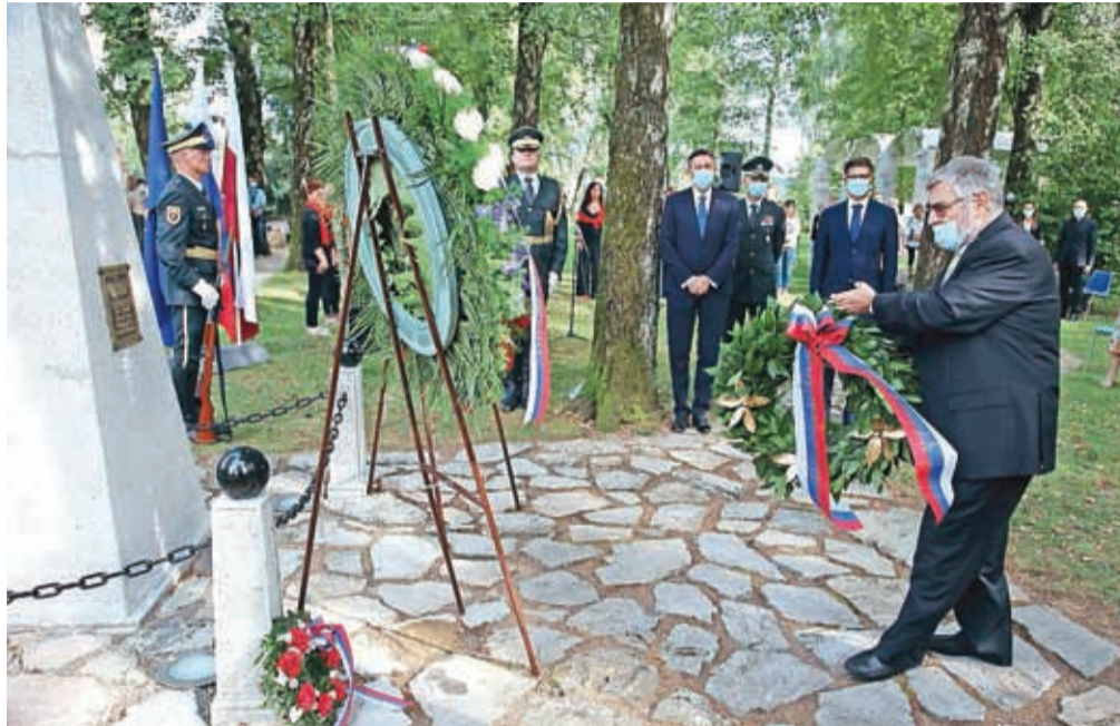
V Prešernovem gaju so se ob devetdeseti obletnici ustrelitve poklonili bazoviškim junakom.

Govornik na slovesnosti je bil tudi odbornik Občine