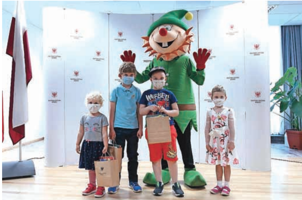
Junake 3. nadstropja je v Kranju pozdravil tudi priljubljeni škrat Kranček.

Ob tej priložnosti so mali junaki Lili, Kati, Luka in Samo županu pripeli zlato pentljico, simbol boja proti otroškemu raku. »Naloga zlate pentljice je, da pokaže Sloveniji, koliko je teh otrok. Žal bolezen ne izbira ne starosti ne spola ne mesta ne