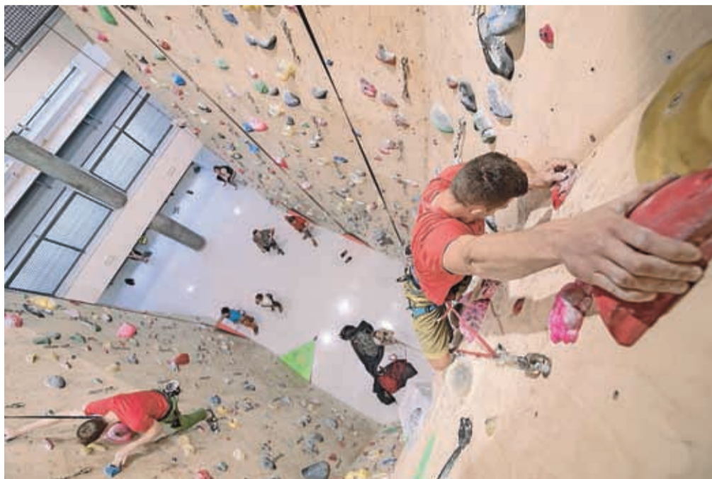
V starem poslopju je sodoben športni objekt, ki je namenjen plezalcem, družinam in predvsem otrokom.