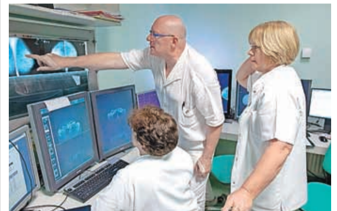
Zdravniki radiologi pri pregledu mamografskih slik v programu Dora.

dojk, ki še niso razširjeni po dojki ali telesu in ko je zdravljene lahko zelo uspešno,« pojasnjuje strokovnjaki. Če imate kakršno koli vprašanje ali če se želite na preventivno mamografijo v programu Dora naročiti sami, lahko obiščete spletno stran dora.onko-i.si, pokličete na brezplačno telefonsko številko 080 27 28 (vsak delovnik med 9. in 12. uro), pišete na dora@onko-i.si ali na Dora, Onkološki inštitut Ljubljana, Zaloška c. 2, Ljubljana, ali vprašate svojega zdravnika ali ginekologa.