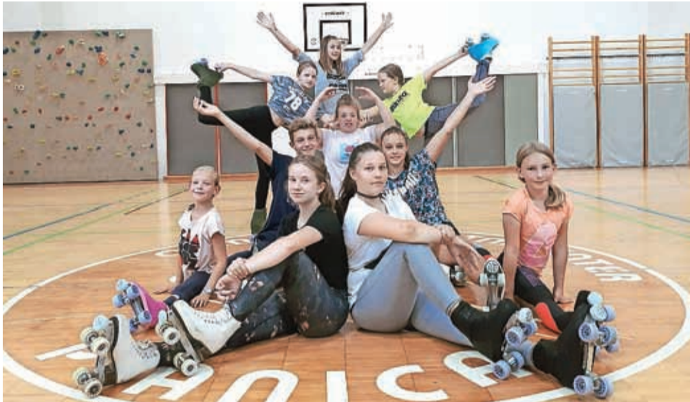
Kotalkarji so se na novo sezono pripravljali tudi v Planici.