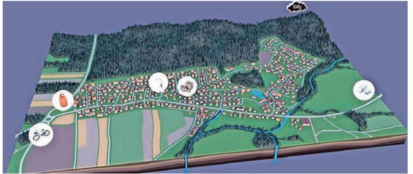
Virtualni model, tako imenovani digitalni dvojček, ki simulira sistem delovanja soseske s pomočjo pametnih rešitev.

Več lokalnih podjetij je uspešno združilo moči in znanje s podjetjem Riko ter v pilotnem projektu Pametna Mlaka izdelalo rešitve, ki sledijo usmeritvam Mestne občine Kranj pri vzpostavljanju Kranja kot pametnega mesta. Z uporabnimi digitalnimi rešitvami je cilj dvigniti kakovost bivanja občanov.