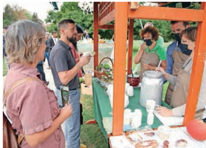
Na prireditvi se je predstavila vas Predoslje, kjer so se povezali lokalni pridelovalci, kmetje in Gostilna Krištof, vsi pa se predstavljajo pod enotno blagovno znamko 100 % lokalno.