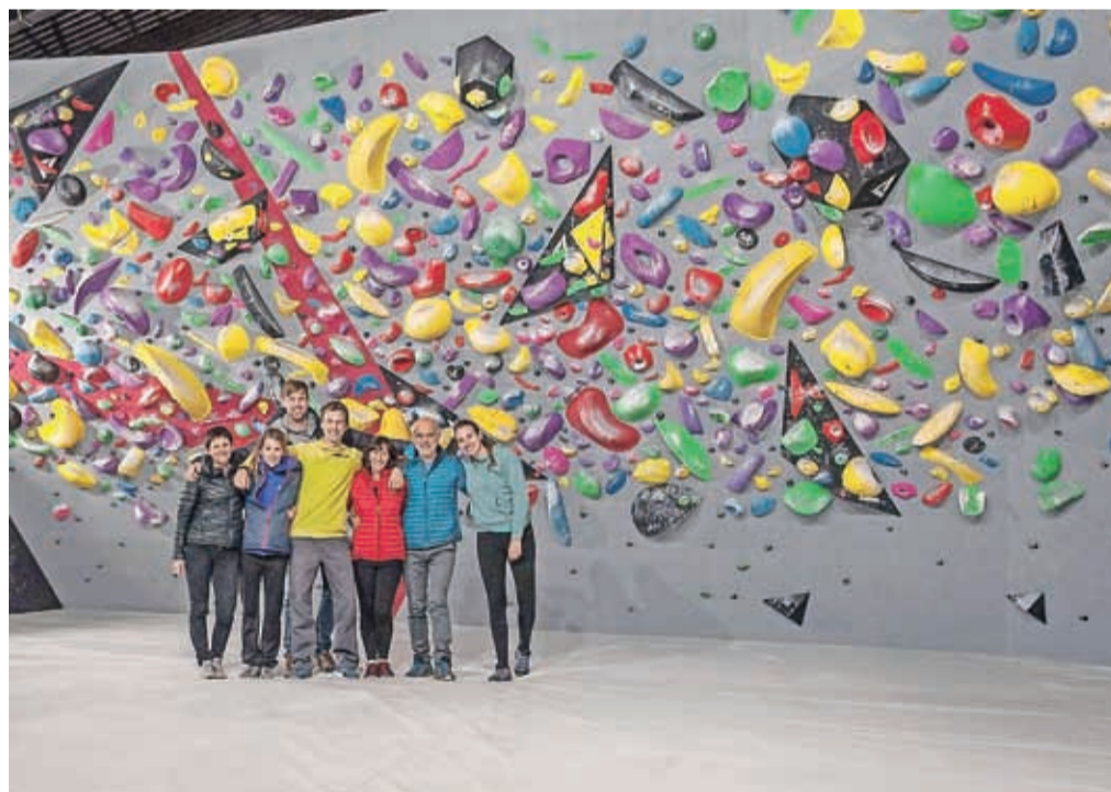
Ekipo uspešnih plezalcev in alpinistov ob steni plezalnega centra First Ascent na Primskovem

Čeprav sta polno zasedena s treningi, tekmami in pripravami, včasih še zavijeta na znameniti »most«, na katerem so se urile vse legende kranjskega plezanja.