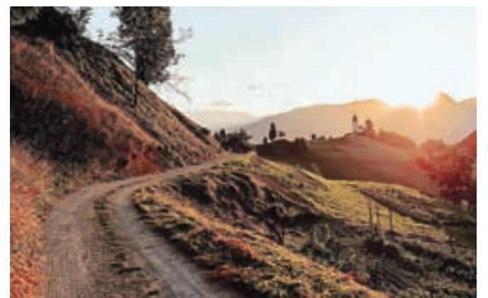
Pot Nemilje-Jamnik

Kranj – Projekt 20 poti je nastal v kranjskem podjetju Goodyear ter v sodelovanju z Mestno občino Kranj in Zavodom za turizem in kulturo Kranj. Namen je skupaj z lokalno skupnostjo in na način, ki odraža Goodyearove vrednote, obeležiti dvajset let delovanja podjetja v Sloveniji. Za spodbudo, da na jesenski dan uberete korak na eno od slikovitih poti (zbranih na www.goodyear20poti.si ), je v času od 15. septembra do 25. oktobra 2018 odprta nagradna igra, v kateri sodelujete tako, da se ob osvojitvi destinacije prek spletne strani vpišete v bazo potencialnih nagrajencev ter stiskate pesti do žreba nagrad. Vsak obisk vsake poti šteje, kar pomeni, da se lahko v bazo vpišete večkrat in s tem povečate svoje možnosti za prejem nagrade.