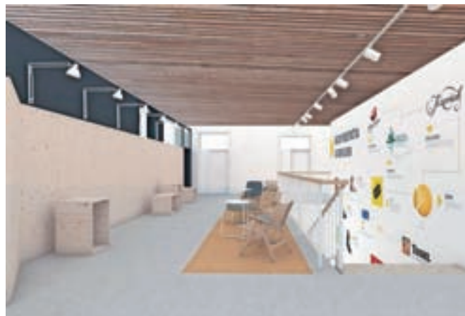
Idejna zasnova razstavnega prostora

Ena od nalog točk SPOT je vzpostavitev in delovanje Razstavnega prostora gorenjskega podjetništva, ki je načrtovano v letošnjem novembru. Razstaven prostor bo razdeljen na dva dela: v prvem bo stalna razstava podjetij z več kot desetletno tradicijo, ki razvijajo in proizvajajo izdelke v Sloveniji, drugi del pa bo namenjen začasnemu razstavi, kjer bodo za obdobje treh mesecev izpos-