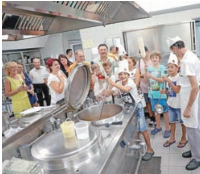
V kuhinji so otroci v roke dobili veliko kuhalnico in kuharsko kapo in pomešali juho v velikem loncu.

Dom upokoencev Kranj je letos pripravil malce drugačen dan odprtih vrat. Sodelavke in sodelavce so povabili, da pripeljejo svoje otroke, vnuke in jim pokažejo, kaj in kje delajo.