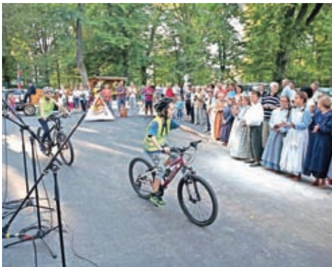
Vesetje mladih ob prvih zavojih po novem obračališču na Orehku / FOTO: GORAZD KAVČIČ