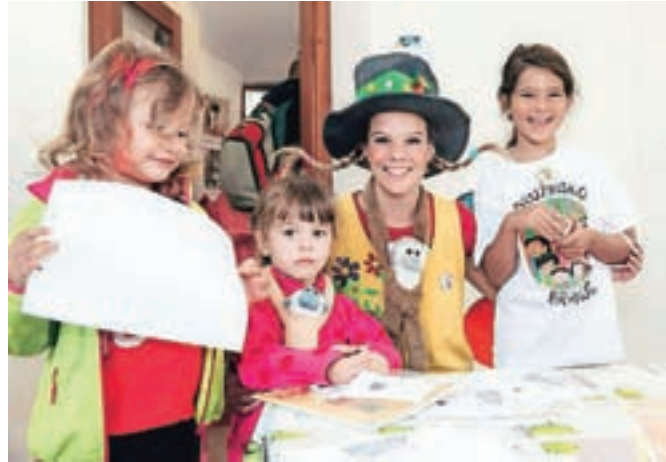
Na prireditvi ob petletnici so otroci uživali tudi v družbi vedno nasmejene Pike Nogavičke.

Z Veselim direndajem so prvo septembrsko soboto zaznamovali petletnico delovanja Otroškega stolpa Pungert Kranj.