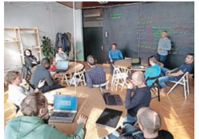
Ekipa strokovnjakov je v kranjski Kovačnici razvijala rešitev za izboljšanje zdravstvenega sistema.

Kot pravi dr. Denis Pavliha, je največja prednost te aplikacije, ki jo trenutno uporablja osem tisoč pacientov v desetih zdravstvenih domovih, ki so v enem letu in pol oddali že skoraj 12 tisoč naročil, da je ni treba naložiti in je brezplačna, saj njeno