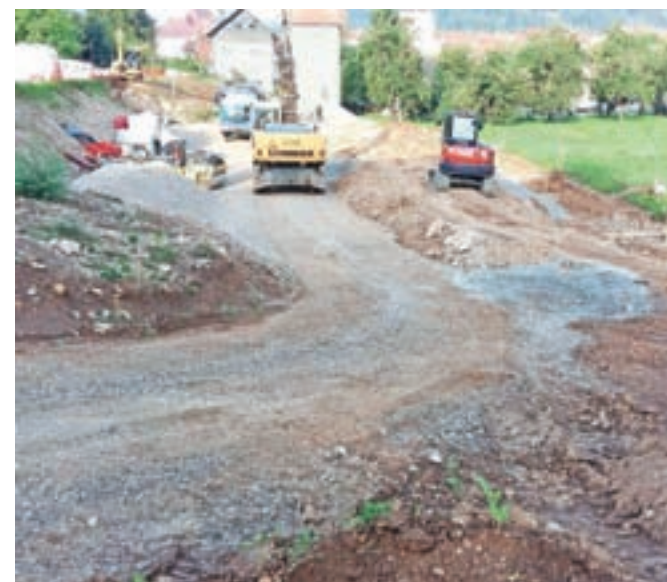
Urejanje parkirišča Huje se je že začelo.

na predvidoma do konca letošnjega oktobra. Poleg novih parkirnih mest bosta na voljo tudi dve parkirni postaji za električne avtomobile. Izvajalec del v skupni vrednosti 350 tisoč evrov je Inka ing, d. o. o., iz Ljubljane.