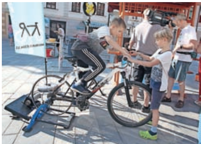
Kuhanje kave s pomočjo lastnih mišic, s katerimi so proizvajali elektriko in jo pretvarjali v toplotno energijo.