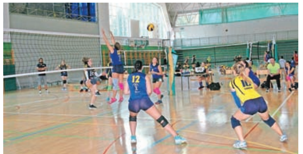
Na turnirju so nastopile tudi domače odbojkarice.