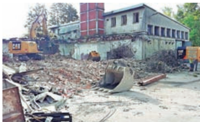
Rušenje nekdanje kotlovnice se je že začelo.

ture. Iz zapisnika koordinacijskega sestanka tudi izhaja, da bo med rušitvijo pos-