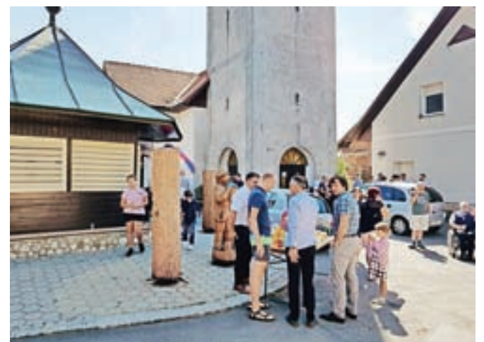
V Hrastju so na novo uredili vaški trg.