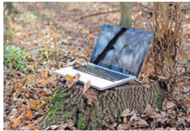
V Kovačnici bo pisana jesen.

Prvič letos Kovačnica vabi na potep, na katerem bodo udeleženci združili prijetno s koristnim. Tokratni program je namenjen spoznavanju z zadrugami. V četrtek, 11. oktobra, bo ob 9. uri start izpred Kovačnice. Sledil bo postanek v Ljubljani, kjer bo ogled Prevajalske zadruge Soglasnik, nato bo sledila pot proti morju na obisk v zadruge Zemlja &