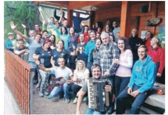
Društvo Auris je podprlo nedavno akcijo Gluhi strežejo v planinskih kočah. Nekaj njihovih članov se je s še drugimi prijatelji planin družilo v domu na Zelenici.