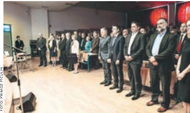
Na Fakulteti za organizacijske vede so praznovali šestdesetletnico razvoja organizacijskih znanosti v Kranju.

Kranj – Osrednji dogodek v sklopu praznovanja šestdesetletnice razvoja organizacijskih znanosti na Fakulteti za organizacijske vede (FOV) Kranj je predstavljala slavnostna akademija sredi septembra. Kot ustanovna članica Univerze v Mariboru je fakulteta že od samega začetka razvijala in gradila svoje pedagoško, znanstveno raziskovalno in strokovno delo na področju organizacijskih ved. Do selitve v nove prostore na Zlatem polju je fakulteta delovala na različnih lokacijah v starem mestnem jedru Kranja. Kot