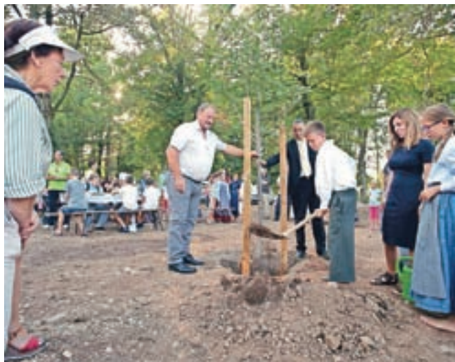
V gozdičku sredi obračališča, ki ga čaka še ozelenitev, so simbolično posadili lipo.

dnjem mandatu na njihovem območju izvedla za 250 tisoč evrov investicij. Poleg obračališča so zadnji dve leti uredili tudi otroško igrišče v Drulovki, varen priključek na Ljubljansko cesto na Orehku in pešpot ob reki Savi v Zarici. "Naslednji projekt je pridobitev prostorov za potrebe krajevne skupnosti, ki naj bi jih uredili v športnem parku Zarica," je še napovedal.