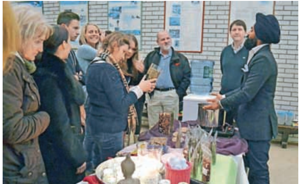
Prvi osnovnošolski alumni klub na Gorenjskem je takoj po ustanovitvi postal zelo dejaven.

»Vse izdelane krmilnice smo in bomo do konca prodali na ostalih dogodkih kluba. Prodajajo se z računom, da ne bo kakšnega suma davčnih prekrškov. Denar bo porabljen za delovanje kluba in pa za namensko pomoči šoli. Rada bi poudarila, da