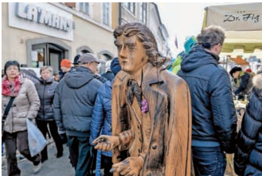
Ob kulturnem prazniku se v Kranju vedno zbere veliko obiskovalcev, ki na ta dan doživijo čas dr. Franceta Prešerna.