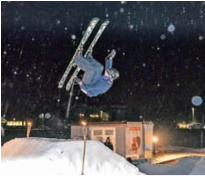
Džampa freestyle dTour v Kranju: atraktivno tudi za gledalce

Džampa freestyle dTour se je ustavil v Kranju.