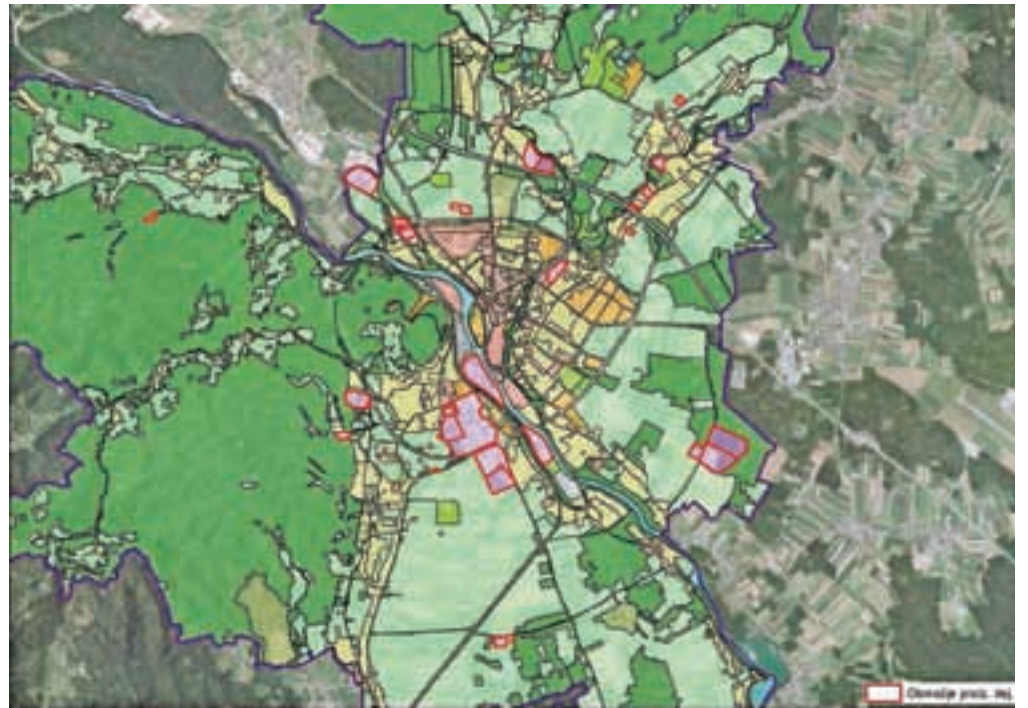
Na karti so poudarjeno označene cone za poslovno in industrijsko rabo.

Kranj – Začelo se je s sistematičnim delom pri oceni realnih možnosti razvoja poslovnih in industrijskih con, zato so bila v ta namen ciljno analizirana potencialna območja, ki so v prostorskem načrtu občine (OPN) opredeljena kot poslovne oziroma industrijske cone. Poleg tega so bila analizirana tudi nekatera druga, razvojno zanimiva območja za razvoj dejavnosti. Na teh analizah je bil izdelan »Ciljni načrt razvoja poslovnih in industrijskih con v Mestni občini Kranj«. V sklopu analize je bila izvedena tudi anketa med vsemi lastniki zemljišč in stavb v conah, ki so opredeljene v OPN, ki je razkrila pripravljenost lastnikov za aktivno sodelovanje pri razvoju posamezne poslovne cone. Kot operativno podpora anketi in z namenom transparentnega prikaza vseh potencialnih območij za razvoj je bil vzpostavljen spletni portal poslovnih con z vsemi potrebnimi grafičnimi in opisnimi podatki o posamezni coni. V prvi fazi je namenjen občinski upravi in potencialnim investitorjem, ki se vse pogosteje obračajo na občino preko novo ustanovljene Pisarne za podjetja. Ta nudi aktivno podporo vsem zainteresiranim investitorjem za vlaga-