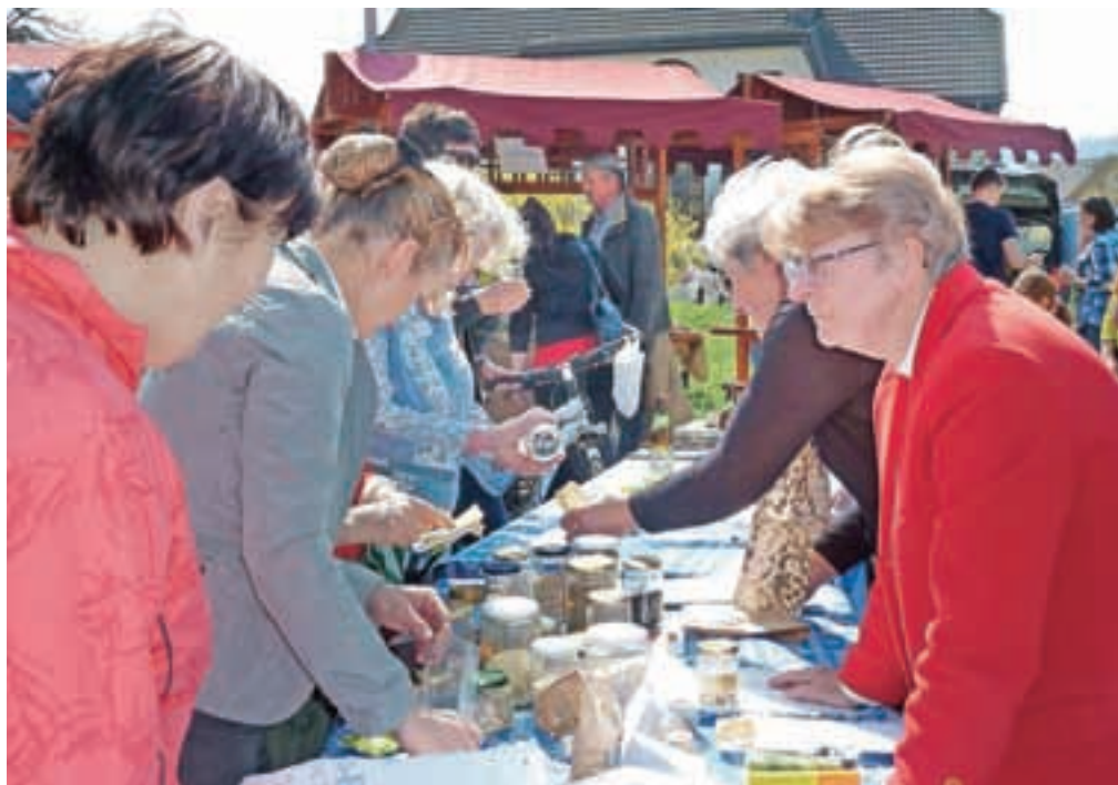
Stražiška tržnica poleg bogate ponudbe lokalne hrane ponuja tudi priložnost za druženje Strašanov.

»Namen Stražiške tržnice, ki se je med krajanji odlično prijela, je povezati lokalne pridelovalce hrane z lokalnimi odjemalci, s tem pa se čim bolj približati samozadostnosti oziroma čim manjši odvisnosti od drugih regij, kar bo v prihodnosti vedno bolj pomembno. Naša želja je bila, da bi tudi kmetje tržnico vzeli kot priložnost za ponu-