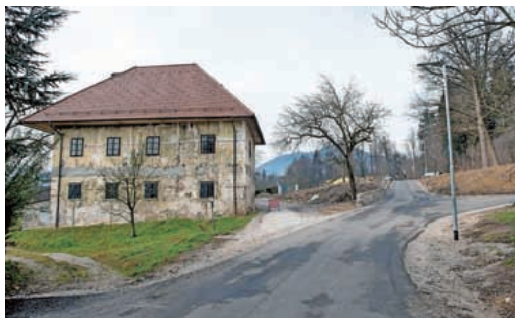
Nova obvozna cesta mimo šempetrške graščine

stanju, in paviljon so zaščiteni kot kulturna dediščina, zato se jih ne sme podreti in bo treba zgraditi novo telovadnico, predvidoma na lokaciji med nogometnim stadionom in šolo. Na to temo smo imeli pred kratkim sestanek s predstavniki sveta staršev, vodstvom šole, mestnimi svetniki in predstavniki športnih društev. Izoblikovali smo skupino, ki bo za občino kot investitorico pripravila skupna stališča vseh interesnih skupin in krajanov. Idejna zasnova za novo telovadnico je sicer že