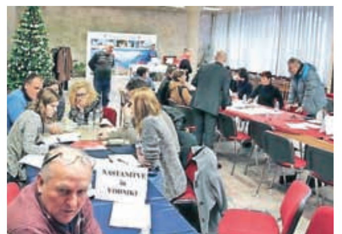
Že na prvem srečanju je bilo delovno vzdušje.