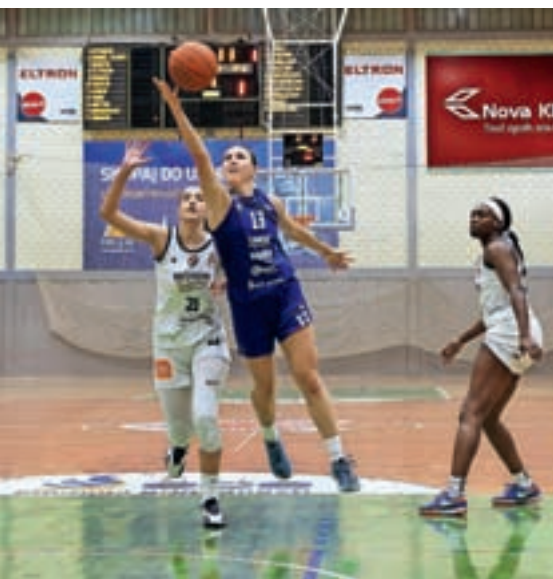
Članice so si v Kranju priborile finale v pokalu Alpe Adria.

trtina je bila precej izenačena, v drugo četrtino so ilirjanke vstopile bolj razigrane in si vsako četrtino priborile večjo prednost. Na koncu so državne prvakinje postale košarkarice Akson Ilirije, ekipa Triglava pa je osvojila drugo mesto in si zaslužila srebrna odličja.