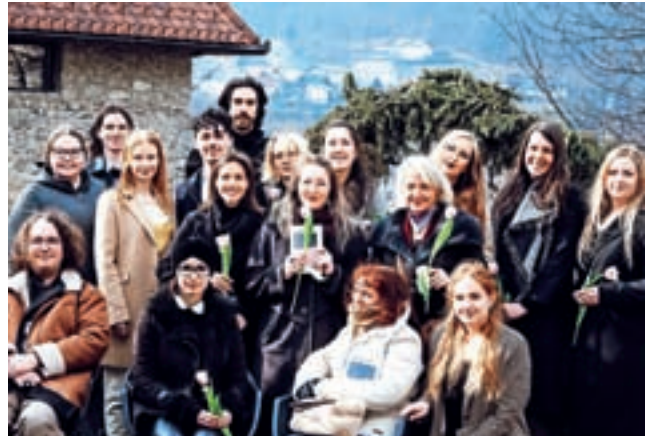
V branje vam ponujajo antologijo erotične kratke proze.