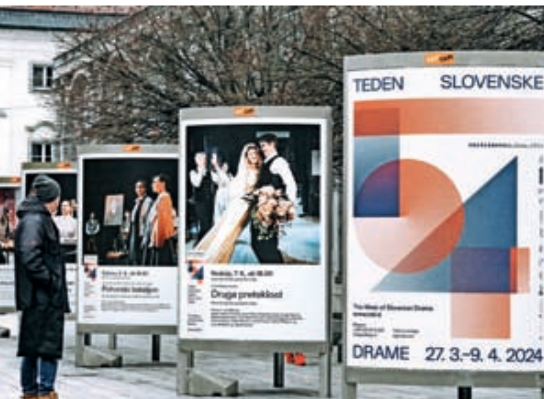
Še malo in v Kranju bosta na sporedu dva najbolj gledališka tedna v letu.