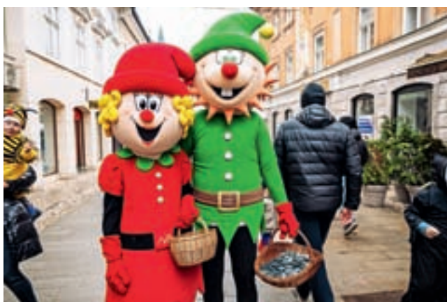
Najbolj znani par Krančkovega karnevala: Kranček in Krančica

le pustne maske vseh vrst in starosti. Dogajanje je letos potekalo na dveh prizoriščih – na Glavnem trgu so obiskovalce razveseljevali Čarovnik Grega, DJ Seba in Dejan Dogaja, pred Prešernovim gledališčem pa harmonikarski orkester Glasbene šole Bučar. Mesto so obiskali kurenti in orači iz Rogoznice, družbo pa so jim delale kranjske maskote Kranček, Krančica, Čebela in Mamut. Dan se je končal s pustno nočjo za otroke v Stolpu Pungert.