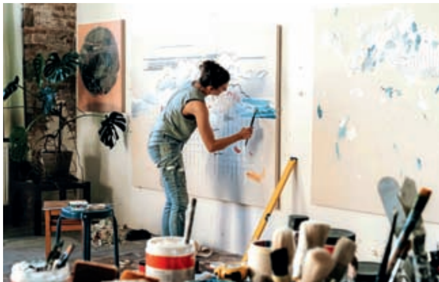
Sredi dela v najetem ateljeju v kompleksu Spinnerei v Leipzigu

in stoji za teboj. Kar nekaj kolegov imam, ki so v tem smislu uspeli in so masovno prodajali svoje slike. Ampak ko pomislim, kaj ti to prinese, če moraš »štancati« slike, je že v redu, da je tako izpadlo, kot je. Da sem se z družino vrnila v Slovenijo, tu se je pred letom in pol rodil drugi sin, Oto, še letos pa bova z Janom začela počasi obnavljati hiško, ki sva jo kupila v vasi Kal med Pivko in Ilirsko Bistrico.