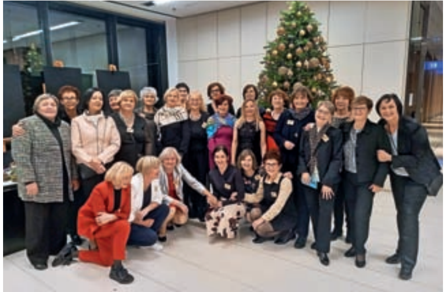
Prostovoljke Kluba En korak več z velikim veseljem sodelujejo, se povezujejo in solidarnostno prispevajo k dobrobiti skupnosti.

Kot je povedala, je njihov glavni namen širjenje socialne baze uporabnikov in priznavanje uporabnikom, da so del našega okolja. Vrednost kluba je v sodelovanju in odpiranju mreže v socialno okolje ter pomoč Centru Korak, ki je po njenih besedah pionir na svojem