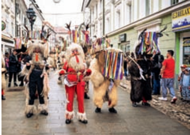
Za odganjanje zime so najbolj glasno poskrbeli kurenti iz Rogoznice.

le pustne maske vseh vrst in starosti. Dogajanje je letos potekalo na dveh prizoriščih – na Glavnem trgu so obiskovalce razveseljevali Čarovnik Grega, DJ Seba in Dejan Dogaja, pred Prešernovim gledališčem pa harmonikarski orkester Glasbene šole Bučar. Mesto so obiskali kurenti in orači iz Rogoznice, družbo pa so jim delale kranjske maskote Kranček, Krančica, Čebela in Mamut. Dan se je končal s pustno nočjo za otroke v Stolpu Pungert.