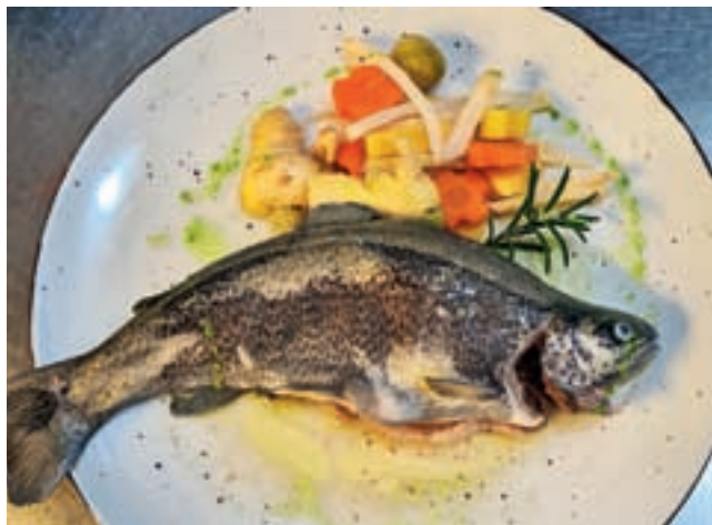
Na sopari kuhana zelenjava in krompir sta delala družbo kuhani in z maslom namazani postrvi. / Foto: Alenka Brun