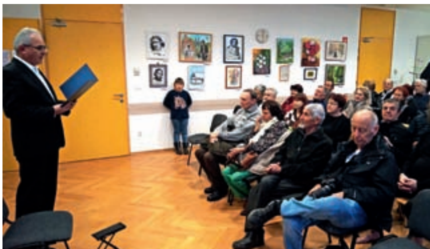
Z razstave Mokrocveteče rož`ce poezije