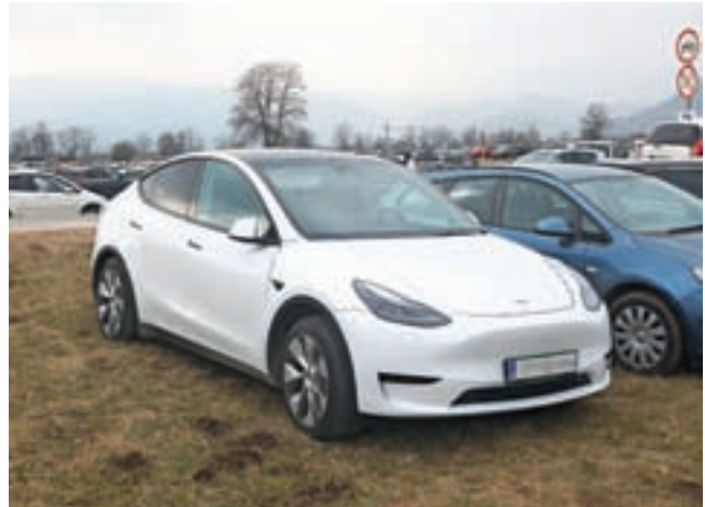
Tudi v Sloveniji je vse več električnih avtomobilov. Fotografija je simbolična.

Tudi v Sloveniji se je prodaja električnih avtomobilov podvojila. Prodanih je bilo 4330, kar pomeni, da je bil