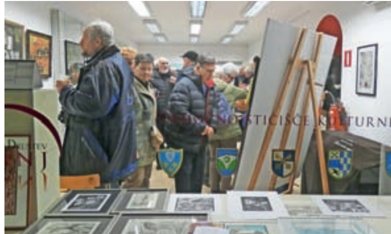
Razstavo so pripravili v galeriji kranjske Zveze kulturnih organizacij.