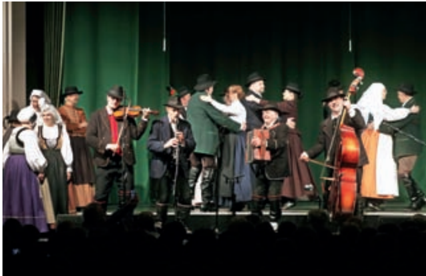
Tokrat se je »godlo« in plesalo.

K ranjski furmani spadajo pod pevsko sekcijo Akademске folklorne skupine Ozara Kranj. Ime so poiskali v preteklosti. Namreč Kranj je bil nekoč znan kot križišče trgovskih poti, kjer so se ustavljali ter prepregali številni furmani, in člani pevske zasedbe so se odločili, da se poimenujejo po njih. Kasneje izve- mo tudi, da so znotraj Akademске folklorne skupine Ozara najprej začele peti Bodeče neže, dekleta, ki so bile svoj čas plesalke pri folklori. Potem so začele nastopati samostojno. In po njihovem vzoru so tudi fantje rekli, da bodo naredili skupino. Odločili so se, da bodo poustvarjali slovensko ljudsko petje s poudarkom na moškem