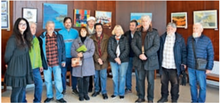
Utrinek z odprtja razstave del likovnikov Jasne