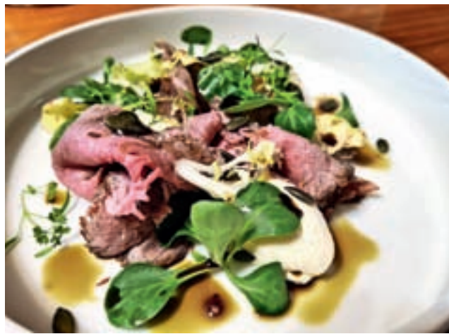
Rožnato pečen rostbif z motovilcem, hrenovim moussom in bučnim oljem