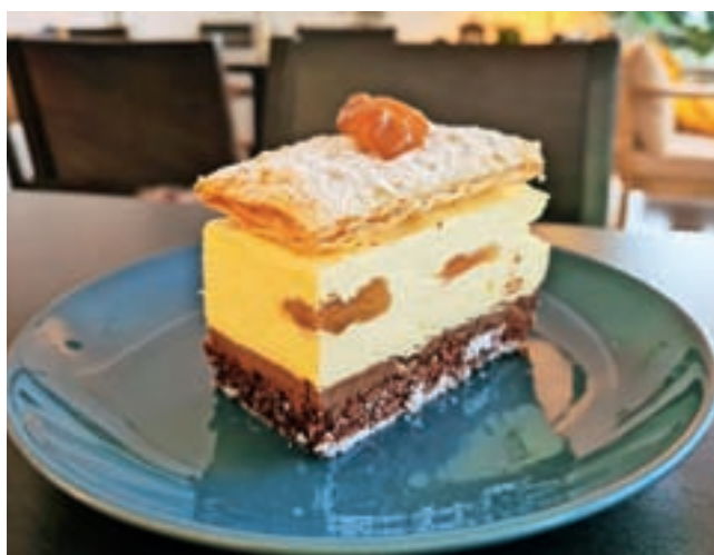
Francetova rezina