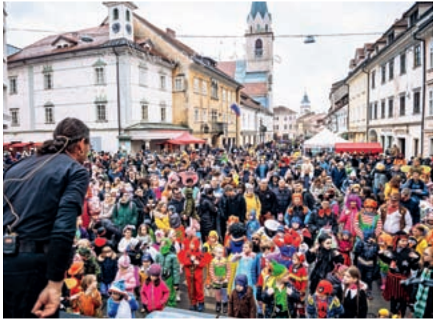
Čarovnik Grega je znova navdušil predvsem najmlajše.

N a pustno soboto, 10. februarja, se je v Kranj vrnil tudi Krančkov karneval, z njim pa so dva dni po Prešernovem smenju stari del mestnega jedra napolni-