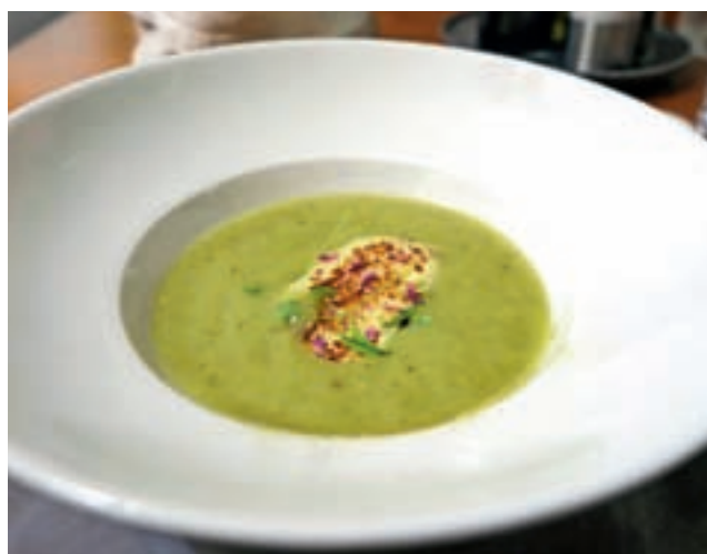
Krompirjeva juha s porom in skutnim štrukljem

drobljencem in medom – preprosto, a brbončice so bile vsele. Podobno so se razveselile tudi sladice z menija Prešerna južina, ki so jo stregli na Primskovem Pr' Matičku. Mandljeva rulada s figovo marmelado in smetano ter sladoledom žižule je kar hitro izginjala v ustih gostov. Kakor se sliši bogato, je bila presenetljivo lahka. Tudi tu je bila gostilna za čas kosila polna. Domača pašteta in sladki namazi, mangalica in gamsova klobasa, zaseka, kisle gobe, bučna skuta so kar vabili, predvsem pa je »kurja župa« s knedli in mlinčki požela precej odobravalnega mrmranja s strani gostov. Komur ni bilo pri glavni jedi do budlane prepelice s pomarančno omako, zelenjavo in štruklji, pripravljenimi na sopari, se je lahko odločil za kuhano in z maslom namazano postrv, ki sta ji na krožniku delala družbo na sopari kuhana zelenjava in krompir.