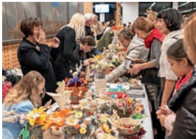
Lanskoletni bazar ob 20-letnici Centra Korak je naletel na velik odziv.