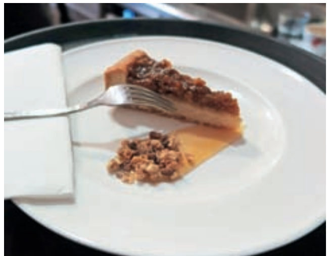
Pita s figami

V centru starega Kranja, v Bistrotju Sonet, so poleg Prešernovega kosila ponujali tudi zanimivo, prav posebno Prešernovo sladico. Do zadnjega niso razkrili, kaj to bo, na Prešernov dan pa smo ugotovili, da gre za pito s figami,