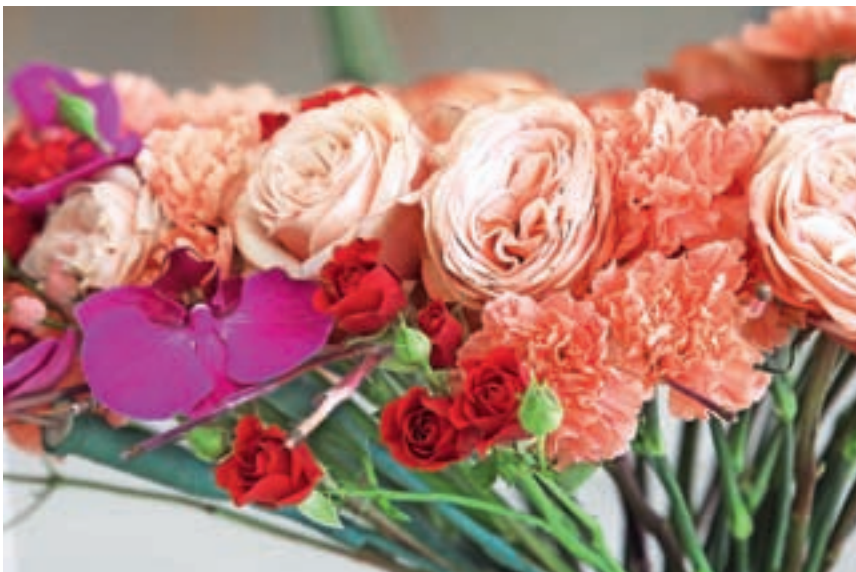
Raznobarvni nageljni, vrtnice in različne vrste čebulnic – izbira je neskončna in s podarjenim cvetjem v nobenem primeru ne moremo zgrešiti.

Kaj pa nega? Ribič je priporočil, da rastline iz cvetličarne kar se da hitro pripeljemo domov in jih ne vozimo cel dan v avtomobilu. »Če smo izbrali lončnico, priporočam, da ko jo pripeljemo domov, pustimo ovito