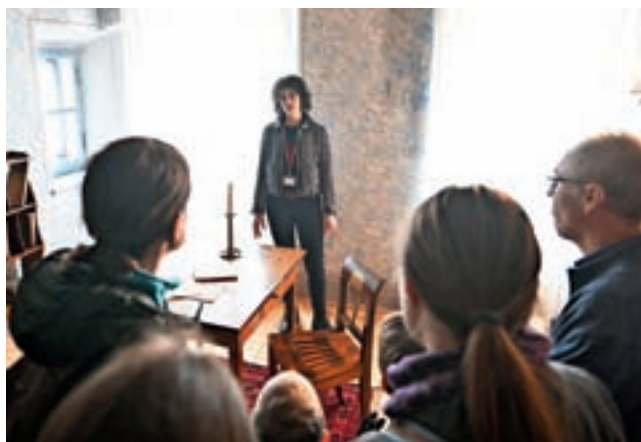
Na Prešernov dan so vrata za obiskovalce odprle tudi kranjske kulturne ustanove.

Kranjske kulturne ustanove so za vse obiskovalce odprle svoja vrata. Gorenjski muzej je na primer pripravil brezplačna vodstva po razstavah in delavnice za otroke, v Prešernovi hiši so si obiskovalci poleg stalne razstave Prešeren – Pesnik lahko ogledali tudi novo občasno razstavo o 60 letih Prešernovega spominskega muzeja. Različne aktivnosti in vodenja so organizirali tudi Mestna knjižnica Kranj, Layerjeva hiša, Prešernovo gledališče, Župnijska cerkev sv. Kancijana in tovarišev ter Galerija Prešernovih nagrajencev za likovno umetnost Kranj, v kateri so odprli fotografsko razstavo portretov letošnjih nagrajencev.