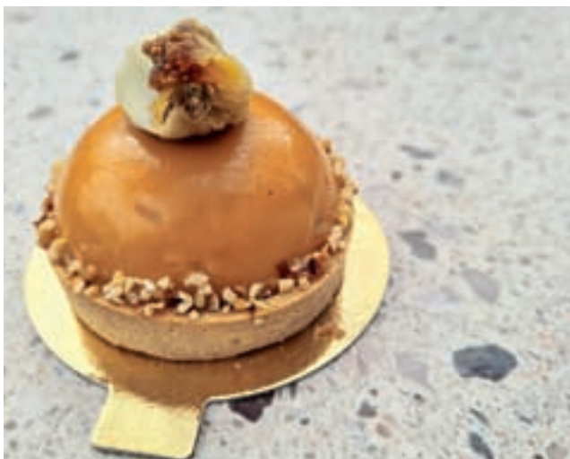
Monoporcijski Prešeren / Foto: Alenka Brun

Poleg klasičnih menijev za kosilo so tokrat na Brionih pripravili tudi Prešernov štirihodni meni – rožnato pečen rostbif z motovilcem, hrenovim moussom in bučnim oljem, krompirjevo juho s porom in skutnim štrukljem, svinjsko ribico s slanino, figami in vinsko omako na zeliščnem pireju ter flambirane palačinke z orehi v pomarančni omaki z domačo stepeno smetano –, ki je nasitil še tako lačne, saj so bile porcije res izdatne. Kdor se je zanj odločil, zagotovo ni šel lačen od mize. S cenami za štiri jedi, ki so bile odlične, niso pretiravali.