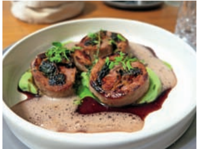
Svinjska ribica s slanino, figami in vinsko omako na zeliščnem pireju