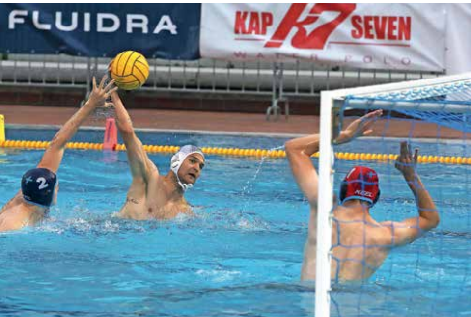
Naša vaterpolska reprezentanca si je v Kranju z borbeno igro priborila pot na evropsko prvenstvo.

Ob Romuniji in Sloveniji so se na evropsko prvenstvo iz kvalifikacij uvrstili še Nizozemska, Nemčija in Srbija, ki so bile zmagovalke svojih skupin, ter Malta in Slovaška, ki sta bili skupaj s slovensko izbrano vrsto ena od treh najboljših drugouvrščenih reprezentanc.