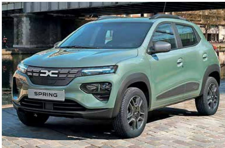
Najcenejši električni avto pri nas je Dacia spring electric. Z novo subvencijo jo je možno dobiti že za 16.500 evrov.

Za nakup električnega vozila v vrednosti do 35.000 evrov boste dobili največ, in sicer 6.500 evrov, za nakup vozila v vrednosti med 35.000 in 65.000 evrov bo subvencija 4.500 evrov, za nakup rabljenega ali testnega vozila v vrednosti do 30.000 evrov bo znašala 3.000 evrov, za rabljen ali testni avto v vrednosti med 30.000 in 65.000 evrov pa bo subvencija 2.000 evrov.