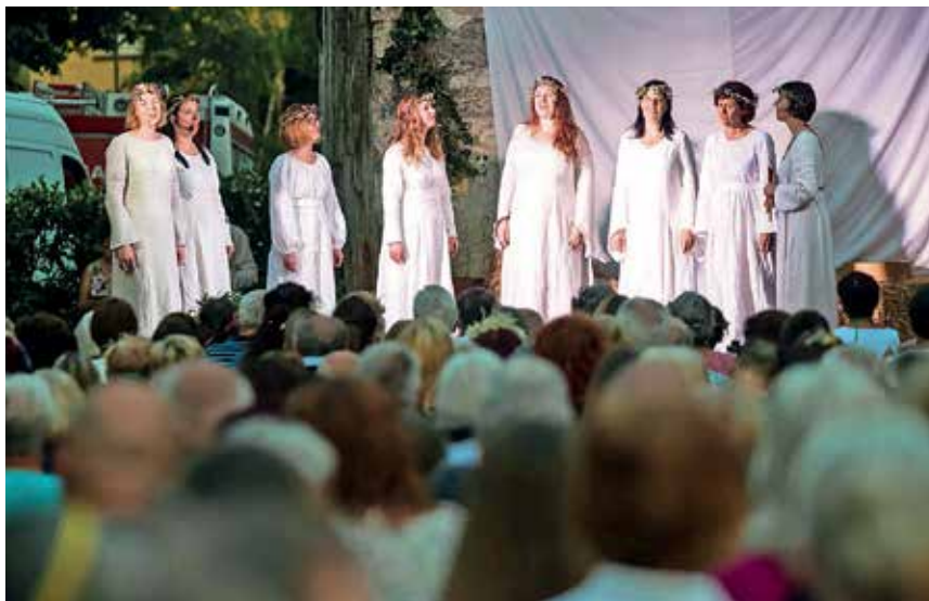
Dečve so jubilej proslavile pred številnim občinstvom v izvirnem okolju Šempetrske graščine.