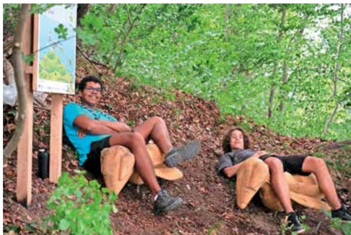
Čebele niso le umetniško delo, so tudi za počitek.