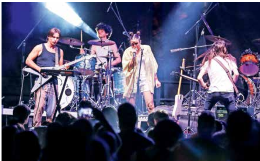
Skupina Koala Voice je svojo energijo uspešno prenesla na občinstvo.