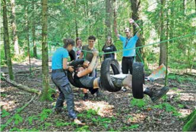
Lov na zaklad so spremljali različni izzivi.