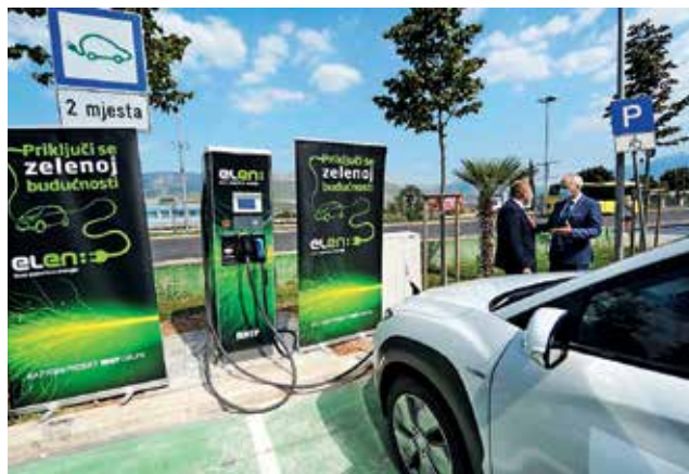
Elen ima na poti proti Dalmaciji pri polnilnicah vsaj trenutno še monopol.

Poleg zastojev in večje porabe v gnečah na poti na morje morajo vozniki električnih avtov računati predvsem na slabo polnilno infrastrukturo, ki močno podaljša čas potovanja. Vedeti je treba, da je električnih avtomobilov vse več in da prosta vtičnica ob avtocesti ni samou-