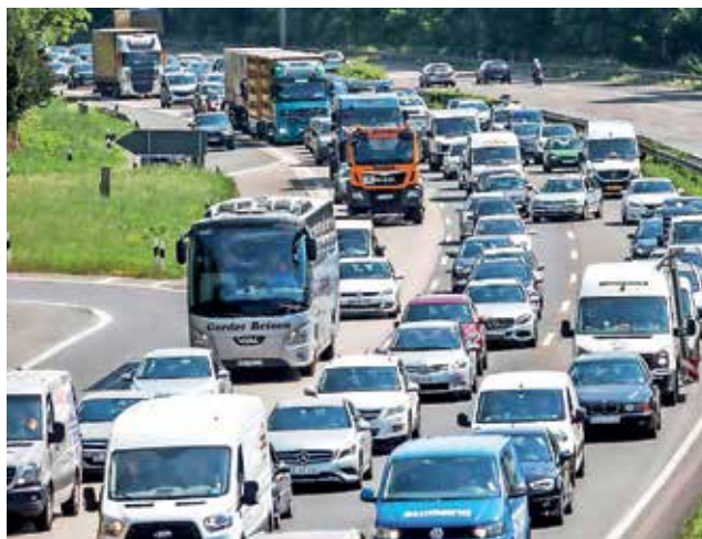
Pri zastojih ne pozabite na reševalni pas, v tem primeru reševalno vozilo nima kam.

Izberite manj obremenjene mejne prehode, npr. namesto Dragonje in Sočerge izberite prehoda Rakitovec/Slum ali Brezovica pri Gradinu/Sveta Lucija. In še: nikar prehitro čez mejne prehode, tu navadno velja omejitev hitrosti 30 km/h.