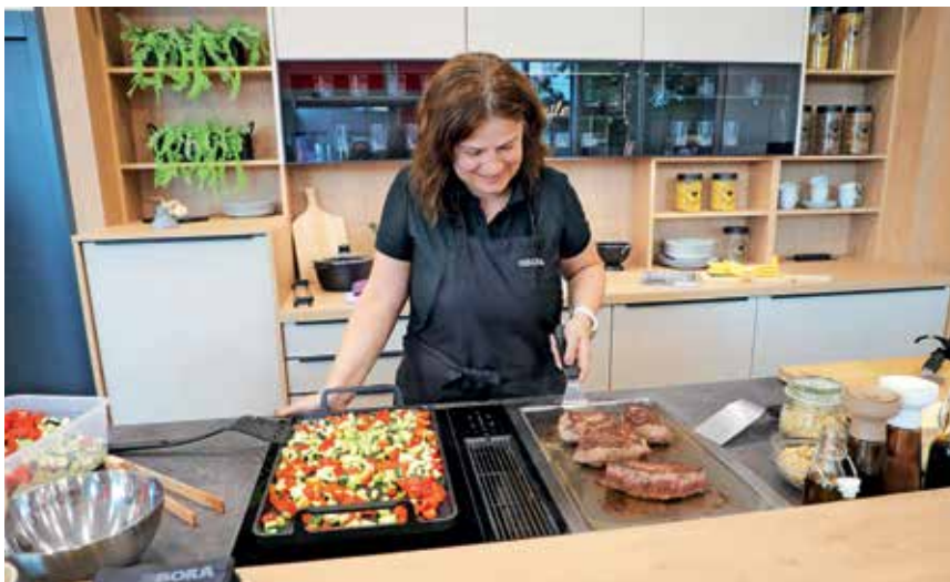
Prvi obiskovalci novega studia kuhinj so lahko spremljali pripravo hrane na sodobnih izdelkih.

Za kuhinjske otoke je po besedah sogovornice precej zanimanja, saj so sodobne kuhinje običajno odprt prostor, ki ni namenjen le pripravi in uživanju hrane, zato je toliko po-