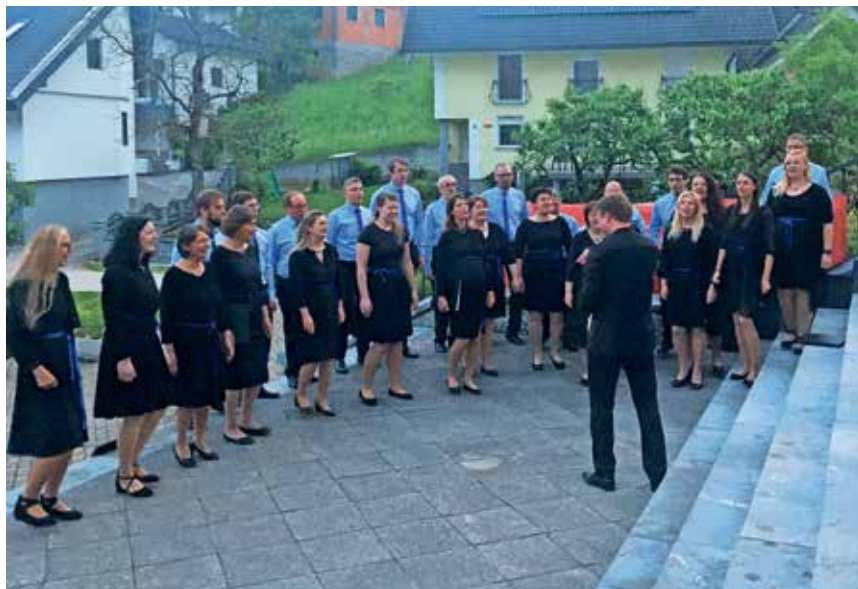
Po letnem koncertu je Mysterium zapel še pred cerkvijo.

Na letnih koncertih je Mysterium pripravil glasbeno popotovanje skozi sakralne skladbe. Uvodoma so zapeli priljubljeno skladbo Good News, ki je postala stalnica v njihovem repertoarju, potem pa še nekaj prekrasnih slovenskih sakralnih skladb ter nekaj črnskih duhovnih, skladb, ki so jih sužnji prepevali v 18. in 19. stoletju v