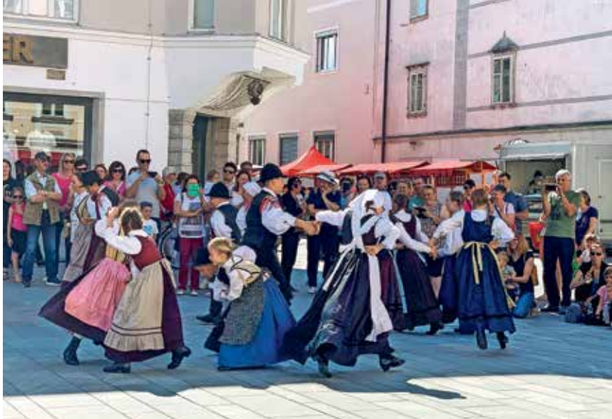
Na Glavnem trgu so se prepletali plesni, pevski in glasbeni nastopi vseh generacij.

Enajsti Pozdrav poletju je tretjo soboto v juniju soustvarjalo kar 385 sodelujočih.