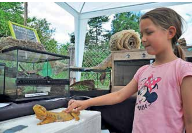
Spoznavanje eksotičnih živali