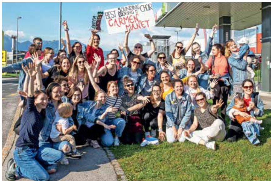
Sprejem domačih ob vrnitvi zbora v Kranj potrjuje povezanost in izjemno energijo v pevskih vrstah Carmen manet.

Carmen manet so optimistične tudi v pogledu na prihodnost. Po poletnem premoru jih čaka kovanje načrtov za koncertiranje v jeseni. »Oči imejte na pecljih, ušesa napeta, prepričani smo, da se kmalu vidimo in slišimo,« še pravijo.