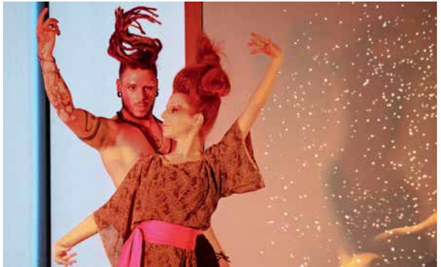
Ogenj