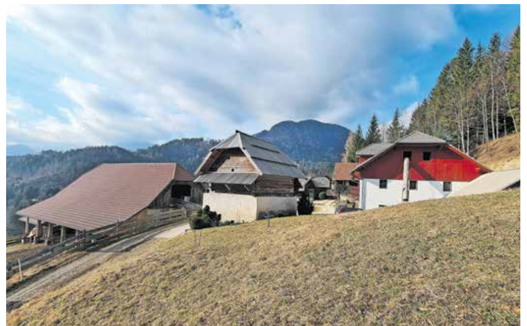
Vsa zemljišča so okrog domačije, a skoraj vsa v strmini.