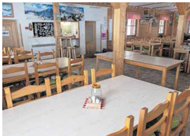
Prostorna in lepo urejena jedilnica / Foto: Primož Pičulin

V planinskem domu je na voljo sedemdeset ležišč,