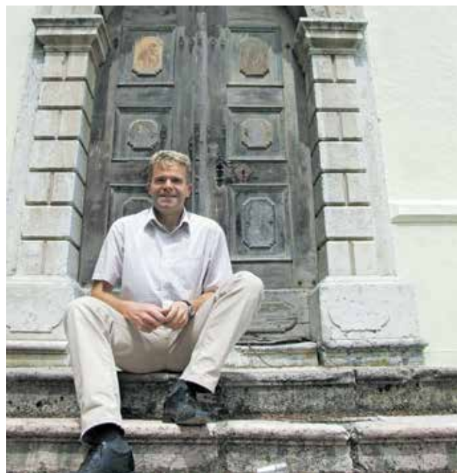
... in leta 2007