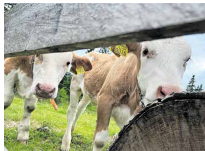
Poleti je na planini živahno pašno življenje.

Kamničani že vsa leta turizma na planini prisotna tudi polemika, kakšna je prava mera turistov na njej. Nekateri menijo, da bi bilo treba število gostov omejiti, drugi pa so prepričani, da je prostora za razvoj še dovolj.