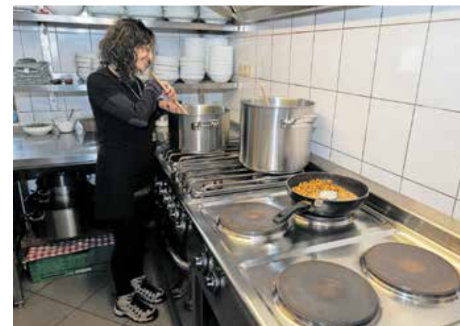
Se že kuha na petkovo jutro ... / Foto: Primož Pičulin