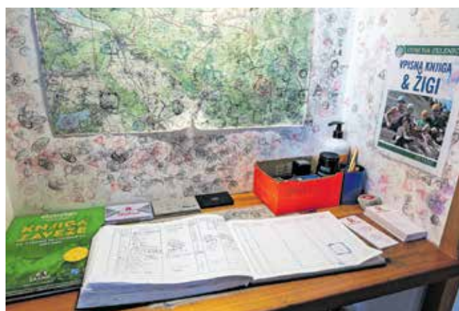
Da se ve, da smo bili 'gor'.

obrnejo v kuhinji, postrežejo goste, počistijo, kar je treba, skrbijo za okolico. Dom je v tem času odprt ob koncu tedna in za praznike, od