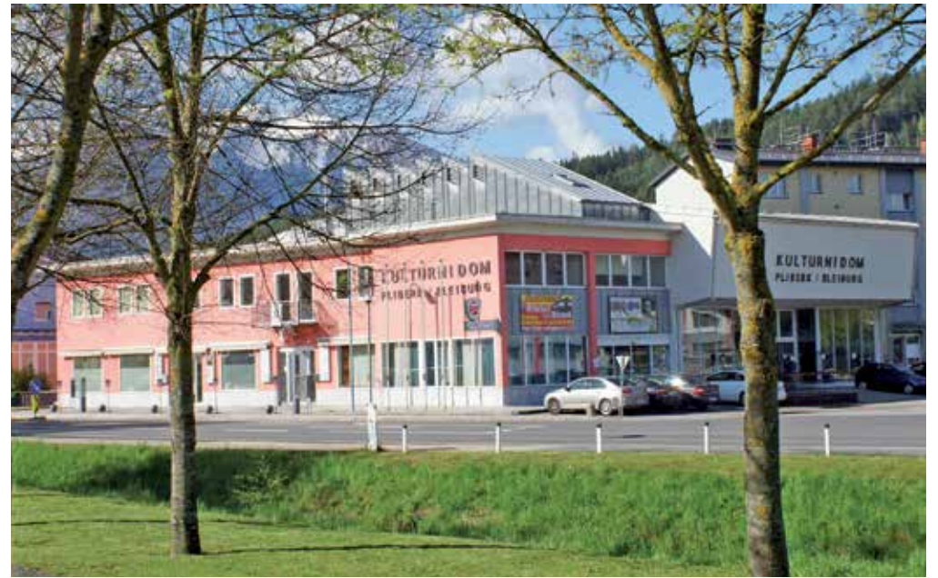
Kulturni dom Pliberk, kakršen krasi Pliberk danes

Na slovesnem uradnem odprtju aprila 2004 je predsednik Fric Kumer poročal: »Že v minulih 50 mesecih se je zvrstilo v kulturnem domu več kot 260 prireditev, samo v letu 2003 pa je prišlo v kulturno središče ob Velikovški cesti 20.000 obiskovalcev.«