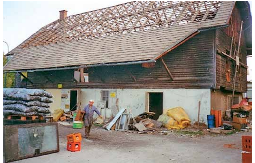
Iz tega poslojja je zrasel kulturni dom.