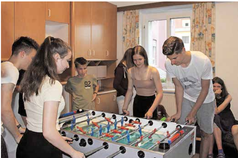
V Slomškovi hiši je poskrbljeno tudi za razvedrilo.