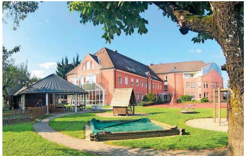
Slomškova hiša dobrega počutja v celovški Ainethovi ulici