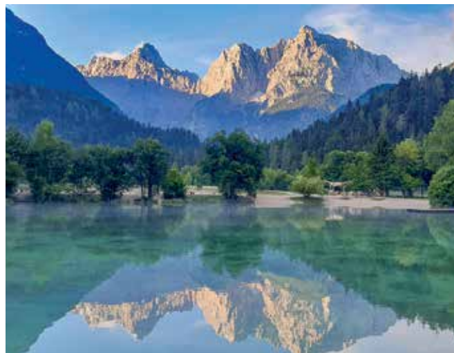
Jutranje prebujanje v Jasni

Dominik S. Černjak, tudi aktualni predsednik Turistične zveze Slovenije, prav tako dodaja, da se turizem