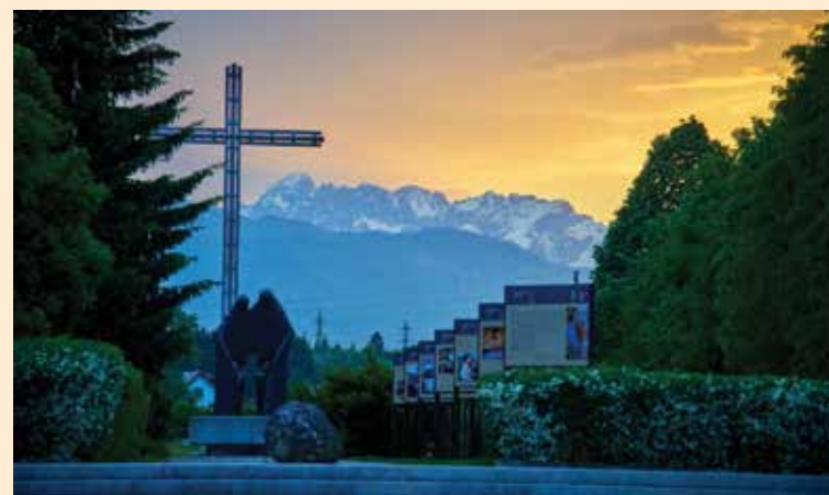
Večerni Ave v Parku miru.