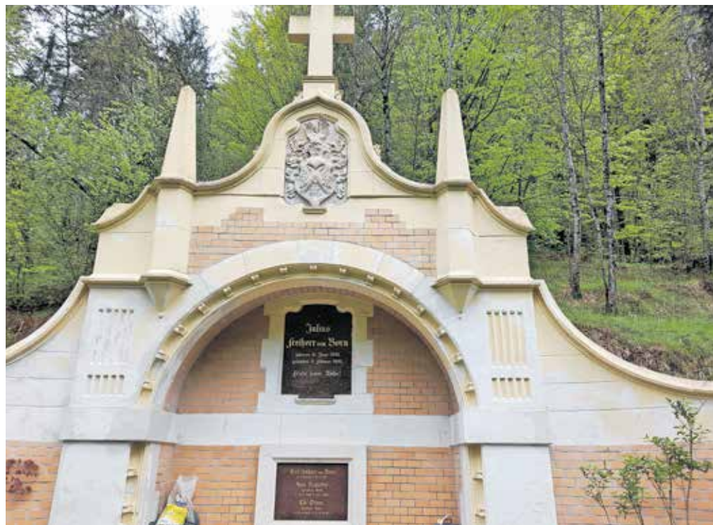
Bornova grobnica v Jelendolu