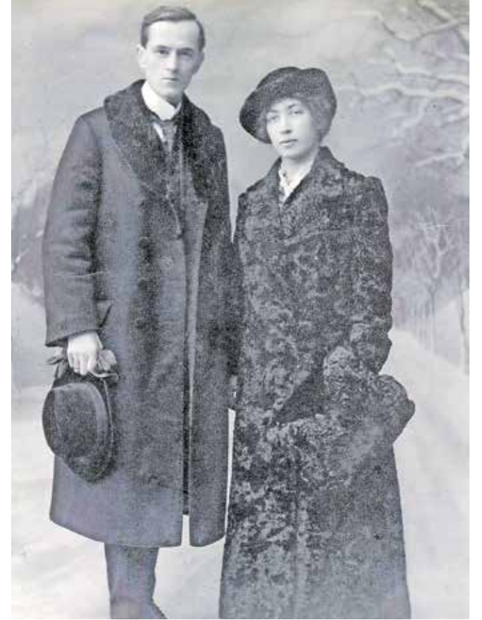
Zakonca Ivan in Helena Vurnik

Kot poudarjajo v Centru arhitekture Slovenije, je bil arhitekt Vurnik predan pedagog, zato k ustvarjanju Vurnikovih dni vsako leto povabijo prav študente različnih fakultet, saj želijo, da delo zakoncev Vurnik poleg študija njunega dela postane tudi navdih za mlade ustvarjalce umetniških smeri.