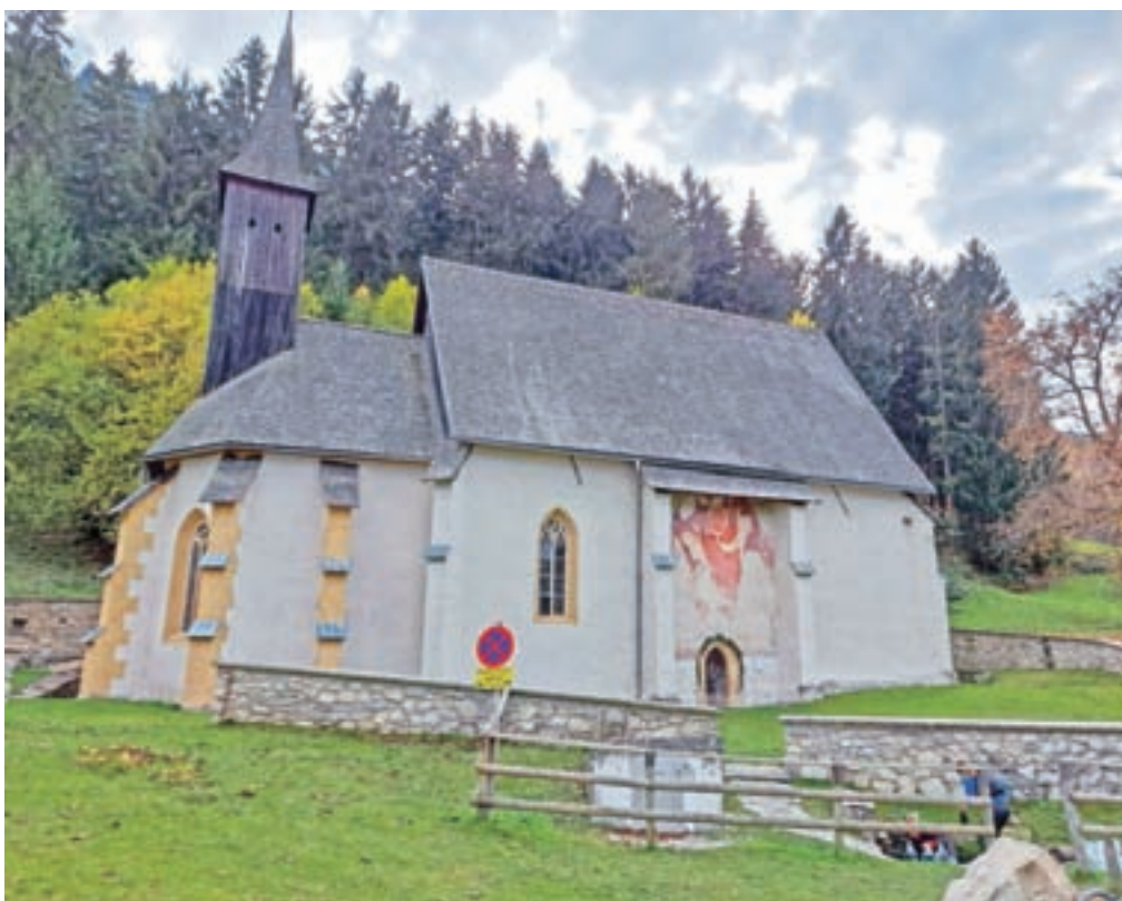
Romarska Marijina cerkev, okrog katere je sedem studencev