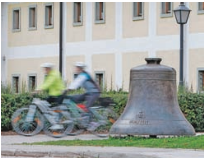
Razstavljeni so tudi jekleni zvonovi, ki so jih ulivali v Kranjski industrijski družbi.