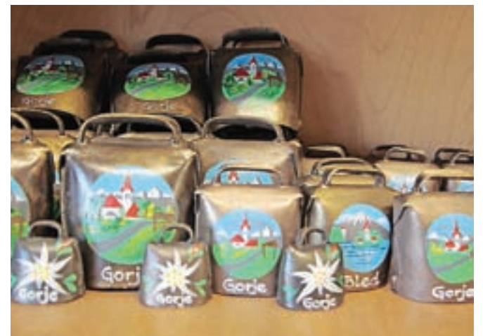
Zvonci kot turistični spominke

ne delam sam, za to je treba imeti pravo roko,« pravi in doda, da med motivi za poslikave prevladujejo gorske rože – planike in encijani – ter motivi in napisi turističnih krajev.