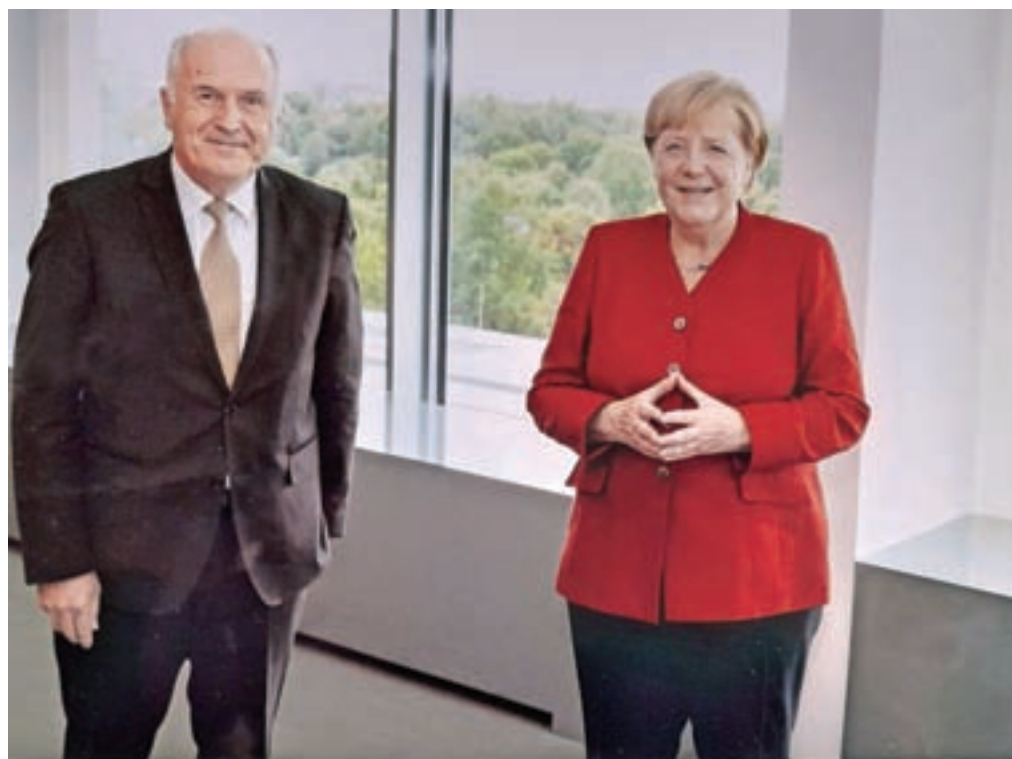
Foto: Valentin Inzko und allen guten Wünschen Angela Merkel

povabljen na poroko v Mostar in eden od svatov mi je dejal: »Dokler ste bili vi v Bosni, nam je bilo dobro. Vi ste nam dajali občutek varnosti.« Te besede so me ganile. Nisem je zagotavljal jaz. Zagotavljala jo je mednarodna skupnost z vojaki Euforja, med katerimi so bili tudi Slovenci. Sam sem predvsem branil državne ustanove, kot je državno ustavno sodišče, državna centralna banka, državna lastnina. Želim, da bo imel moj naslednik večjo podporo mednarodne skupnosti in bi pospešil razvoj države. Za ljudi v Bosni gre vse prepočasi, zato se izseljujejo.