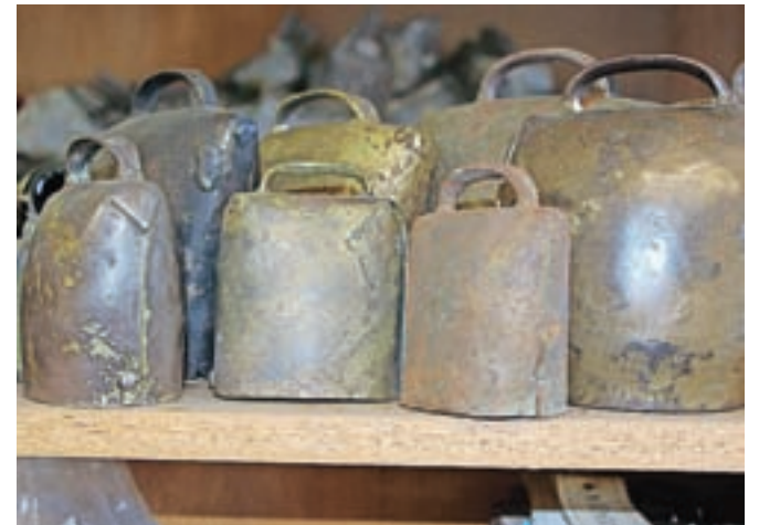
Stari zvonci z gorjanskega območja

od dva do tri tisoč na leto, zdaj jih zaradi covid-19, ki je zavrl turistične tokove, bistveno manj, le še tretjino nekdanje količine. Kravjih zvoncev zaradi opuščanja paše naredi vse manj, še največ jih izdeluje za turistične spominke, sicer pa tudi za živinorejske nagrade pa za kurente, škoromate, oteпов-