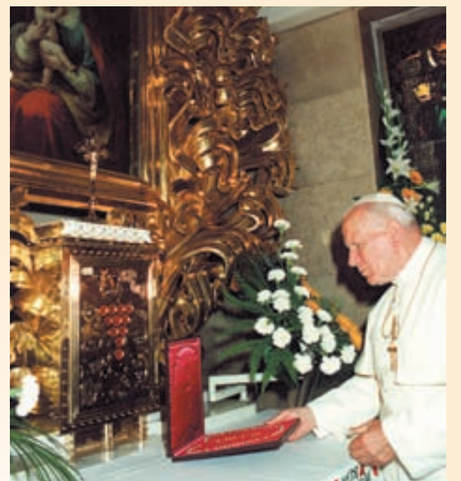
Sveti papež Janez Pavel II. je med obiskom Brezij Mariji Pomagaj poklonil rožni venec.