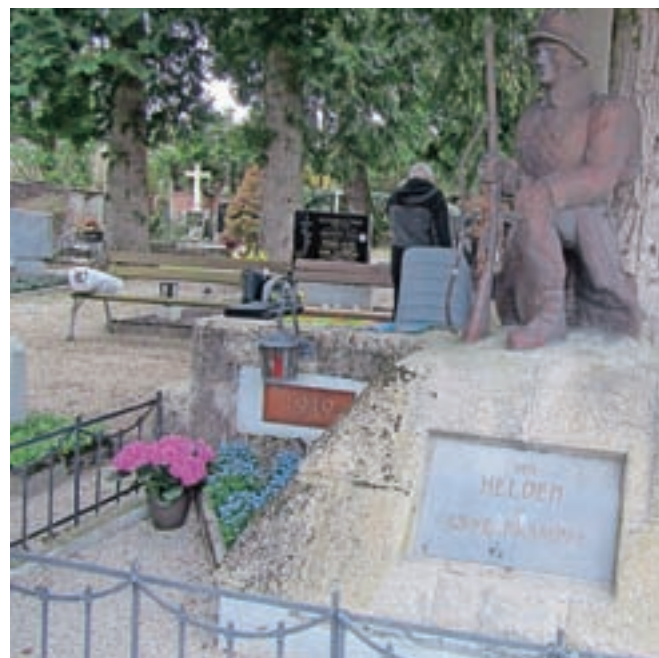
Kip klečečega vojaka med grobovi padlih v bojih za Koroško oziroma našo severno mejo na velikovškem pokopališču