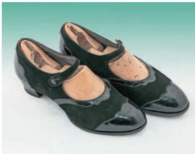
Ženski nizki čevlji s pasčkom, t. i. špangarji, Tržič, druga četrtina 20. stoletja

Knjiga ima več kot štiristo strani. »Glavni motiv pri pisanju knjige je bil, da bi bila gradiva, ki so raztresena tu in tam po muzejskih zbirkah, nekatera so tudi še neobjavljena, združena na enem mestu in da tisti, ki ga obutev bolj zanima, na sorazmerno preprost način pride do informacij. Da pa bi besedilo pritegnilo tudi pozornost bralca, ki ga temeljne oblike obuval ali nadržnosti njihovega videza ne zanimajo, osrednjemu besedilu dodajam zanimivosti, povezane z obuvanjem – med njimi so številni reki in pregovori, ki smo jih ohranili v sodobnem besednjaku, a pogosto ne poznamo njihovega izvora. Dodane so pesmi, večinoma ljudske, ki imena obuval omenjajo v različnih kontekstih in pomenih ...« V knjigi je mogoče najti tudi zapise o šegah in navadah, povezanih z obuvanjem in obutvijo, pričevanja o cenah, ponudbi obuval na trgu. Tudi obuvala namreč veliko povedo o