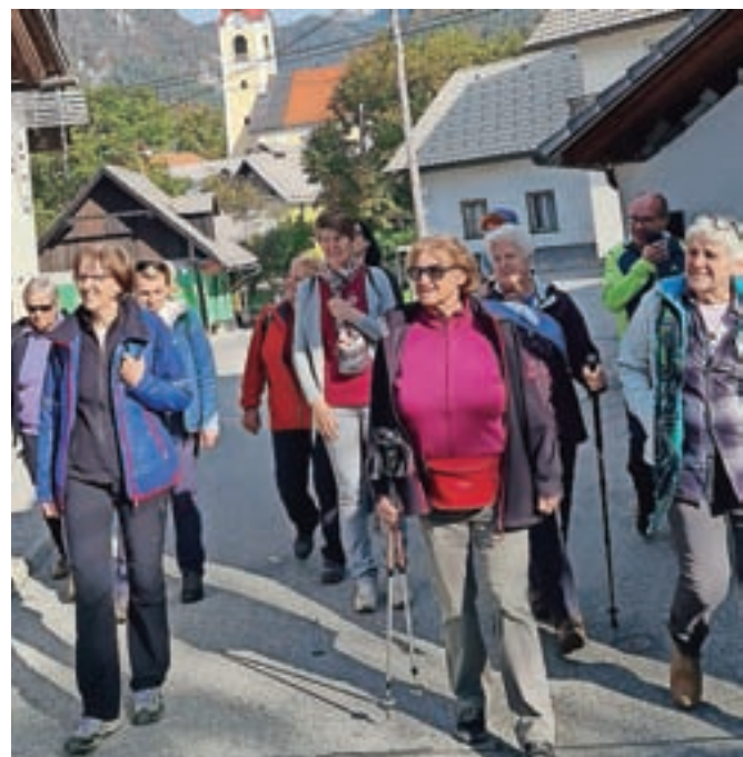
Skupina pohodnikov se je iz Begunj peš odpravila skozi stari del vasi in nato skozi Dvorsko vas, Otok ter zaselka Gorica in Vrbnje proti Radovljici.

ji družina še vedno vodi priljubljeno gostilno, cilj številnih obiskovalcev, ljubiteljev legendarnih glasbenikov, pa je muzej Avsenikove glasbe, ki deluje v sklopu domačije in v katerem si je mogoče ogledati tako zgodovino