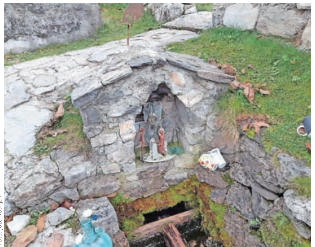
Eden od sedmih studencev; k njemu hodijo po vodo od blizu in daleč.