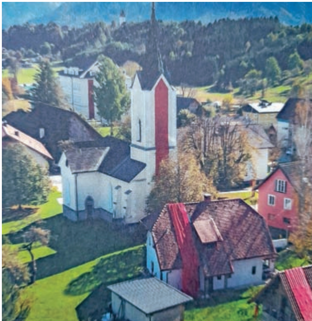
Rdeči trak, vključen je tudi v vezavo knjige, so potegnili po hišah, travnikih in poljih in tako simbolizirali mejo. Projekt je bil prispevek h kulturni raznolikosti dežele Koroške in je spodbujal k razmišljanju o mejah.