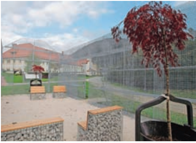
Območje je opremljeno z zanimivo urbano opremo, na mestu Korenove hiše stoji »zelena dnevna soba«.