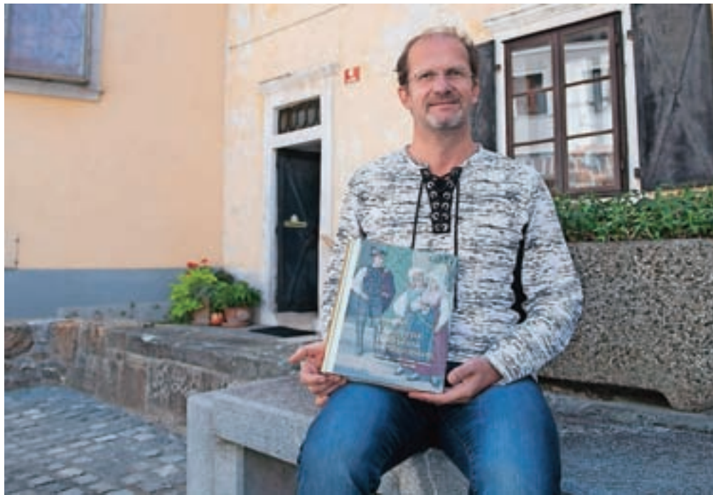
Dr. Bojan Knific / Foto: Primož Pičulin

Razlog je bil dokaj jasen: niti svetovalci folklornim skupinam nismo poznali temeljev in nismo znali svetovati, kakšna obuvala naj izberejo pri oblikovanju novih kostumskih podob, še manj pa, kako naj jih čevljarji izdelajo. Manj težav je bilo pri obuvalih, ki so interpretirala obuvanje ljudi na Slovenskem konec 19. stoletja in pozneje, kajti nekateri čevljarji so vsaj v osnovi poznali način