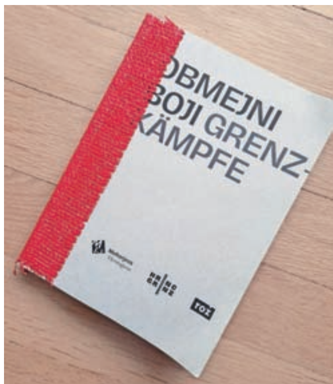
Naslovnica knjige Obmejni boji/Grenzkaempfe , ki sta jo izdala Mohorjeva založba in Slovensko prosvetno društvo Rož iz Šentjakoba