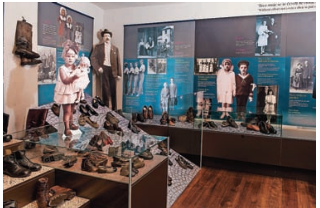
Bogata čevljarstva zbirka v Tržiškem muzeju

Če ste se namenili iti iskat knjigo, pa to mimogrede pozabili, je tu rezervna rešitev: kdor nima v glavi, ima v petah. In za branje knjige Obutvena dediščina na Slovenskem ne potrebujete posebnega poguma. Res sicer pravijo, da kdor nima junaškega srca, mora imeti pete, a verjmite – knjiga ne grize.