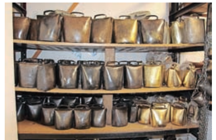
Zvonci, kakršne nosijo kurenti