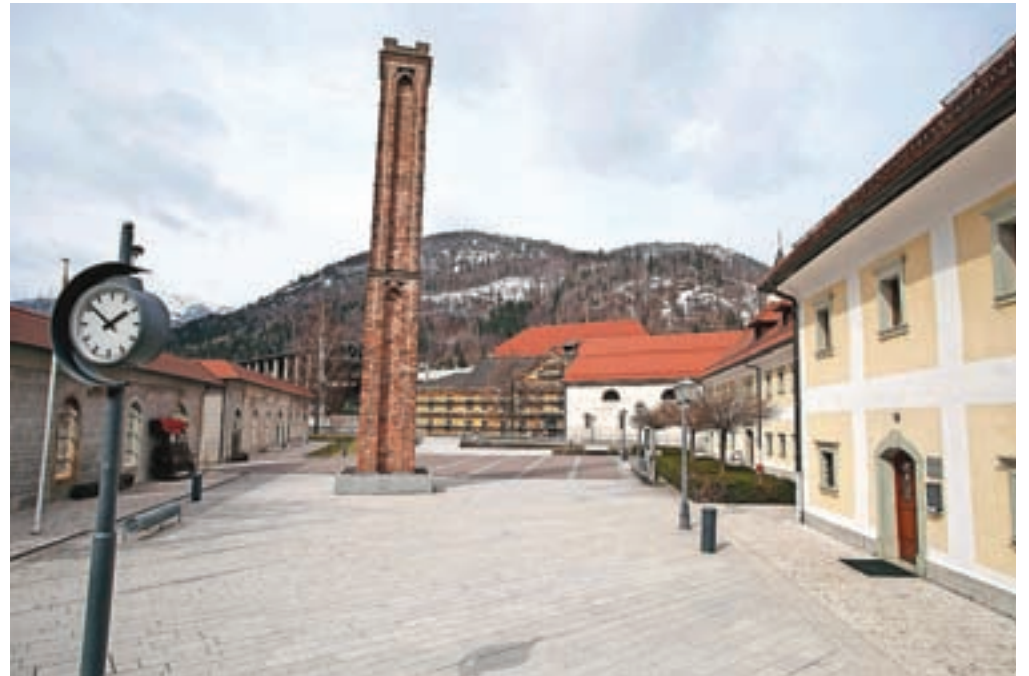
Osrednji trg na Stari Savi

Na severu trga je fužinarska Bucelleni-Ruardova graščina iz začetka 16. stoletja, v kateri so živeli lastniki savske fužine. V pritličju so bile pisarne, blagajna, podeljevalnica žigov in trgovina z mešanim blagom. V prvem nadstropju je bilo fužinarjevo stanovanje z dvanajstimi sobami, veliko dvorano in petimi sobami za goste. Eni so rekli rdeča soba, v njej so imeli tudi klavir in biljardno mizo. V drugem nadstropju