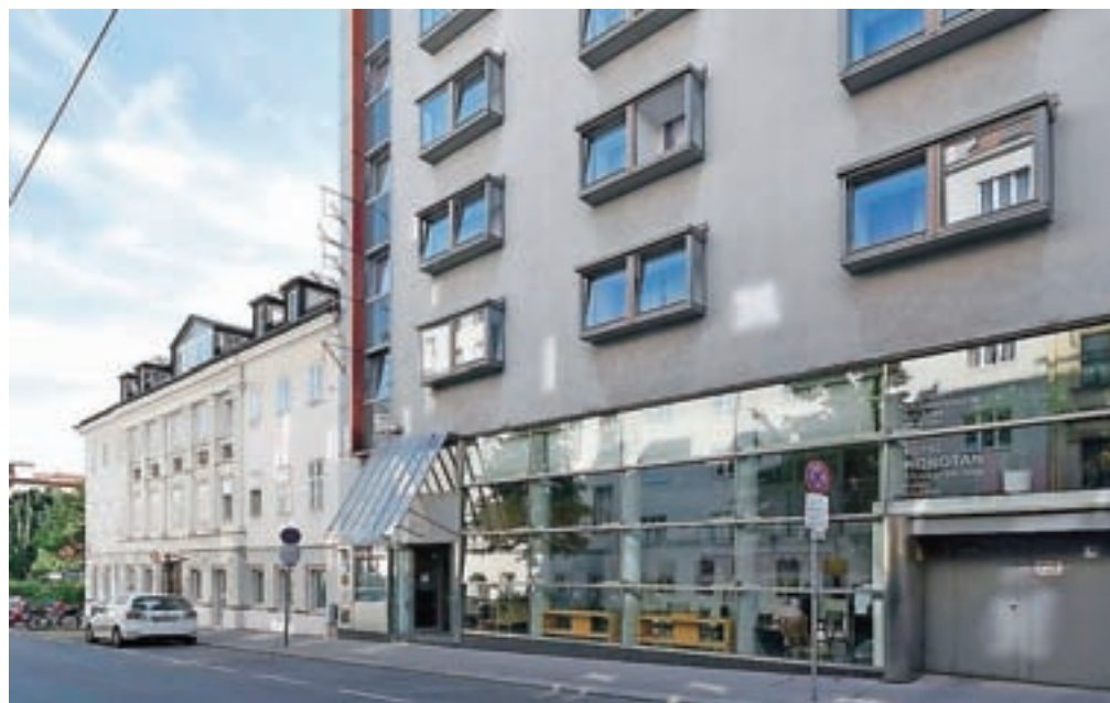
Slovenski dom Korotan na Albertgasse 48