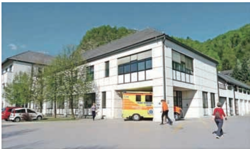
Bomo v Kamniku izgubili službo nujne medicinske pomoči v zdravstvenem domu, kakršno smo poznali do sedaj?

»Zdaj se vidi in potrjuje, kako prav smo ravnali, da smo zagnali vik in krik in smo zbirali podpise in opozarjali na te zadeve. Delovna skupina očitno ignorira 11.500 podpisov, ignorira naša mnenja in proteste in predstavi točno tisti predlog, za katerega so trdili, da je še v oblakih in da mi pretiravamo. Ključno vprašanje, ki ga zastavljam, je: Zakaj Domžale ja, Kamnik pa ne? Če je namen zagotavljanje boljše oskrbe, potem bi pričakovali, da bo to šlo bolj navzven proti periferiji, ostaja pa vse skupaj v nekem centru. Mi ostajamo pri svojih stališčih, ki jih bomo branili. Bojimo se