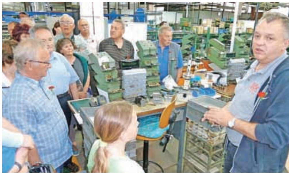
Dan odprtih vrat Titana je privabil številne Kamničane, med njimi je bilo tudi veliko nekdanjih delavcev.