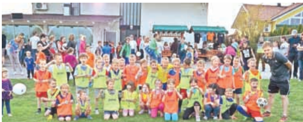
Mladi nogometaši na Igralnem dnevu NK Virtus

žogo velikanko oz. zorbing žogo, v kateri so se z užitkom kotalili in uživali kot hrčki v svojem kolescu. Za zaključek pa smo jim pripravili manjše presenečenje, saj je vsak udeleženec bil nagrajen s spominsko medaljo Igralni dan – Virtus 2015. Medaljo, s katere jih pozdravlja in bodri naš Levček, ki je klubski simbol ter krasni Virtusov grb. In še za konec, če je merilo veselje in nasmeh otrok, ki so prisostvovali, potem je Igralni dan – Virtus 2015 odlično uspel! Priredili smo jim lep dan in izkušnjo, ki jim bo ostala v spominu. Hvala vsem trenerjem in staršem, ki so pomagali, da so otroci ta dan uživali!