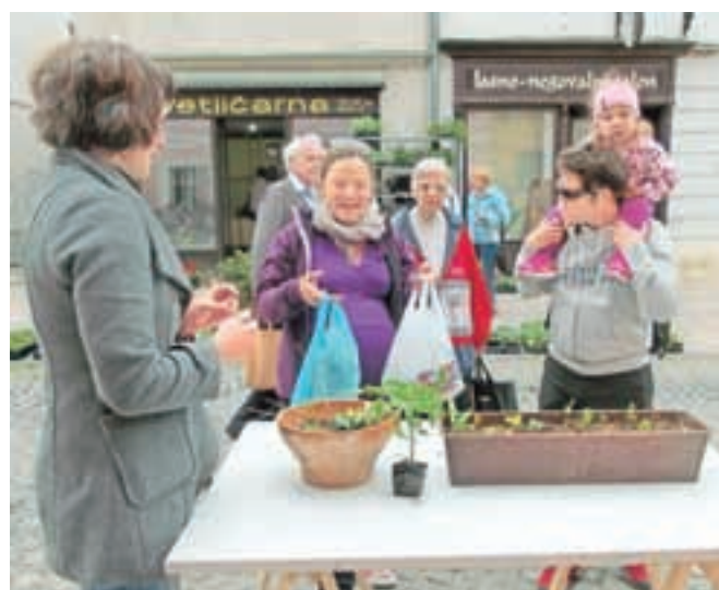
Na prvi kamniški Festni Vesni so organizatorji pripravili zanimivo dogajanje za ljubitelje vrtnarjenja in ponovne uporabe stvari.