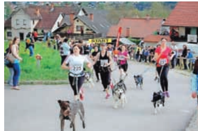
V Mekinjah so letos tekmovali tudi štirinožci.

so se pomerili na 500, 1000 in 2000 metrov, nato moški in ženske na pet kilometrov, najbolj vzdržljivi pa so se pomerili na 10-kilometrski progi. Najstarejši udeleženec je štel kar 75 let. Poleg tekačev je na progi nastopilo okrog trideset štirinožcev, ki so tekli poleg svojih lastnikov v disciplinah canicross ter bikejoring. Rezultate krosa si lahko ogledate na društveni spletni strani. ŠKD Mekinje se zahvaljuje prostovoljcem, donatorjem (posebna zahvala gre Občini Kamnik in podjetju Calcit), tekmovalcem ter tudi obiskovalcem, ki vsi skupaj prispevajo k vsakoletni tradiciji ter poskrbijo, da je dogodek vsako leto boljši.