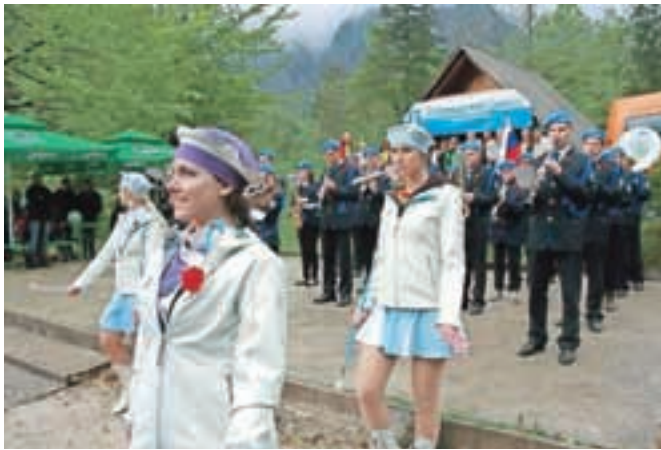
Kamniške mažoretke in člani Mestne godbe Kamnik na prvomajski proslavi v Kamniški Bistrici

naslednji praznik, dan dela. Prvomajsko praznovanje se je namreč začelo s tradicionalno budnico, ki so jo godbeniki začeli ob 3.30 na Glavnem trgu, zaključili pa ob 11. uri v Kamniški Bistrici. Na prizorišču tradicionalnega prvomajskega praznovanja se je zaradi slabšega vremena in splošnega vzdušja zbralo manj obiskovalcev,