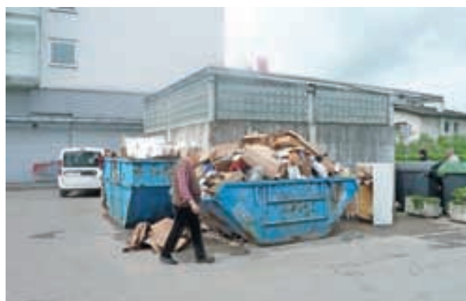
Neurejeni zabojniki za smeti pred Mercator centrom so v zadnjem času razburili kar nekaj Kamničanov.

Po odgovor smo se obrnili na upravnika stavbe, podjetje Aktiva upravljanje. Pojasnili so nam, da so s problematiko seznanjeni, da pa se zabojniki nahajajo na parkirišču, ki je v lasti Mercatorja, in ne na skupnih površinah, katerih upravnik so. »Za podrobnejše informacije se obrnite na družbo Mercator,« so nam vrnili žogico. In kaj pravijo v Mercatorju? »Na neurejene zabojnike smo opozarjali tudi mi. Z uporabniki zabojnikov (najemniki in stanovalci) bomo našli rešitev, ki bo primerna (združitev odlagalnih mest, namestitve dodatnih posod, zamrežitev). Ureditev bo izvedena takoj, ko bo mogoče,« so nam odgovorili.