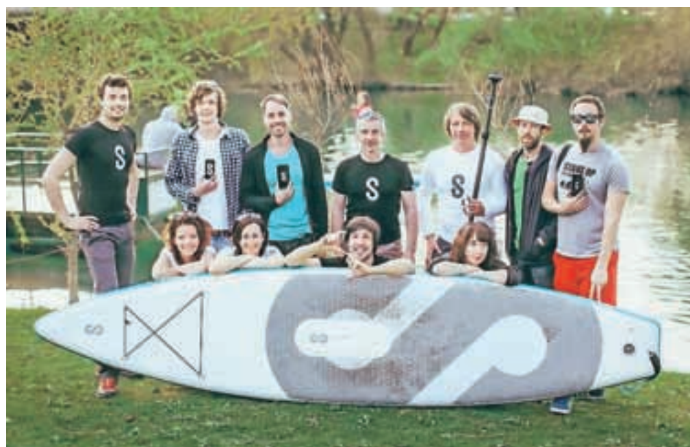
Ekipa SipaBoards, ki je v zgolj dveh tednih zbrala potrebnih 150 tisoč evrov za zagon proizvodnje prvega samonapihljivega supa na svetu.

Pretežno kamniška ekipa SipaBoards, ki sedaj sestavlja že petnajst sodelavcev, je v zadnjih mesecih trdega dela razvila prvi samonapihljivi sup z električnim pogonom, kar predstavlja novost na svetovnem tržišču. Prednost supa, ki je dobil ime po sipi, je v prvi vrsti v tem, da je primeren tako za začetnike in otroke kot tiste, ki še niso suvereni v stoječem veslanju. SipaBoards ima električno baterijo, katere moč sup najprej napihne, nato pa uporabniku olajša veslanje in mu omogoča do štiri ure vožnje. Skrit potisni motor na dnu supa pomaga tudi pri ohranjanju ravnotežja in smeri, vsi uporabniki pa si bodo lahko pomagali z motorjem, ki ga upravljajo z gumbom na veslu. Zložen