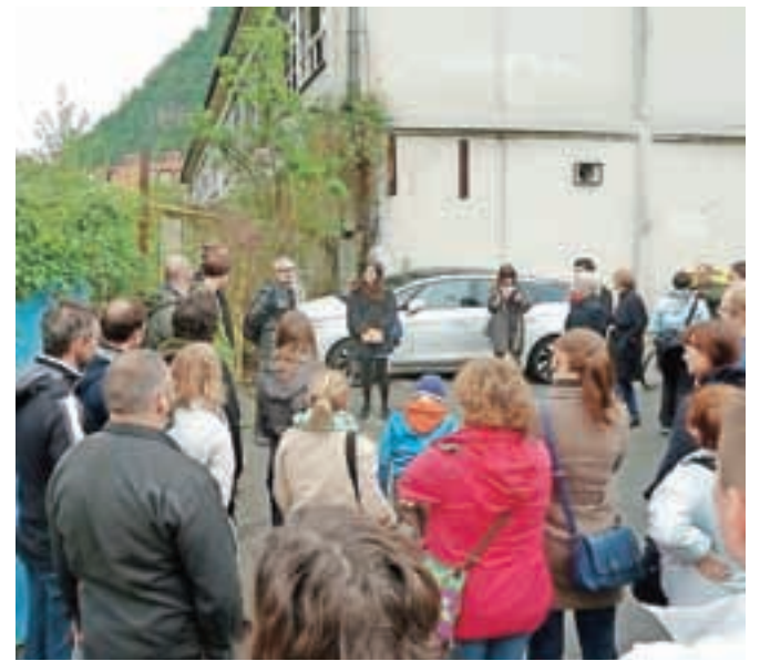
Udeleženci urbanega sprehoda pred podirajočimi se prostori nekdanjega Utoka