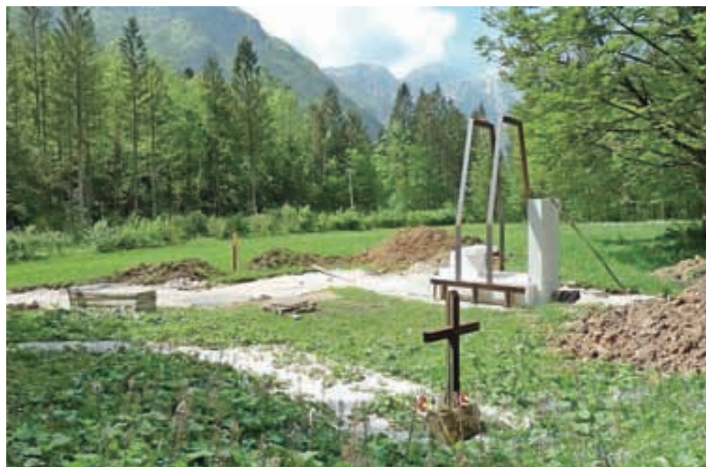
Spominsko sakralno obeležje na Kopiščih te dni že dobiva svojo končno podobo.