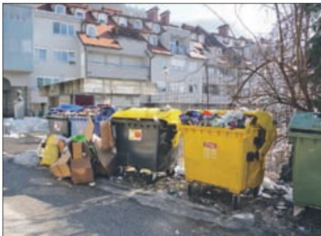
Čistilni akciji se bodo pridružila društva po vsej občini.