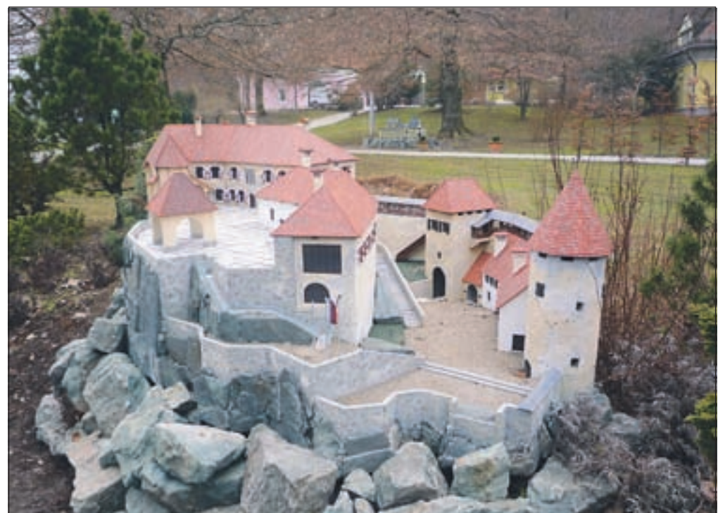
Maketa Blejskega gradu in druge miniature Minimundusa bodo na ogled do 6. aprila.

Volčji Potok - Tulipani in narcise še niso zacveteli, so pa zato park Arboretuma v teh dneh popestrile miniature Minimundusa, ki v Volčjem Potoku gostuje že nekaj let zapored. Na ogled je nekaj zanimivih maket stavb, ki so v svojem naravnem okolju prave turistične zanimivosti - stara mestna hiša v Pragi, sinagoga iz Gradca, portugalski stolp Belem, majhna vasica San Andres Xecul iz Gvatemale, OMV rafinerija iz Avstrije in mnoge druge. Pri