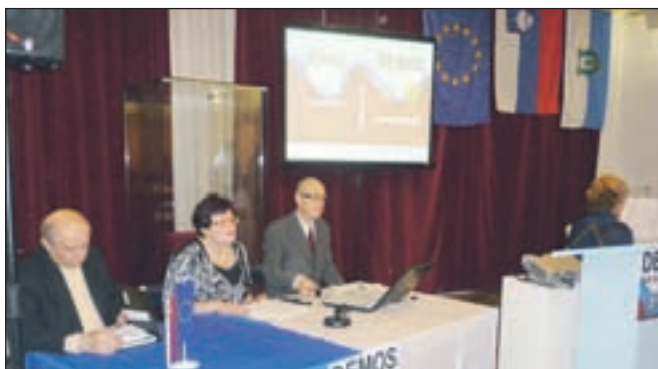
Zbornik bodo v prihodnjih dneh predstavili tudi v Komendi.