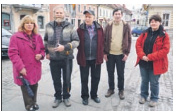
Udeleženci nedeljskega ogleda vodnih virov v dolini Kamniške Bistrice

lini, za katere še ne skrbi koncesionar, analize pa so pokazale, da voda v njih ni kakovostna.