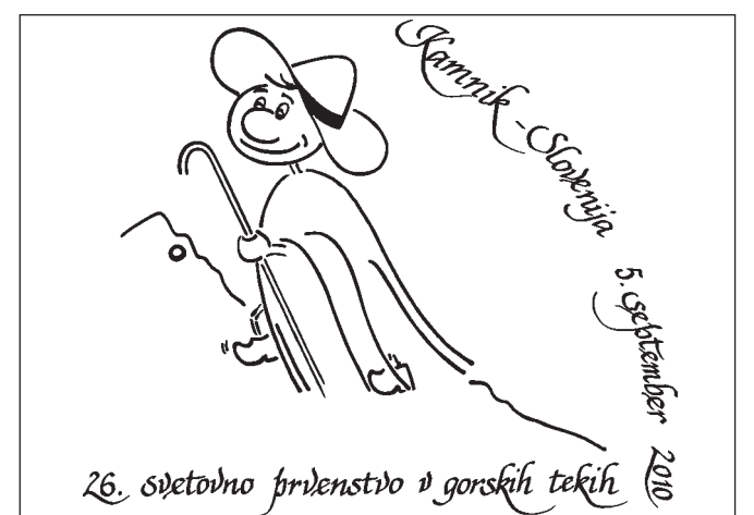
Za logotip svetovnega prvenstva v gorskih tekih, ki bo 5. septembra potekalo v Kamniku, so izbrali pastirja z Velike planine.

zaključek prvenstva bosta na Glavnem trgu v Kamniku, izbran pa je tudi uradni logotip, ki ga predstavlja pastir z Velike planine.