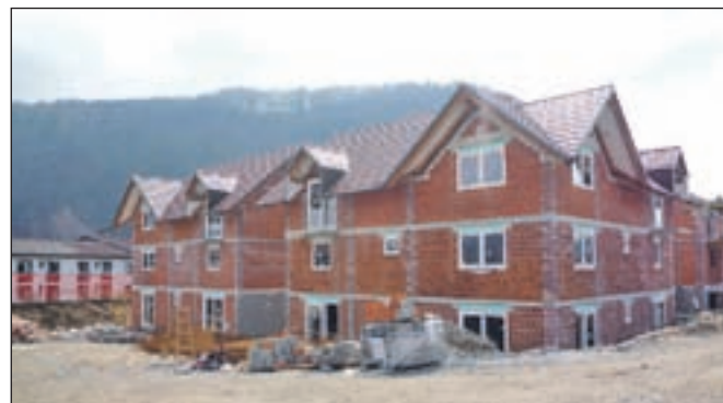
Stanovanja bodo vseljiva predvidoma septembra letos.

Gradnja tridesetih oskrbovanih stanovanj, ki jih je zasebni investitor v neposredni bližini doma starejših občanov začel graditi septembra lani, poteka po načrtih. Štirje objekti so zgrajeni, v teh dneh pa delavci že napeljujejo vse potrebne instalacije. Maja bodo javnosti predstavili prvo vzorčno opremljeno stanovanje, da si bodo kupci lažje predstavljali, kakšna je oprema, prilagojena starejšim in gibalno oviranim osebam. Zanimanje za nakup je sicer precejšnje, saj je rezerviranih že tretjina vseh stanovanj, ki bodo vseljiva jeseni, ko se bo gradnja skupaj z urejanjem okolice tudi zaključila. J. P.