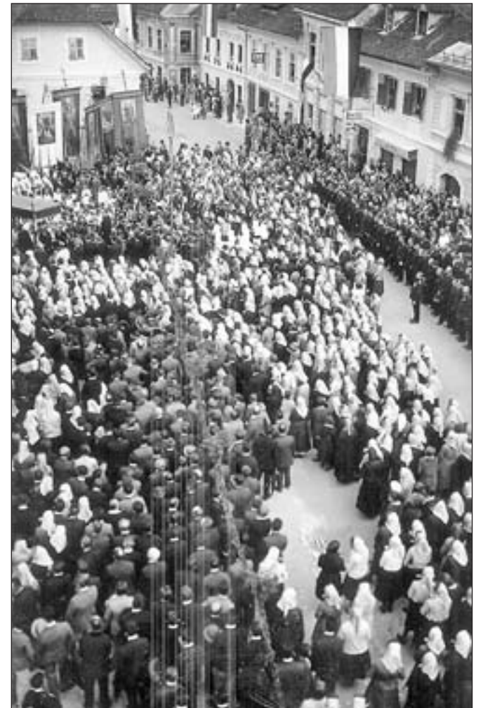
Odkritje spominske plošče Rudolfu Maistru na Šutni leta 1938