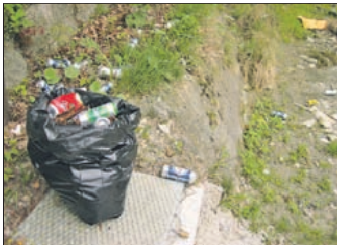
Cilj akcije je pobrati več kot 20 tisoč ton odpadkov.

Dodana vrednost akcije Očistimo Slovenijo v enem dnevu je popis črnih odlagališč in njihova sanacija, s čimer si organizatorji želijo dvigniti zavest občanov, naj odpadkov ne odlagajo v naravo in naj takšna odlagališča, če nanje naletijo, prijavijo. Občina Kamnik ima v letošnjem proračunu za čiščenje divjih odlagališč namenjenih 9.500 evrov, 600 evrov za odvoz opuščenih avtomobilov in 7000 evrov za organizacijo ekološkega ozaveščanja in ekoloških aktivnosti.