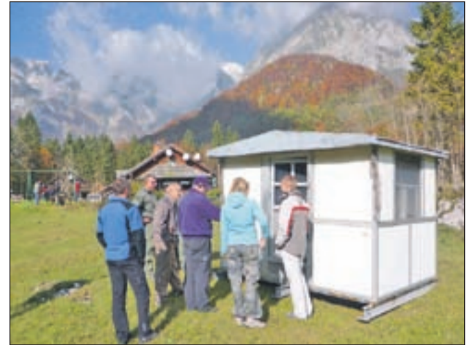
Stari bivak je po 36 letih svoje odslužil, a si kamniški planinci želijo, da konča v muzeju.

Kaj bodo s starim bivakom, se še niso odločili, menijo pa, da si zaradi svoje zgodovine zasluži mesto v kakšnem muzeju. Novi bivak, vreden 20 tisoč evrov, so kamniški gorski reševalci kupili s pomočjo donatorjev, a vsega denarja še niso uspeli zbrati. Vsi, ki jim želite pri tem pomagati, lahko svoja sredstva nakažete na transakcijski račun 02312-0035354472, sklic 2100.