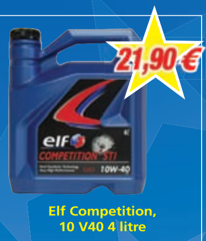
Elf Competition, 10 V40 4 litre