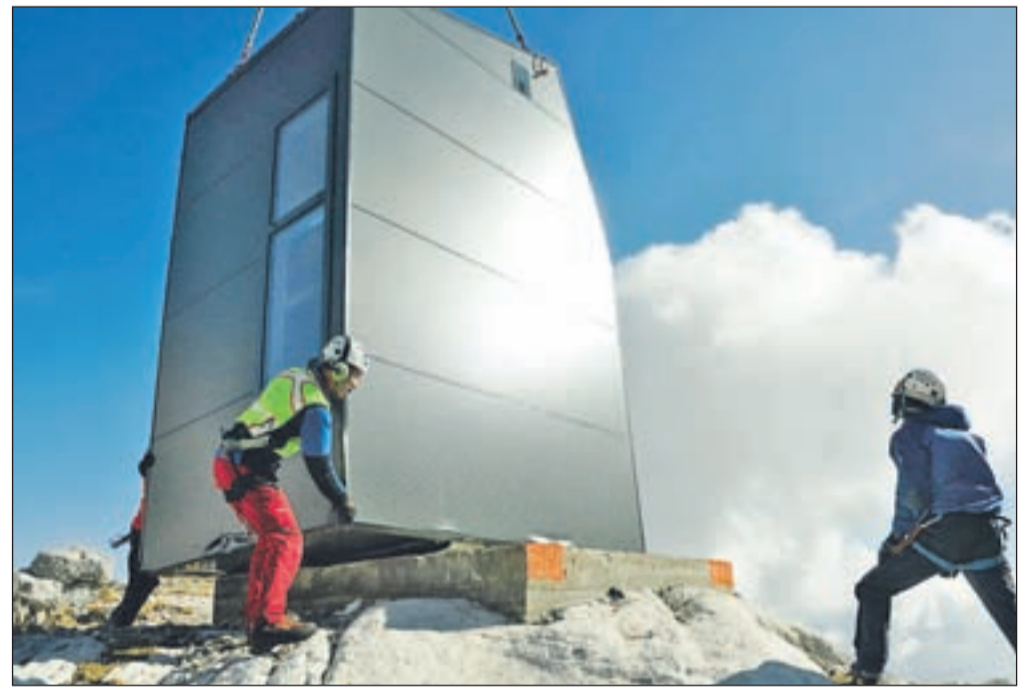
Bivak so položili na betonirane temelje, na mesto, kjer je stal že stari.