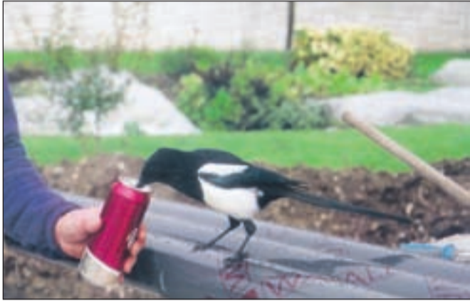
Sraka se v svojem domu in ob domačinih zelo dobro počuti, zato bi ji Tunjičani radi izbrali primerno ime.

Veliko zanimanja in navdušenja v zadnjih dneh po Tunjicah povzroča sraka, ki ne bi bila v tem okolju prav nič nenavadnega, če ne bi svojih novih sovaščanov ogovarjala in z njimi popila tudi kakšno pivo. "Sraka se je pred dvema tednoma pojavila od neznano kod, za svoje novo prebivališče pa si je izbrala nenaseljeno hišo na naslovu Tunjiška Mlaka 9f. Prav nič prijazna ni, saj svoje sosede ogovarja, pravzaprav zelo razločno zmerja z besedami, kot so 'koza', 'pusti me', 'pojdi stran' in podobno. Popije vse, kar ji damo, tudi pivo, moramo pa paziti na svoje stvari, saj je že ukradla denar in nekaj drugih predmetov. Očitno se pri nas dobro počuti, sploh zdaj, ko se ji je pridružil tudi partner, ki ga že uči besed," je tunjiško zanimivost opisal Valentin Zobavnik. Nad govorečo srako, ki se prav nič ne boji radovednežev in človeške družbe, so navdušeni predvsem otroci, imena pa ji še niso dali, zato zbirajo predloge. J. P.