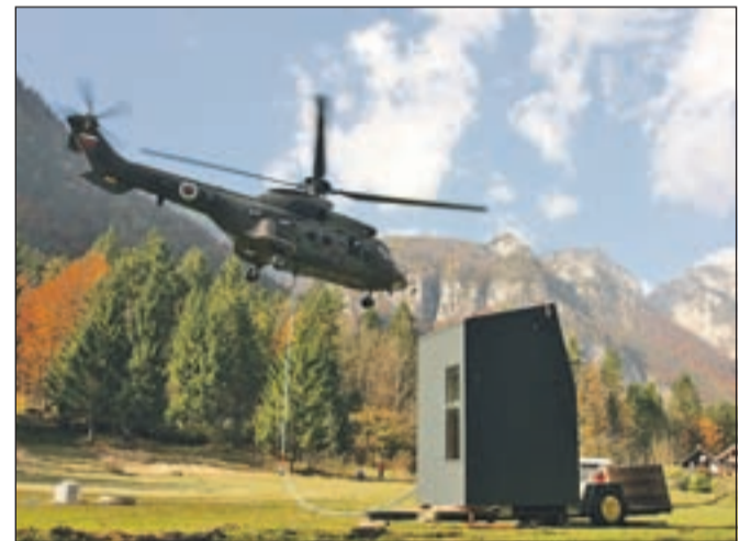
Bivak so pod Grintovec prepeljali s helikopterjem Slovenske vojske.