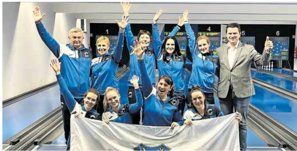
Kegljačice Calcita so celotno sezono dokazovale, da so najboljše.

Skozi celotno sezono so dokazovale, da so najboljše in jim ponovno osvojitve naslova lahko odvzame le poškodba kakšne izmed ključnih igralk. Na koncu so izgubile vsega dve tekmi, predvsem