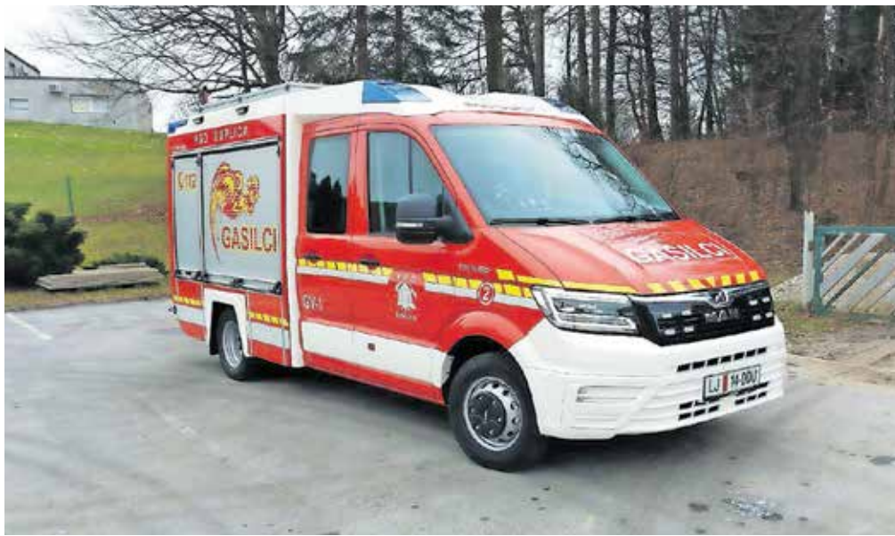
PGD Duplica je s pomočjo Občine Kamnik kupilo novo gasilsko vozilo GV-1.

Člani PGD Duplica si še nisimo dodobra opomogli in ni nam še uspelo zamenjati poškodovane opreme, ko so nas že prizadele katastrofalne poplave. Na srečo so bile na področju našega delova-