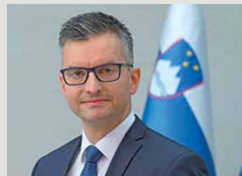
Marjan Šarec, minister za obrambo RS

general in pesnik Rudolf Maister - Vojanov, obranitelj slovenske severne meje, se je rodil 29. marca 1874 v Kamniku in umrl 26. julija 1934 na Uncu pri Rakeku. Leta 2024 tako zaznamujemo 150. obletnico njegovega rojstva in 90. obletnico njegove smrti. Kamnik ima tako še posebno čast, da njegov rojstni dan počasti kot občinski praznik. Rudolf Maister je bil v obdobju po drugi svetovni vojni prezrt in njegovega imena ni bilo zaželeno omenjati, kot to s ponosom počnemo danes. Vendar je bilo v Kamniku drugače, saj je Maister leta 1970 dobil veličasten spomenik, od leta 1995 pa njegov rojstni dan praznujemo kot občinski praznik. Zahvala gre modrim odločitvam vodilnih v Kamniku v omenjenem obdobju. Rudolf Maister ima velike zasluge za obstoj Slovenije v njenih današnjih mejah, brez kančka slabe vesti lahko trdimo, da brez njega danes države sploh ne bi imeli. Maister predstavlja najzlahtnejše, kar Slovenci premoremo. To sta naša vojaška tradicija, neločljivo prežeta z domoljubjem, in naša lepa slovenska beseda. Meč in pero sta nas ohranila skozi viharna obdobja naše zgodovine. Ni jih bilo malo. Maister je tisti, ki ne deli, temveč združuje. Je nasprotje vsem potem in stranpotem naše zgodovine ter nam zapušča bogato dediščino poguma in odločnosti, predvsem pa neizmerne ljubezni do domovine, ki je nikoli ne bi izdal in šel proti lastnemu narodu. Najmanj, kar lahko storimo, je, da mu izkažemo hvaležnost s svojo prisotnostjo ob njegovem spomeniku na praznik Občine Kamnik.