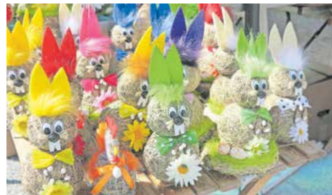
Na velikonočnem sejmu brez takšnih in drugačnih velikonočnih zajcev pač ne gre.