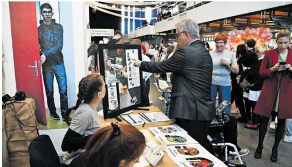
Minister Han na stojnici učnega podjetja iz Cirijska Kamnik

Celje – V učnem podjetju smo si letos izbrali slogan Oživljamo preteklost, beležimo sedanost, ustvarjamo prihodnost. Obiskovalcem smo ponujali skeniranje in retuširanje starih slik, fotografiranje različnih dogodkov, natis dragocenih slik na plakat ter ustvarjanje fotoknjig. Naš prodajni nabor pa smo obogatili še s ponudbo kreiranja slik s pomočjo umetne inteligence ter z možnostjo naročila magnetkov z osebno izbranim motivom. Za potrebe mednarodnega sejma smo izdelali tudi spletno stran, kjer smo ponudbo predstavili v številnih jezikih. Naše dejavnosti so bile letos nekoliko drugačne kot pretekla leta, vendar naše učno podjetje s svojimi aktivnostmi še vedno ostaja zavezano razvoju trajnostne ekonomije, ki omogo-