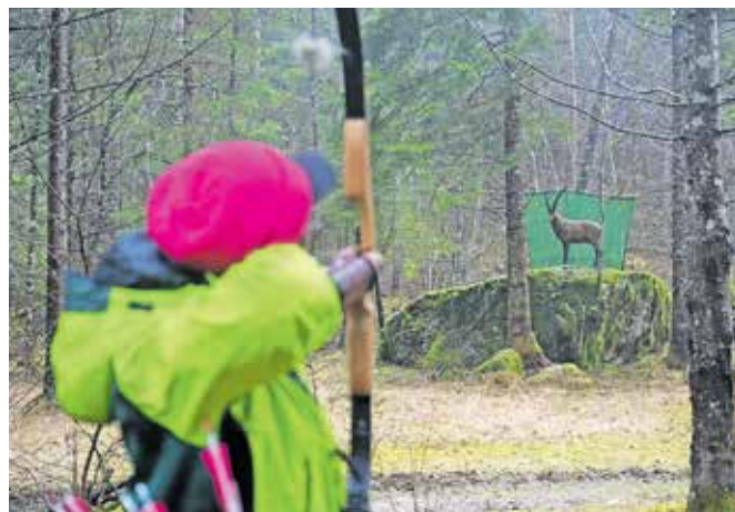
Tekmovanja se je udeležilo okrog sedemdeset lokostrelcev iz Slovenije, Hrvaške, Italije in Avstrije.

Lokostrelci tekmujejo v skupinah po štirje na tarčo. Po terenu je razvrščenih 28 tarč, ki so opremljene s številnimi in barvnimi količki, od koder se strelja na različnih razdaljah, odvisno od sloga in starostne skupine. Od belega količka streljajo najmlajši do 9. leta starosti,