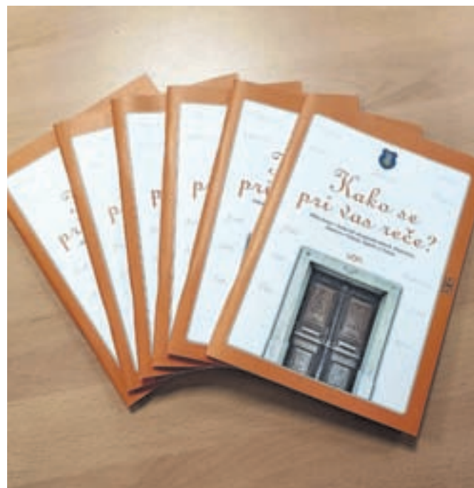
Knjižica predstavlja stara hišna imena na območju kamniške občine med Bučem in Motnikom.

Čeprav je bilo zbiranje hišnih imen na območju,