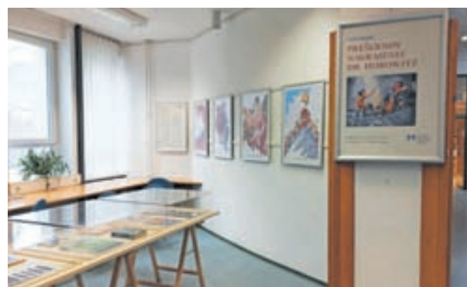
Razstava je na ogled v predverju kamniške knjižnice.