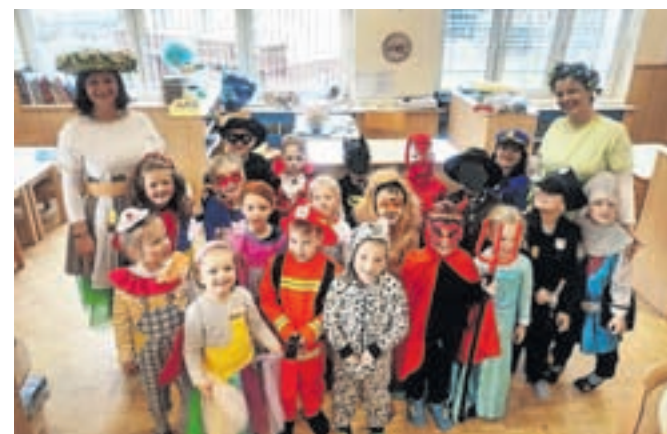
Pust v enoti Palček, Vrtec Antona Medveda Kamnik

V vrtec nismo prišli otroci in vzgojiteljice, temveč maskare. Po zajtrku smo posvetili pozornost še zadnjim detajlom poslikave obrazov in se fotografirali. Sledila je modna revija, kjer so se predstavile vse maskare. Nato smo se zbrali pred vrtcem, kjer so nas že čakale navdušene velike maskare – starši, babice in dedki. Število udeležencev, ki so se vabilu odzvali, je preseglo vsa pričakovanja! V dolgi povorki smo se odpravili po Šmartnem v Tuhinjski dolini in se ponosno pokazali vaščanom. Kakor vsako leto smo se tudi tokrat ustavili pri trgovini, kjer so nas že pričakovali in bogato pogostili. Prijazna lastnica je za nas spekla tudi krhke flancate. Družili smo se, poklepetali, se zahvalili za gostoljubje in vse dobrote ter se odpravili naprej. Pot nas je vodila do šolskega igrišča, kjer se je prava zabava šele začela. Iz zvočnika se je zaslislala glasba, ob kateri smo rajali, plesali in se veselili. Vzgojiteljice smo vse prisotne pogostile s krofi in vročim čajem.