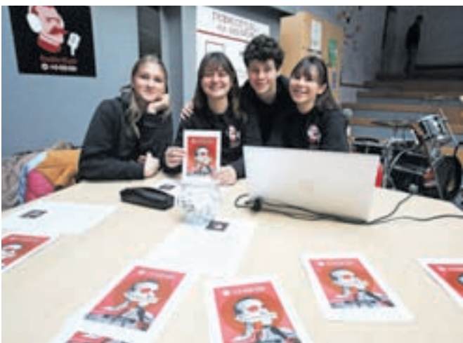
Na šoli uspešno deluje tudi radijska dejavnost – Radio Rudi.