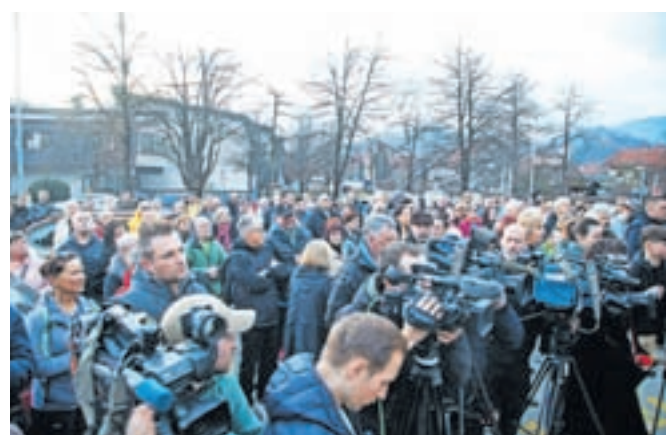
Veliko občanov Kamnika in Komende se je v ponedeljek zbralo na mirnem shodu.