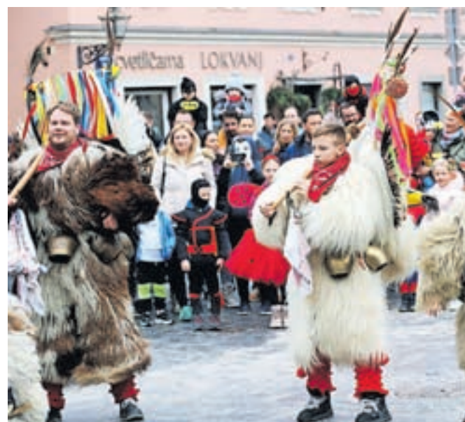
Koranti iz Zamušanov so že v soboto zavzeli Glavni trg.