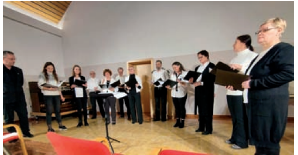
Komorni pevski zbor Šutna Kamnik

Številno občinstvo je zbor nagradilo z bučnimi aplavzi, mi pa se že veselimo novih projektov. Ob tej priložnosti v svoje vrste znova vabimo vse, ki imajo posluš in veselje do slovenske pesmi.