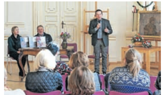
Knjigo Sporočilnost cvetic na slikah Narodne galerije so predstavili v Narodni galeriji Slovenije.

»Skozi tradicionalne načine uporabe smo Slovenci na