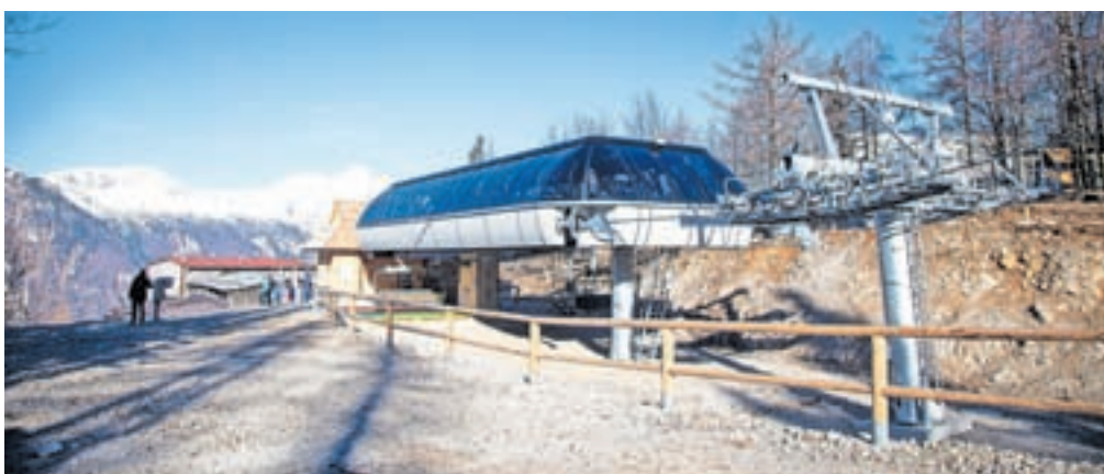
Spodnja postaja sedežnice na Šimnovcu