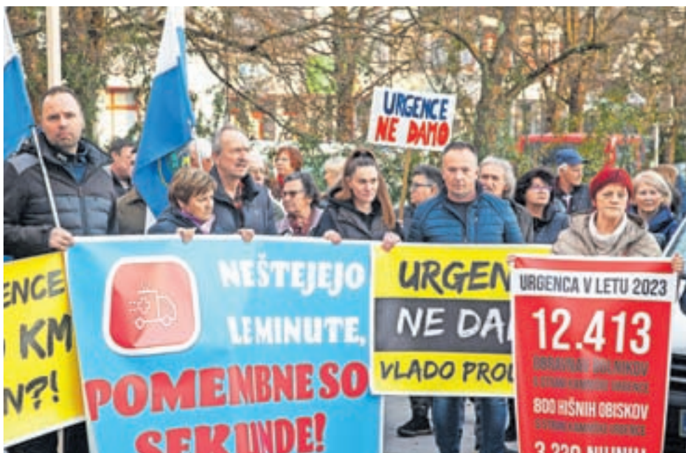
»Urgence ne damo,« so jasni občani.