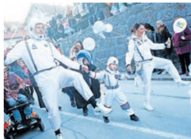
Med maskami je bilo tudi veliko družin.