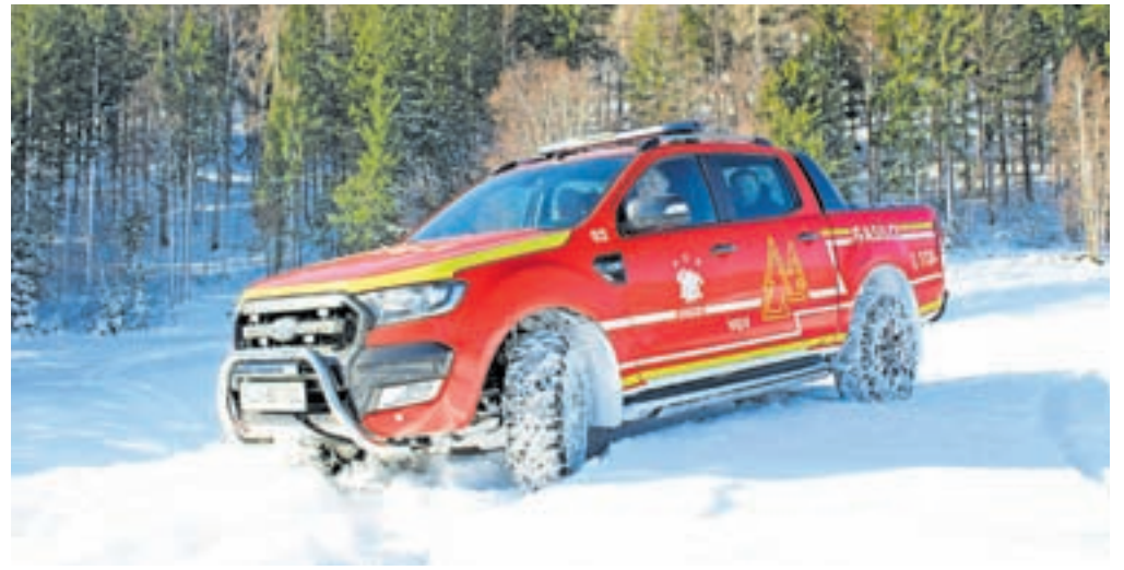
Novo večnamensko gasilsko vozilo PGD Gozd

Gasilci in gasilke PGD Gozd operativno pokrivamo razmeroma veliko in razgibano območje, ki zajema dolino Črne, okoliška naselja ter območje Male in Gojske planine. Območje je veliko več kot 22 kvadratnih kilometrov, v njem pa v desetih naseljih živi okrog 800 prebivalcev. Za uspešno posredovanje v vsakršnih razmerah je na tovrstnem terenu gasilsko vozilo s štirikolesnim pogonom nujno. To in pa pomanjkanje ponudbe kombijev s štirikolesnim pogonom pa je bil tudi razlog, da smo že aprila lani kupili rabljeno vozilo Ford Ranger Wildtrak s 3,2-litrskim motorjem, velikim tovornim prostorom, štirikolesnim pogonom in terenskimi zmogljivostmi. Vozilo, tudi če še ni bilo povsem »gasilsko«, je svojo uporabnost pokazalo že ob vseh večjih intervencijah v lanskem letu – v julijskih neurjih, avgustovskih ekstremnih poplavih in neurju ter v času jesenskih neurjih. Zaradi prostora za prevoz tovora in terenskih zmogljivosti je namreč ogromno pripomoglo k izvajanju intervencij in odpravi posledic omenjenih naravnih nesreč. Z avtom