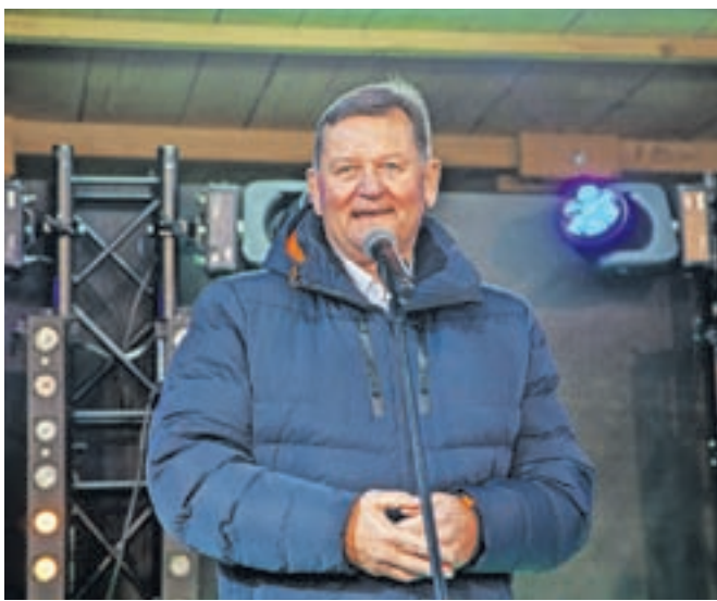
Zbrane je nagovoril tudi minister dr. Aleksander Jevšek.