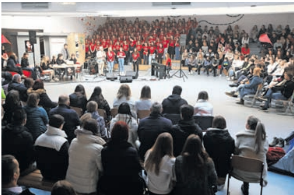
Odziv na petkov prvi termin informativnih dni prča o tem, kako veliko je zanimanje za kamniško gimnazijo in srednjo šolo.

»Vizija šole je postati najboljša izobraževalna organizacija, ki nenehno prepoznava potrebe in zahteve družbe po znanju in spretnostih ter se nanje odziva s kakovostnim izobraževanjem v stimulativnem in prijaznem okolju. Želimo postati visoko nadpovprečna šola po učnih dosežkih ter v rezultatih šolskih in obšolskih dejavnosti,« je zapisano na spletni strani kamniške gimnazije in srednje šole. Gimnazija in srednja šola Rudolfa Maistra Kamnik se lahko pohvali z nadpovprečnimi rezultati mature, v lanskem šolskem letu so pri povprečnih ocenah pri 14 od skupno 17 predmetov dosegli rezultate, ki so nad slovenskim povprečjem, imeli pa so tudi sedem zlatih maturantov na gimnaziji ter zlate tudi na strokovnih programih. »Naša dijakinja je bila tudi ena izmed sedmih, ki so pri strokovnem pred-