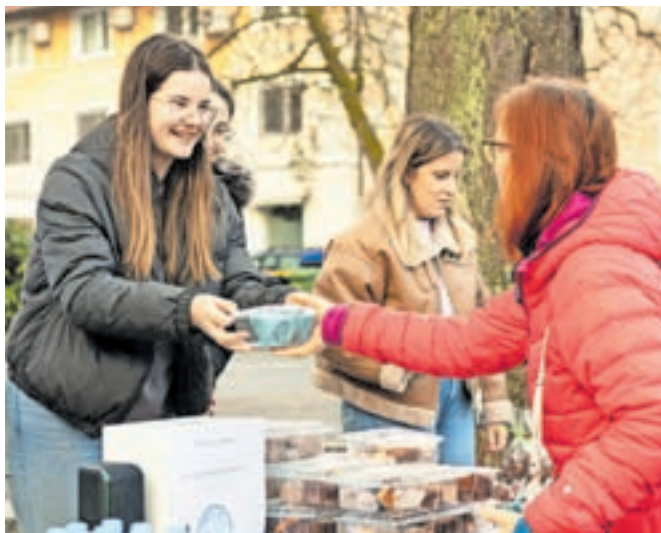
Utrinek z lanskoletne akcije Dobrodelni marec

Dobrodelno dogajanje v marcu bo v nedeljo, 3. marca, odprl Turnir v odbojki, ki bo potekal v Športni dvorani Kamnik (Osnovna šola Fra-