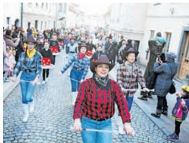
Povorko so vodile mažoretke in godbeniki.