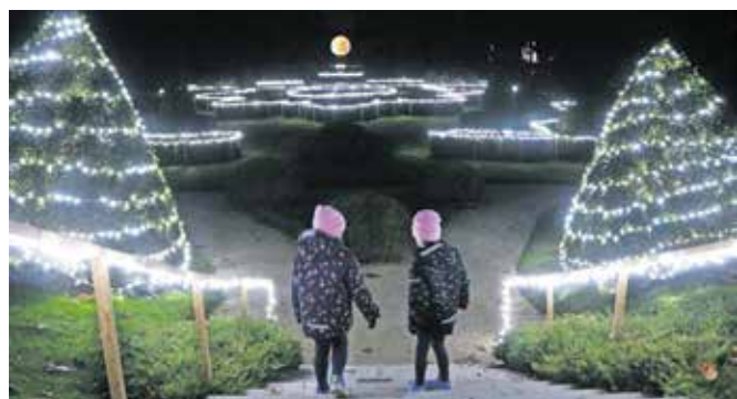
Predvsem najmlajšim večerni sprehod med lučkami spodbudi domišljijo.