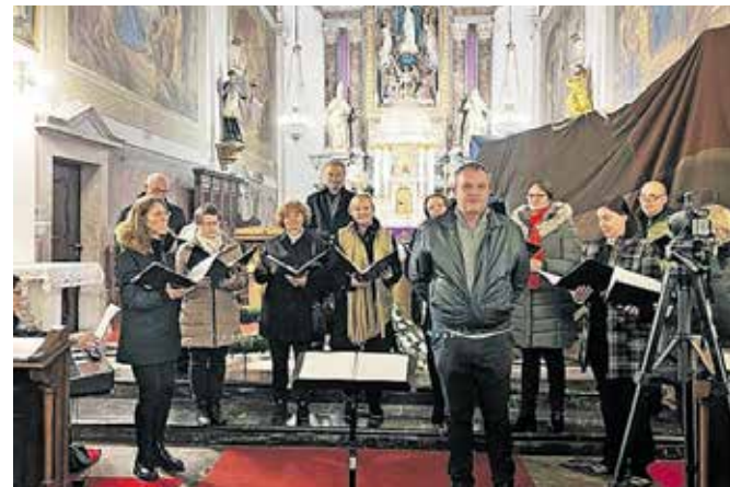
Koncert v cerkvi Marijinega brezmadežnega spočetja na Šutni

Kamnik – Nekako na sredini adventa smo in dan je skoraj dvakrat krajši kot noč, k slabšemu počutju pa v nižje ležečih krajih pripomore tudi megla. Ni čudno torej, da se tako zelo veselimo lučk, ki dodatno razsvetljujejo mesta in naše domove ter napovedujejo skorajšnje izboljšanje. Pevci Komornega pevskega zbora Šutna se tudi veselimo! In sicer vsakoletnega srečanja s pevskimi prijatelji v cerkvi Marijinega brezmadežnega spočetja na Šutni. Z njimi ne zaznamujemo le Marijinega praznika, ampak tudi prijateljstvo ljudi dobre volje in ustvarjanja pevskih harmonij. Tokrat smo se družili s Polanskimi dekleti, ki so odprle večer. Zapele so tri pesmi ob kitarski spremljavi. Domači zbor se je predstavil s tremi Marijinimi pesmimi. Da smo lahko prisluhnili milozvočnim melodijam citer, se lahko