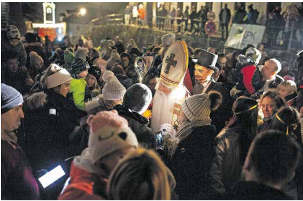
Miklavžev obisk je razveselil otroke.

Že v začetku decembra so otroci kamniških šol in vrtcev okrasili božična drevesca, med katerimi se lahko sprehodijo obiskovalci Šuťne. Glavni trg zaseda drsališče, ob odprtju pa so otroci kamniških vrtcev pripravili tudi novoletni bazar. Želje so oddali v Božičkov nabiralnik, pisma pa so s posebno