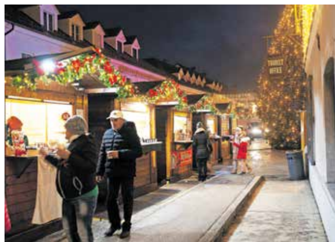
Božično-novoletni sejem, na katerem je mogoče najti tudi lokalne izdelke za obdaritev.