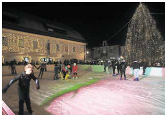
Na drsališču najbolj uživajo otroci.

V četrtek, 28. decembra, bo najprej ob 19.30 na sporedu skupina Jet Black Diamonds, ob 21. uri pa bo sledil nastop zasedbe Mrfy. V petek, 29. decembra, bo srca ogrela Nina Pušlar s svojo skupino in predskupino AR'n'BI. V soboto, 30. decembra, bo temperaturo dvigovala Tanja Žagar, nato pa z nedelje na ponedeljek sledi še silvestrovanje na prostem z domačim ansamblom Galop. Odštevanju do novega leta bo sledil ognjemet.