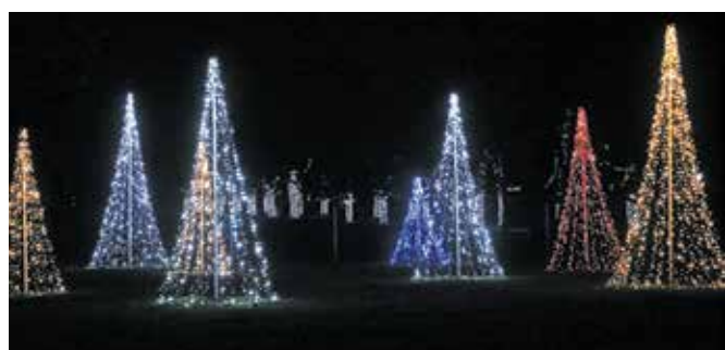
Čarobni gozd

Sprehod med lučkami obiskovalca popelje od enega do drugega prizora, možen pa bo vse do drugega tedna v januarju.