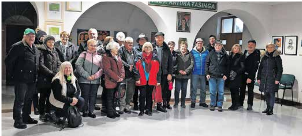
Člani društva na ekskurziji