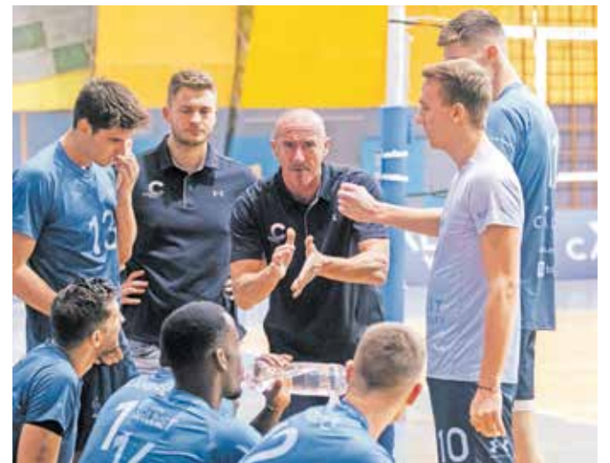
Odbojkarje jutri čaka pomemben obračun.

Vse pohvale si zaslužijo tudi odbojkarice druge članske ekipe Calcita Volleyja, ki so osvojile prvo mesto v 1. B DOL za ženske, in to z veliko prednostjo pred Krimom. Kamniške princeske bodo pod vodstvom Tjaše Gadža sezono nadaljevale v zeleni skupini, v kateri bodo še ATK Grosuplje iz 1. A DOL za ženske ter Krim, Šentvid in Braslovče iz 1. B DOL za ženske. Ali bodo v zeleni skupini igrali tudi odbojkarji druge kamniške moške