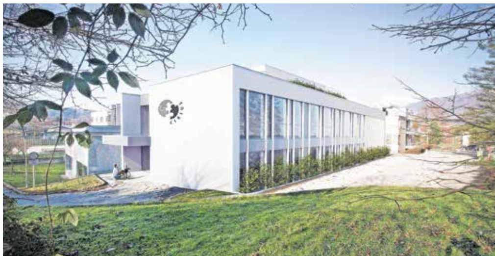
Dodatne prostore bodo začeli uporabljati z novim šolskim letom.

Z novim prizidkom bodo rešili prostorsko stisko, saj se bodo na ta način sprostili nekateri prostori, ki jih zdaj zaseda poseben program vzgoje in izobraževanja. »V zadnjih letih beležimo konstanten vpis otrok in mladostnikov. Se pa s prostorsko stisko za program, za katerega se gradijo prostori, spopadamo že zadnjih osem let. Z novimi prostori bomo predvsem zagotovili dobre pogoje za vzgojno-izobraževalno delo in dobro počutje tako otrok kot zaposlenih,« so nam še pojasnili na Cirusu Kamnik. Ustanova z daljšim imenom Center za izobraževanje, rehabilitacijo in usposabljanje Kamnik deluje od leta 1947 in predstavlja osrednjo državno izobraževalno rehabilitacijsko ustanovo za gibalno ovirane otroke in mladostnike in tiste, ki imajo poleg gibalne oviranosti še druge posebne potrebe.