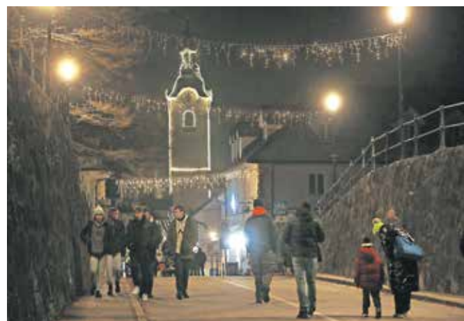
Praznično osvetljeno mesto

pošto odpotovala na Laponsko. Sledil je prižig lučk na božični smreki in praznične okrasitve, ki je razsvetlila stari del mesta.