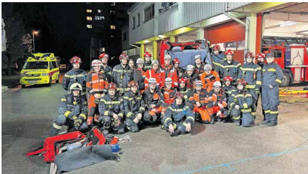
Eno od izobraževanj je potekalo pri gasilskem domu PGD Kamnik.

Drugo skupno strokovno izobraževanje se je odvijalo na bodočem izobraževalnem poligonu pri gasilskem domu PGD Kamnik, kjer smo kamniški gasilci pripravili izobraževanje na temo tehničnega reševanja v primeru prometnih nesreč. Izobraževanje je bilo razdeljeno na dve delovni točki. Na prvi delovni točki se je obravnavalo reševanje poškodovanih oseb, vključno z ukleščeni-