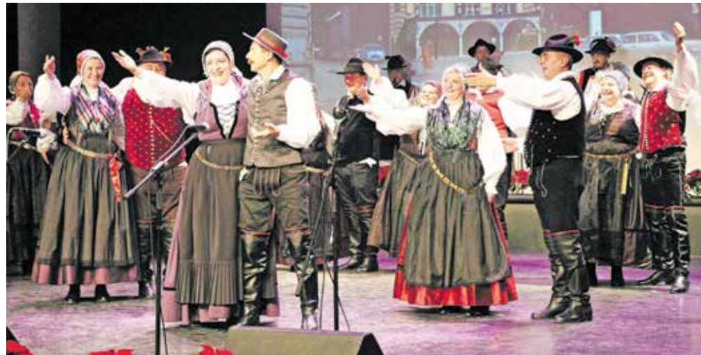
Ples in glasba izpod kamniških planin, folklorna skupina Kamnik

zaplesali člani Mladinske folklorne skupine Račna. Vodja se v napovedi pohvali, da so ponosni na svoje mladince, da kljub modernim časom ohranjajo tradicijo – delujejo od leta 2003. Plešejo plese iz cele Slovenije, najraje pa imajo tiste iz osrednjeslovenske regije. Približno enako let delovanja imajo tudi drugi gosti – Folklorna skupina Spomin Društva upokojencev Sevnica. Čeprav niso več najmlajši, so dokazali, da se lahko kosajo z marsikatero drugo folklorno skupino. To dokazujejo tudi ocene strokovne komisije na tekmovanjih pod okriljem JSKD. Čeprav njihovi plesi niso več tako zelo poskočni, so gledalcu vseeno všečni in prislužili so si velik aplavz.