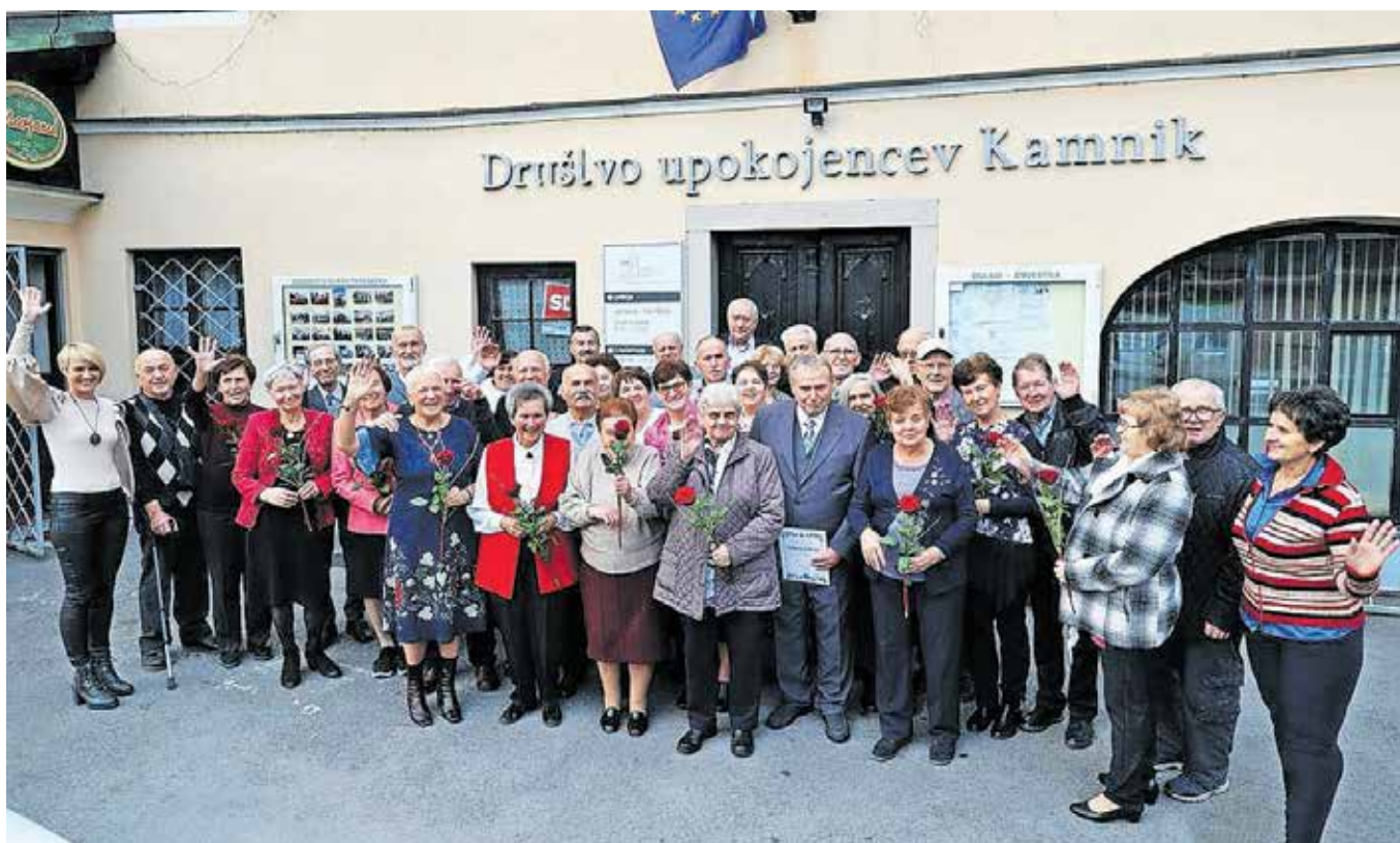
Letošnji jubilanti