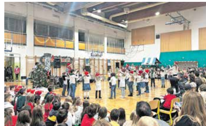
Učenci so obiskovalcem pričarali praznično vzdušje.

3683,56 evra. Denar je v celoti namenjen šolskemu skladu Osnovne šole Stra-