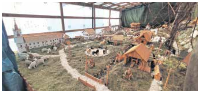
Jaslice Antona Podjeda

Godič – V Godiču je ponovno na ogled razstava jaslic Antona Podjeda, ki vabi obiskovalce, da doživijo čarobnost božične umetnosti. Razstava je odprta na naslovu Godič 81c, Stahovica, vsak dan med 10. in 19. uro. K. P.