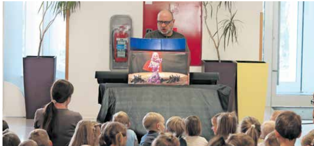
Premierno izvedbo predstave Vitez, zmaj in jezero so spremljale vse skupine otrok v vrtcu Zarja.