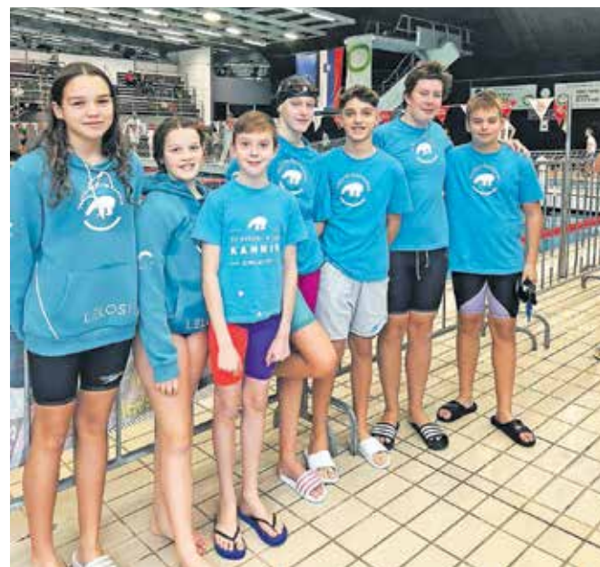
Mladi kamniški plavalci na Mišovem memorialu