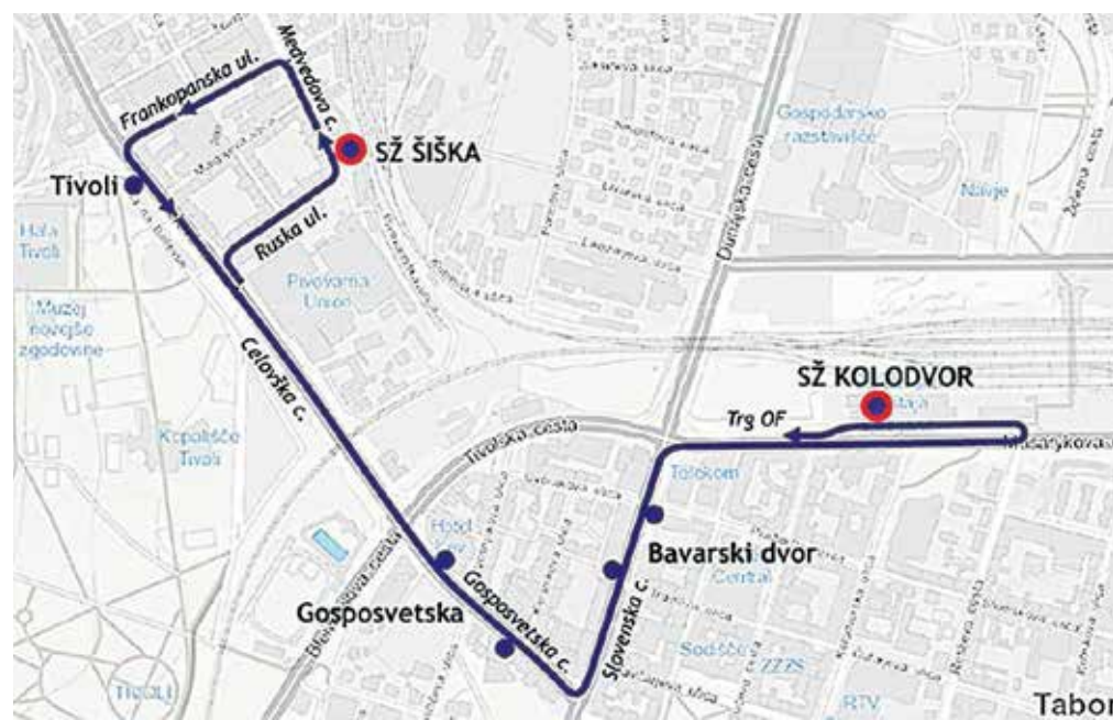
Trasa nove avtobusne povezave med glavno železniško postajo in postajo Ljubljana Šiška

Zaradi prenove železniške in gradnje nove avtobusne postaje, ki se začne v Ljubljani, je v Ljubljani precej sprememb v prometu. Poleg zapore Dunajske ceste je prilagojenih tudi več tras in vozni redov vlakov in avtobusov. Na Slovenskih železnicah so tako že vzpostavili začasno novo postajališče Ljubljana Šiška, ki bo izven prometnih konic končna postaja tudi za kamniški vlak. Kot pojasnjujejo na Slovenskih železnicah, na progi Kamnik Graben-Jarše Mengeš-Domžale-Ljubljana Šiška-Ljubljana ob delavnikih vozil 48 vlakov, od tega 19 do oz. s postaje Ljubljana Šiška. Vsi vlaki, ki bodo vozili do oz. s postaje Ljubljana Šiška, imajo tudi povezavo z novo linijo Ljubljanskega potniškega prometa SŽ Šiška-SŽ Kolodvor. Gre za integrirano ponudbo, ko vo-