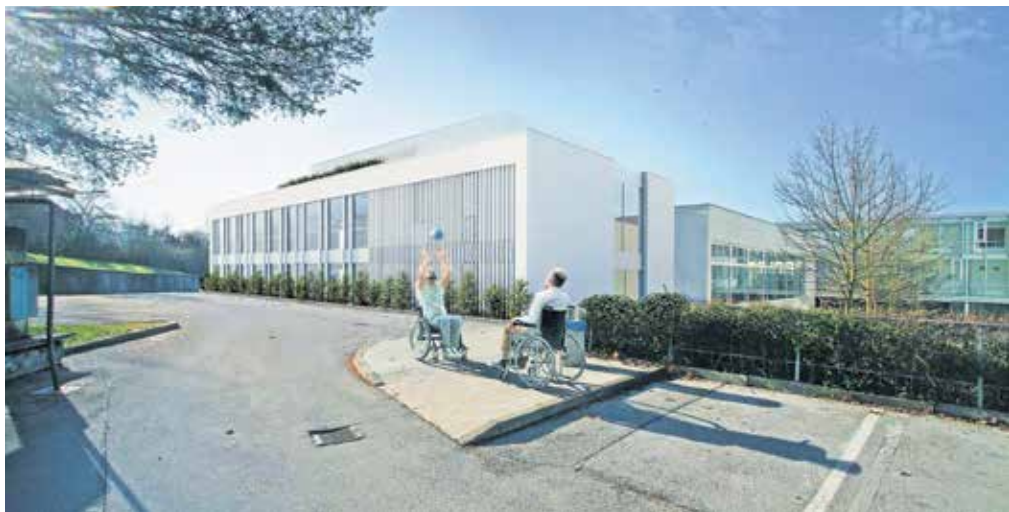
Investicija v nove prostore znaša skoraj štiri milijone evrov.

V objektu v dveh etažah bo šest novih učilnic, po tri v vsakem nadstropju, vsaka pa bo imela tudi sobo za počivanje in jih bodo zaradi gibljivih notranjih sten lahko povezali v en prostor. V vsakem nadstropju bodo sanitarije s previjalnico, v objektu bodo tudi soba za razgovore, soba za umirja-