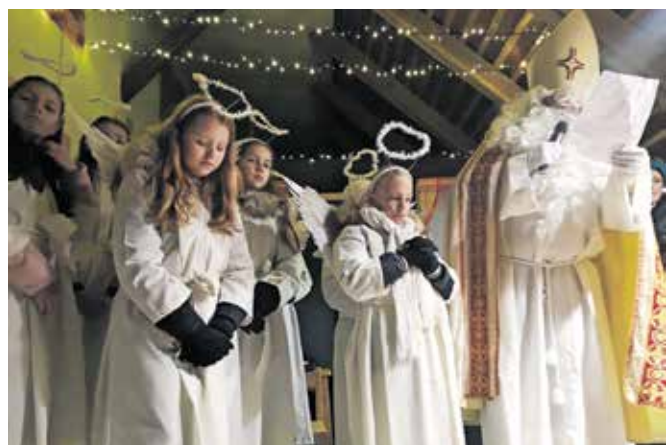
Miklavž v Nevljah