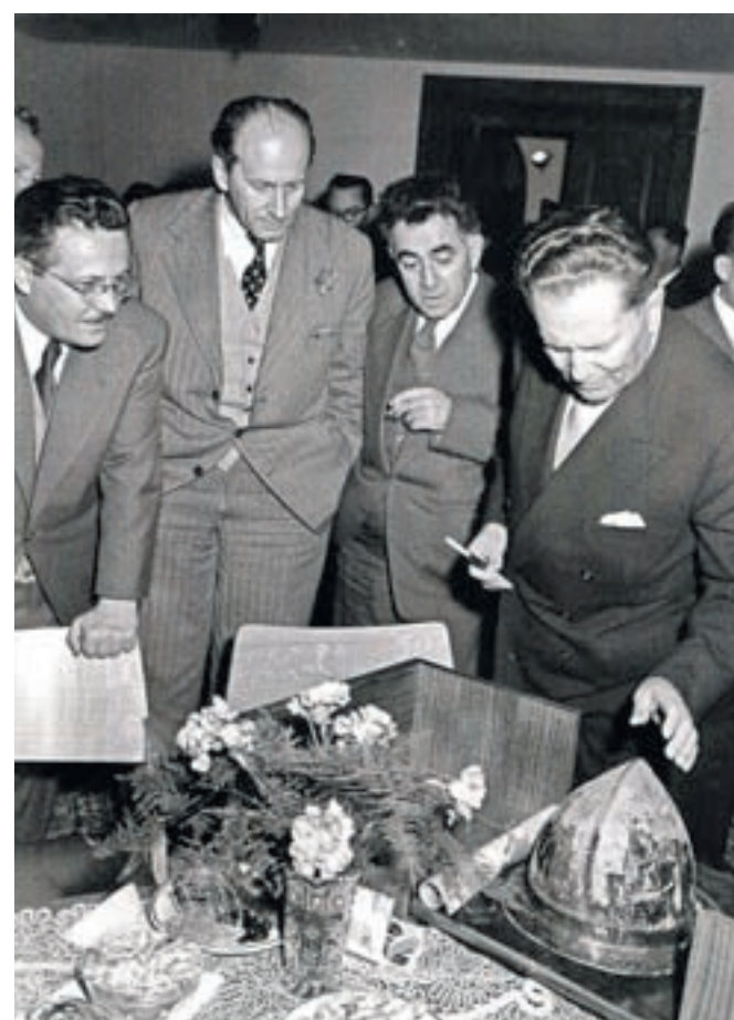
Tito si ogleduje čelado; Grm pri Novem mestu, 23. 11. 1958

Jeseni leta 1958 so k Sadnikarjevim prišli predstavniki novomeške občine, da bi izbrali predmet, ki ga bodo podarili Josipu Brozu - Titu. V oči jim je padla opisana čelada. Kupnina zanjo je znašala 250.000 dinarjev. Dne 23. novembra 1958 so jo na Grmu pri Novem mestu na slavnostnem odprtju Ceste bratstva in enotnosti poklonili tedanjemu predsedniku Jugoslavije. Originalna čelada je razstavljena v Muzeju 25. maja v Beogradu, kjer hranijo protokolarna darila, ki jih je Tito prejel v dar po vsem svetu. Od leta 2020 imamo svojo kopijo originalne čelade tudi v kamniškem muzeju. Razstava z zgodbami treh čelad in drugimi arheološki-