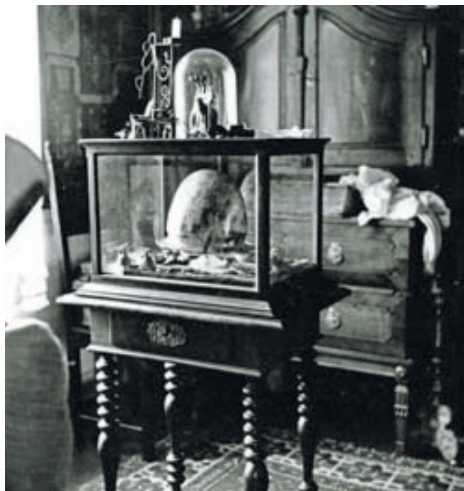
Vitrina z arheološkimi predmeti in čelado, ko je bila še v Sadnikarjevi zbirki

ga muzeja Kamnik, Narodnega muzeja Slovenije in Dolenjskega muzeja Novo mesto.