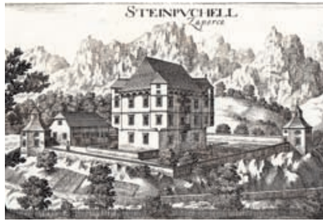
Graščina Zaprice, iz Valvasorjeve Slave vojvodine Kranjske, 1689