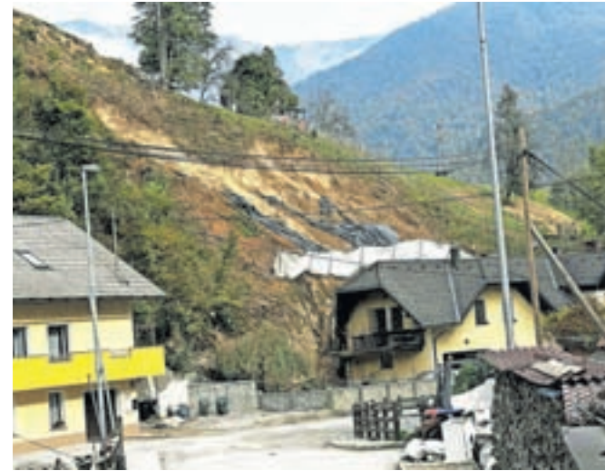
V občini potekajo sanacije plazov.

Kot še dodajajo na kamniški občinski upravi, pa tudi na plazovih, kjer so zaradi ugotavljanja geomehanske sestave tal potrebne raziskovalne vrtnice, že tečejo dela, saj v najkrajšem možnem času želijo zagotoviti, da bodo občani lahko varno živeli v svojih domovih.