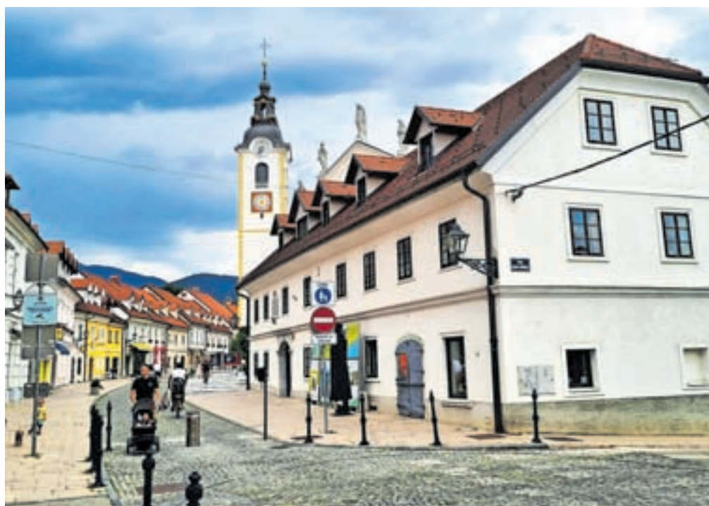
Obisk turistične destinacije Kamnik je bil v poletnem trimesečju letošnjega leta za dobrih 23 odstotkov manjši kot v enakem obdobju lani.

Tudi podatki za prvih osem mesecev nakazujejo na upad turistov. Kamnik je namreč v prvih osmih mesecih tega leta obiskalo 23.462 turistov (lani v istem obdobju 28.743), od tega 6177 domačih (lani 10.580) in 17.285 tujih turistov (lani 18.163). Po številu prihodov je bilo največ turistov iz Hrvaške, Nemčije, Češke, Italije, Francije, Nizozemske, Belgije, Madžarske, Avstrije, Poljske, Bolgarije in Izraela. Podatki kažejo, da je v prvih osmih mesecih pri kamniških namestitvenikih prenočilo skupaj 57.638 turistov (lani 72.234), od tega 13.607 domačih (lani 27.192) in 44.031 tujih turistov (lani 45.042). Na Kamniškem najpogosteje prespijo turisti iz Češke, Nemčije, Hrvaške, Italije, Nizozemske, Francije, Madžarske, Izraela, Bel-