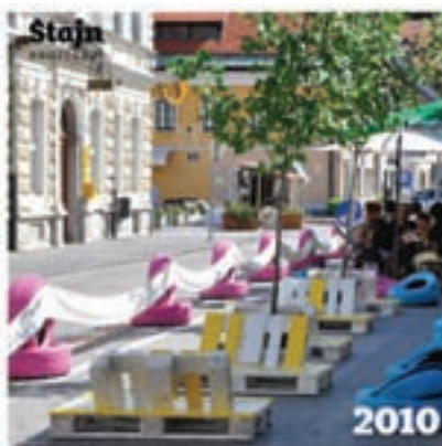
Intervencija skupine Štajn v Kamniku leta 2010

Predstavljajte sičasne urbane vrtove, ulične poslikave, t. i. pop-up kioske ali premično urbano pohištvo. To je taktični urbanizem! Sodobni pristop k oblikovanju mest, ki s preizkušanjem preprostih in začasnih sprememb na ulicah, trgih in parkih ustvarja živahnejše in prijetnejše mesto. Kamniku intervencije taktičnega urbanizma niso tuje. Skupina Štajn je že v letu 2010 razvila Urbani test – projektni pristop k novim prostorskim investicijam . Na podlagi izkušenj začasnih ukrepov taktičnega urbanizma in s skupnim sodelovanjem Občine Kamnik ter lokalne skupnosti smo uvedli