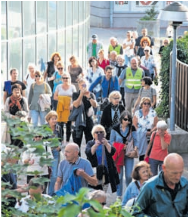
Skozi središče mesta se je sprehodilo precejšnje število krajanov.

Kot nam je povedala predsednica krajevne skupnosti Ivanka Učakar, si krajanje prizadevajo za celovito obnovo kompleksa Malega gradu, med dolgoročnimi načrti pa je tudi ureditev rojstne hiše Franca Pirca, ki jo je občina odkupila pred nedavnim. »Hiša je zelo pomembna za oživitve rova pod Malim gradom, v krajevni skupnosti pa upamo, da bi tam lahko