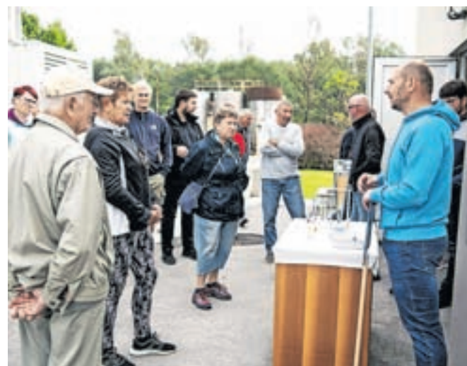
Dneva odprtih vrat se je udeležilo okoli dvesto obiskovalcev.

dala direktorica, bo v prihodnjem desetletju tako treba čistilno napravo nadgraditi na četrto stopnjo čiščenja. »Iz odpadne vode, ki je zdaj prečiščena 96-odstotno, bo