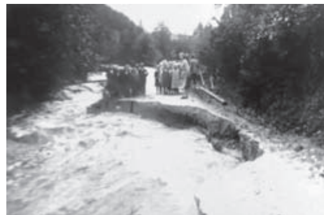
Na obrežju Bistrice v Stranjah

Pisali so tudi o res nujni regulaciji: »Razmere nas silijo, da se regulacije resno popri-