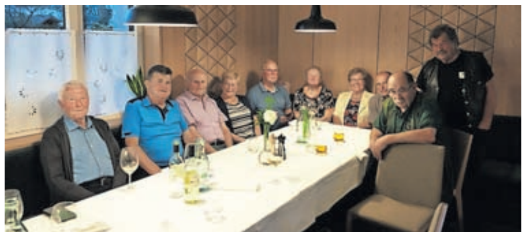
Na praznovanju častiljive obletnice

Vrhpolje – V nekoliko okrnjenem številu smo se v petek, 22. septembra, zbrali v gostišču Repnik na Vrhopolju nekdanji sošolci in sošolke, ki smo leta 1953 prestopili prag neveljske osnovne šole. Letos namreč obhajamo častljivo obletnico – 70 let, odkar smo začeli nabirati znanje v radožive otroške glavnice. Ob snidenju smo se kar malo spogledovali, saj nam je zob časa krepko spremenil zunanji videz. Žal se je kar nekaj sošolk in sošolcev zaradi boleznih moralo prezgodaj posloviti s tega sveta. V spomin nanje in na pokojne učitelje smo jim naklonili trenutek tišine, zanje bo darovana tudi spominska maša v neveljski cerkvi. V sproščenem pogovoru ob prigrizku in pijači smo obujali spomine na tiste čase. Ugotavljali smo, da nam je