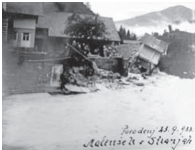
Posledice povodnji pri Malenškovi v Stranjah

Kamniška reka Bistrica in njeni pritoki so pokazali svojo silno moč tudi v prejšnjih desetletjih. V časopisih smo zasledili novico o divjanju Nevljice 23. septembra leta 1893, ko se je nad Tuhinjsko dolino utrgal oblak. Na mo-