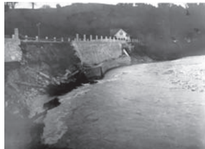
Cesta v Stranjah

zemljišč, prestavila na mnogih mestih strugo in ogrožala hiše in številna industrijska podjetja vzdolž struge.« Nekateri problemi so očitno večni.