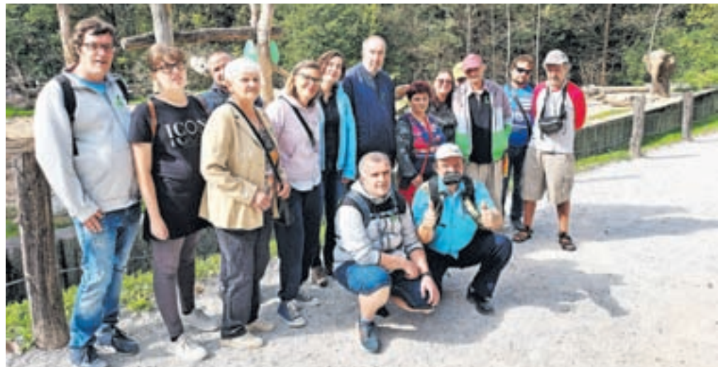
Uporabniki DC Štacion so obiskali ljubljanski živalski vrt.