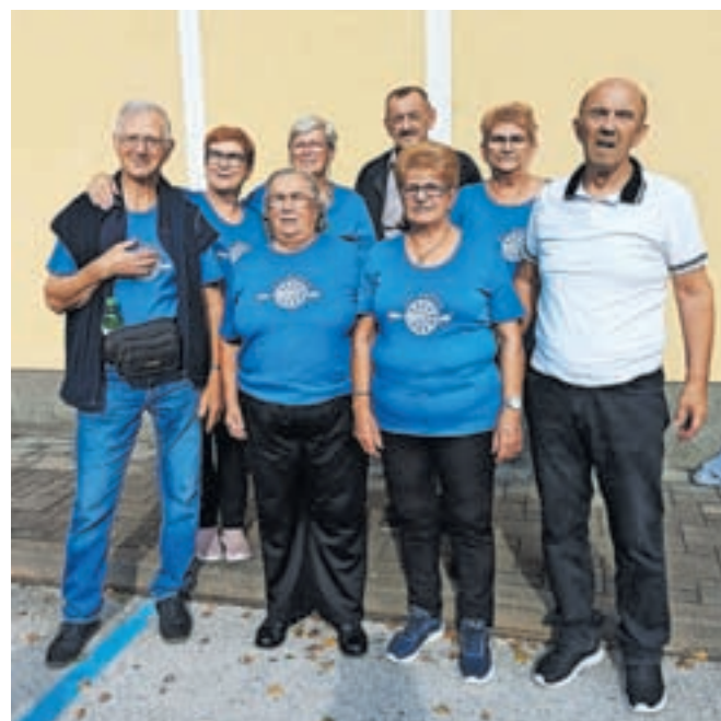
Kamniški udeleženci tekmovalja

Letošnje državno prvenstvo je bilo v sredo, 4. oktobra, v Škocjanu na Dolenjskem.