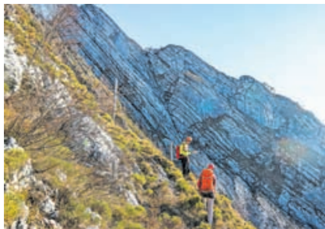
V gorah Karnijskih Alp