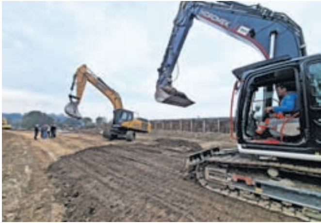
Na območju Šmarce gradijo nasip v dolžini tristo metrov.

Kot so ob tem sporočili s kamniške občinske uprave, nasip gradijo iz gramoznega materiala in tesnijo z glinenim jedrom. »Centralno glinasto jedro je širine en meter na koti krone in globine približno 1,5 metra oziroma do kote talne vode. Vgradnja glinice se izvaja v plasteh z ustreznim komprimiranjem,« so še sporočili. Dela izvaja podjetje Hidrotehnik. Projektantska ocena stroškov intervencijskega nasipa znaša 672.179 evrov.