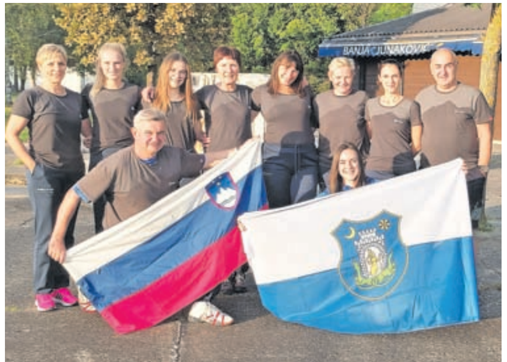
Kamniški kegljači so odlično nastopili v Apatinu.