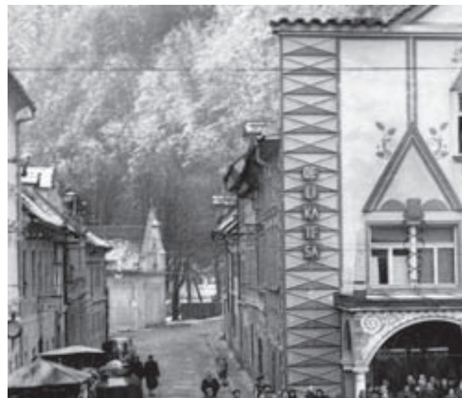
V tej imponantni zgradbi so leta 1963 odprli prenovljen lokal Delikatesa. Ponojal je tudi legendarno francosko solato in šunknen žemljice.

soč brisač, podjetje Usnje soudeležbo pri gradnji stanovanjske barake v vrednosti 330.000 dinarjev, podjetje Kamnik je prispevalo 128 odej in prijavilo 120 krvodajalcev.