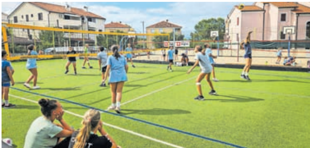
Odbojarski tabor Calcita Volleyja na Krku

»Tabor smo izkoristili tudi za uvodne treninge v novo sezono. Otroci so trenirali dvakrat dnevno, treningi pa so bili prilagojeni starosti in znanju udeležencev. Imeli smo tudi predavanje o športni prehrani in življenju športnika. Dnevi na taborih tako hitro minevajo. Izjemno sem vesela, da smo se vrnili z nasmehi na obrazih. Srečna sem, da lahko delam z mladimi in obetavnimi špor-