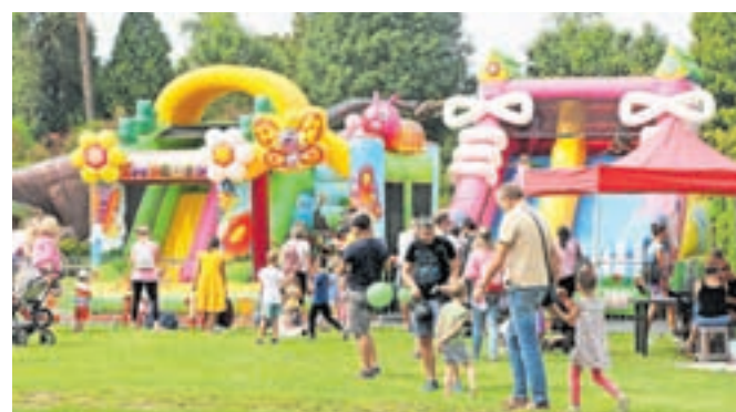
Dežela napihljivih igral / FOTO: ALENKA BRUN