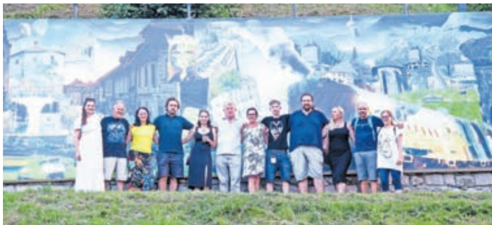
Razstava je na ogled še do konca septembra.

tu ob razstavi sprašujejo avtorji, ki so se, podobno kot lani pri projektu Veronika, tudi tokrat ustvarjanja lotili s kolektivnim pristopom. Interpretacijo končnega izdelka sicer prepuščajo gledalcem, mesto v spremnem tekstu pa so dali tudi orodju ChatGPT, ki je »ocenil«, da so skozi ustvarjeno delo želeli izzvati »obenem smeh in razmislek«. Ali jim je zares uspelo, se na lastne oči lahko prepričate še do konca septembra.