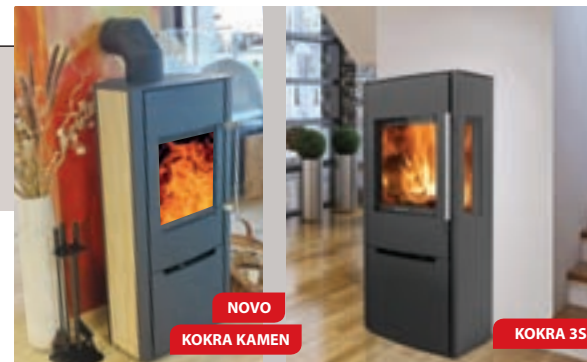
NOVO KOKRA KAMEN