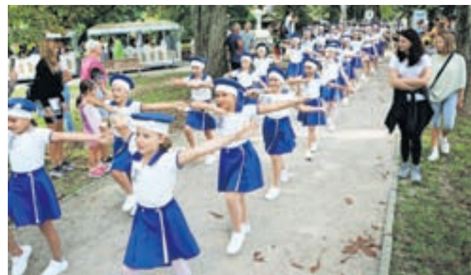
Kamniške mažoretke med uvodnim sprehodom od vhoda parka do glavnega odra