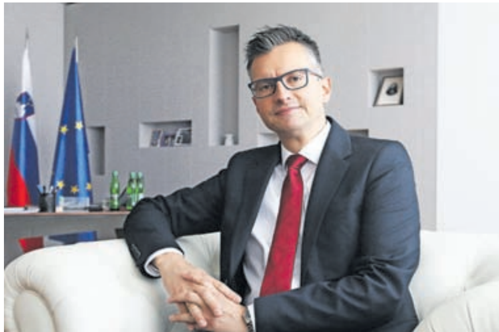
Minister za obrambo Marjan Šarec

Zagotovo se bo kaj našlo, o tem bomo spregovorili na državni analizi, podobno kot po lanskem požaru na Krasu. Vse pomanjkljivosti bomo v prihodnje poskusili čim bolj odpraviti.