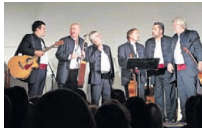
Klapa Mali grad

Na začetku smo postavili klasično klapsko zasedbo osmih pevcev, in to je trajalo kar nekaj let. Medtem se je zamenjalo kar nekaj pevcev, nekaj jih je žal tudi umrlo. Danes nas je šest, upamo pa, da nas bo kmalu več, da se bomo lahko zopet lotili tudi zahtevnejših skladb. Svoj jubilej bomo zaznamovali s koncertom v dvorani Kulturnega doma v Kamniku 30. septembra, s podporo