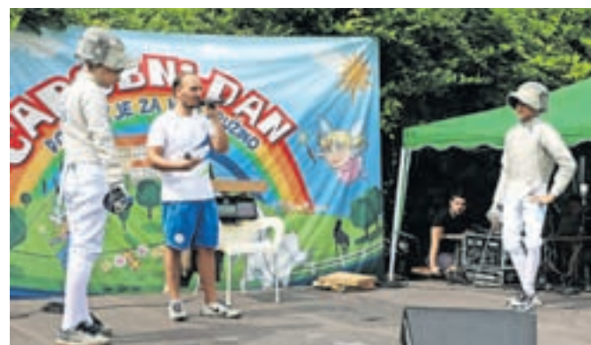
Predstavili so tudi sabljanje.