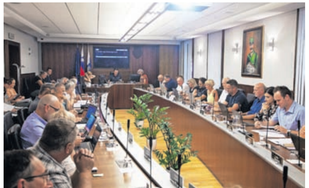
Svetniki so soglasno potrdili rebalans proračuna.

Svetniki, ki so se oglasili v razpravi, so pohvalili kvaliteto izvedeno intervencijo in požrtvovalno delo gasilcev ter ostalih služb, ki so sodelovale. Nekateri so sicer izrazili obžalovanje, da je pri določenih projektih prišlo do zmanjšanja proračunskih sredstev. Svetnica Bojana