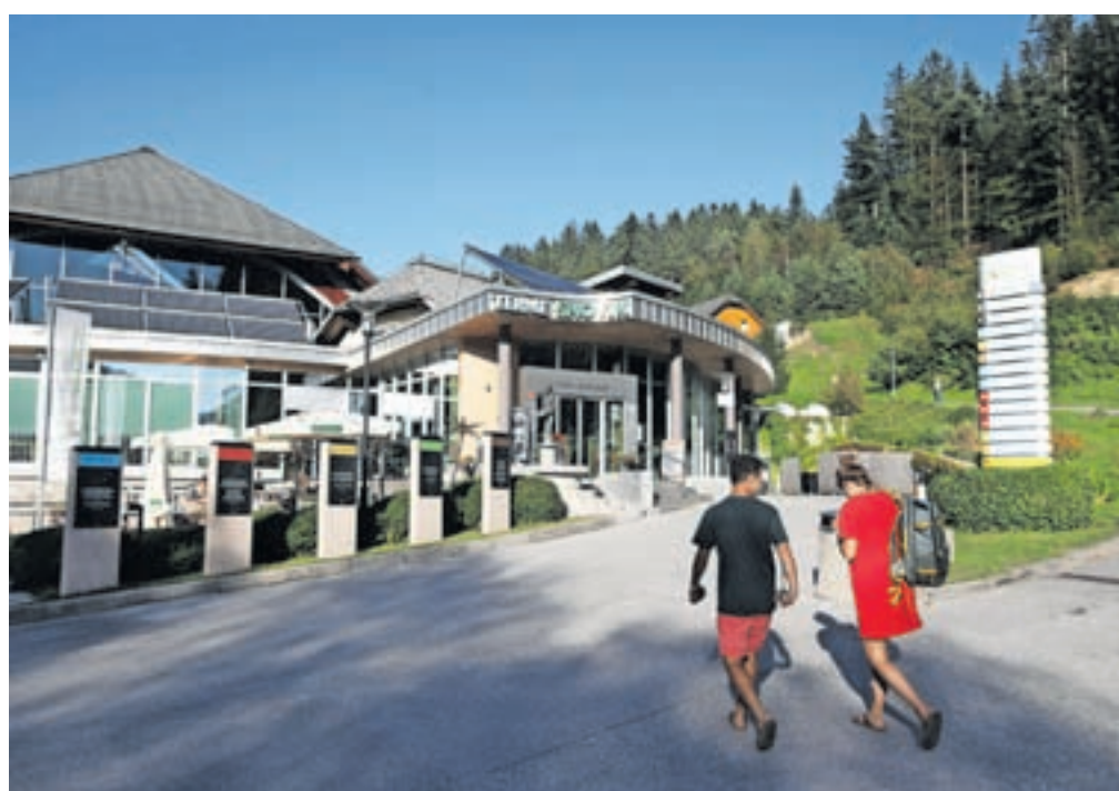
Terme Snovik

V hotelu naj bi bilo 120 ležišč, tri dvorane (razvijati želijo tudi segment kongresnega turizma), restavracija, recepcija za hotelske in apartmajске goste ... Idejne rešitve so družbenikom, lokalni skupnosti, občini in drugim predstavili konec lanskega leta. »Zdaj imamo na papirju izkristalizirano idejo, s katero smo bili uspešni tudi v postopku spre-