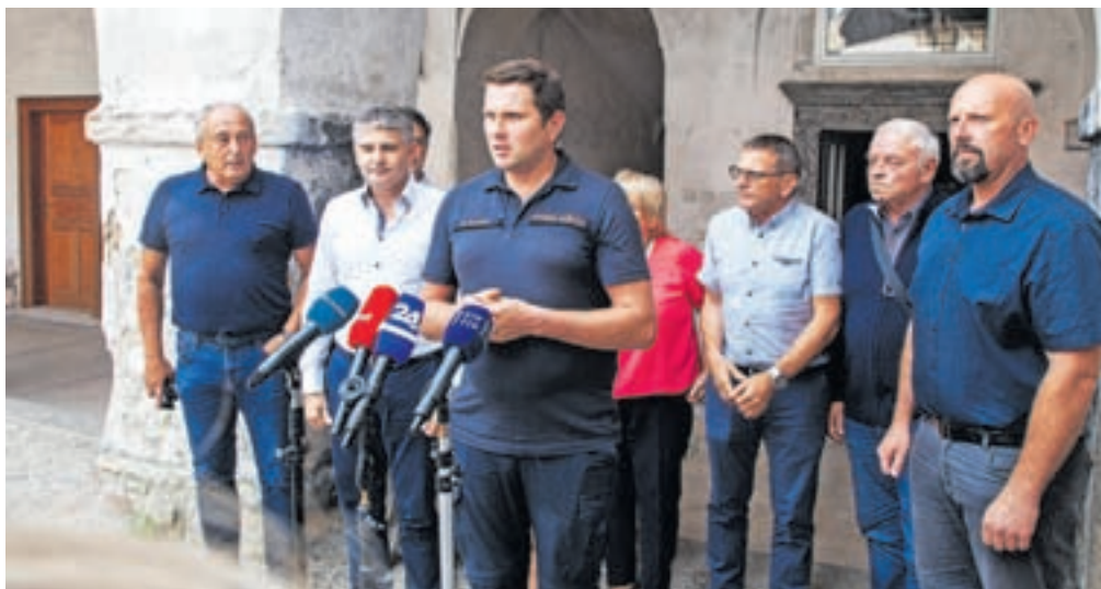
Župani porečja Kamniške Bistrice so vladi predlagali ukrepe za hitro in učinkovito sanacijo po poplavih.

Razpravljali so o ukrepih, ki so potrebni, da bi čim prej začeli sanacijo poplavljenih območij. Izoblikovali so tudi pet sklepov. Poleg tega, da so se zavzeli za podaljšanje roka za vnos škode v sistem, so vlado pozvali, naj zagotovi zadosti finančnih sredstev za poplačilo vseh interven-