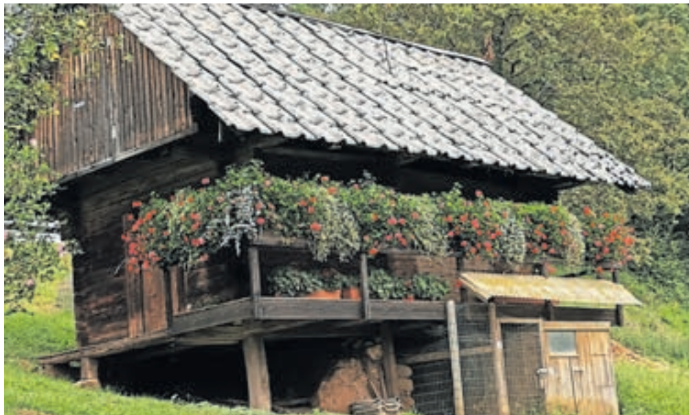
Urejena okolica ter cvetoči balkoni in okna so pika na i pri videzu hiše.