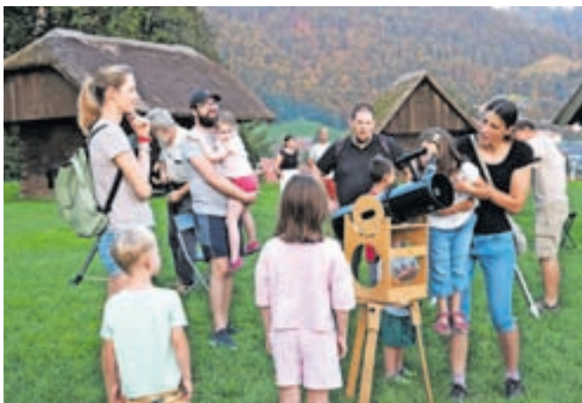
Poletni večer z opazovanjem nočnega neba je privabil zlasti družine z otroki.