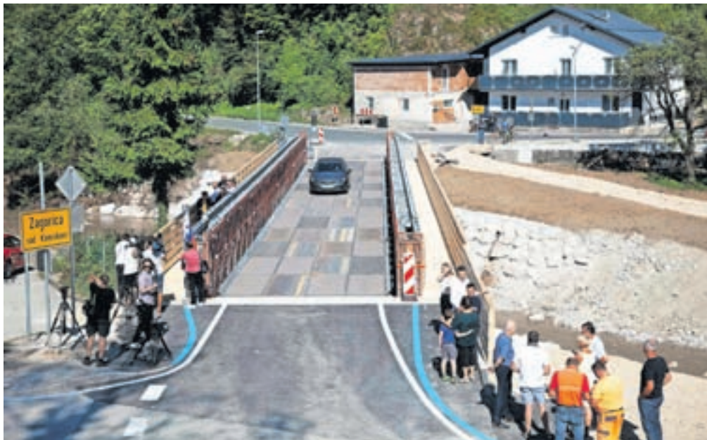
Investicija v montažni most je znašala šeststo tisoč evrov.

»Vsi skupaj smo dokazali, da se v kratkem času lahko naredi ogromno. Čaka nas še ogromno dela in sa-