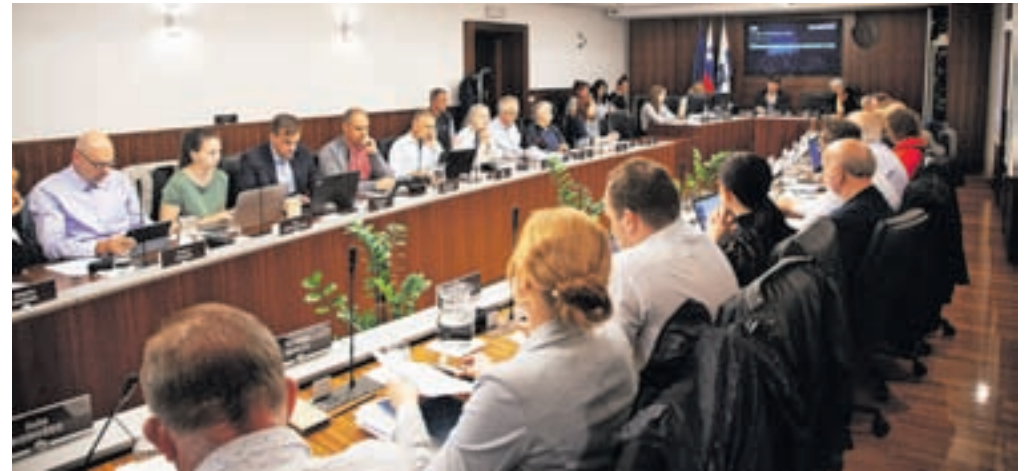
Konec maja so se svetniki zbrali na četrti redni seji v tem mandatu.

Na področju zagotavljanja varnosti cestnega prometa so policisti obravnavali 1590 kršitev, kar je 30 odstotkov manj kot leto prej. Manj je bilo kršitev prekoračitev hitrosti, prekomerne uporabe alkohola in kršitev pri uporabi varnostnega pasu. Kot ugotavljajo na kamniški policijski upravi, upad tovrstnih kršitev kaže na čedalje večjo ozaveščenost udeležencev cestnega prometa. Na območju občine so se lani zgodile 204 prometne