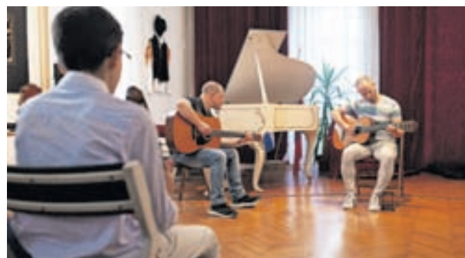
V šoli se uči tudi nekaj odraslih, a so se le redki opogumili za nastop pred publiko.

slih, ki so za inštrument poprijeli v kasnejših letih. »Nastopila je velika večina naših učencev. Vse namreč spodbujamo, da čim več nastopajo in se na ta način znebijo treme, kar jim lahko prav pride tudi na drugih področjih življenja,« je povedal Skalar, ki pravi, da je zanimanje za igranje inštrumentov vsako leto večje, medse pa bi lahko sprejeli še več učencev, če bi imeli na voljo dovolj učiteljev.