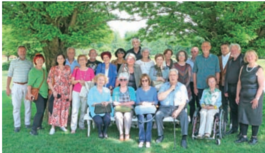
Gimnazijci so se ob petinpetdeseti obletnici mature tokrat srečali v Arboretumu Volčji Potok.