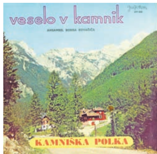
Naslovnica plošče Veselo v Kamnik, 1965

V drugi polovici šestdesetih let 20. stoletja se je začela zmagoslavna pot te pesmi.