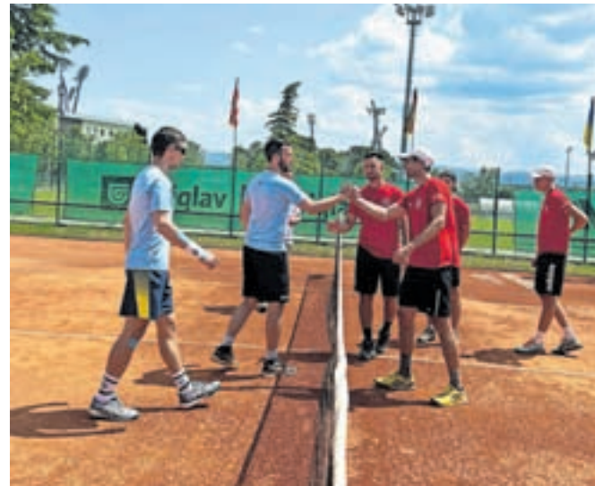
Igralci Tenisa kluba Kamnik so se uvrstili v zaključno tekmovanje najboljših štirih ekip, ki nastopajo v 3. slovenski ligi za člane.