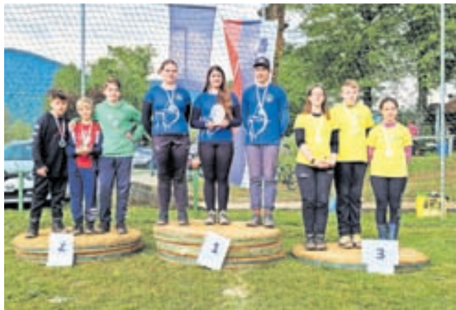
Mladi kamniški lokostrelci dosegajo odlične uspehe.