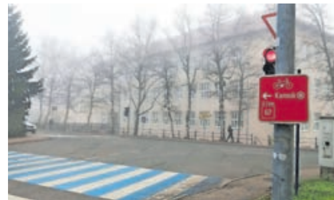
Usmerjevalne table na kamniškem delu poti

so tudi podatki o lokacijah turističnih informacij, kulturnih in naravnih znamenitosti, podrobnosti pa so na voljo na spletni strani gko.si. Konec lanskega leta pa so kolesarske povezave označili