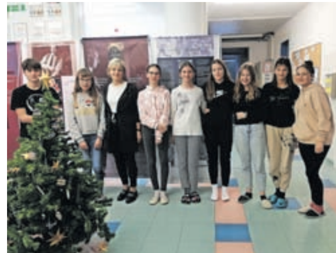
Na razstavi o Ani Frank

Patricija: »Sama razstava se mi je zdela zanimiva, saj go-