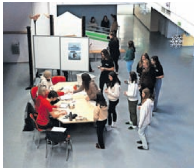
Večina dijakov ni pripravljena jesti brezmesno.