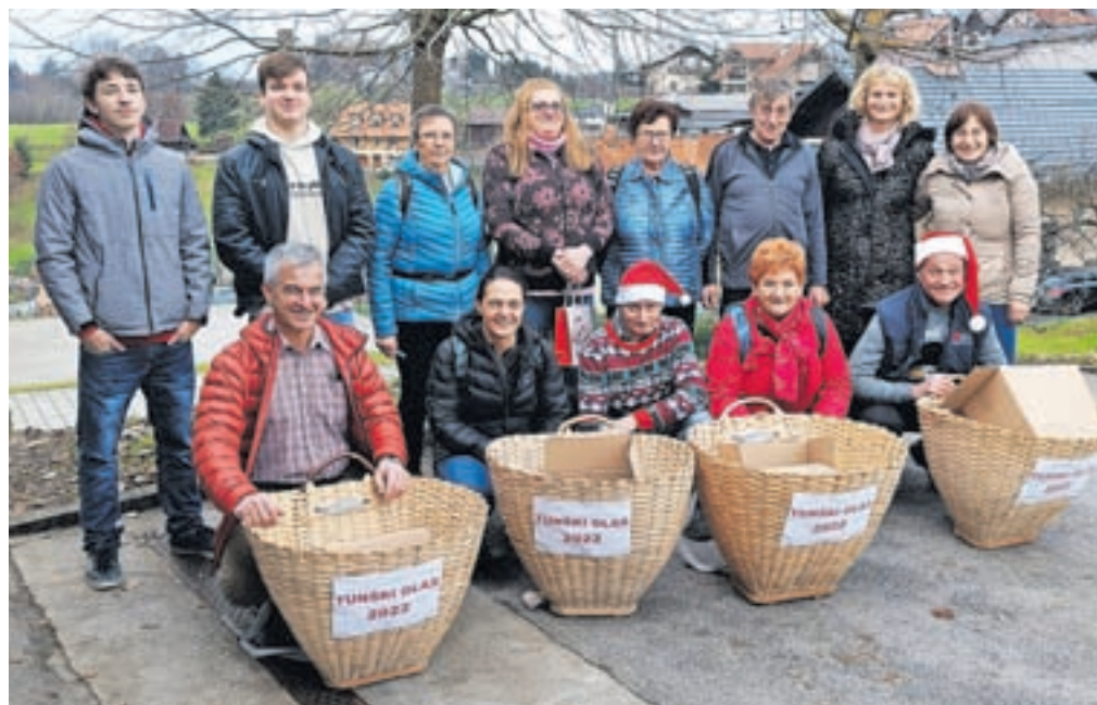
Raznašalci so po vaseh raznosili 343 izvodov glasila Tunški glas.