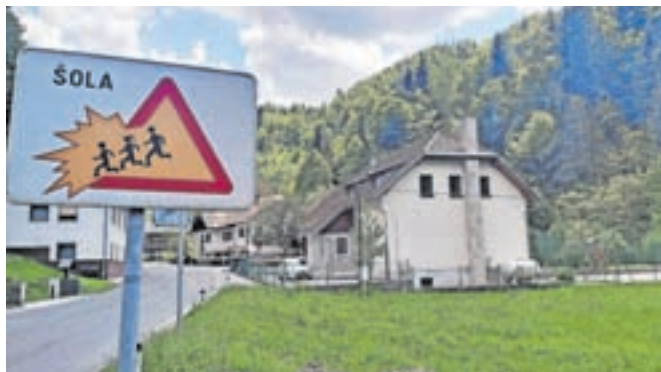
Podružnična šola Gozd

Kot so še sporočili s kamniške občinske uprave, je že izdelana tudi projektna dokumentacija za izvedbo, tako da se bo Občina Kamnik lahko z investicijo v prihodnjih mesecih prijavila na javne razpise za energetske sanacije stavb, ki jih bo razpisalo ministrstvo za infrastrukturo.