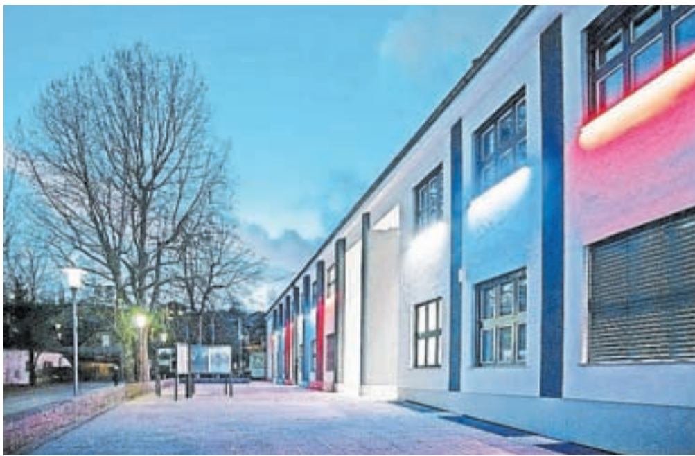
Dom kulture Kamnik je danes stičišče kamniške kulture

Aprila in maja bodo potekale razprave o kulturni strategiji, prav tako pa se na odru obetajo premiere novih gle-