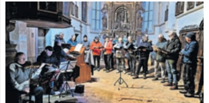
Pevske jaslice so tokrat potekale že devetnajstič.

Koncert smo ponovili v nedeljo, 8. januarja, po nedeljski maši v cerkvi v Zgornjem Tuhinju. Kakor na Sv. Primožu sta pevce Lire tudi