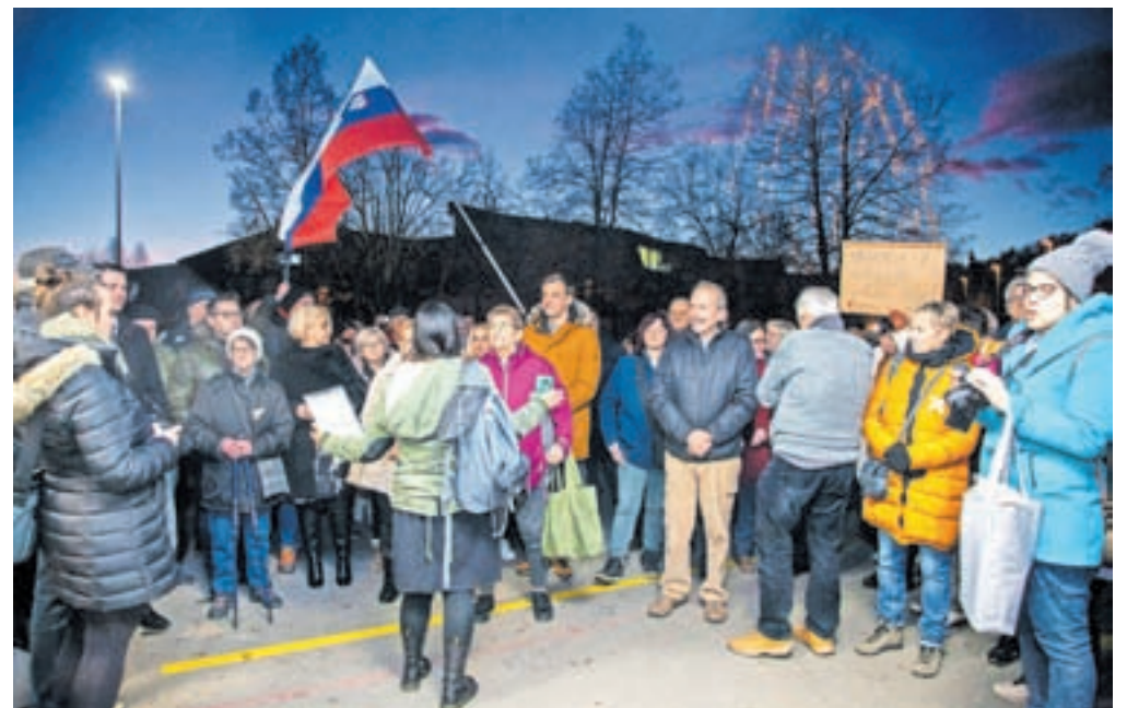
Kakšnih sto zaskrbljenih občanov se je zbralo pred zdravstvenim domom.

Tudi pred kamniškim zdravstvenim domom je potekal protest zaskrbljenih občanov Kamnika in Komende. Približno sto protestnikov je z mirnim shodom opozorilo na težave v javnem zdravstvu, predvsem pa je bila v ospredju nedavna namera o reorganizaciji nujne medicinske pomoči, ki predvideva selitev storitev v Domžale, kar bi bistveno poslabšalo oskrbo pacientov v Kamniku in predvsem v odročnejših predelih občine.