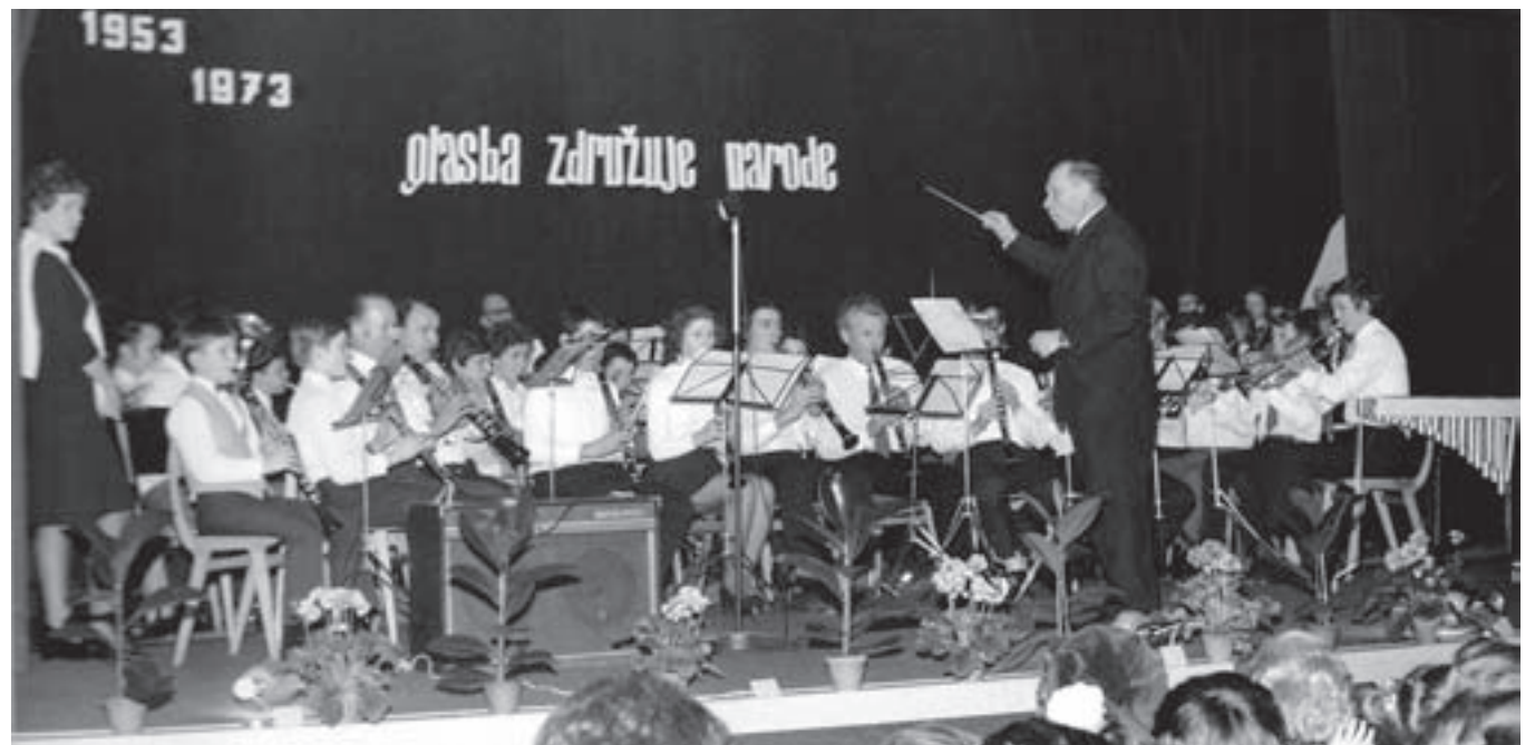
Na fotografiji je pihalni orkester glasbene šole s pridruženimi starejšimi člani. Fotografija je bila posneta na slavnostnem koncertu ob 20-letnici delovanja šole leta 1973.

Kljub težavam je šola v 60. in 70. letih napredovala. Decembra 1968 se je preselila