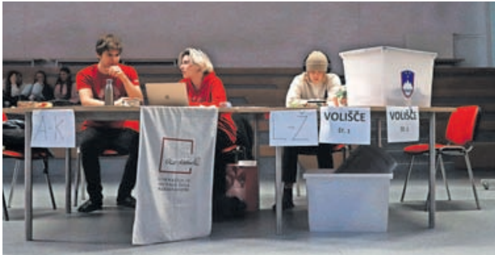
Dijaški referendum na kamniški srednji šoli

»Naš cilj je bil, da referendum naredimo čim bolj pristen in podoben dejanskemu glasovanju na državni in lokalni ravni,« je pojasnil Hrabar. Imenovali so štiričlansko volilno komisijo, ki je pripravila glasovnico, volilno skrinjico in prostor za volišče, na koncu pa tudi prešeta oddane glasove. Dijaki so glasovali tako, da so se zglasili na volišču pred volilno komisijo, pokazali svojo dijaško izkaznico, se vpisali v volilni imenik in