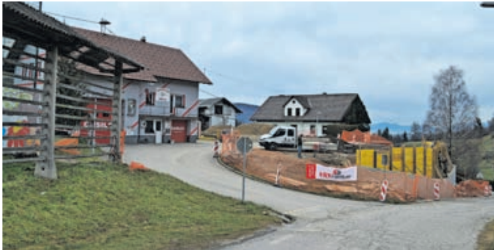
Dela bodo predvidoma zaključena maja.

V prvi fazi bodo zgradili oporne zidove, uredili meteorno kanalizacijo in dvignili teren na enoten nivo platoja, s čimer bodo pridobili dodatno površino. Nato pa v drugi fazi sledijo asfaltiranje in ureditev okolice, zatravi- te v in zaris parkirnih mest. Na novozgrajenem prostoru je predviden prostor za devet