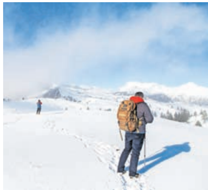
Ob obiskovanju gora je treba upoštevati tudi vremensko napoved in nevarnost plazov.