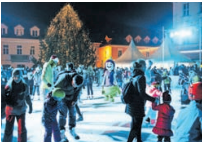
Kamniško dršališče v povprečju vsak dan obišče več kot 160 obiskovalcev.

Dršališče sicer od ponedeljka do četrta deluje med 13. in 21. uro, v petek do 22. ure, med počitnicami, prazniki ter ob sobotah je odprto med 10. in 22. uro, ob nedeljah pa med 10. in 21. uro. Od minulega petka pa drsa tudi na pokritem dršališču v mobilnem prireditvenem prostoru pred Termami Snovik. Od ponedeljka do petka je odprto med 16. in