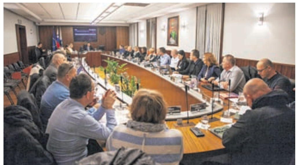
Svetniki začenejo redno delo v novem mandatu.