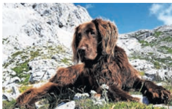
Terapevtski pes Lord, s katerim otroci berejo v kamniški knjižnici.

Program prostovoljno izvajajo vodniki s posebej izšolanimi terapevtskimi psi, ki lahko pomagajo otrokom pri izboljšanju bralnih sposobnosti. Kot pravijo, je v njihovi družbi branje vznemirljivo in nekaj posebnega. Bolj ko je branje zabavno in sproščujoče, večje je otrokovo zanimanje. Prijave zbirajo po elektronski pošti na erika.poljansek@kam.sik.si in anja.ramsak@kam.sik.si.