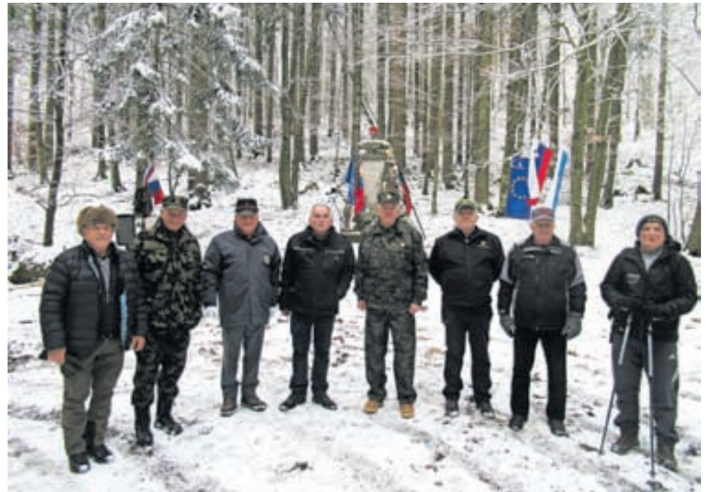
Člani OZSČ Kamnik - Komenda na Kostavski planini