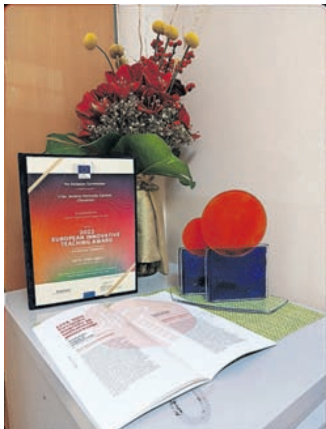
Vrtec Antona Medveda Kamnik je prvi predšolski zavod v Sloveniji, ki je prejel evropsko nagrado za inovativno poučevanje.