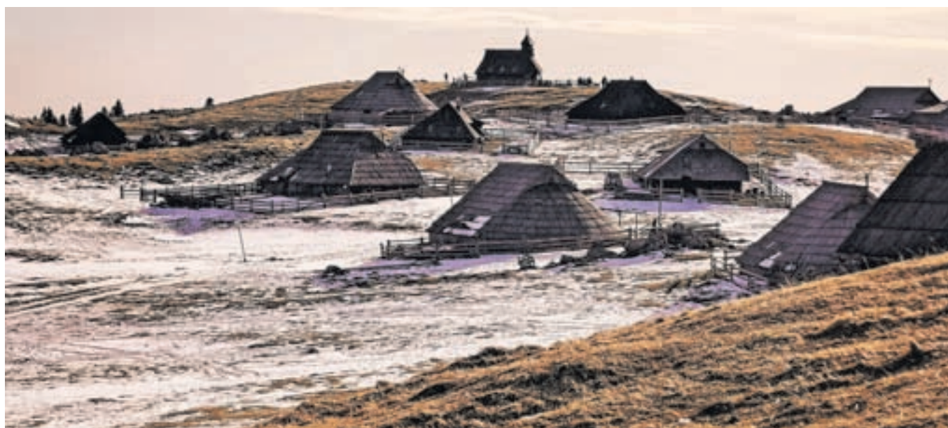
Na Veliki Planini so trenutno le zaplate snega.

obratovanjem smučišča povezani tudi višji stroški (energenti, elektrika, večje število zaposlenih, več obratovalnih ur) in se tako kot tudi na drugih smučiščih zimska sezona sama od sebe