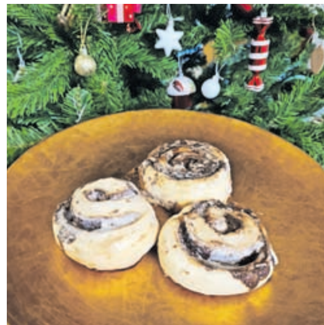
Cimetove rolice z drožmi