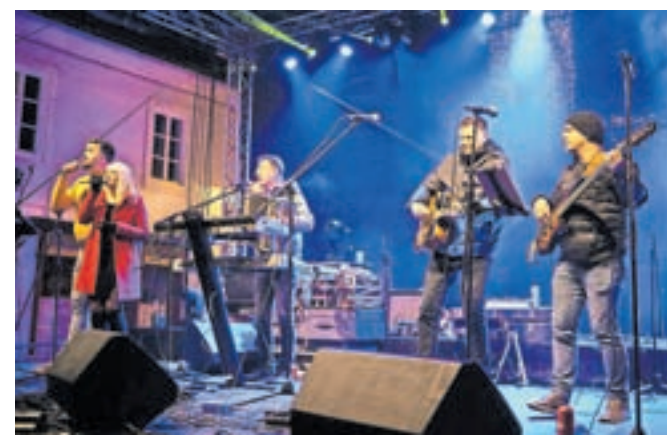
Ob vstopu v novo leto je zbrane na Glavnem trgu zabaval Ansambel Viharnik.

za tem je Kamnik utripal s skupino Big Foot Mama. Kamniški mladi rokerji Before Time so zadnji četrtek v letu 2022 razgrelji množico. »Zgodil se je nepozaben glasbeni večer, ki ga bo Kamnik še dolgo pomnil,« so dejali na zavodu. Za glasbeno poslastico sta na predzadnji dan leta poskrbeli skupi-