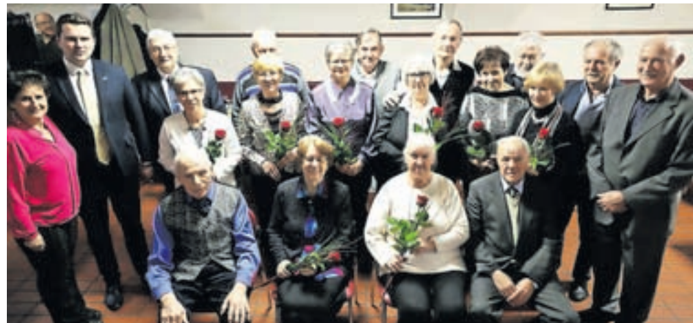
Zakoncenci, ki so v preteklih dveh letih praznovali petdeset in šestdeset let zakonskega življenja

šestdeset let, podelili priznanja in cvetje. Ker v decembru leta 2021 razmere niso dopuščale podelitve, so se na Društvu upokojencev Kamnik odločili, da združijo