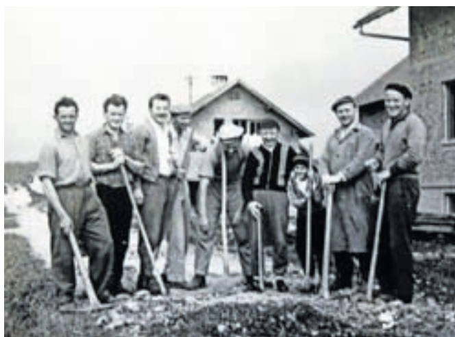
Med gradnjo ...

V ulici še vedno živi pet čilih začetnikov in kar štirje med njimi so že dosegli častljivo devetdesetletnico. Njihovi potomci so kljub asfaltni cesti in ograjam okrog hiš še vedno povezani. Utrip ulice se nadaljuje tudi v novem času, a na drugačne načine kot takrat.