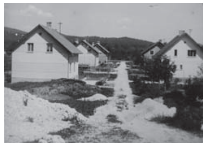
Takole je bila videti Prvomajska ulica med nastajanjem.