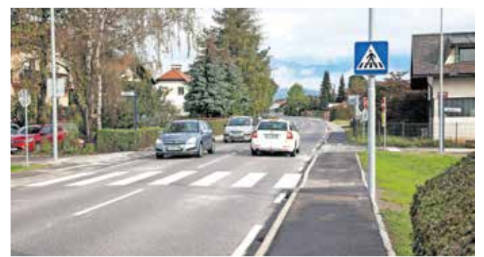
Novi prehod za pešce v Šmarci

Hkrati pa na občinski upravi načrtujejo tudi ureditev prehoda za pešce tudi v Zagorici nad Kamnikom, pod cerkvijo v bližini Osnovne šole Stranje, s čimer bodo poskrbeli za varnost pešcev, predvsem pa varnejšo pot v šolo. Skupna vrednost investicij v oba prehoda za pešce bo znašala nekaj manj kot sto tisoč evrov.