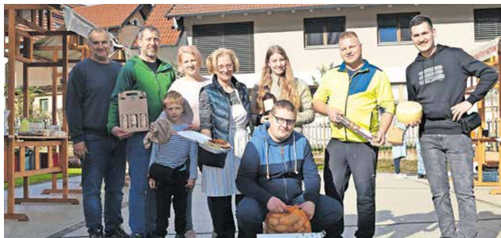
Ponudniki so zadovoljni s prvo sezono. Čaka jih še novembrsko-decembrski zaključek.