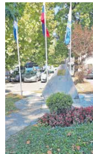
Spominsko obeležje v parku vzhodno od Doma kulture Kamnik

ture Kamnik, ko je bila možnost, da se primerno uredi tudi vsa okolica doma in da pride spominsko obeležje bolj do izraza. Ni primerno, da je notranost parka prostor za parkiranje, tudi pločnik ob cesti, ki vodi v ozemlje bivše KIK, je parkirišče, ob vsakem naliču je dostop do obeležja iz južne smeri nemogoč, saj voda ne odteka. Pred nami so novembrske županske volitve. Od kandidatov za župana pričakujemo, da bodo v svoje programe uvrstili: poimenovanje parka med Domom kulture Kamnik in cesto, ki vodi na ozemlje bivše KIK, v Park osamosvojitve, umik parkirišča iz sredine parka na zahod-