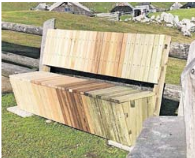
Testna klopa na Veliki planini

Za zaščito lesa se kot najbolj ekonomsko upravičena izbira kaže les, ki je zaščiten z bakrovimi zaščitnimi pripravki. »Saj ta zaščita nudi najdaljšo življenjsko dobo lesa. Registrirani pripravki za zaščito lesa na bakrovi snovi se tudi minimalno izlučujejo iz lesa, kar pomeni, da ni nevarnosti za izpiranje