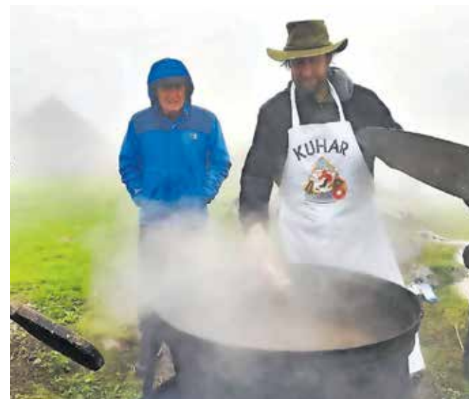
Ob bajtarskem prazniku tradicionalno kuhajo golaž.