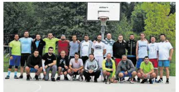
Na košarkarskem maratonskem srečanju sta se pomerili ekipi ŠKD Mekinje in ŠD Zg. Tuhinj. / FOTO: ŠKD MEKINJE

Mekinje – V soboto, 24. septembra, je na športnem igrišču v Mekinjah pod Samostanom Mekinje potekal že 16. tradicionalni košarkarski maraton, na katerem sta se pomerili ekipi ŠKD Mekinje in ŠD Zg. Tuhinj. Tekmovanja se je udeležilo lepo število igralcev obeh ekip. Še posebno lepo in navduhujoče pa je bilo videti kar nekaj svežih in mladih obrazov pri mekinjski ekipi, kar pomeni, da se jim za podmladek ni treba bati. Tekma je bila vseskozi napeta, ekipi sta se izmenjavali v vodstvu, vendar na višjo prednost od 20 točk ni uspelo pobegniti nobeni ekipi. Po napeti končnici so slavili gostje s prednostjo štirih točk in rezultatom 363 : 367. Na koncu pa so najpomembnejši druženje, dobra volja in ohranjanje tradicije. J. M.