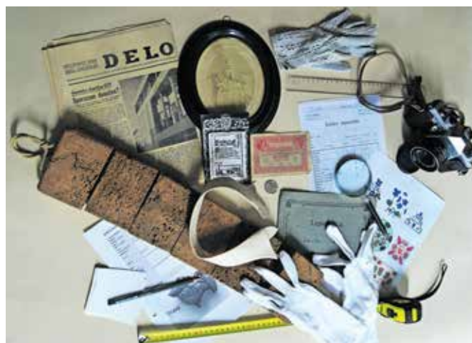
Prav gotovo je iz obdobja 60. let 20. stoletja ohranjenih še veliko fotografij, predmetov in vaših osebnih spominov.

Za študijsko leto 2022/2023 smo si zamislili raziskovalno temo: 60. leta 20. stoletja v Kamniku. Prav gotovo je iz tega časa ohranjenih še veliko fotografij, predmetov in