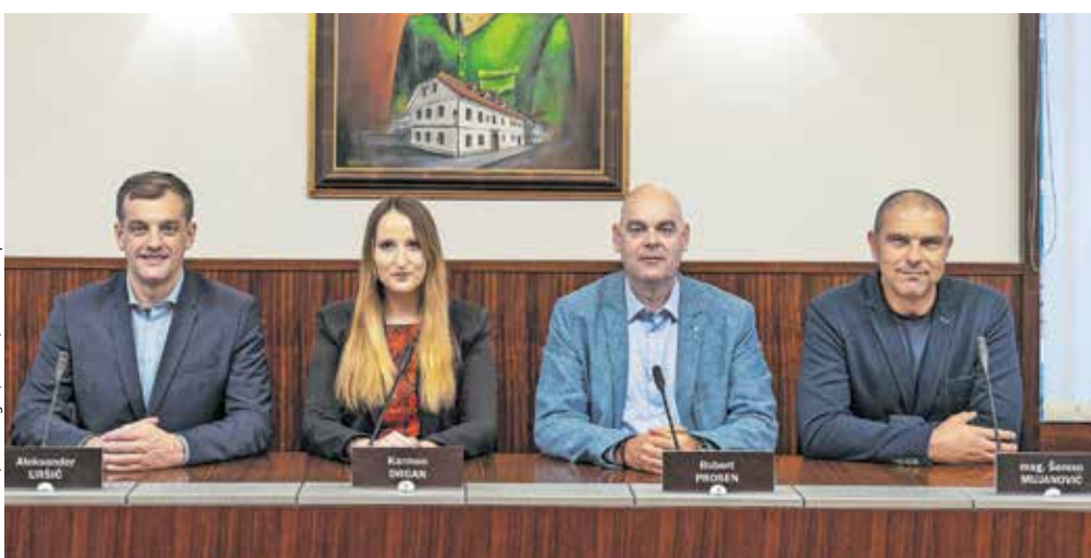
Občina Kamnik, glavni trg 24, Kamnik; svetniška skupina LSU