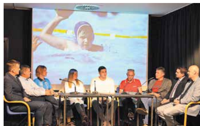
Na praznik slovenskega športa v kamniškem Domu kulture / FOTO: DAMIJAN RIFL

Večna tema je pokriti bazen, tudi športna dvorana in še bi