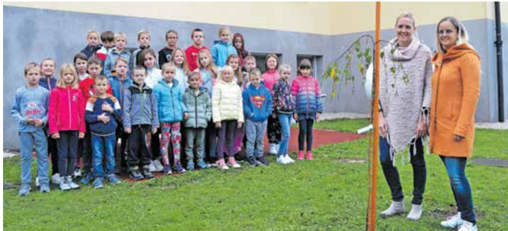
Ob šoli na Selih so posadili brezo, ki jim bo nekoč delala senco ob izvajanju pouka v učilnici na prostem.

hantova. V sklopu praznovanja bo med januarjem in aprilom na temo praznovanja obletnic potekal tudi likovni natečaj, kjer bodo izrazili svojo umetniško ustvarjalnost, v marcu bodo na ogled postavili razstavo o preteklosti šole Sela, 19. maja pa za zaključek praznovanja pripravljajo slavnostno proslavo ob jubileju v šotoru na igrišču, ki se je ob akciji Začni mlad, tekmuj pošteno prelevilo v atletski stadion.