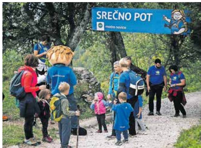
Deseti Dobrodelni pohod na Sv. Primož