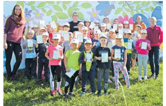
Učenci in učenke ter profesorice PŠ Sela so v prazničnem šolskem letu še posebej aktivni.

igrišču, seveda pa izkoristijo tudi idilično naravno okolje. »Največkrat se odpravimo proti bližnjemu Rožiškemu vrhu. Ob slabšem vremenu in ko pritisne mraz, pa smo v manjši telovadnici, ki je primerna za izvajanje programov športa naših starostnih skupin,« pove sogovornica in doda, da jih naslednji organizirani tek čaka že ob koncu meseca. Pridružili so se namreč tudi projektu Tek podnebne solidarnosti, na katerem bodo z otroki tekli njihovi starši.