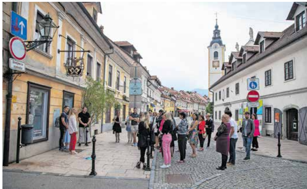
Na Šutni in v središču Kamnika nastajajo podjetniške zgodbe.