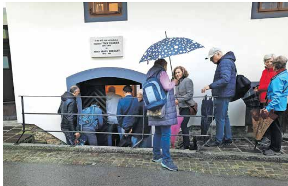
Postanek ob in v Bajtici