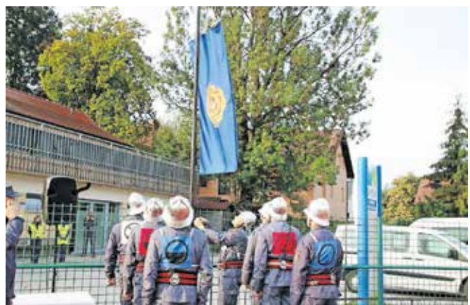
Pred tekmovanjem so starejši gasilci in gasilke PGD Kamnik dvignili zastavo.

V moški konkurenci so se najboljše odrezali gasilci PGD Topole, drugo mesto so zasedli gasilci PGD Križ in tretje PGD Mengeš. Vse tri ekipe so se uvrstile na državno tekmovanje, ki bo potekalo naslednje leto. Gasilci PGD Srednja vas so bili četrti, peti društveni kolegi PGD Tunjice in šesti gasilci PGD Kamnik. Med ženskami so zmagale starejše gasilke PGD Jarše - Rodica, druge so bile gasilke iz PGD Sava, tretje mesto pa so zasedle starejše gasilke PGD Loka pri Mengšu.