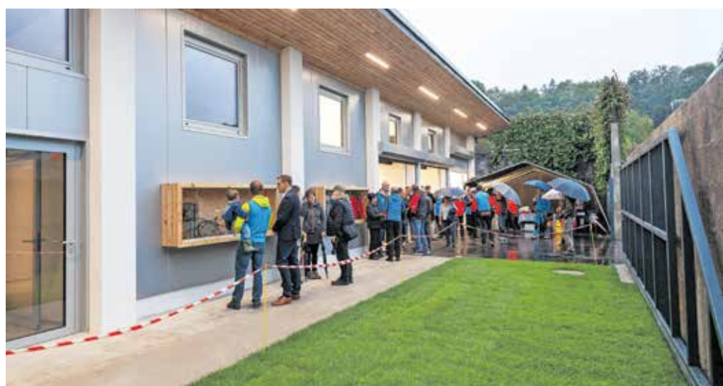
Novi prostori kamniških gorskih reševalcev

Ob stoletnici delovanja, ki jo kamniška Gorska reševalna služba praznuje v letošnjem letu, so se tako člani prvič vselili v lastne, moderno opremljene prostore, ki so si jih uredili v objektu zapuščenega skladišča pirotehničnih izdelkov na skrajnem severnem robu nekdanje smodnišnice. »Po stotih letih smo na svoji zemlji, v svojih prostorih,« je bil ob uradnem odprtju vesel predsednik kamniških gorskih reševalcev Srečo Podbevšek in ob tem dodal: »Tako ko smo dobili objekt, smo ugotovili, da se moramo takoj lotiti dela in hitro smo tudi z zbiranjem prispevkov in donacij ugotovili, da nas družba podpira. Z delom smo