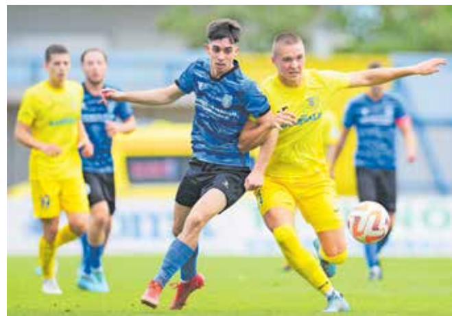
Kamničani so v prvem krogu pokalnega tekmovanja po pričakovanjih izgubili s prvoligašem iz sosednjih Domžal.