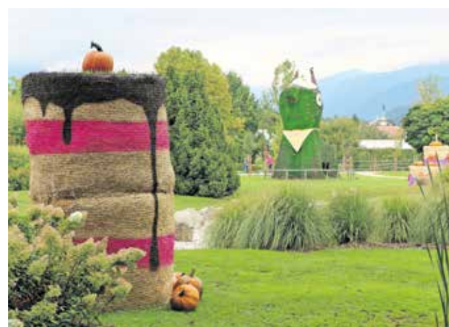
Kužu Cvetku oktobra v parku delajo družbo zanimive bučne torte ...

stavili na ogled ob novi programski poti ter v šotoru pri pristavi. Ker dekoracijo z bučami radi povežujemo s čarovnicami, bodo te konec oktobra začasen dom poiskale tudi v Arboretumu Volčji Potok.