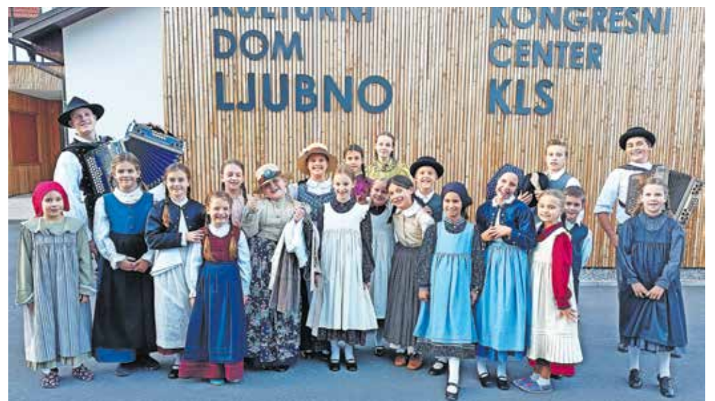
Otroška folklorna skupina Verine zvezdice na Ljubnem

ni Podplaninci, Otroška folklorna skupina Facki z OŠ Frana Kocbeka Gornji Grad in Folklorna skupina Ošterija iz Bočne. Mali folklorniki so se odlično odrezali. Nastopili so kar s štirimi plesnimi točkami in navdušili polno dvorano na Ljubnem. V Kamnik so se vrnili ob 21.30, in čeprav je bila za nekatere pot zaradi ovinkaste ceste zelo naporna, so se na avtobusu ves čas razlegali veseli glasovi, ki so že spraševali, kdaj sledi naslednji nastop.