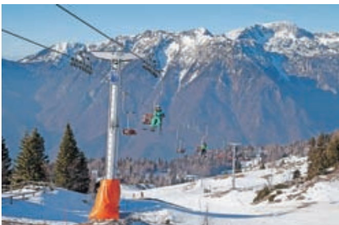
Smučanje na Veliki planini ponuja tudi izjemne razglede.

17. uri in poteka po 2,4 kilometra dolgi osvetljeni prog. Zaradi omejitve oseb na sankališču je sicer za sanjanje potrebna predhodna prijava. V času nočnega sankanja nihalka vozi ob 17. in 18. uri (gor) in 20. ter 21. uri (dol). Možna je tudi izposoja sani. Aktualne informacije o delovanju smučišča in obratovanju naprav pa velja preveriti na spletni strani družbe Velika planina. Nihalka sicer v času obratovanja smučišča vozi vsake pol ure od 8. do 17. ure, ob petkih pa do 18. ure. Sedežnica obratuje od 8.30 do 16.15, razen ob petkih do 17.15, smučišče pa je odprto med 8.30 in 15.30. Smučišče ponuja 3,5 kilometra prog, od katerih večina sodi med srednje zahtevne, vlečnica Jurček pa je namenjena otrokom in smučarjem začetnikom.