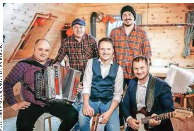
Modrijani so ob desetem rojstnem dnevu pesmi Ti, moja rožica občinstvu predstavili njen remiks, potem pa na Veliki planini posneli videospot.

Za Ti, moja rožica 2022 je nastal tudi že videospot, ki je svojo premiero doživel lani decembra. Odziv na zimsko vizualno podobo pesmi na spletu je zelo dober, v priredbi pa bo pesem zaživela, ko se bodo znova začele zabave in veselice, dodaja Švab. Namreč videospot za novo Ti, moja rožica je nastal na Veliki planini, režiral pa ga je Jani Pavc. Švab pojasni: »Jani obožuje te planine in sneg. On najlepše ujame to vzdušje. In Občina Kamnik nam je zelo pomagala, da smo lahko posneli