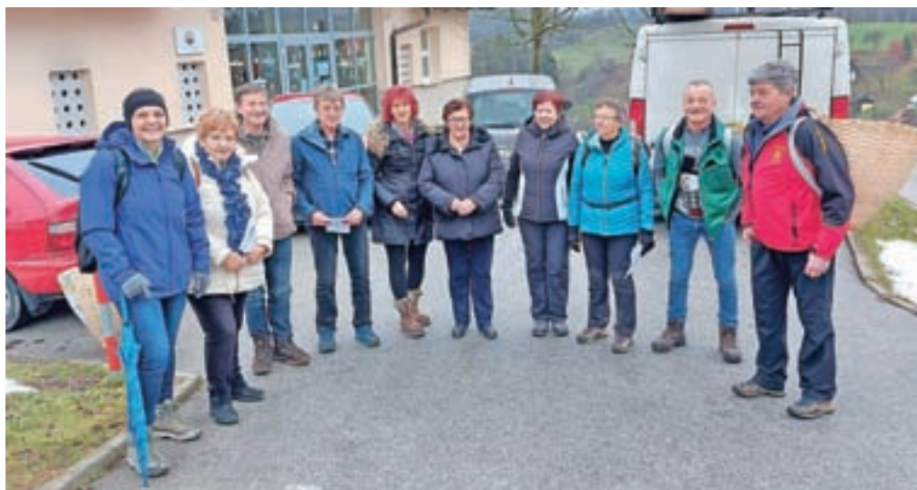
Člani društva, ki so Tunški glas dostavili na domove krajanov