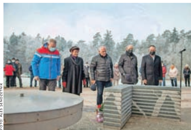
Delegacija se je padlim poklonila s polaganjem venca.