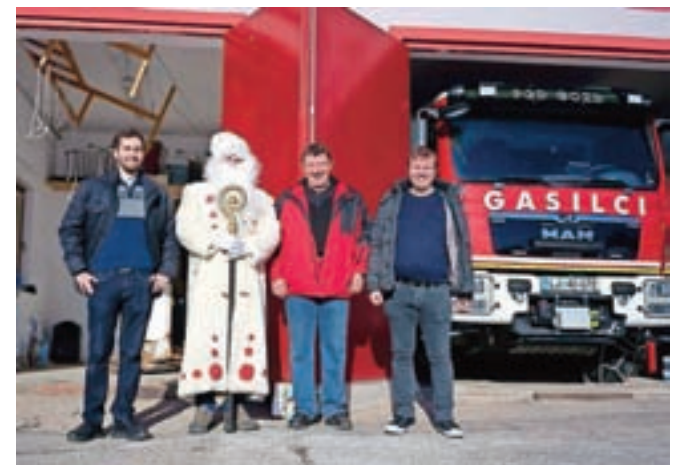
Predstavniki KS Črna ob obisku Dedka Mraza

Otroci so se tudi letos razveselili obiska Dedka Mraza.