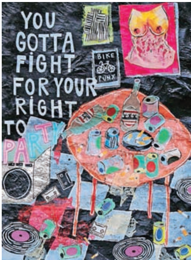
Fight for your right to party, 2020

Umetnica v motivih kot glavni lik pogosto poudarja žensko kot seksualni simbol, hkrati pa spremljamo tudi podobe in z njimi občutja iz vsakdanjega življenja, kar največkrat prikaže na humoren način. Skozi tehniko kolaža na neki način izraža svoj življenjski nazor. Na primer v obsojanju pretiranega potrošništva in nenehne želje po več in še. Petja Kolenko z umetnostjo reciklaže in motiviko izraža nasprotovanje in poziva k bolj razsvetljeni družbi.