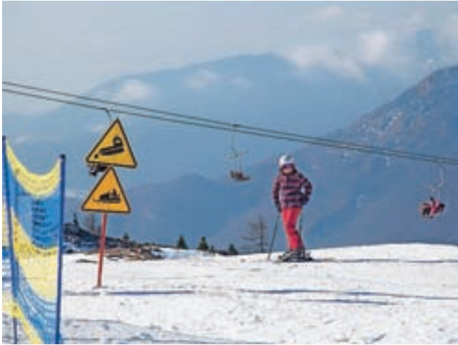
Smučarjem je na voljo 3,5 kilometra prog.

Že nekaj let na Veliki planini zagotavljajo tudi nočno sankanje. "Nočno sankanje je iz leta v leto bolj priljubljena aktivnost, zato imamo skoraj vsak petek in soboto vsa mesta povsem zasedena," še pojasnjujejo na Veliki planini in dodajajo, da bo sankališče odprto še naprej vsak petek in soboto. Nočno sankanje se začne ob