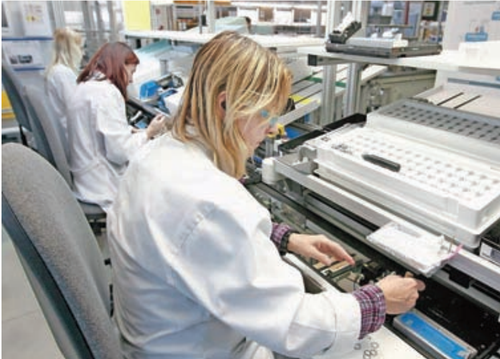
Veliko zanimanja je še vedno za delavce v proizvodnji oz. za enostavna dela. Fotografija je simbolična.

"Glede na leto 2020 je bilo za skoraj polovico večje in je celo za 20 odstotkov presešlo tudi povpraševanje v letu pred epidemijo," pravi sogovornica, ki dodaja, da so podjetja največ iskala proizvodne delavce in druge delavce za enostavna dela. Povpraševanje je bilo tudi po delavcih v gradbeništvu, v elektro, kovinski in avtomobilski industriji, voznikih, precej se je zaposlovalo v trgovini, ves čas je bilo veliko tudi povpraševanja po kadru za delo v šolstvu, zdravstvu, negi in oskrbi. "Največ potreb po kadru so sicer prijavile različne zaposlitvene agencije (Adecco, Naton, Manpower, Workforce), Ko-