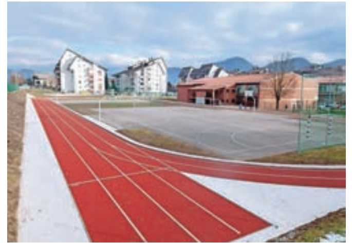
Pogled na prenovljeno atletske stezo ob Osnovni šoli Marije Vere na Duplici

čje občasno uporabljajo tudi otroci iz sosednjega vrtca Antona Medveda. "Celotno območje športnega parka ob šoli je sicer od-