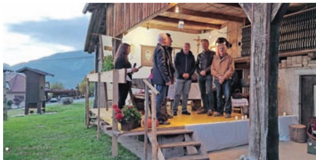
Brezjani smo tokrat pripravili pripovedovalski večer.