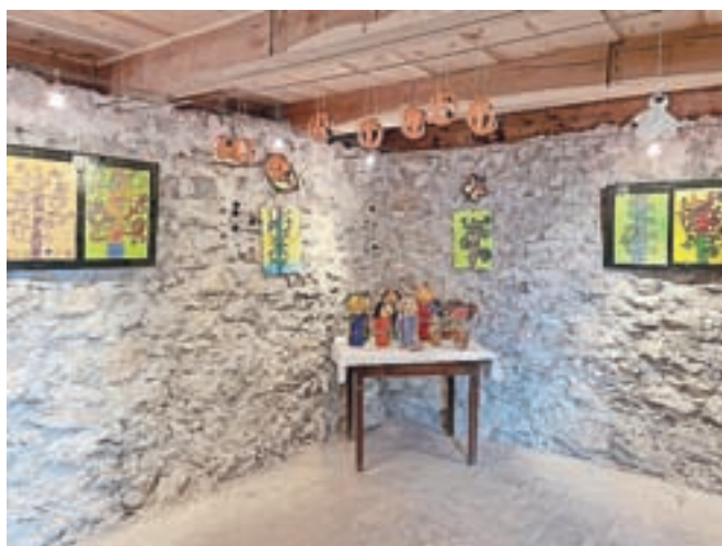
Na razstavi so na ogled izdelki, povezani z jesenjo.

niti ne opazimo. Zgodi se nam tudi, da nismo dovolj pozorni do svojih najmlajših. Zanje pa je pomemben vsak dan, zlasti če ga preživijo ustvarjalno. Prav je, da njihove stvaritve pokažemo in jih z ogledom nagradimo