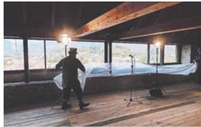
Odprtje razgleda s stražnega stolpa

Schleglovo platno je umestil na konec linije dolge tradicije upodabljanja zadnje večerje vse od da Vincija in Vasarija, a poudaril, da je