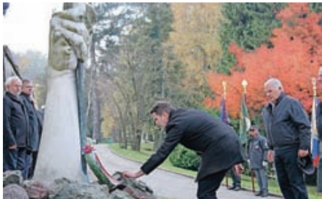
Ob spomeniku padlim v prvi svetovni vojni.