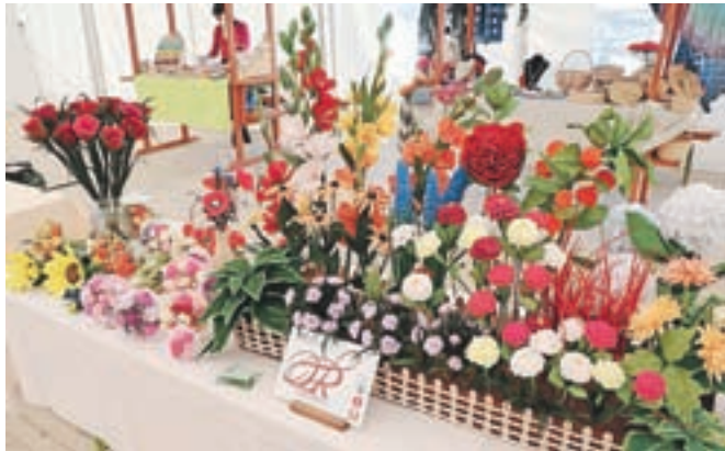
Cvetje iz krep papirja je na razstavi sestavljalo aranžmaje, kjer bi od daleč opazovalec pomislil, da je cvetje pravo.