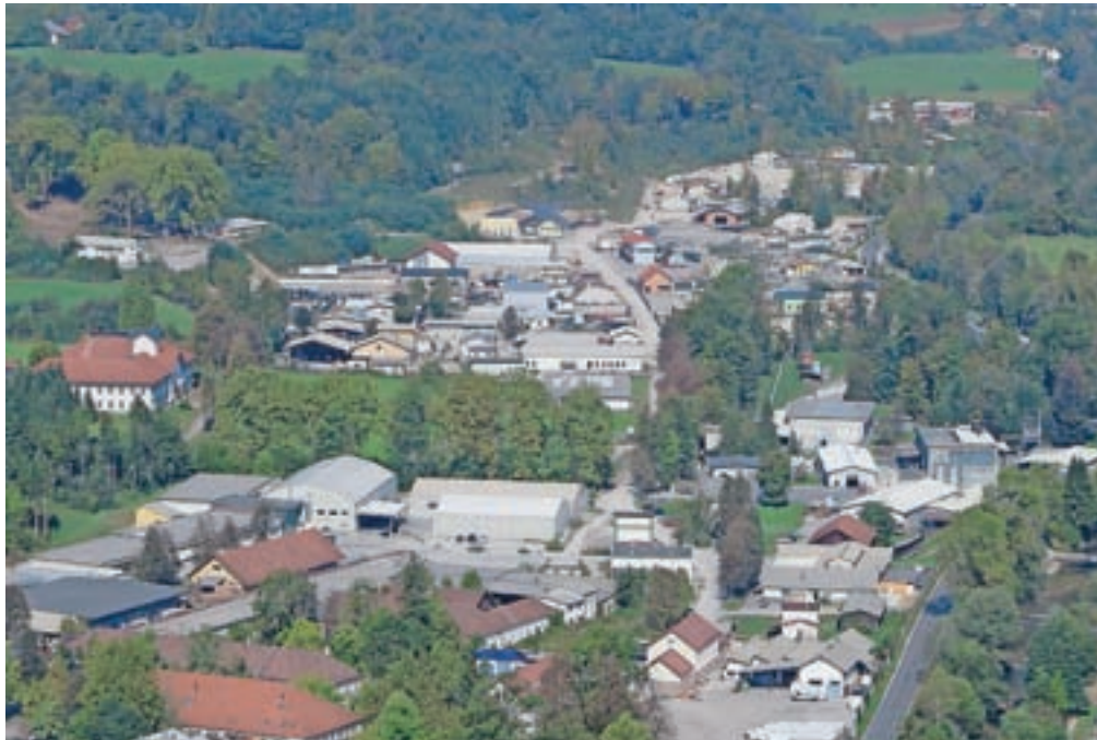
Občina Kamnik ima v lasti že skorajda vse ceste na območju nekdanje smodnišnice.

Območje se bo celovito lahko uredilo šele po sprejetju občinskega podrobnega prostorskega načrta (OPPN), za katerega je osnutek že pripravljen, prav tako so nanj pristojni nosilci urejanja izdali ustrezne smernice in z njimi zahtevali pripravo študij. Skladno s tem so bile do sedaj izdelane že tri strokovne študije, in sicer terenske in laboratorijske raziskave podzemnih in površinskih voda ter zemljin, konservatorski načrt za prenavo območja in idejna zasnova ureditve tujih, zalednih in meteoritnih voda. Prav prva študija je vodilna na občini najbolj skrbela, saj bi morebitna onesnaženost območja z eksplozivnimi sredstvi oz. ostanki proizvodnje smodnika zahtevala celovito sanacijo in s tem povežane velike stroške ter dolgotrajne postopke. A rezultati so pomirjajoči. »Obseg opravljenih geoloških ter okoljskih raziskav ter pridobljeni rezultati in interpretacije dajejo zadovoljiv vpogled v geološke in okoljske razmere na lokaci-