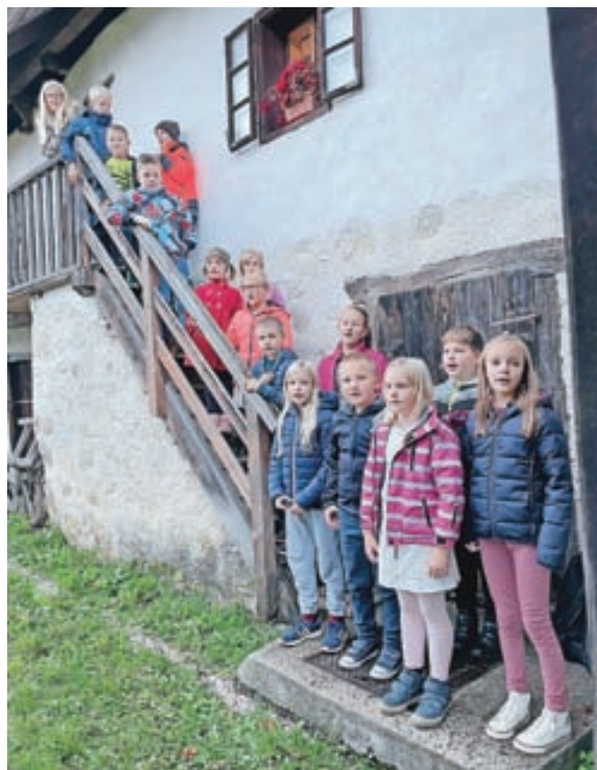
Učenci Podružnične šole Vranja Peč pred Budnarjevo domačijo

Policisti so bili obveščeni o nesreči pri delu v enem izmed podjetij na območju Kamnika. Do nesreče je prišlo na hidravlični stiskalnici, ki je bila v tem času nastavljena na ročno in ne na avtomatsko upravljanje, kar pomeni drugačen sistem dela, in je delavcu med opravljanjem dela stisnila roko. Delavec je dobil telesne poškodbe in je bil z reševalnim vozilom odpeljan na zdravljenje. O nesreči je bil obveščen delovni inšpektor, policisti pa nadaljujejo zbiranje obvestil in bodo o vseh ugotovitvah obvestili pristojno državno tožilstvo.