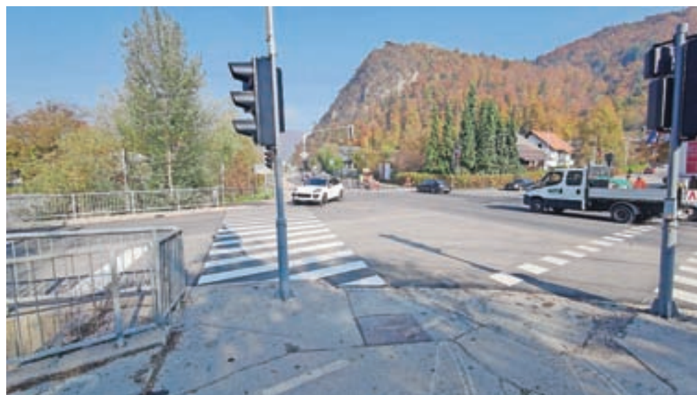
Prenovljeno križišče pri srednješolskem centru

In čeprav se bliža zima, gradbene sezone še ni konec. V teku so namreč trije občinski razpisi za še tri gradbišča. Občina namreč išče izvajalce za gradnjo testne vrtnice pri zajetju Iverje v Stahovici, za posodobitev vodovodnega sistema na Zduši, saj zadnje hiše že nimajo zadostnega pritiska v vodovodnih cevih, in prenavo vodovoda in kanalizacije na delu Vrhpolj.