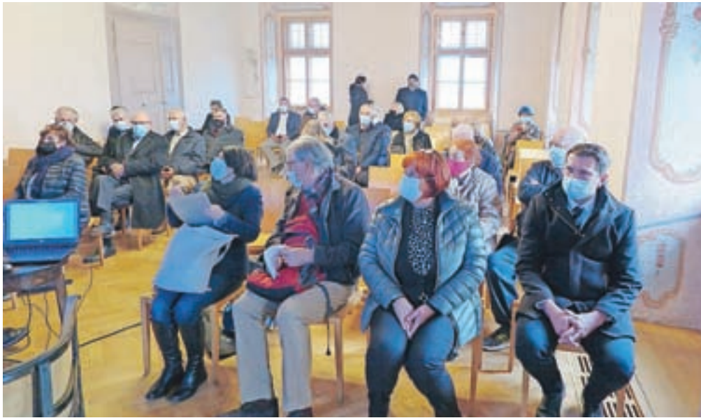
Zbrani na predstavitvi Maistrove poti na gradu Zaprice

Povezati vse ustanove ni bil mačji kašelj, za to pa sta poskrbela koordinatorska