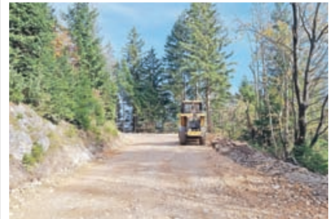
Zaradi del na cesti do Velike planine še vedno veljajo občasne popolne zapore prometa.