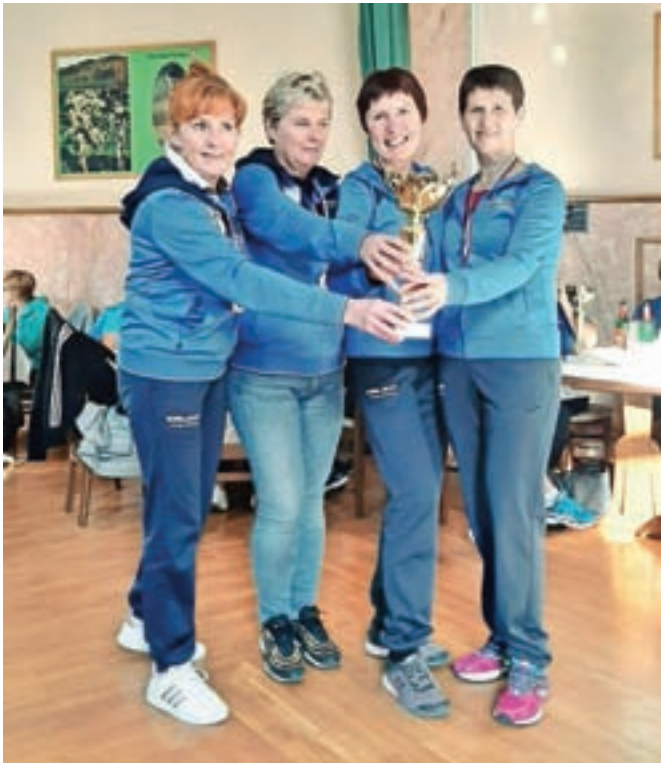
Članice Kegljaške sekcije DU Kamnik so na državnem prvenstvu osvojile prvo mesto.