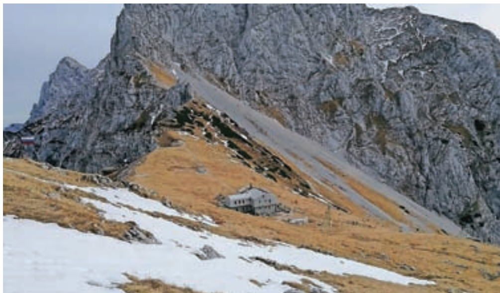
Kamniška koča na Kamniškem sedlu je že zaprta, a bo osnovno oskrbo obiskovalcem ob lepih koncih tedna nudila tudi čez zimo.

Tečaj varne hoje v gorah pozimi bodo člani Gorske reševalne službe Kamnik letos organizirali v soboto, 20. novembra. Razpis je objavljen na njihovi spletni strani.