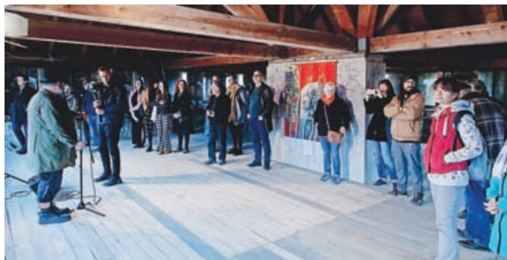
Stražni stolp kot prostor dogodkov in razstav