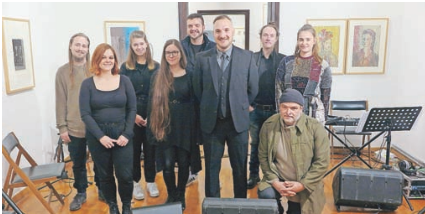
Na predstavitvenem koncertu so nastopili tudi vsi, ki so sodelovali na albumu.