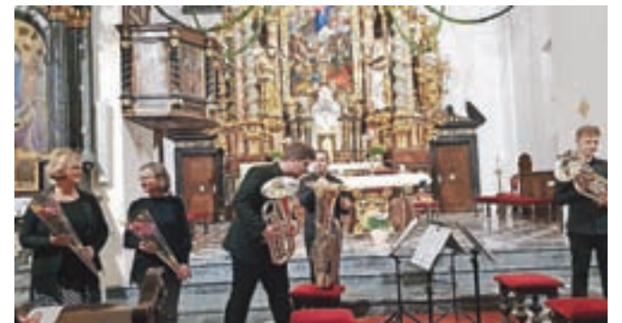
Nastopajoči na sklepem koncertu letošnjega cikla Musica aeterna/Živa glasba