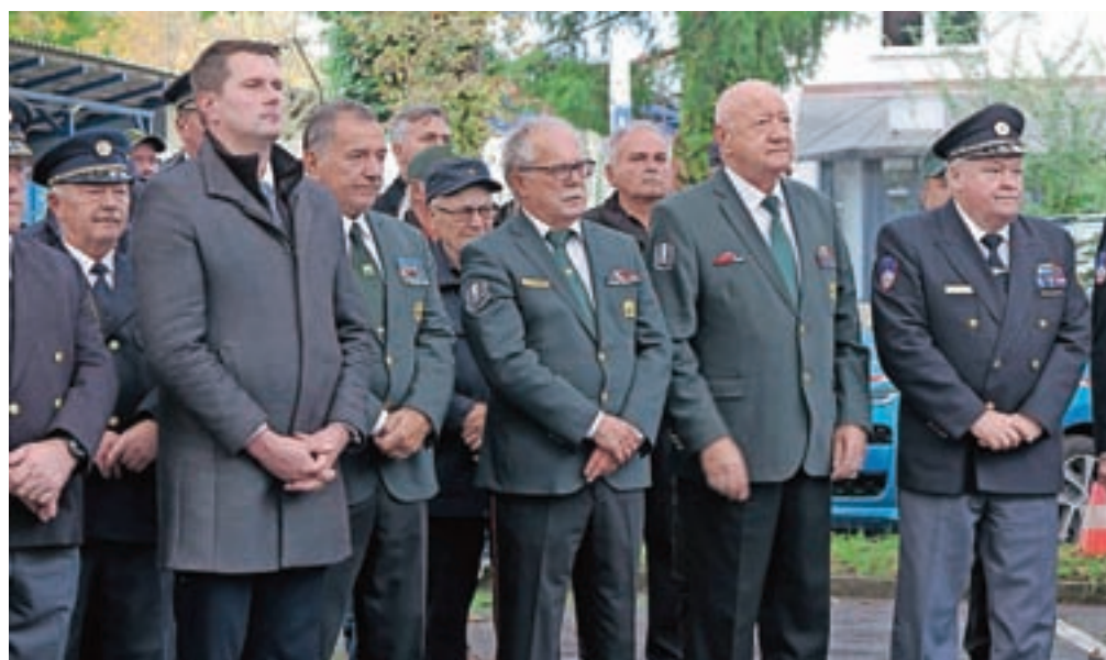
Zbrani na veteranski proslavi ob dnevu suverenosti v Kamniku

Z dnevom suverenosti se spominjamo dogodkov, ki so se zgodili v noči na 26. oktober leta 1991, ko je ozemlje Slovenije zapustil še zadnji vojak JLA, s čimer se je končal proces slovenskega osamosvajanja. Jugoslovanska vojska se je iz pristanišča v Kopru sicer začela umikati že 20. oktobra, 25. oktober pa je bil določen kot zadnji dan umika. Zadnji vojaki JLA so ozemlje Slovenije zapustili 25. oktobra 1991 ob 23.45.