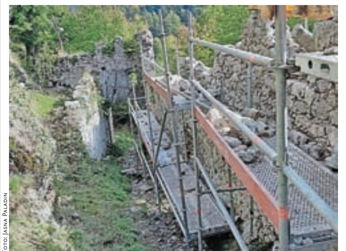
Obnova zidov obrambnega hodnika na Starem gradu

Kamnik – Občina Kamnik se je z izbranim izvajalcem v teh dneh lotila obnove zidov obrambnega hodnika na Starem gradu, ki so bili že močno dotrajani. Pred tedni so že pokosili travo in pripravili teren za gradbince, ki so se zdaj lotili zidov. Projekt so prijaviли na razpis ministrstva za kulturo in bili uspešni, tako da bodo od države za sanacijo prejeli štiriideset tisoč evrov; celotna investicija je sicer ocenjena na 76.340,77 evra. Zaradi del vse pohodnike na Stari grad pozivajo, naj upoštevajo zaporo in se na vrh podajo po nemarkirani poti v smeri Velike Špice do asfaltna ceste in po cesti do Grajske terase. J. P.