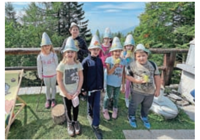
Učenci so izdelali tudi pastirske klobuke.

Prvi dan smo se peš povzpeli na Zeleni rob, si privoščili sladoled v Sladkem kotu in si ogledali kapelico Marije Snežne. Drugi dan smo se peljali s sedežnico in si ogledali vetrnico. Vse to je od učencev terjalo precej napora in poguma, tako da smo si privoščili zasluženo kosilo v gostišču Zeleni rob. Po-