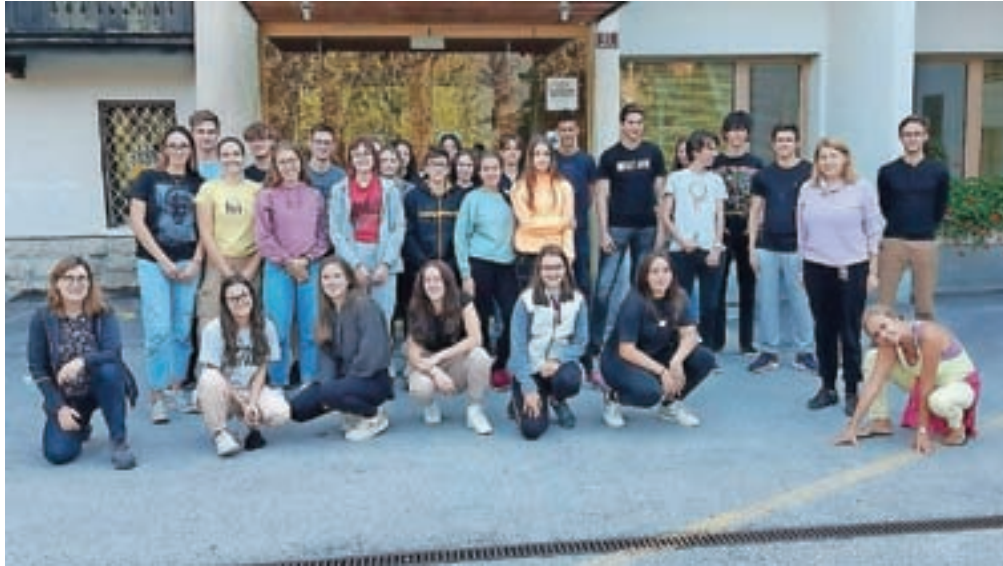
Udeleženci tabora za pridobitev nemške jezikovne diplome