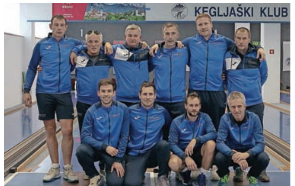
moška ekipa KK Calcit Kamnik pa odlično četrto mesto.