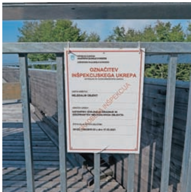
Odločba o rušitvi ploščadi je pravno močna, a po besedah župana zanjo velja moratorij do sprejetja občinskega prostorskega načrta.

kot lastnik ne morem zagotoviti primerne varnosti. Zaščitne ograje neznanci namreč večkrat odstranijo, na ploščad plezajo od vsepovsod, opozorilne table so potrgali, nedavno pa so s tečajev sneli tudi jeklena vrata. Varnosti ne morem zagotovljati, plezanje po ploščadi pa je ta hip smrtno nevarno. Projekt stoji zaradi neaktivnosti uradnikov, zato razmi-