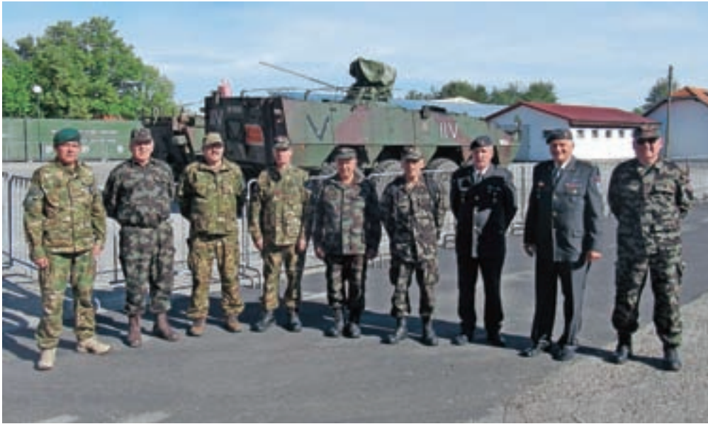
Člani OZSČ Kamnik - Komenda in OZSČ Domžale

Svoje vloge v družbi so predstavili poleg proizvajalcev in ponudnikov tudi Ministrstvo za obrambo, Policija, Uprava RS za zaščito in reševanje ter Gasilska zveza Slovenije. Na posameznih oddelkih oziroma stojnicah so se predstavila še razna združenja, kot so Veterani vojne za Slovenijo, Zveza slovenskih častnikov, Društvo general Maister, Vojaški muzej ter še nekatera domoljubna društva. Posebno privlačni so bili nastopi oboroženih sil SV in Policije, ki so ob uporabi številnih sredstev moderne oborožitve prikazali visoko stopnjo strokovne usposobljenosti, fizične kondicije in volje do opravljanja svojih nalog. Čas ogleda je hitro minil in obisk vojaške kuhinje, kjer