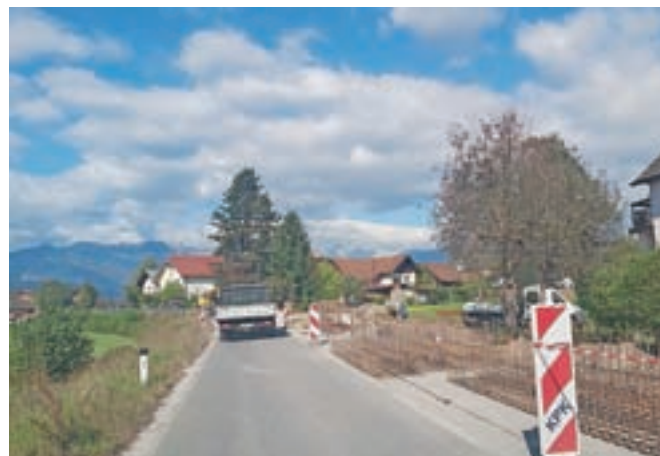
V Volčjem Potoku bodo dobili pločnik v dolžini slabih petsto metrov.

Volčji Potok – Od konca septembra v Volčjem Potoku poteka gradnja pločnika od Arboretuma do avtobusne postaje v smeri Kamnika, zato na tem delu cestišča velja delna zapora ceste. Poleg pločnika, ki so ga v preteklem tednu že asfaltirali, bodo uredili tudi oporni zid, javno razsvetljavo, odvodnjavanje, prenovili bodo obe avtobusni postajališči in zarisali dva prehoda za pešce, in sicer navadnega v bližini prodajnega centra in povišanega (grbina) med obema postajališčema. Dela bodo končana najkasneje do 23. novembra, njihova vrednost pa je ocenjena na slabih 217 tisoč evrov. J. P.