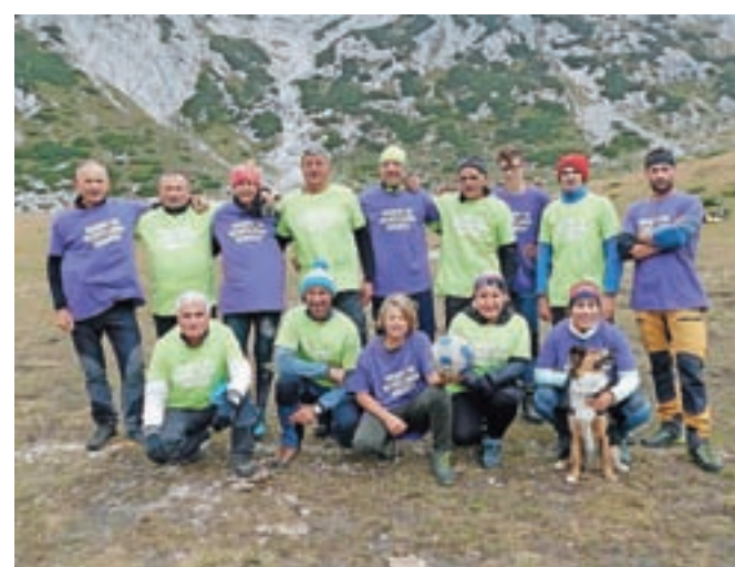
Tudi tokrat sta se pomerili ekipi Štajercev in Kranjcev.

Kamnik – Vremenske napovedi so bile različne – nekatere so obetale dež, druge pa sonce. Vse to in seveda epidemiološko stanje pri nas je vplivalo na to, da udeležba ni bila tako številna kot v prejšnjih letih, saj je bilo tokrat zahtevano upoštevanje protikoronskih ukrepov. Nekateri pristni Štajerci, ki so že bili na Korošici, so se pa raje umaknili v dolino, saj je bilo dopoldne poleg močnega vetra megleno in so pričakovali poslabšanje (ki ga pa ni bilo). Vendar se je kljub vsem prej naštetim oviram in tudi precej močnemu vlažnemu vetru zbralo dovolj navdušencev, da se je nogometna tekma na najvišji ravni začela točno opoldne in tako nadaljevala tradicijo, ki se je začela leta 1979. Tokrat je za dodatno presenečenje poskrbel sponzor, ki je podaril majice (drese) za igralce, fotoreporterja in sodnika.