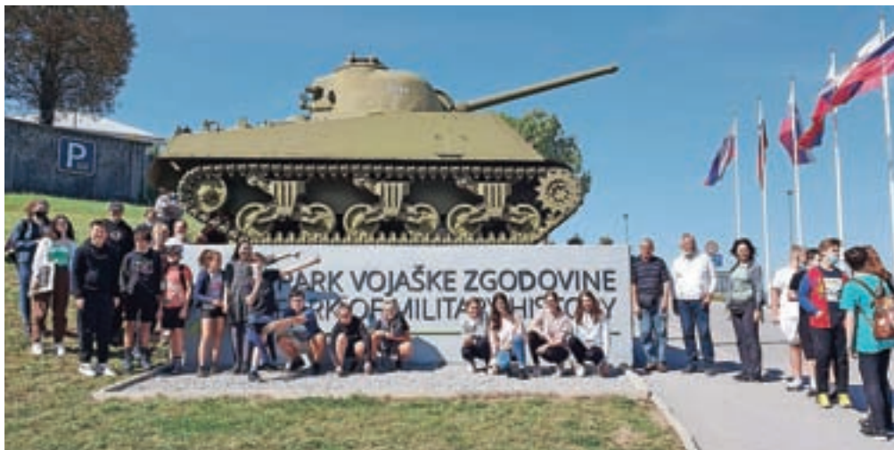
Ogledali smo si tudi Park vojaške zgodovine Pivka.

Nato smo se odpravili v Park vojaške zgodovine Pivka, kjer smo si ogledali veliko vojaških vozil, letala, helikopter, reševalno vozilo in motor. Nekatera vozila so bila v uporabi tudi med osamosvojitveno vojno. Na nas je poseben vtis naredila podmornica, ka-