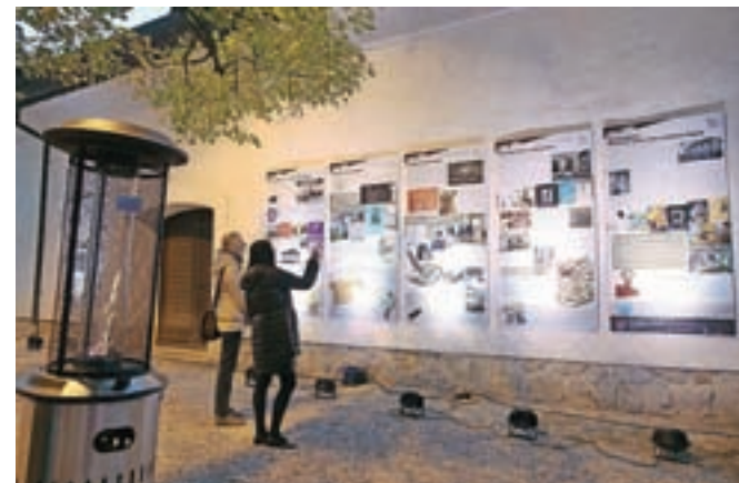
Zgodovina kamniškega muzeja je predstavljena tudi na panojski razstavi na dvorišču gradu Zaprice.