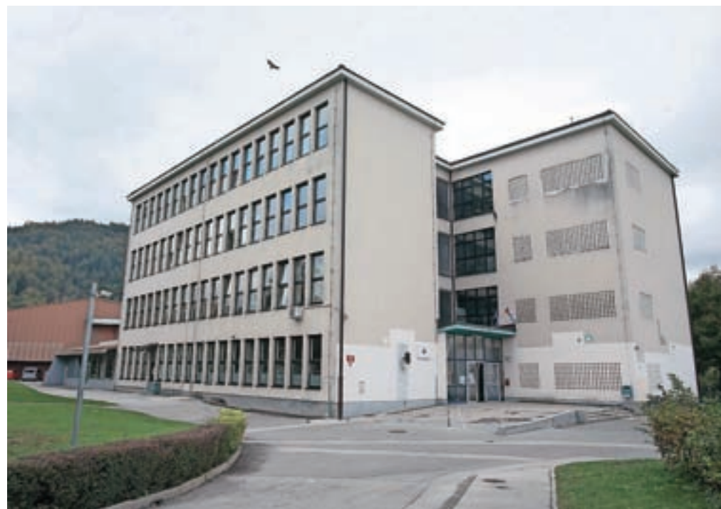
Stara šola bodo po dokončanju nove porušili.