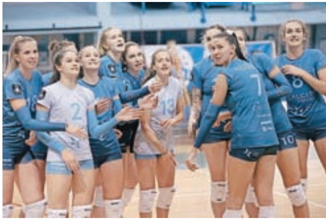
Članice prve ženske ekipe Calcita Volleyja