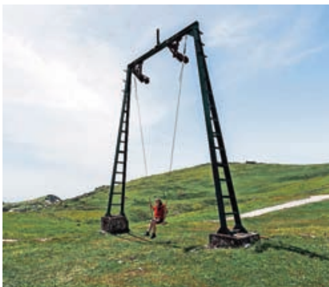
Gugalnice so bile že testirane, za obiskovalce pa bodo na voljo spomladi.

»Vsi našeti upravičenci do občinskih sredstev so se odločili, da bodo prijavljeno idejo v 50 odstotkih podprli z lastnimi sredstvi, kar pomeni, da morajo za črpanje vseh dodeljenih sredstev projekt podpreti z lastnimi sredstvi vsaj v višini sredstev, ki jim jih zagotovi Občina Kamnik. Vse zgoraj našete ideje naj bi se izvedle do 30. novembra 2021,« so nam pojasnili na občini.