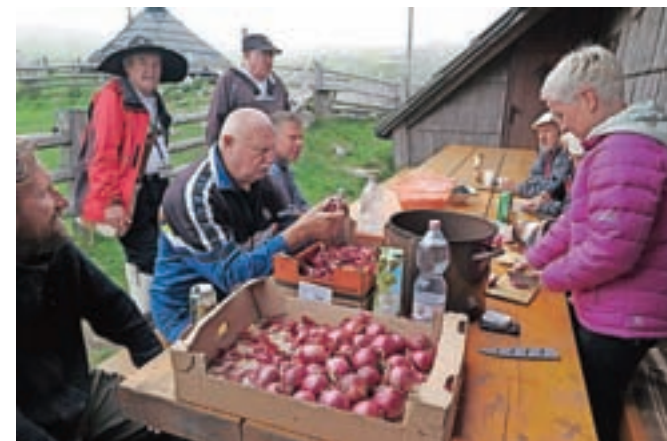
Bajtarji so že v petek popoldne olupili in narezali dvajset kilogramov čebule...