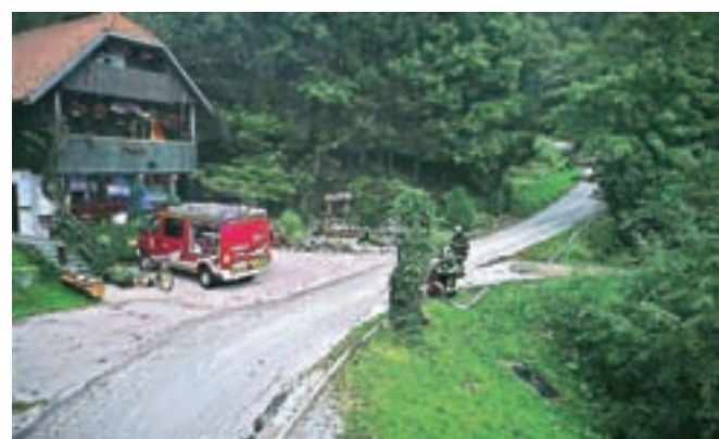
Na vaji smo uspešno pogasili požar skladovnice lesa in bližnjega gozda na Ravnah.

Šmarski gasilci se zahvaljujemo vsem sodelujočim gasilkam in gasilcem in krajanom Raven. Posebna zahvala gre tudi Slemenškovi in Grošetovim, ki so nam omogočili izvedbo vaje.