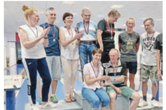
Člani in članice Kegljaške sekcije Društva upokojencev Kamnik

Takoj za moško ekipo so nastopile še ženske, ki zadnja leta nimajo resne konkurence na Gorenjskem. Tudi tokrat je bilo kaj hitro jasno, da bodo prepričljivo ugnale vso konkurenco. To se je uresničilo in tudi ženska ekipa je postala prvak Gorenjske za