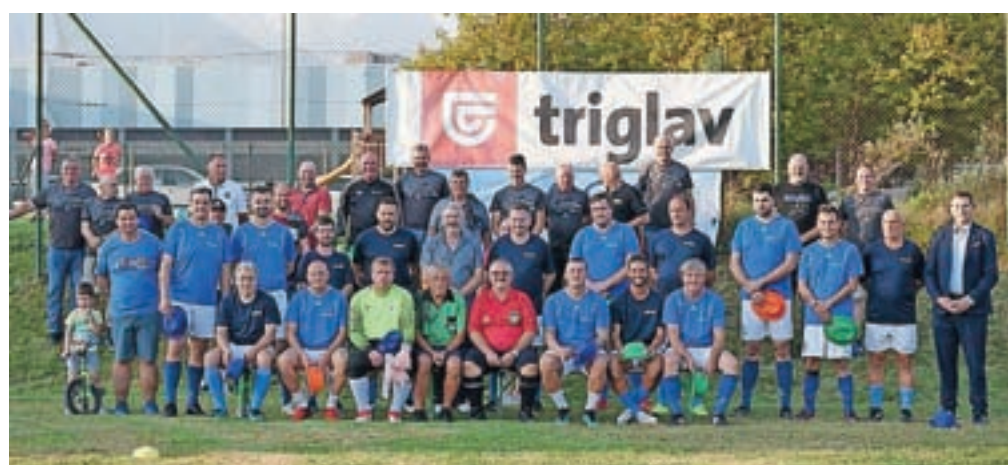
Udeleženci letošnjega srečanja