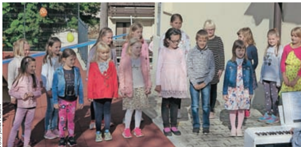
Hvaležni za novo igrišče so se učenci potrudili s prisrčnim kulturnim programom.