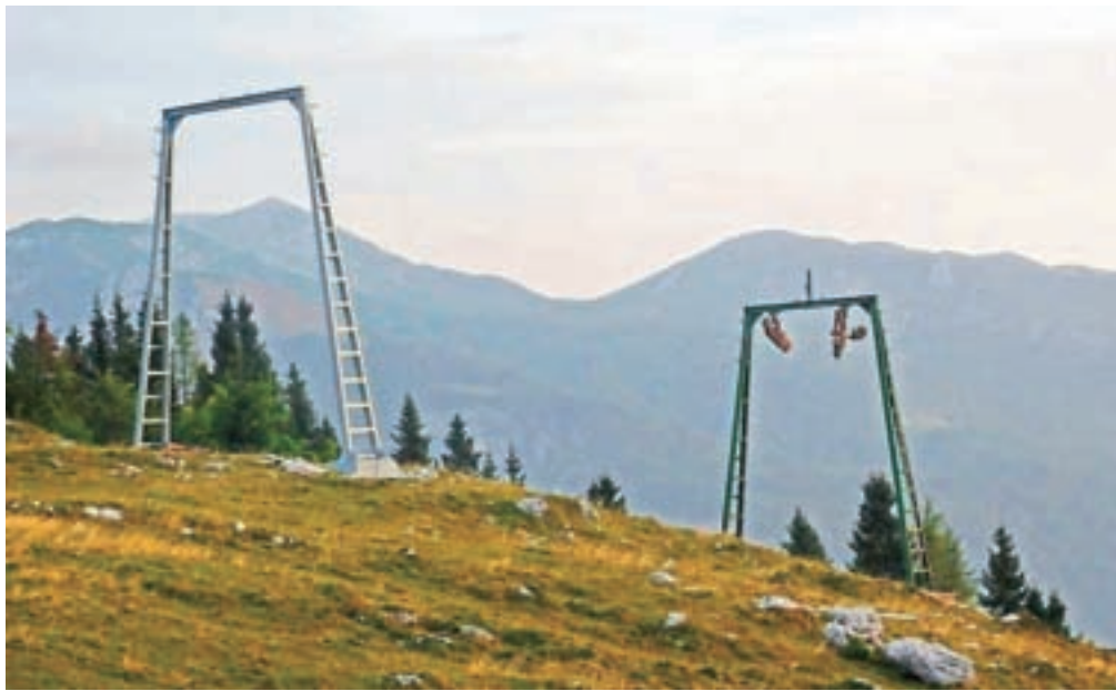
Prenovljeni steber opuščene vlečnice Tiha 1

»Zelo smo bili veseli, da je bila naša predstavljena ideja všečna komisiji na Turističnem startup vikendu in tudi direktorju družbe Velika planina in naš projekt je zdaj že v zaključni fazi implementacije. Po pregledu terena smo se odločili, da postavimo štiri gugalnice – tri bodo namenjene odraslim (14+), ena pa otrokom (3–14 let). Pri izbiri lokacij smo upoštevali več parametrov – ohranjenost stebrov, možnost razmeroma enostavnega dostopa (tako za obiskovalce kot za vzdrževalce) ter seveda lep razgled. S temi parametri smo izbrali štiri lokacije – dve v bližini