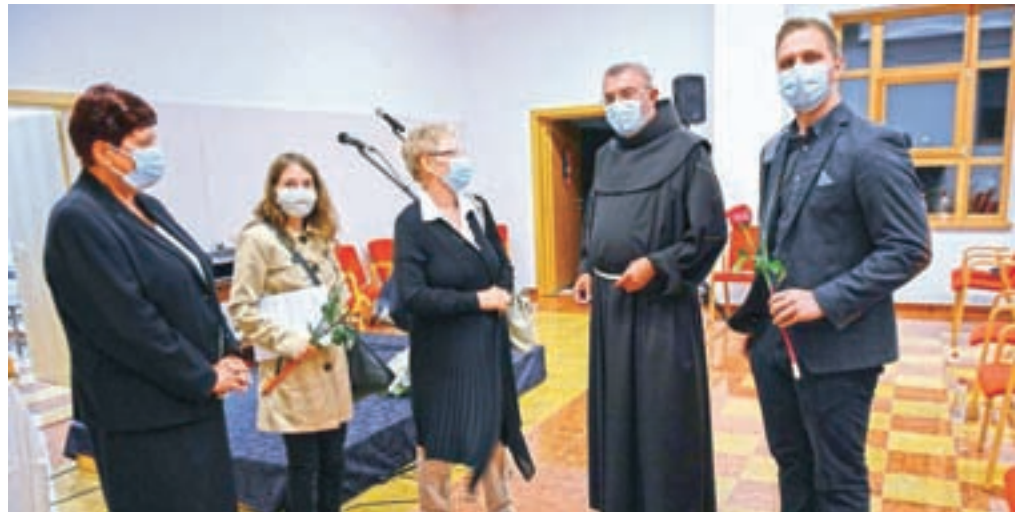
V prijetnem pomenku po prireditvi