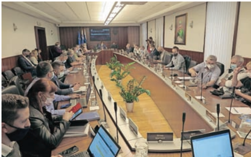
Občinski svetniki na septembrski seji