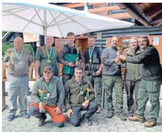
Dobitniki medalj in pokalov

Zgornje Palovče – Skupno je nastopilo devetindvajset članov in devet veteranov iz lovskih družin, ki imajo lovišča v občini Kamnik. Vsak tekmovalac se je lahko prijavil dvakrat, vendar je za ekipo uvrstitev štelo prvo streljanje. Strelci so se pomerili v disciplini na glinaste golobe v lovskem stavu in na tarčo srnjaka z malokalibrsko puško ob uporabi optike in sede z naslonom ob količek. Idealni vremenski pogoji in vzorna organizacija z upoštevanjem vseh varnostnih ukrepov so omogočili odlične rezultate, kar se je na koncu pokazalo pri seštevanju zadetkov oziroma točkovanju. Ekipo prvo mesto so zasedli strelci LD Kamnik, ki so v postavi Primož Osolnik,