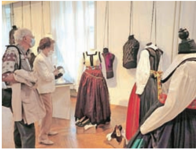
Utrinek z razstave V pisanem gvantu – stara oblačila Gorenjcev in njihove nove podobe