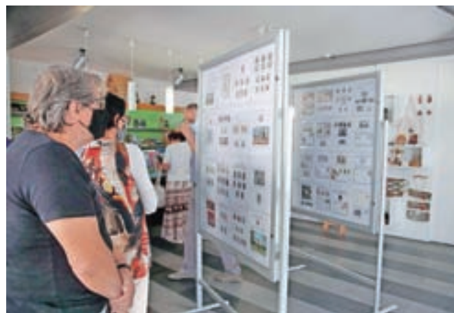
Kamniški filatelisti so razstavili znamke s podobami oblačilne dediščine z območja nekdanje Jugoslavije.