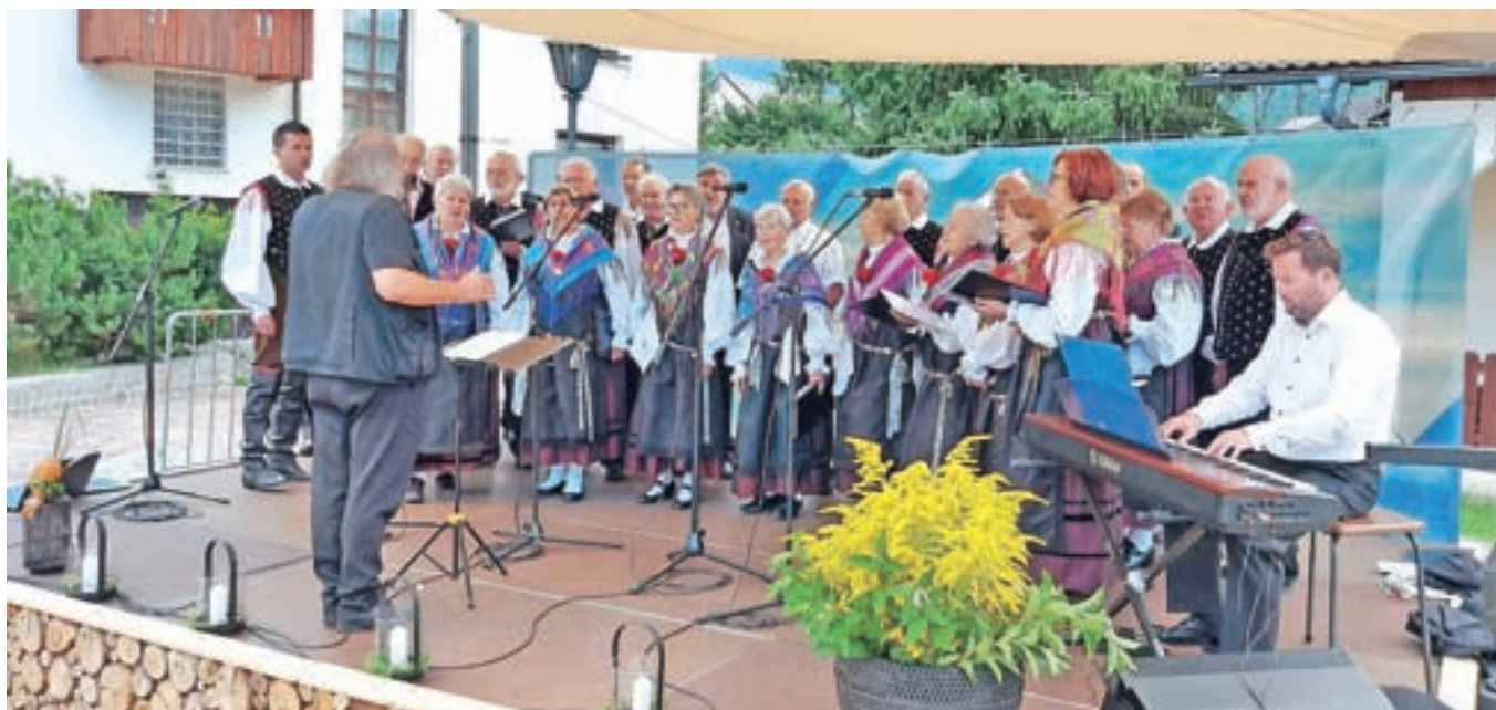
Liraši skupaj s kranjskogorskimi pevci na letošnjih Škerlovih dnevih