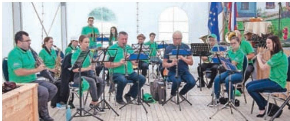
V programu je sodelovala tudi Godba Tuhinjske doline.

»Danes so nam na voljo različni pripomočki in lahko zelenjavo, ki je ne uporabimo takoj, predelamo in shranimo. Obiskovalci so se seznanili, kako lahko iz sadja ali zelenjave iztisnemo domače sokove, pripravimo različne namaze, pa tudi o tem, kako nam lahko zdravilne rastline olajšajo marsikatero zdravstveno težavo. V današnjem času je priljubljena tudi naravna kozmetika, zato so se lahko poučili o pripravi krem, mazil ali