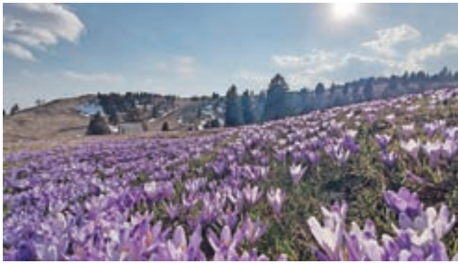
Film bo v svet poslal tudi cvetoča polja žafranov na Veliki planini.

Priprave so bile zelo temeljite, a živali so pogosto pokazale, da niso igralci, zato so scenarij nenehno spreminjali in se prilagajali razmeram. Poznavanje ži-