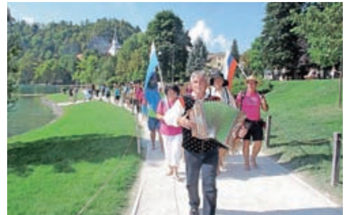
Bosonogi na poti okoli Blejskega jezera