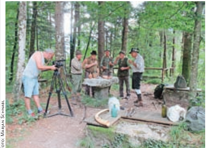
Snemanje pri Firštovi mizi v Kamniški Bistrici