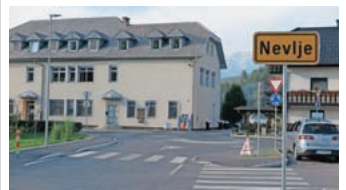
K umirjanju prometa v kraju najbolj pripomore novo krožišče.