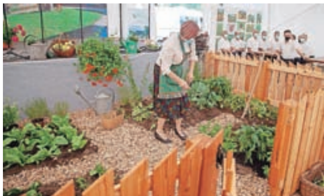
Kako je bil vrt videti nekoč, so ponazorili kar na prireditvenem prostoru.

V prireditvenem prostoru ob Termah Snovik so nazorno pokazali, kako je bil vrt videti nekoč in kaj so v njem sadili. Obiskovalci so se seznanili z različnimi izdelki, ki jih lahko z nekaj znanja pripravimo sami, organizatorji pa so pripravili tudi nabor tradicionalnih jedi.