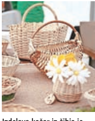
Izdelava košar iz šibja je dandanes precej redka ročna spretnost.