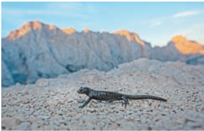
Planinski močerad

vali je bilo ključno – prav vsaka ima namreč svoj karakter –, še bolj pa potrpežljivost in tudi sreča. Za nekajminutnimi posnetki se namreč skrivajo dnevi ali celo tedni snemanj v mrazu ali temi, v popolni tišini, tako da so se ustvarjalci kar najbolj zliili z naravo. Vse so posneli v letu in pol, še pol leta pa je bilo potrebne za montažo. Ekipa ustvarjalcev je štela le pet-