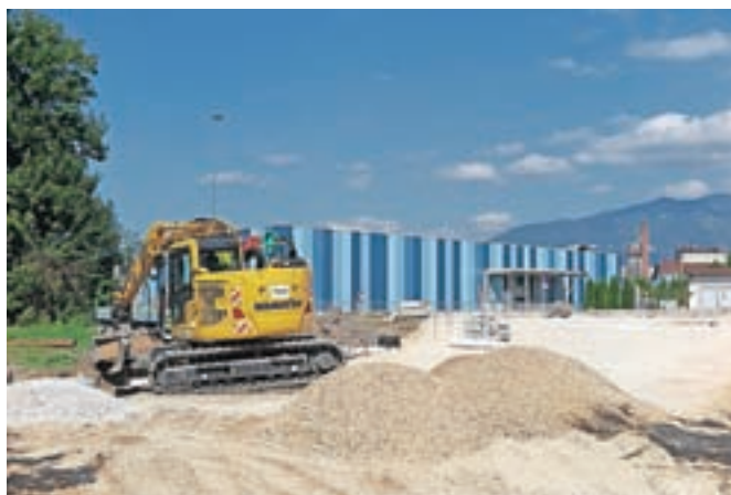
Gradnja novega priključka z Radomeljske ceste na obvoznico

»Oba projekta, reševanje poplavne varnosti in nadaljevanje rekreacijske poti do meje z občino Domžale, sta združena v skupen projekt. Za dokončno sklenitev rekreacijske povezave z občino Domžale moramo izvesti približno 800 metrov kolesarske povezave, ki se bo gradila sočasno s protipoplavnimi ukrepi,« pravi župan Matej Slapar, ki se nada, da bodo ukrepi izvedeni v prihodnje pol leta. Pogodba z državo za sofinanciranje je že podpisana.