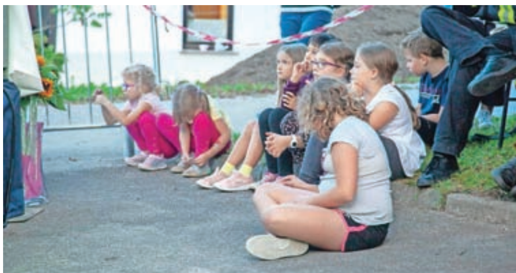
Tudi najmlajši so prisluhnili zgodbam.