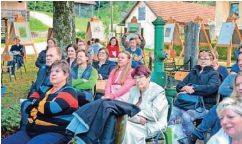
Odlične zgodbe so znova pritegnile obiskovalce v parku Pod lipami.

V sklopu festivala je že konec avgusta na vrtu Frančiškanskega samostana v Kamniku potekal večer z naslovom Zgodbe od Kamnika do