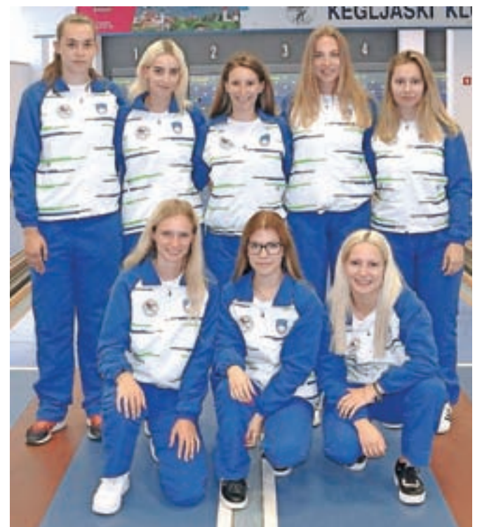
V reprezentanci U23 so bile tudi tri članice KK Calcit Kamnik.