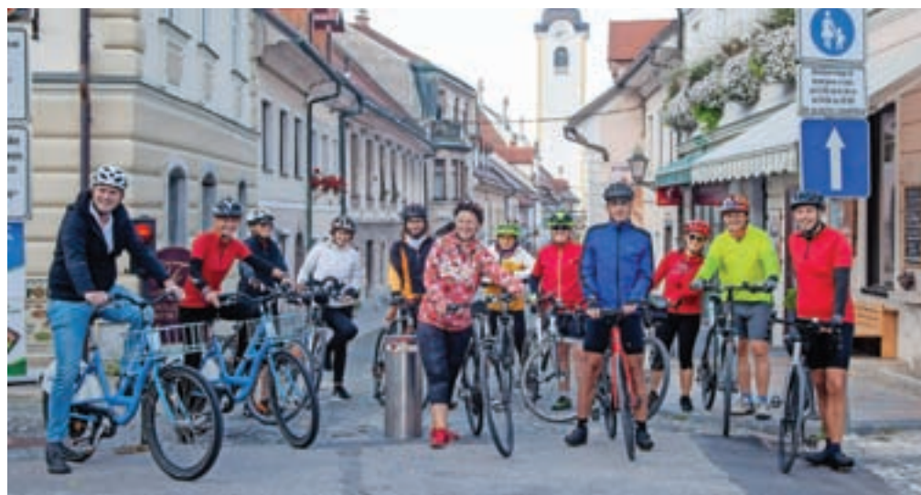
Kolesarje je pot v soboto zjutraj iz kamniškega mestnega jedra popeljala do slovenske obale.