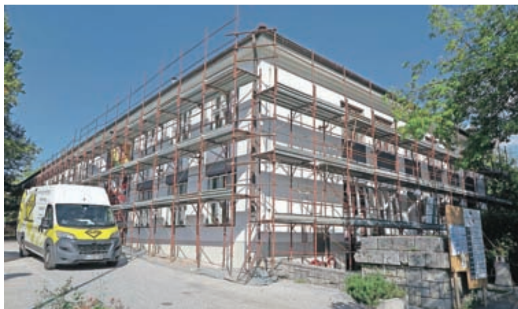
Konec avgusta se je začela energetska sanacija Doma kulture Kamnik.

»Poleg finančnih sredstev, ki jih je in jih še bo v naslednjih letih v obnovo in vzdrževanje krajevnih domov vložila občina, je izredno pomemben tudi vložek krajanek in krajanov, tako njihovo prostovoljno delo pri sanaciji kot pri razvoju kulturnega življenja in drugih vsebin, ki bogatijo življenje v domovih in s tem v krajevnih skupnostih. S svojim delom tako tudi krajanke in krajanji skrbite, da se infrastruktura ohranja in da kultura živi,« pravi župan Matej Slapar, ki pa nam je predstavil še eno veliko investicijo na področju kulturne infrastrukture, pravzaprav dve, ki se letos izvajata v Domu kulture Kamnik. Konec avgusta se je začela energetska prenova objekta Doma kulture Ka-