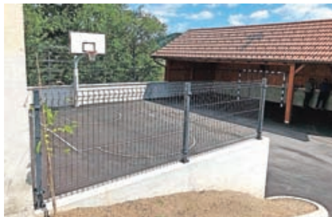
Večnamenska ploščad pri podružnični šoli na Vranji Peči

V kratkem se bo začela tudi gradnja športnega igrišča na Gozdu. Razpis za izvajalca je zaključen, dela bo izvajalo podjetje KPL, gradnja pa bo predvidoma zaključena v dveh mesecih. »Ta projekt je sofinanciran s strani ministrstva za izobraževanje, znanost in šport, namenjen pa bo krajanom za rekreacijo in gasilcem za vadbo, po potrebi pa ga bomo lahko spremenili tudi v parkirišče,« nam je še povedal župan in poudaril, da bodo urejanje igrišč po krajih nadaljevali tudi v prihodnje. Eno od pobud so nedavno tako podali krajanji Brezij nad Kamnikom.