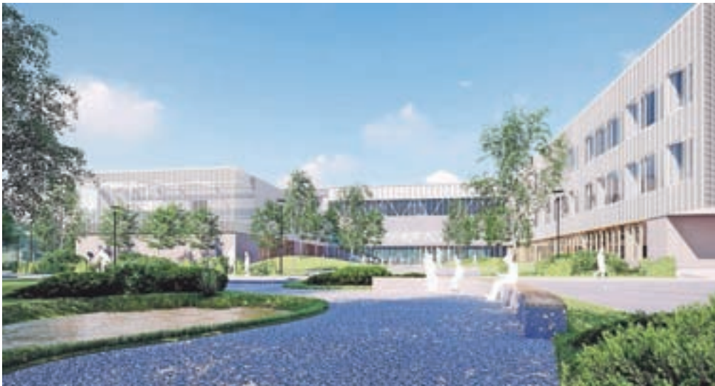
Nova šolska stavba bo sodoben objekt, na katerega bodo Kamničani lahko ponosni še vrsto let.

znova zataknilo. »Kjer se v zvezi s to šolo lahko stvari zapletejo, se očitno tudi zapletejo. Gradbena dela bi lahko že začeli, če bi bil izbran tudi nadzor del – občina je namreč objavila tudi ta razpis, na katerega so prispeli štiri ponudbe. Prva dva ponudnika nista izpolnjevala pogojev, tretji ponudnik na dotični dan ni imel plačanih davkov, zato smo izbrali četrtega ponudnika, a se je tretji na našo odločitev pritožil, tako da o pritožbi zdaj odloča Državna revizijska komisija, ki ima za to časa trideset dni. Prepričani smo, da smo se odločili prav, in želim si, da bo postopek kmalu zaključen in bomo gradnjo vendarle lahko začeli,« nam je še povedal župan. Zaključen pa je že razpis za supervadzor, pogodba je bila podpisana minuli teden. Pogodbeni rok za dokončanje del je osemnajst mesecev, nova šola pa naj bi učence sprejela v šolskem letu 2023/24. Po tem bodo v drugi fazi projekta staro šolsko stavbo porušili in uredili vse zunanje in športne površine (druga faza bo stala že 3,5 milijona evrov) in se topopoma lotili še preostalih faz projekta. Zgraditi bo namreč treba tudi novo športno dvorano, ki je hkrati tudi telovadnica šole, in ostale površine, ki bodo hkrati predstavljale javni prostor za vse Kamničane. Začetek gradnje bodo obeležili s slavnostno položitvijo temeljne kamna.