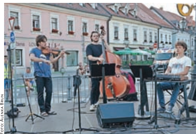
Oder Pr' Goslač se je v času festivala dobro obnesel.