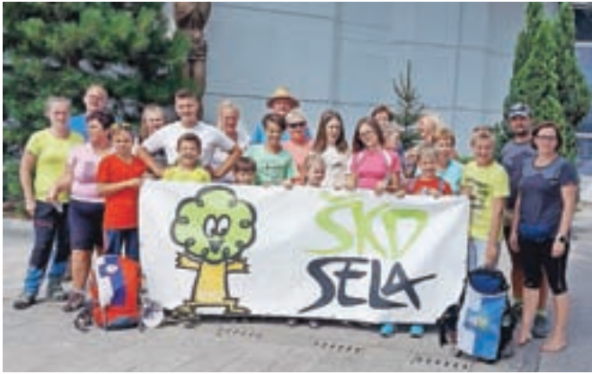
Tokratna družina je štela okoli dvajset pohodnikov.