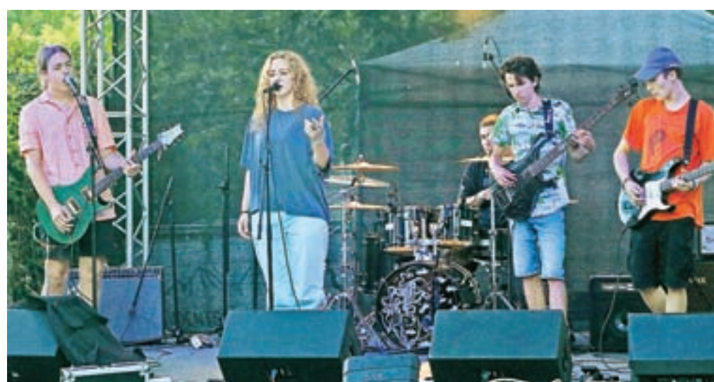
Večini izbranih iz kompilacije Probahodnik smo lahko prisluhnili v živo. Before Time so bili tokrat na odru Barutane tisti, za katere je publika že slišala. Na fotografiji so na popoldanski generalki.