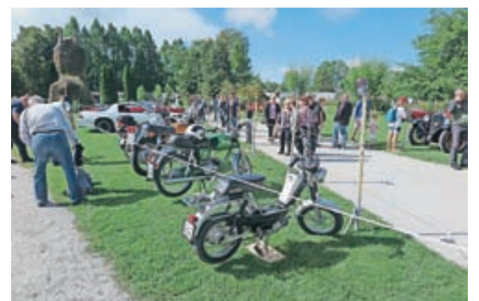
... pa tudi motorjev različnih letnikov.