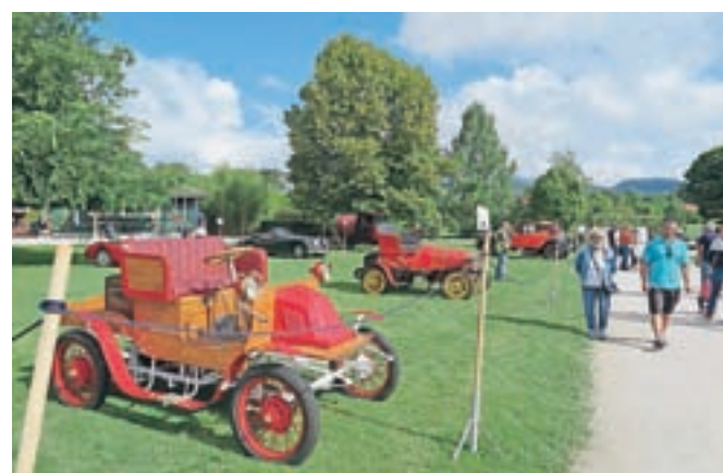
Na ogled je bilo okoli šestdeset starodobnih avtomobilov ...

Slavnostni del dogodka se je zaključil s podelitvijo priznanj članom, podpornikom in sponzorjem, obiskovalci pa so starodobnike lahko občudovali še vse do poznega popoldneva.