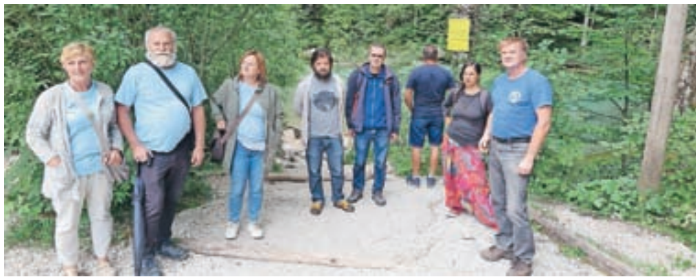
Predstavniki Civilne iniciative za Kamniško Bistrico in Jamarskega kluba Kamnik ob izviru Kamniške Bistrice, kamor so pred dnevi namestili rumeno opozorilno tablo

niško-Savinjskih Alpah. Voda priteka na površje v več izviri in je zajezena v majhno, izvirno jezerce. Gre za zelo občutljiv habitat, v katerem živijo tipične izvirske rastlinske in živalske vrste, ki jih drugje ne najdemo. Izvir Kamniške Bistrice posredno napaja zajetje Iverje, ki z vodo oskrbuje več kot 20 tisoč Kamničanov. Kopanje v izviru moč-