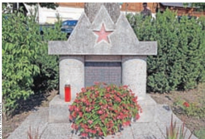
V čast padlim talcem v Smledniku pri golfskem igrišču stoji spomenik, kjer so navedena imena pobitih fantov.