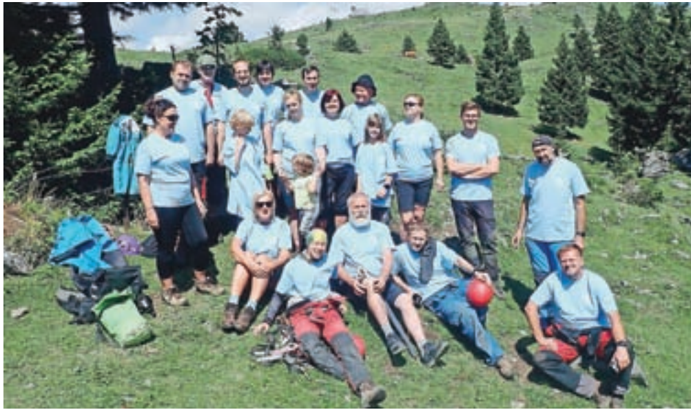
Del udeležencev Jamarskega tabora na Veliki planini

»Iz Kofc smo odstranili še ostanek smeti in odpadkov, ki nam jih ni uspelo iznesti v lanskem letu. Tako je jama Kofce popolnoma očiščena in povrnjena v prvotno stanje in ne ogroža več podzemeljske vode. Iz Male Kofce smo najprej odstranili nametane odpadke v obliki plastike, steklenic in odsluženih loncev, potem pa smo se lotili kosti goved, ovc in prašičev, ki se v jami pojav-