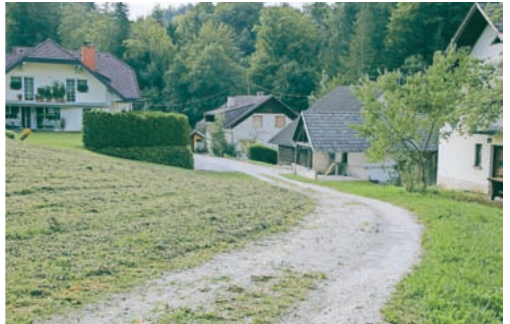
Asfaltirali bodo tudi lokalno cesto v Tunjiški Mlaki.

V okviru sanacije bodo asfaltirali tri kilometre makadamskih cest in poti v več krajevnih skupnostih. V Krajevni skupnosti Šmarca bodo uredili del Primoževe ulice, kjer bodo na novo asfaltirali 114 metrov javne poti in na novo uredili vodovodno infrastrukturo. V Krajevni skupnosti Tunjice bodo asfaltirali del lokalne ceste Tunjiška Mlaka–Zadnji Vrh v dolžini 240 metrov, poleg tega bodo na novo asfaltirali kategorizirani del lokalne ceste Tunjiška Mlaka–Vinski Vrh v dolžini 135 metrov, na območju Tunjiške Mlake 5e, 5g, 6a in 6b pa asfaltirali cesto v dolžini 135 metrov. V