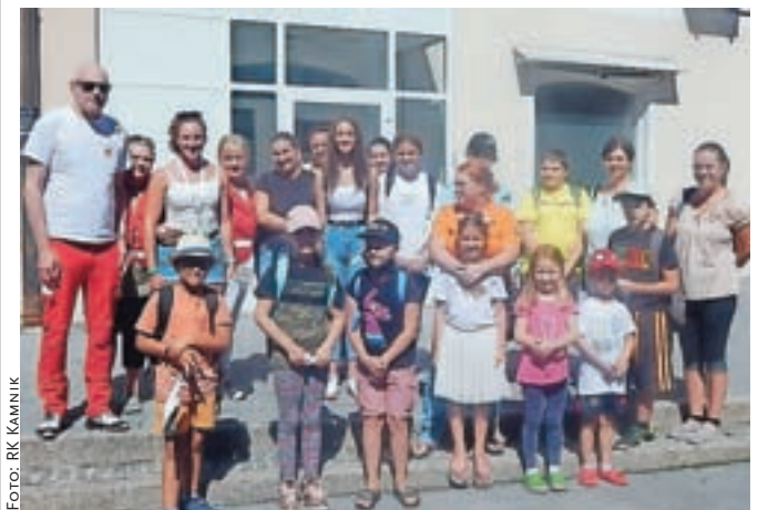
Otroci prve skupine pred odhodom na Debeli rtič