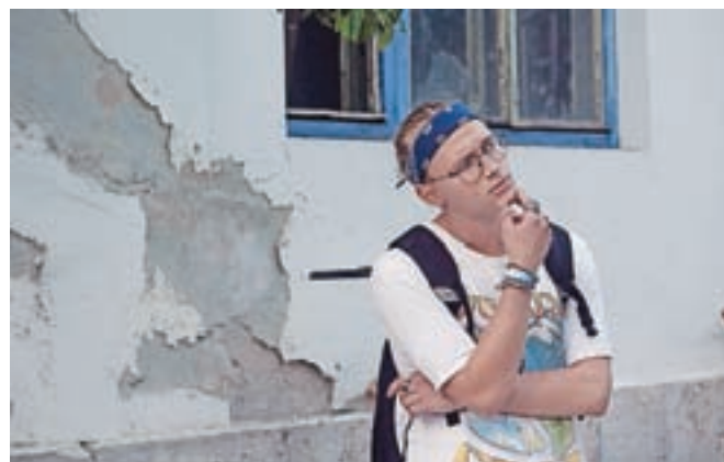
Stin Brinovec je raperske stihe začel pisati v sedmem ali osmem razredu. Velik poudarek daje rimam, pravi 19-letnik iz Šmarce, ki rapa v njemu najlepšem jeziku – v slovenščini.

Na natečaj za glasbeno kompilacijo, ki so jo poimenovali