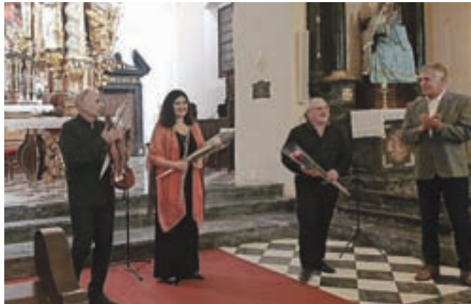
Nastopajoči na koncertu v mekinjski cerkvi

(J. Alain in J. S. Bach). Prav v slednjih je organist razpel vse svoje registre, saj se je moral pri decidnih spremljavah držati bolj zadaj in je v tem primeru dovolj enakovredno briljiral s pianu. Tukaj, v Alainovih molitvenih Litaniyah in sloviti ali kar