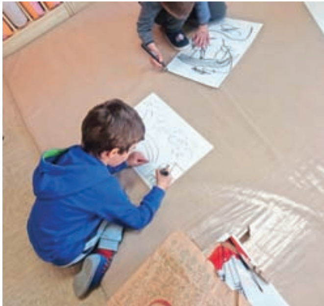
Najmlajši so sodelovali tudi pri izdelavi stripa Dan v življenju krave Berte.

Zavedamo se namreč, da je mleko pomemben del naše