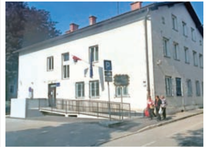
Vstop v Policijsko postajo Kamnik je zdaj mogoč le s parkirišča.

Predvidoma sredi junija se bo začela energetska sanacija, saj je bila Občina Kamnik uspešna na razpisu ministrstva za infrastrukturo. Sanacija je bila že nujno potrebna, saj je objekt v precej slabem stanju. Kljub gradbišču bo delovanje in dostop do storitev Policijske postaje Kamnik potekalo nemoteno.