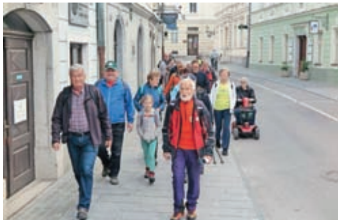
Udeleženci letošnjega Maistrovega pohoda

Člani Društva general Maister Kamnik so konec maja, nekoliko kasneje kot po navadi, organizirali že šestnajsti Maistrov pohod.