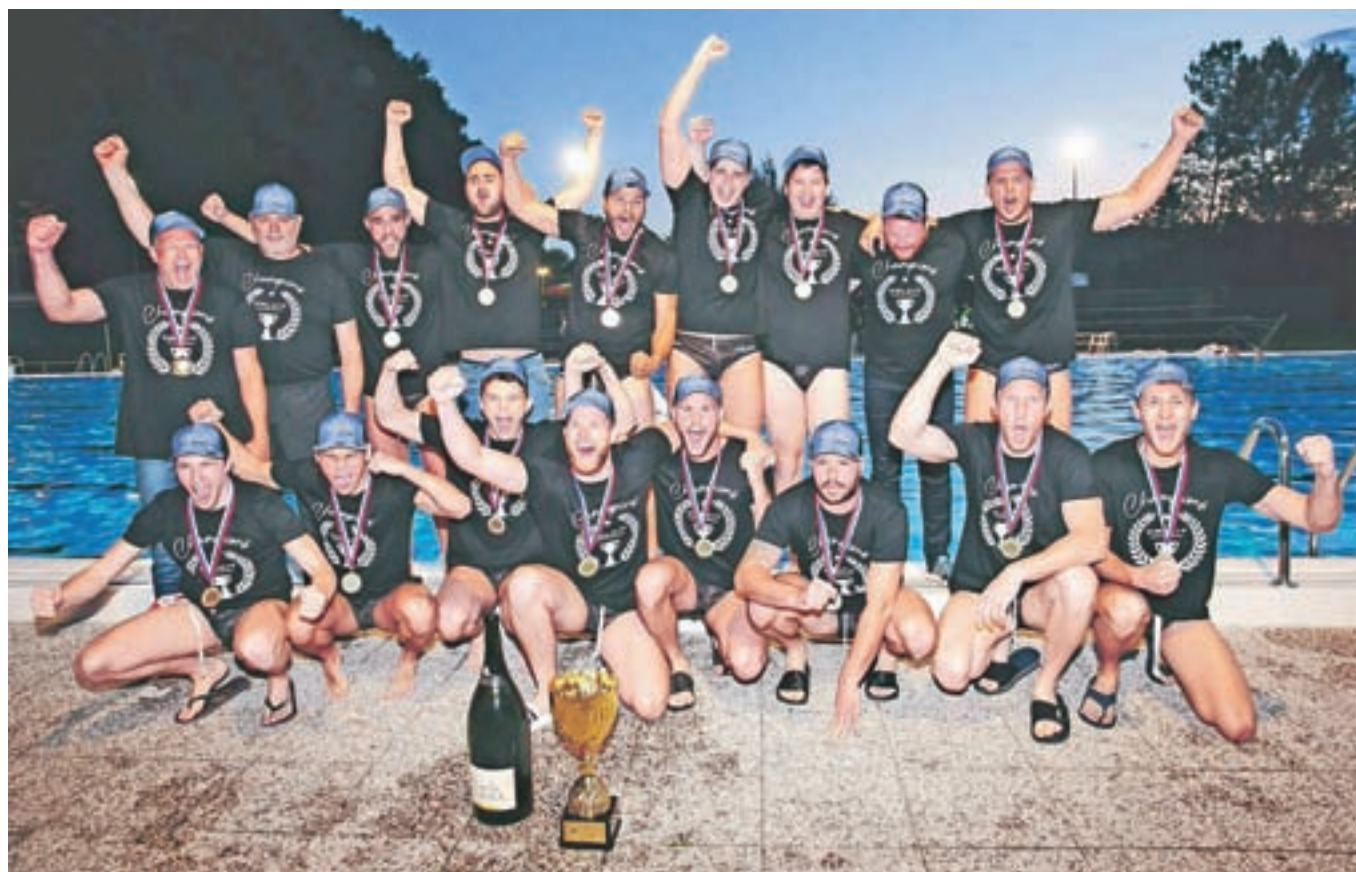
Kamniški vaterpolisti so pokalnemu dodali še naslov državnih prvakov

Vaterpolisti ekipe Calcit Waterpolo so naslovu pokalnih prvič dodali še naslov državnih prvakov. Do zgodovinskega uspeha so prišli, čeprav nimajo pokritega bazena.