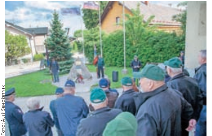
Slovesnost ob spominskem znamenju v Komendi