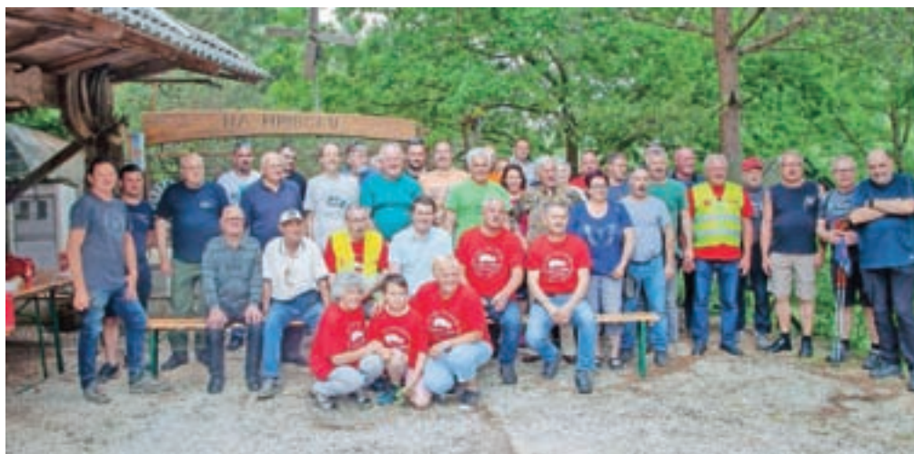
Udeleženci jubilejnega, desetega srečanja Na hribčku

za organizacijo dogodka, ki vsako leto popestri dogajanje v tuhinjskih vaseh, ter izrazil upanje, da bo podobna srečanja organiziral tudi v prihodnje, srečanja pa sta se udeležila tudi minister za obrambo Matej Tonin in evropska poslanka Ljudmila Novak.