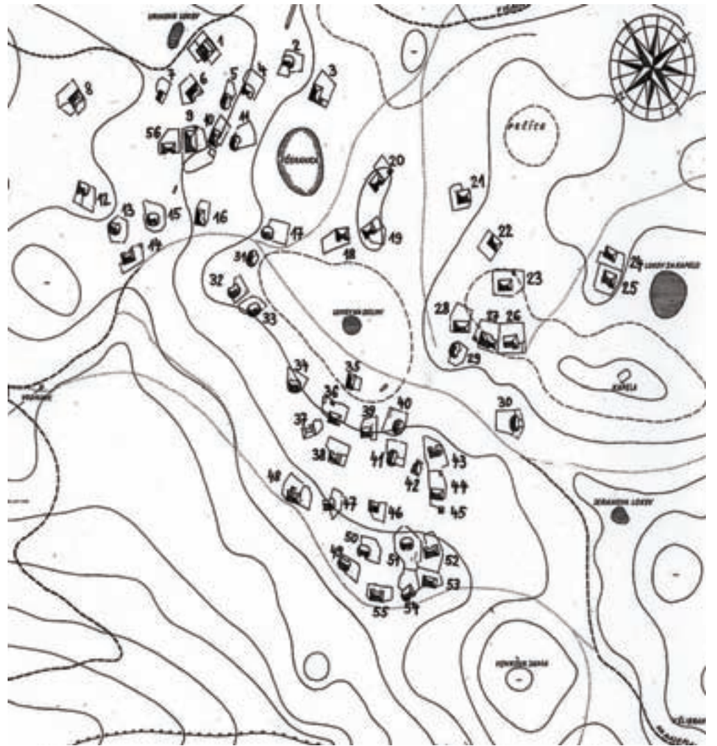
Zemljevid Velike planine z vrisanimi in oštevilčenimi pastirskimi bajtami na Velikem stanu. Popis je iz leta 1973.

Predstavljam vam hišna imena domačij, ki imajo pastirske kočice oziroma bajte na Velikem stanu na Veliki planini. Poimenovali so jih po hišnem imenu domačije, kate-re last je bila pastirska bajta. To so vse kočice, ki so stale na Velikem stanu ob popisu leta 1973. V kasnejših letih so jih nekaj še dogradili. Številka pred imenom bajte je številka kočice. Na nekaterih kočah so številke vidne še danes. Vasi, od koder izvirajo lastniki koč, ležijo ob vznožju kamniških planin.