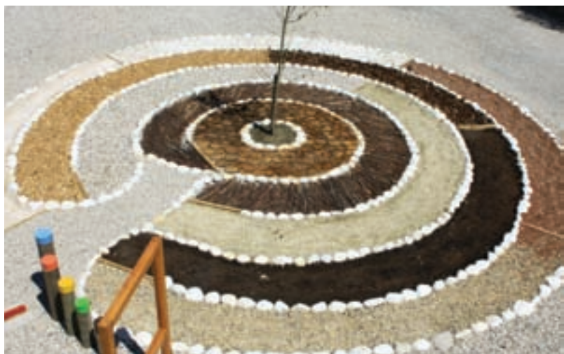
Kneippovo bosonogo doživetje

V Termah Snovik je VSAK DAN Kneipp dan. Vsa Kneippova načela so preko petih stebrov vpleti v celovito ponudbo, ki je že od samega začetka prijazna ljudem in okolju.