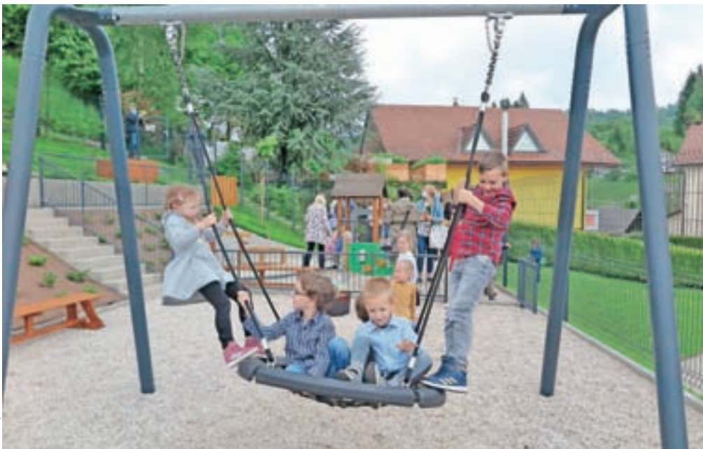
Posodobljeno igrišče naj bi še posebno dobro vplivalo na razvoj otrokovih možganov.

Igrišče bo žal namenjeno le vrtčevskim otrokom in ne tudi vsem ostalim iz kraja, saj bodo vrata igrišča zaradi morebitnega vandalizma po zaprtju vrtca vsak dan zaklepali.