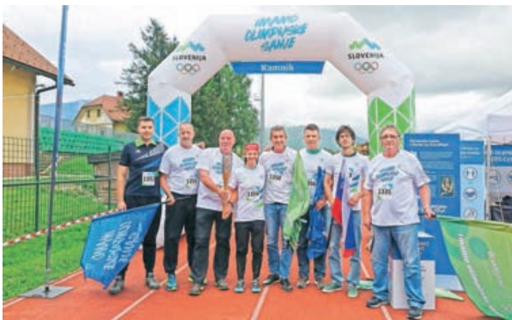
Takole so z baklo pozirali nekdanji kamniški olimpijci.

Širjenju pozitivnih vrednot so se pridružili tudi v Kamniku, kjer sta Športna zveza Kamnik in Zavod za turizem, šport in kulturo Kamnik na Stadionu prijateljstva v Mekinjah pripravila prijeten dogodek, na katerem je z baklo po stadionskem krogu teklo približno 150 zbranih. Ti so bili seveda varni v svojih mehurčkih ali pa na dovoljšnji razdalji, baklo pa so ob vsaki predaji tudi razkužili. S slaba dva kilograma težko baklo, narejeno iz recikliranega jekla in bukovega lesa, ki jo je oblikoval Vasja Ambrožič, so tekli najmlajši iz vrtcev Antona Medveda Kamnik, Peter Pan, Sonček in Zarja, varovanci zavoda Cirus, učenci OŠ 27. julij Kamnik, OŠ Frana Albrehta, OŠ