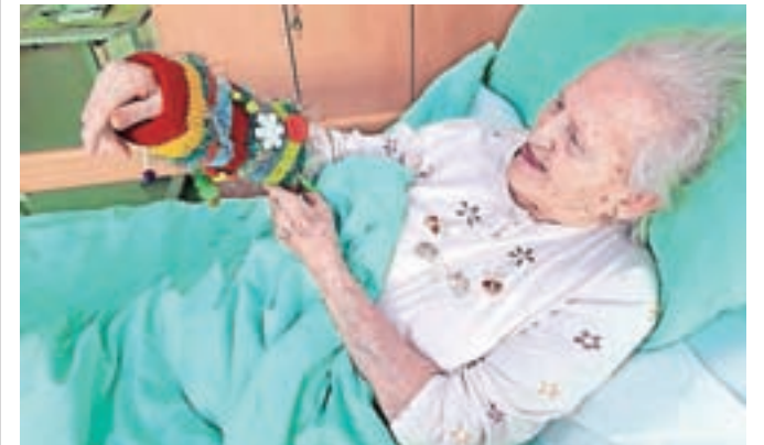
Posebni pisani rokavčki so dokazano v veliko pomoč osebam z demenco.

Kamnik – V Domu starejših občanov Kamnik so začeli izdelovati »rokavčke-pomagavčke« – posebne ročno izdelane rokavčke, ki so v veliko pomoč osebam z demenco, saj zmanjšujejo stres, stimulirajo in sproščajo. Vabijo vse, ki imajo doma kakšne zanimive predmete, da jim jih prinesejo, saj bodo s tem vsakdan olajšali marsikomu. J. P.