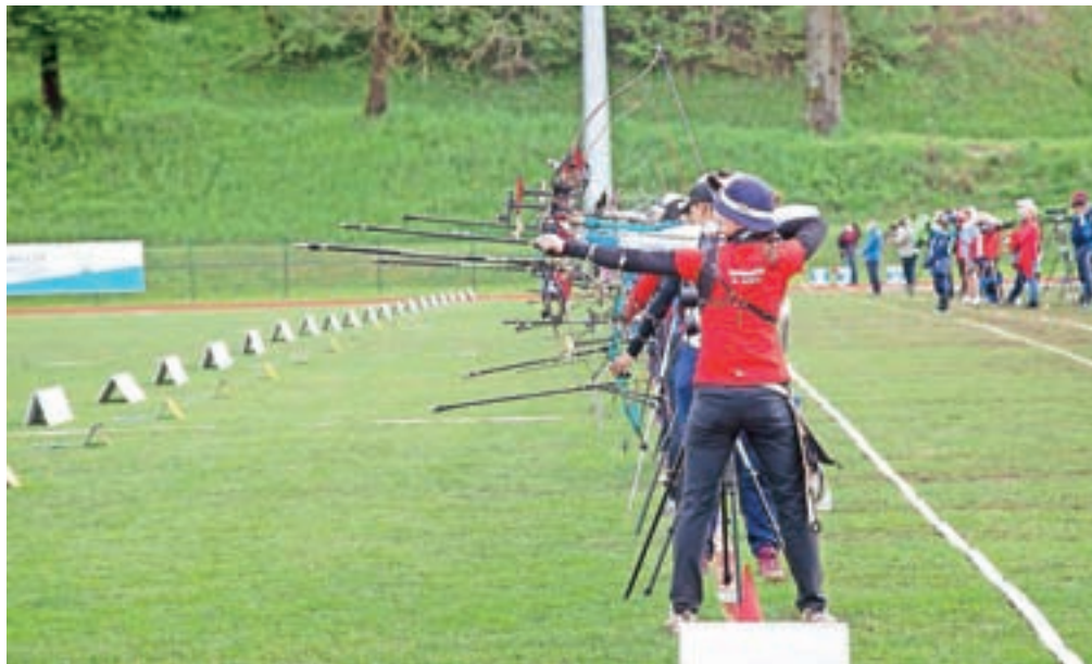
Sto petdeset lokostrelcev se je udeležilo letošnjega mednarodnega turnirja na mekinjskem stadionu.

Organizacije tekmovanja, ki za klub z 41-letno zgodovino sicer predstavlja precejšen zalogaj, so se lotili z željo, da bi predvsem mladim tekmovalcem omogočili izkušnje z velikih tekmovanj kar na domačem terenu. Veronikin pokal je od takrat precej presegel pričakovanja in Kamnik postavil na svetovni zemljevid lokostrelstva.