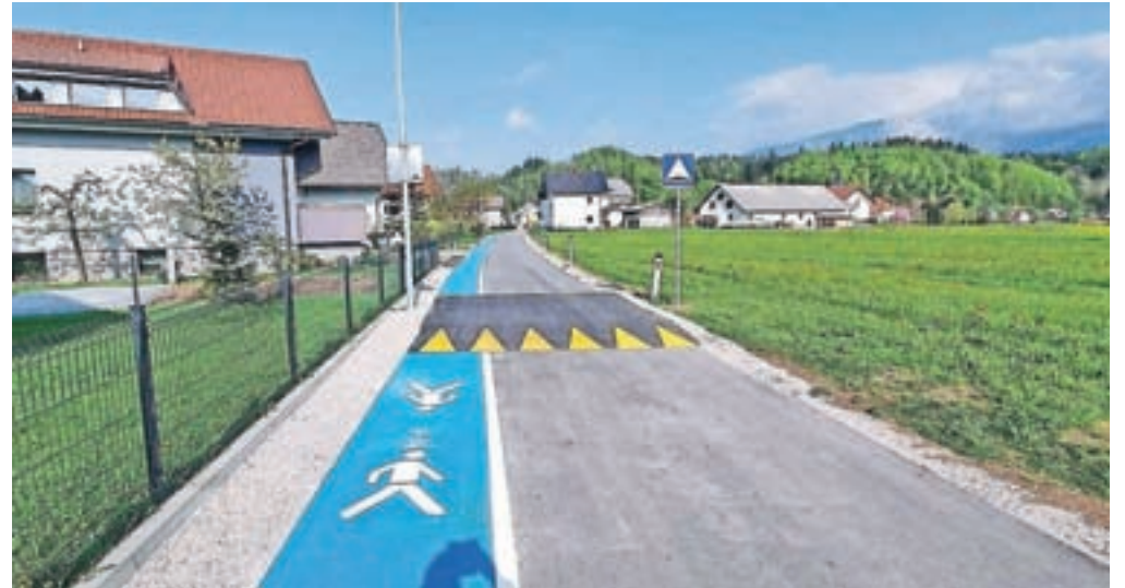
Z obnovo cestne infrastrukture je bila urejena tudi varna šolska pot.

A dela s tem še niso končana, saj se bo še v maju začela že druga faza dela. Občina je gradbeno pogodbo za približno 90 tisoč evrov podpisala s Komunalnim podjetjem Kamnik, ki je bilo s pogajanjmi kot najbolj ugodno izbrano na javnem razpisu. Projekt, ki še sledi, za-