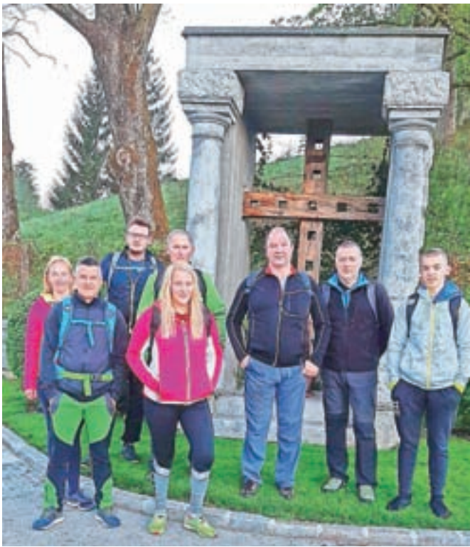
Del pohodnikov ŠKD Sela

na cilj. Zahvaljujemo se tudi vsem ostalim, ki ste se pohoda udeležili, morda prvič, in verjamem, da tudi v naslednjih odpravah. Zahvala tudi PGD Sela za opravljen prevoz. Družina pohodnikov je bila zelo pisana, od mladih do starih, od športnikov do manj aktivnih športnikov, ki