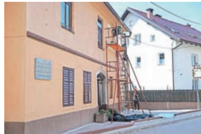
Prenova Vivodove hiše poteka v sodelovanju z restavratorji in konservatorji.