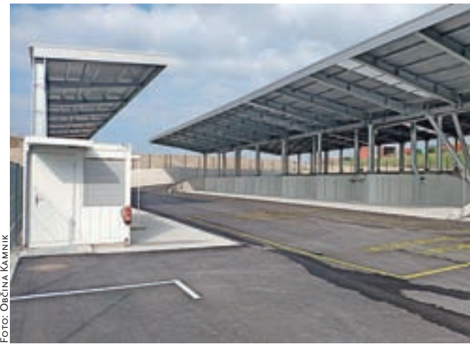
Gradnja zbirnega centra za ravnanje z odpadki je končana.

Začasna primopredaja objekta je bila že izvedena z namenom, da bo koncesionar zbirni center opremil z zabojniki za zbiranje posameznih vrst odpadkov in ostalo potrebno opremo.