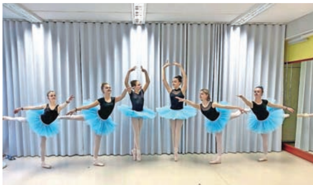
Baletke iz Baletne šole Ana

»Veliko baletk že od malega težko čaka dan, ko bodo lahko stopile na »špice«, a baletni učitelji se zavedamo, da s tem zares ne gre hiteti, saj mora za ples po konicah prstov biti sistematično usvojen določen nivo ba-