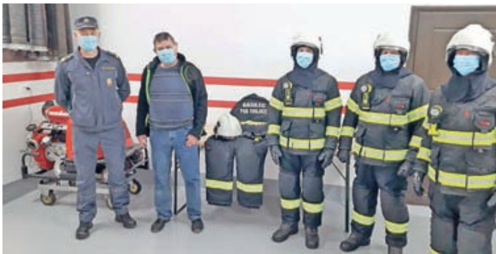
Nova zaščitna oprema za tunjiške gasilce

Tunjice – Konec marca je v prostore Prostovoljnega gasilskega društva Tunjice prispela nova osebna zaščitna oprema, kar so omogočila namenska sredstva Zavarovalnice Triglav. Društvo je namreč v sklopu letošnje preventivne akcije Za boljši jutri prejelo preventivna sredstva v višini 3.600 evrov, ki jih omenjena ustanova namenja posameznim lokalnim skupnostim. Tokrat je tunjiškimi gasilcem pomagala pri nakupu nove gasilske opreme, in sicer oblek, čevljev, čelad ter rokavic za štiri operativne gasilce. V primeru intervencije bodo ustrezno zaščiteni in varovani pred potencialnimi nevar-