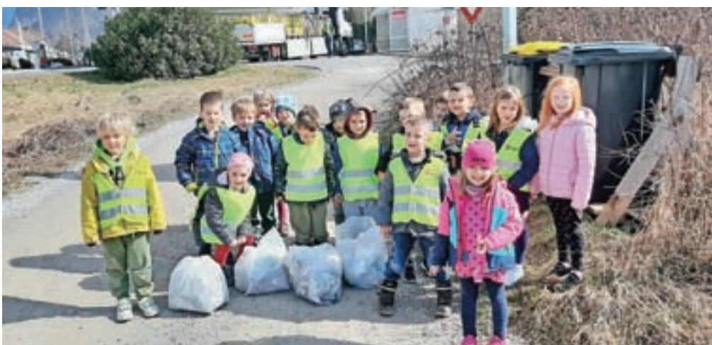
Otroci iz oddelka Žarek Vrtca Zarja so smeti pobirali tudi v okolici vrtca, kamor sicer radi zahajajo na sprehod.

Očistili smo potko in poskrbeli za lepo in čisto okolje ob poti, po kateri radi zahajamo v naravo, ki nam ponuja obilico raznolikih možnosti za sproščeno igro na svežem zraku.