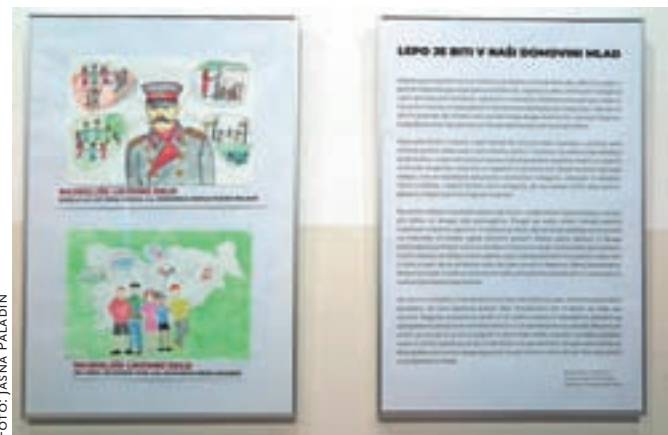
Najboljši likovni in literarno delo letošnjega natečaja

mnik in Komenda, ki ga sestavljajo Društvo general Maister Kamnik, Območno združenje veteranov vojne za Slovenijo Kamnik - Komenda, Zveza združenj borcev za vrednote NOB Kamnik, Policijsko veteransko društvo Sever Ljubljana – odbor Kamnik in Območno združenje slovenskih častnikov Kamnik - Komenda. Razstava bo na ogled do začetka junija.