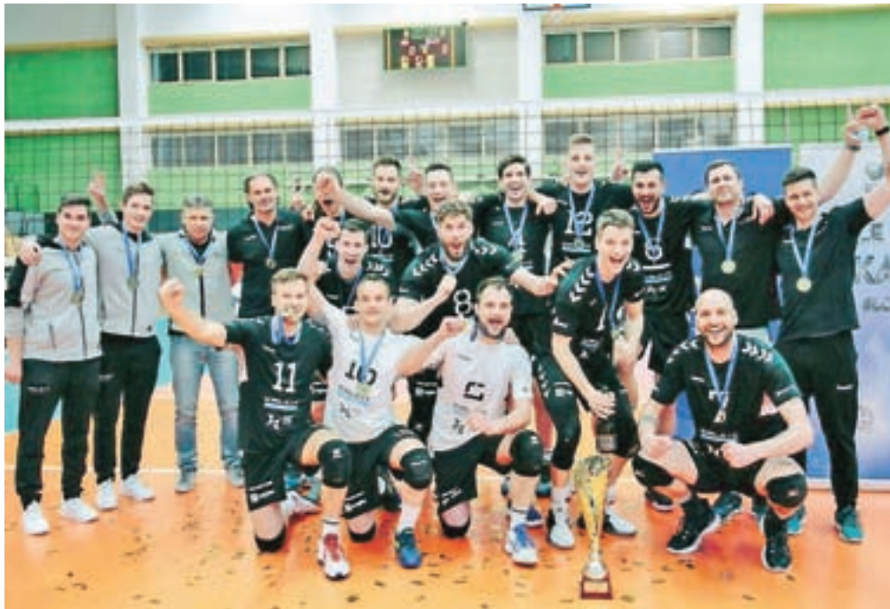
Kamniški odbojkarji s pokalom za že četrti pokalni naslov

»Že ko smo igrali v polfinalu končnice državnega prvenstva, sem bil prepričan,