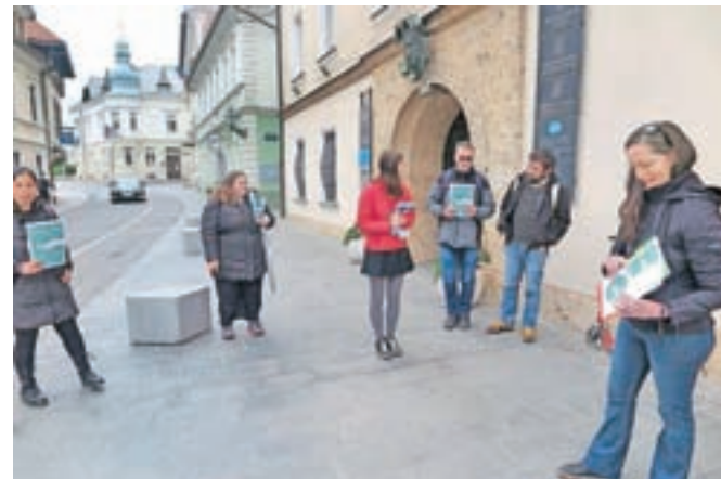
Kamniški prostovoljci pred upravno enoto / FOTO: JASNA PALADIN

»Zelo nas skrbi, kako oblast posega v naše pravice do pitne vode, mi si prizadevamo ohraniti vodo kot javno dobro. Vode so marsikje že sedaj onesnažene, z novim zakonom pa bodo zaščitene še manj, ne glede na to, da politika obljublja ustrezne varovalke,« so zaskrbljeni kamniški prostovoljci, ki jih boste pred upravno enoto lahko srečali ob ponedeljkih, sredah in petkih do 24. maja.