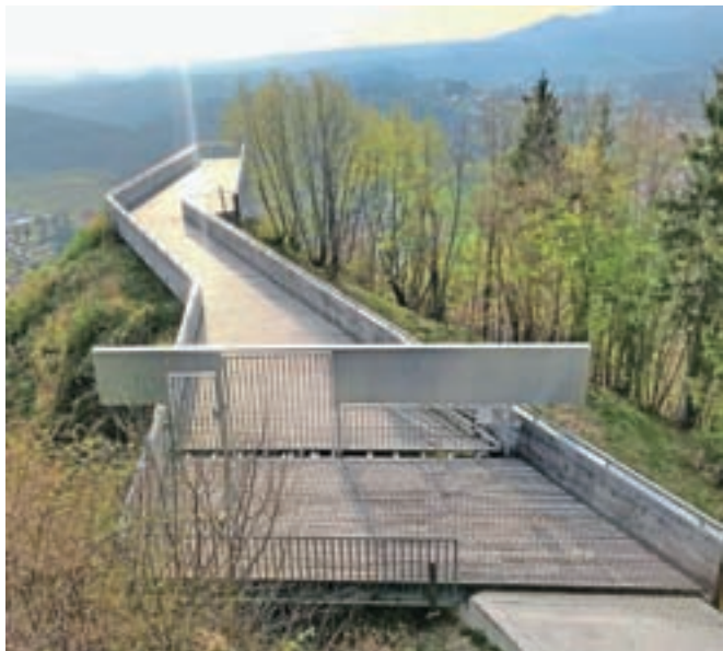
Razgledna ploščad na Starem gradu

Investitor se je med inšpekcijskim postopkom trudil dokazati, da se je gradnja ploščadi začela še pred 30. junijem 2018, ko je veljala še prejšnja gradbena zakonodaja, in ker gradbena inšpekcija zgolj na podlagi ortofoto posnetkov ni ugotovila dru-