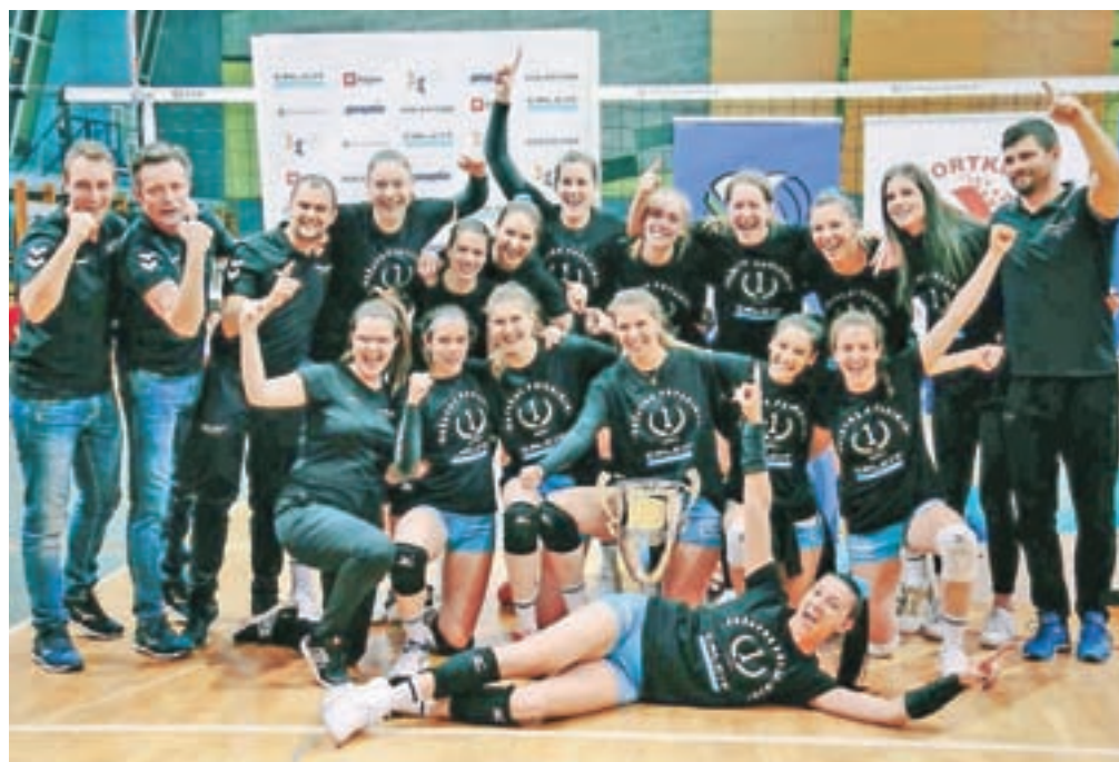
Kamniške odbojkarice so osvojile že peti naslov državnih prvakinj.

Kamnik – Odbojkarji Calcita Volleyja so minuli petek v finalu zaključnega turnirja Pokala Slovenije v Ljubljani premagali ACH Volley in se mu na najboljši možni način oddolžili za nesrečni poraz v polfinalu končnice državnega prvenstva. Zanje je bil to ob treh naslovih državnega prvaka četrti pokalni naslov. Žal pri odbojkaricah v letošnji sezoni nismo dobili pokalnih zmagovalk, zato pa so Kamničanke po treh zmagah s 3 : 2 nad Novo KBM Branikom v finalu končnice državnega prvenstva ubranile lanskoletni naslov. To je bil njihov že peti.