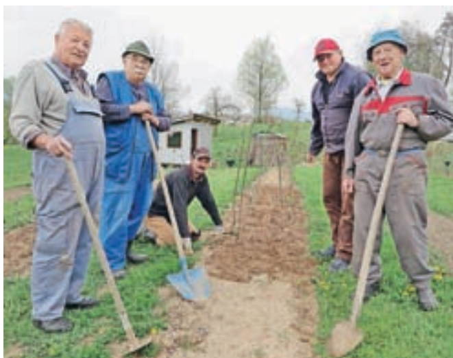
Člani Sadjarsko-vrtnarskega društva Tunjice pri pripravi sadik starih sadnih sort v svojem sadovnjaku na Prevali v Tunjicah

Razvoj travniških sadovnjakov sega v 17. stoletje, ko so kmetje predvsem manj uporabna zemljišča in bolj strme lege v bližini domačij zasadili z različnimi vrstami sadnega drevja, sadje pa potem uporabljali za samoskrbo ter za predelavo presežkov v jabolčnik, kis, žganje ali suho sadje. Tako je bilo tudi na Kamniškem. »Travniški sadovnjaki so poleti varovali domačije pred vročim soncem in pozimi pred mrzlimi vetrovi, strma zemljišča pa pred erozijo. Za širjenje tovrstnih sadovnjakov so imeli veliko zaslug kmetje, ki so