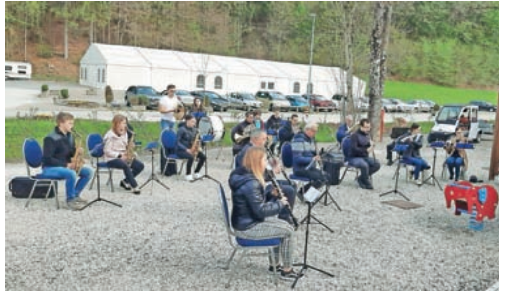
Prvomajska budnica članov Godbe Tuhinjska dolina

Za obiskovalce term je za zadaj na voljo omejeno število sob, le 30 sob oz. apartmajev. Kopanje v notranjem termalnem bazenu je za zdaj mogoče le za apart-