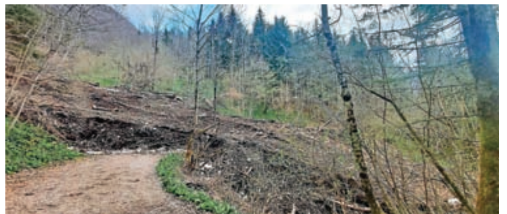
Ostanki snežnega plazov v dolini Korošice

go pri oblikah površja, pri nastanku in izoblikovanju katerih so sodelovali tudi snežni plazovi,« nam je povedal Pavšek in dodal, da so se na terenu povezali tudi z Meščansko korporacijo Kamnik, na zadnjem temenskem delu pa se jim je pridružil še revirni gozdar. Pavšek pravi, da so dnevi do konca pomladi kot nalašč za ogled ostankov snežnih plazov v omenjenih dolinah. Praviloma so ti višje zgoraj,