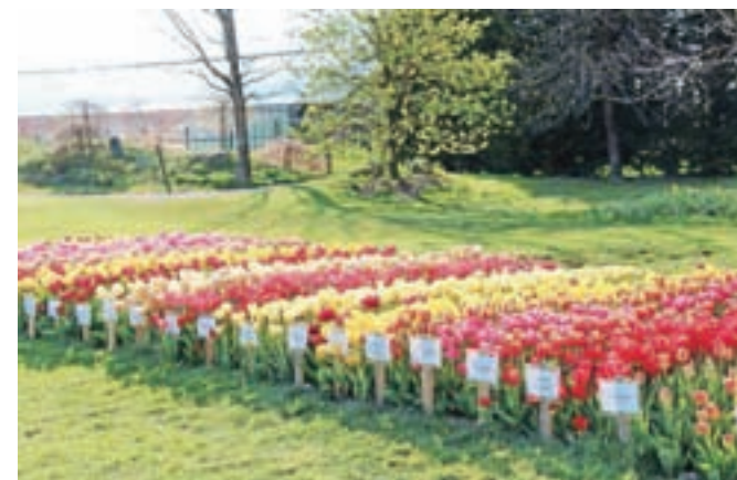
Z napismi opremljen nasad 250 različnih sort tulipanov.

V Arboretumu se zavedajo, da so tulipani prva zares barvita stvar pomladi, zato