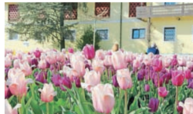
Po barvnih odtenkih so tulipani zasajeni ob pristavi.

sredine aprila do začetka maja, a letos bodo cveteli še nekoliko dlje.