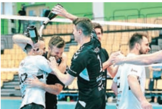
Vesolja ob uspehu ni manjkalo.

Slovenska klubska sezona na najvišji ravni se je tako končala, še vedno pa potekajo tekmovanja v drugi moški ligi, v kateri je druga kamniška ekipa še brez poraza, ter v obeh mladinskih ligah. Obe mladinski ekipi Calcita Volleyja sta se zanesljivo uvrstili na zaključni turnir osmerice.