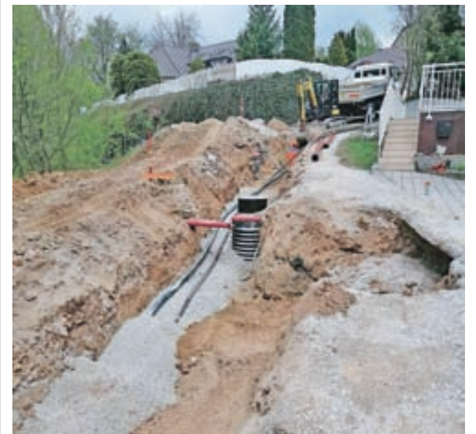
Gradnja kanalizacije na Žalah

Vrednost investicije je približno 120 tisoč evrov.